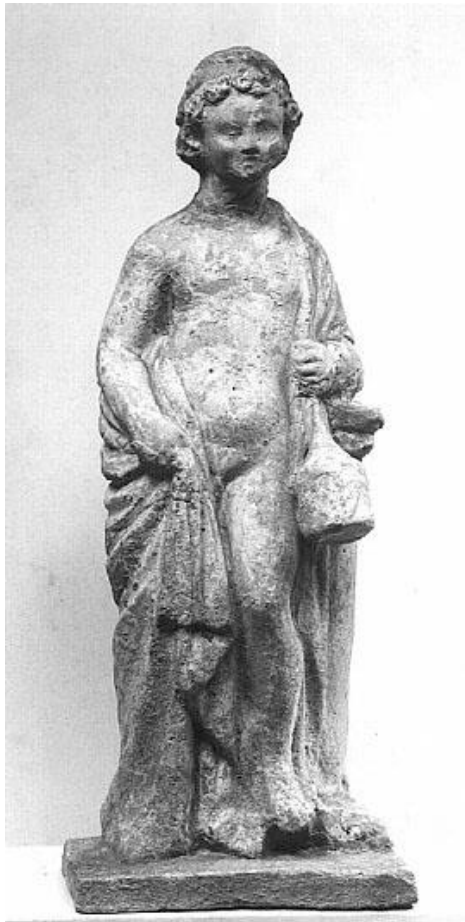
figure 5 Éphèbe tenant une cage Vers 330 - 200 av. J.-C. Provenance et fabrication : Tanagra H. : 16,50 cm. Musée du Louvre MNB 479