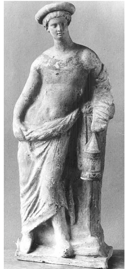
figure 6 Éphèbe tenant une cage Vers 330 - 200 av. J.-C. H. : 27,50 cm. Musée du Louvre MNB 595