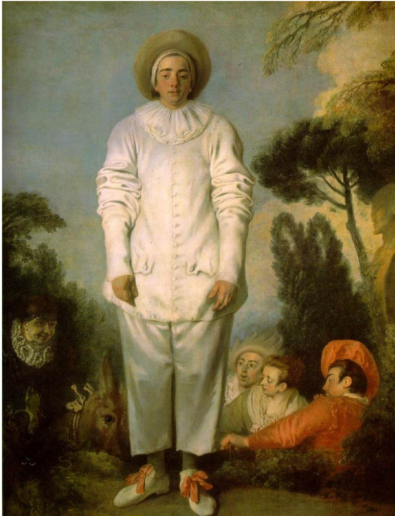
« Gilles de Watteau » (Source : Wikipédia).

Agnès Castiglione, pour sa part, a pu rapprocher le narrateur « Pierrot » du célèbre tableau de Watteau, le « Pierrot » (anciennement le « Gilles de Watteau ») 554 .