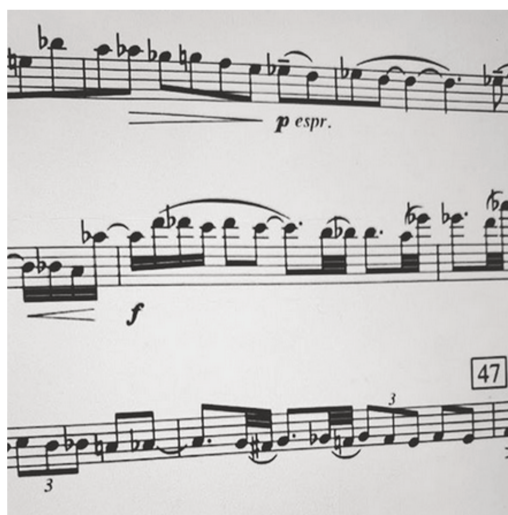
Divertimento for Flute in B Major op. 52 Ferruccio Busoni (1866 - 1924)

Bachelard a puisé ses arguments musicaux notamment dans les écrits du compositeur Maurice Emmanuel ( Histoire de la langue musicale ) et il a rencontré Debussy, pour lequel rythme n'est pas synonyme de mesure, avec des carrures régulièrement accentuées. Il se positionne d'ailleurs contre le symbole de la barre de mesure, elle n'est plus qu'une aide pour la polyphonie mais ne rend pas compte de la construction rythmique elle-même.