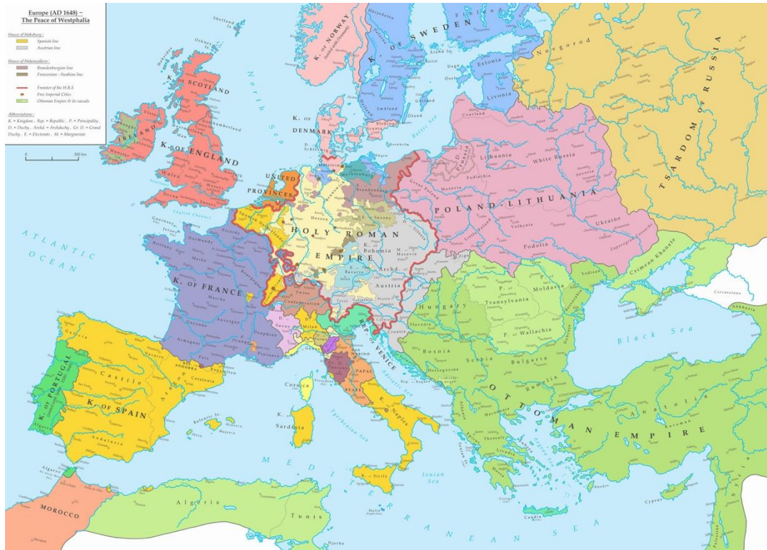
L'Europa dopo la pace di Westfalia

un potere più formale che sostanziale nei confronti degli Stati che componevano il sistema imperiale germanico 176 .