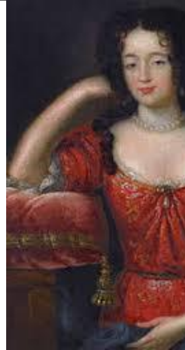
Maria Kazimiera Sobieska nata de la Grange d'Arquien regina di Polonia

A questa elezione non fu meno importante l'opera di mediazione svolta dal Buonvisi, il quale cercò di seguire le indicazioni che provenivano dalla Santa Sede e che indicavano come possibile candidato un personaggio cattolico e legato agli interessi della chiesa di Roma.