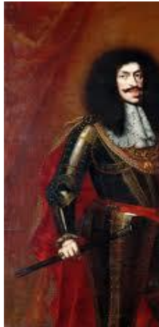
Leopoldo I d'Asburgo-Austria

allarmato, inviò rigorose direttive al nunzio affinché scongiurasse questa eventualità, facendo riflettere l'imperatore sulla sconvenienza, per un Asburgo, di sposarsi con una principessa che, seppur intenzionata a convertirsi, era nata ed aveva vissuto al di fuori della fede cattolica. Nonostante la propensione di Leopoldo per l'affascinante Ulrica, i consigli di Buonvisi diedero i frutti sperati e Sua Maestà Cesarea, ormai vedovo, scelse di sposare Eleonora di Neuburg, con viva soddisfazione della Curia romana 346 .