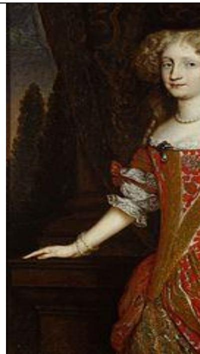
Eleonora Maddalena del Palatinato-Neuburg