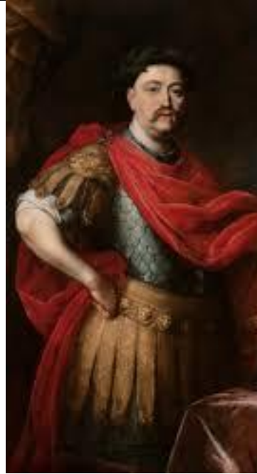
Jan III Sobieski sovrano di Polonia

attachée d'ailleurs par sa naissance aux interests de Vostre Majesté me paroît plus ferme que tout autre et dans la disposition d'une plus grande dependance 273 .