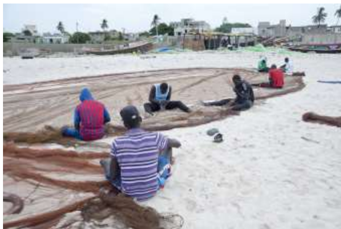
Planche 26 Plage de M'Bao (2014), séance de rafistolage du filet de pêche