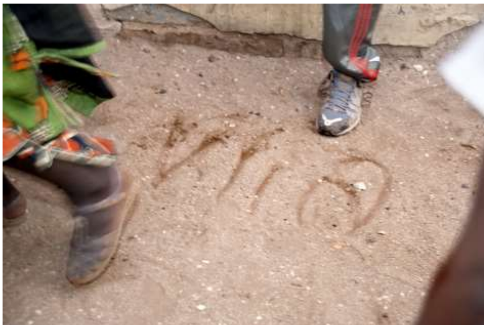
Planche 72 M'Bao (2014), Zoom sur le symbole que Thiat inscrit sur le sol avant de l'enjamber.