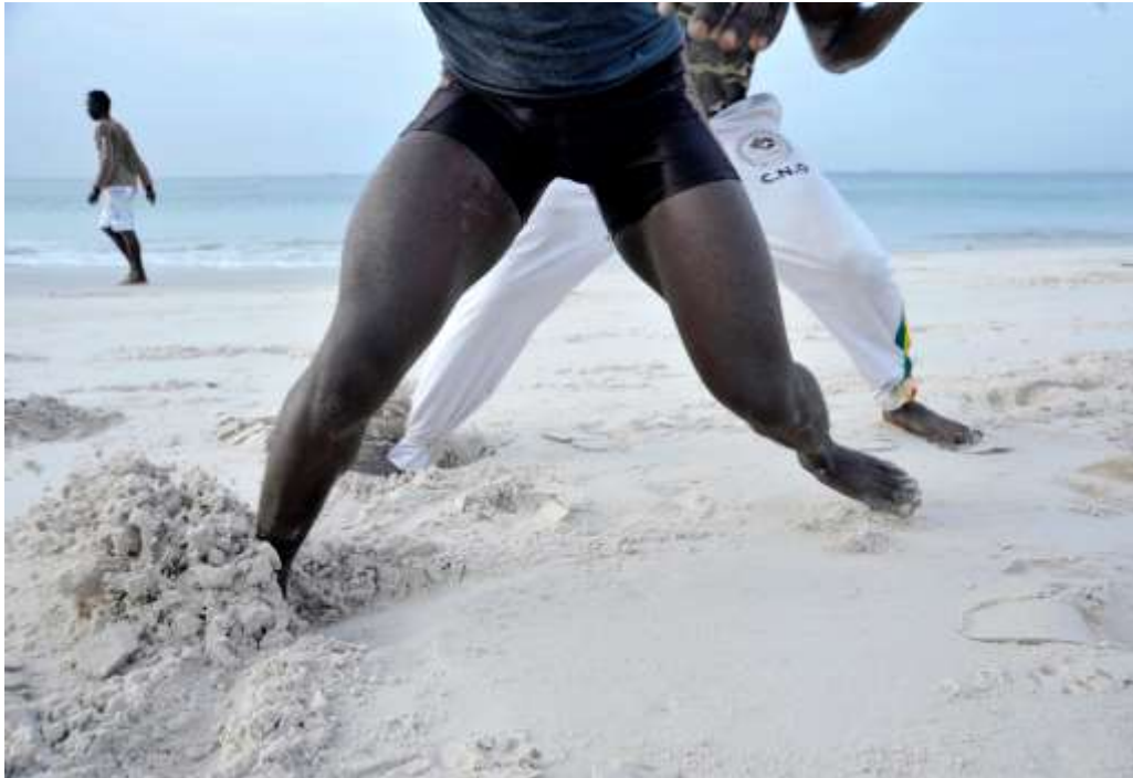
Planche 18 Plage de M'Bao (2014), entraînement sur sable.

D'autres aspects de l'entraînement des lutteurs, que nous avons pu observer chez Ablaye, portent sur des exercices physiques qui visent à développer la musculature et des « contacts », à savoir des exercices d'opposition sous forme de duels.