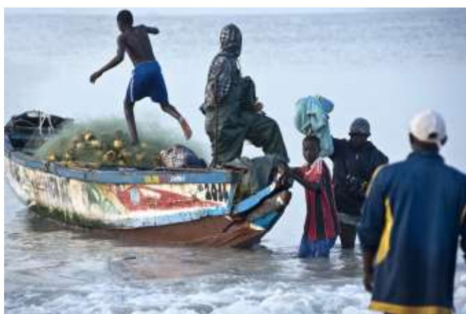
Planche 28 Mer de M'Bao (2014), fin de pêche, sortie de bateau.

Dans l'activité de la pêche, toutes les tâches réalisées collectivement et qui nécessitent une synchronisation, sont couramment accompagnées de chanson.