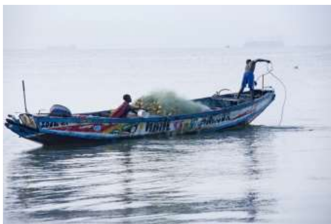
Planche 24 Mer de M'Bao (2014), arrimage du filet en fin de pêche.