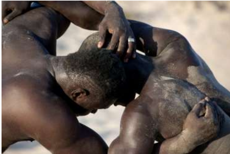
Planche 57 M'Bao (2014)