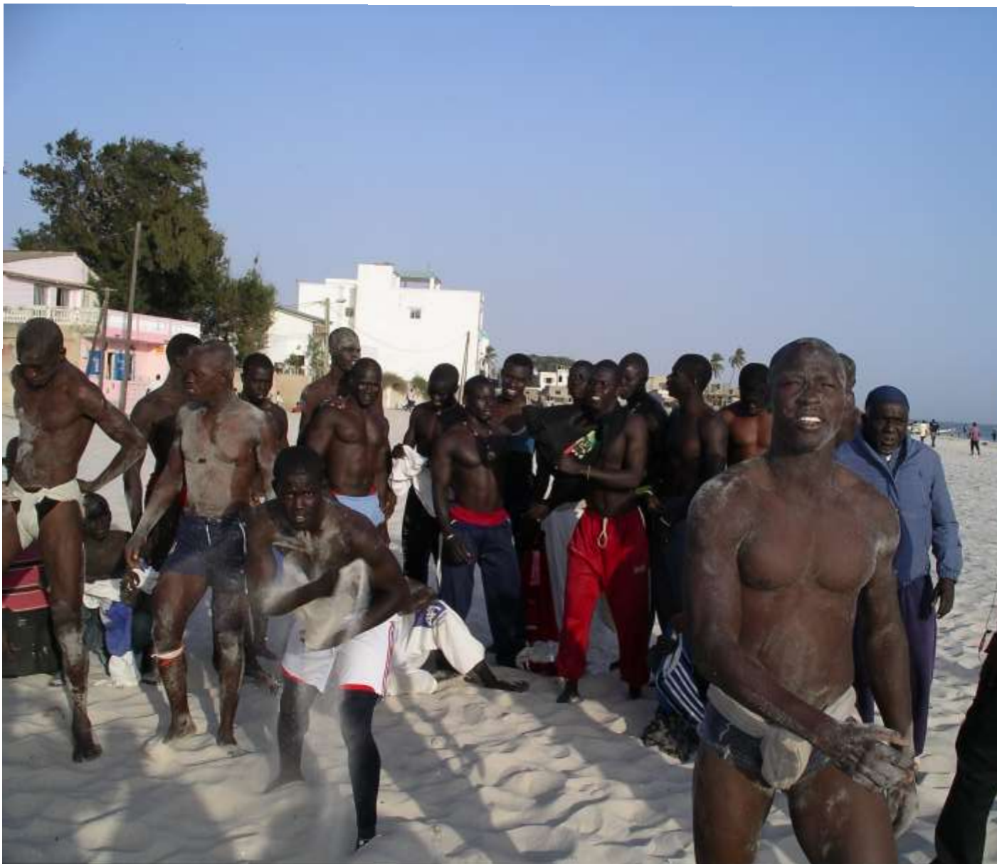
M'BAO (2011), « l'écurie de lutte M'Bao Lébougui »