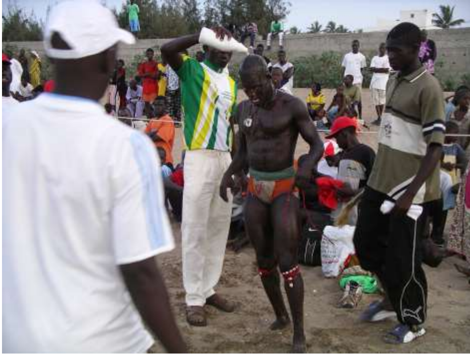
Planche 9 Petit M'Bao (2005), compétition de lutte traditionnelle, séquence de préparation mystique d'avant combat.

Ces derniers, tout en jetant un regard furtif vers l'arène, lui distillaient quelques conseils. Pendant ce temps, le « coin mystique » où il prenait ses bains était occupé, comme pour le garder, par un groupe d'enfants disposés en arc de cercle autour des « potions mystiques ». Après cette phase préparatoire, arrive le moment où Thiat fait sa présentation en esquissant des pas de danse, accompagné par les musiciens et les chanteurs. Par la suite, il revient vers son « coin mystique » pour s'asperger et se faire asperger de nouveau de potion mystique, avant d'aller disputer son combat. L'issue de ce combat a été très polémique. Les deux lutteurs impliqués ont eu du mal à se départager et la nuit allait tomber. Il était environ dix-neuf heures et le lieu commençait à s'obscurcir. L'arbitre de la partie commençait à s'impatienter, tandis que Thiat demandait fréquemment une pause pour ajuster ses « gris-gris » en forme de ficelle. Il en avait aux bras, aux jambes, à la tête, au niveau de la taille et du torse. Apparemment agacé par le temps que prenait Thiat pour ces opérations, l'arbitre