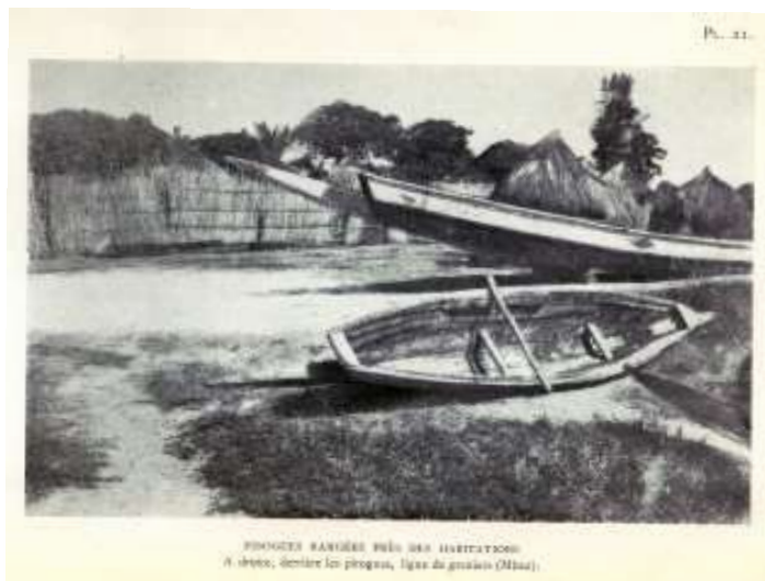
Planche 1 M'Bao (1946), Pirogues rangées près des habitations, G. Balandier / P. Mercier

L'activité économique du « village traditionnel » reposait essentiellement sur la pêche et l'agriculture. L'existence de cette activité agricole a été à l'origine de la première extension due aux populations arrivant des autres régions du Sénégal. Du Djolof, du Baol ainsi que de la partie non littorale du Cayor. Ces derniers étaient employés comme « ouvriers agricoles » par la population Lébou qui les surnommait « Adior ». Dans l'imaginaire Lébou, le « Adior » est celui qui n'a pas de lien avec l'océan, celui qui n'a pas dans ses usages la pratique de l'activité de pêche et qui a une certaine appréhension de la mer.