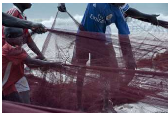
Planche 22 Plage de M'Bao (2014), Pliage du filet de pêche.

Le corps est sollicité comme outil dans une perspective de production. La forme de pêche pratiquée en pays lébou implique le groupe. Les enfants côtoient les adultes et s'approprient ainsi les techniques et savoir-faire dans ce domaine par l'expérimentation. La transmission procède par mimétisme. Les plus jeunes imitent les gestes et postures corporels de leurs aînés. Et ces derniers veillent sur ces "imitateurs volontaristes" avec beaucoup de bienveillance.