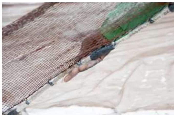
Planche 25 Plage de M'Bao (2014), geste de saisie dans le pliage du filet