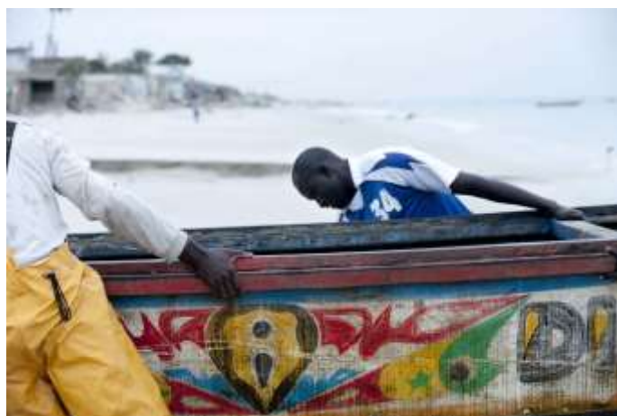
Planche 21 Plage de M'Bao (2014), fin de pêche.