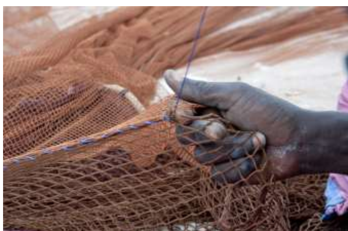
Planche 27 Plage de M'Bao (2014), geste de rafistolage.