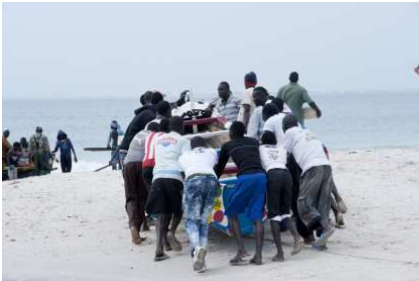
Planche 20 M'Bao (2014), mise à l'eau d'un bateau de pêche.

L'activité de pêche nous fournit des éléments pour une meilleure connaissance des techniques du corps dans l'espace social. L'approche anthropologique visuelle nous permet d'établir des formes d'usage du corps. L'observation, appuyée sur la technique photographique, est une occasion pour joindre un certain nombre de matériaux à l'analyse de la compréhension des «pratiques corporelles ». Ces expériences quotidiennes récurrentes qui rythment l'espace et le temps participent à forger l'imaginaire du corps. Dans notre espace lébou, le corps est mobilisé comme ressource. La pêche est, dans notre espace, une activité couramment collective. Elle est un lieu de transmission de savoir-faire. Cette sensibilisation est à la fois formelle et informelle. Elle se matérialise à travers l'expérience. L'activité de pêche est un lieu de partage, un lieu de vie. Ainsi la transmission s'inscrit dans la réalité d'un certain nombre de tâches, d'un certain nombre de postures et de formes d'utilisation du corps.