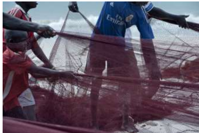
Planche 22 Plage de M'Bao (2014), Pliage du filet de pêche.

Le corps est sollicité comme outil dans une perspective de production. La forme de pêche pratiquée en pays lébou implique le groupe. Les enfants côtoient les adultes et s'approprient ainsi les techniques et savoir-faire dans ce domaine par l'expérimentation. La transmission procède par mimétisme. Les plus jeunes imitent les gestes et postures corporels de leurs aînés. Et ces derniers veillent sur ces "imitateurs volontaristes" avec beaucoup de bienveillance.