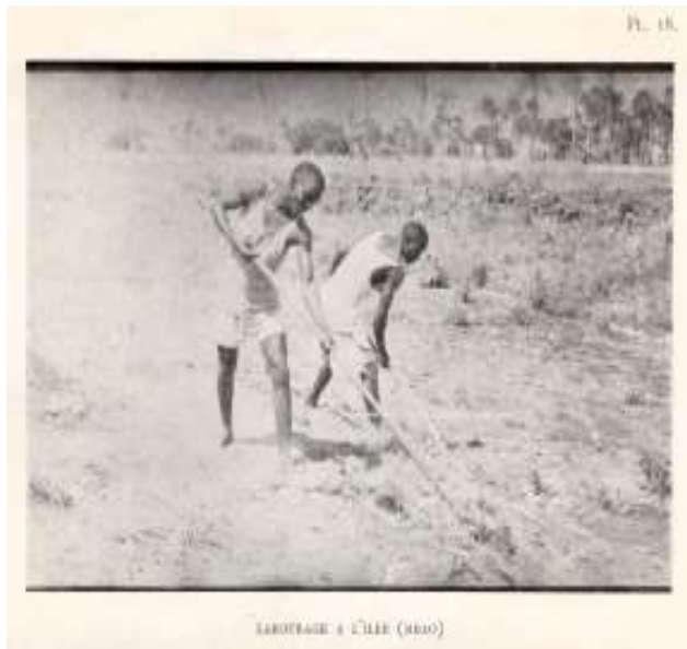
Planche 3 M'Bao (1946), Labourage à l'iler. G. Balandier/P. Mercier

Elles prêtent les terres qu'elles ne cultivent pas à des pères de famille qui le souhaitent et les sollicitent. Selon la capacité familiale à cultiver les terres, des personnes viennent prêter main forte. Les garçons de la famille participent très tôt aux travaux des champs, les cousins et amis viennent « aider ». De même, des personnes peuvent arriver d'autres villages pour participer à cet effort. Dans ce cas, elles sont dans ce cas hébergées, nourries et logées par les familles avec lesquelles elles travaillent. Ce sont les « sourghas ». Leur contribution est quantifiée. On leur affecte généralement un volume de tâches à accomplir en échange de l'hospitalité, mais aussi d'une rente pécuniaire. Les « sourghas » sont assimilés à la famille qui les accueille. Ils dorment, partagent les repas et participent aux travaux de la famille afférents à l'agriculture. Il est moins question de « domination, d'exploitation, (...), d'obligation » 31 que d'échange de services. Les « sourghas » sont essentiellement sérères 32 , ils ont un savoir-faire quant aux travaux des champs. La plupart des « sourghas » viennent de la