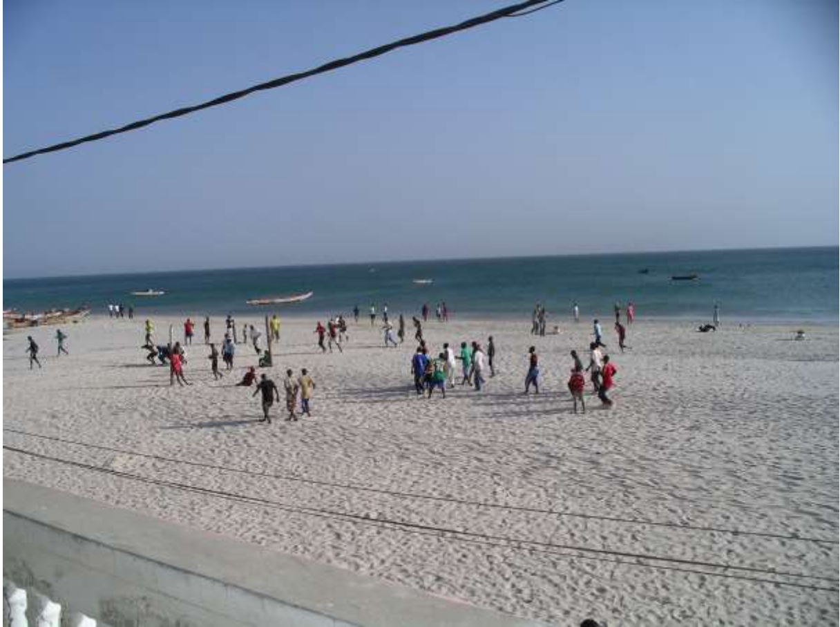
M'Bao (2011), « Benoukh ».