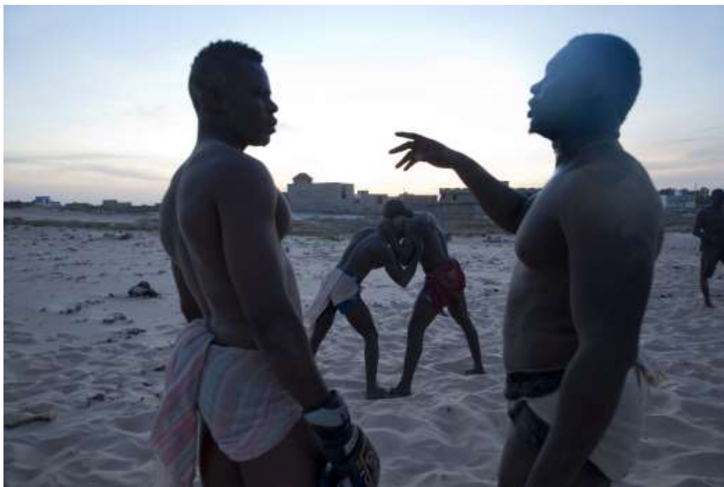
Planche 17 Niakou Rapp (2014), Entraînement de lutte sur terrain vague ( un « don de contact »).

Dans ce type de préparation spécifique, nous l'avons accompagné lors d'un « coup de main » qu'il donnait à un de ses amis lutteurs qui avait un combat programmé. Pour cet entraînement en question qui consiste à « donner, en cadeau, un contact » (traduction littérale), nous avons organisé un déplacement dans un terrain vague près du Lac Rose à « Niakou Rap ». C'est un terrain de dunes de sable isolé. Ablaye a été sollicité par son ami lutteur pour lui servir de « sparring-partner ». Ce type de don marque une certaine proximité. Il suppose d'une part une reconnaissance de la qualité du lutteur qu'est Ablaye, et d'autre part une confiance. En effet, dans ces phases de préparation, la méfiance des futurs combattants est totale. Ils travaillent des parades pour contrer et terrasser leur futur adversaire en même temps qu'ils se méfient d'éléments mystiques que pourraient leur envoyer ce dernier. Cet épisode nous montre une facette de la manière dont les lutteurs s'exercent. Nous percevons ainsi une façon qu'ont les lutteurs de s'apprécier à travers une passion partagée, pour le moins une pratique