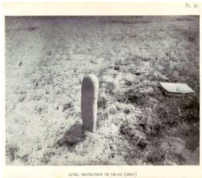
Planche 4 M'Bao (1946), Autel protecteur de champ. G. Balandier / P. Mercier

La protection des champs est matérialisée par des éléments symboliques disposés à l'entrée de l'espace cultivé. Des prières sont formulées et des rituels de sacrifice sont exécutés pour que le rendement agricole soit important. La