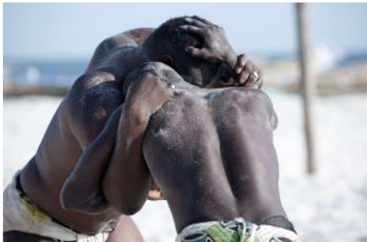
Planche 58 M'Bao (2014)