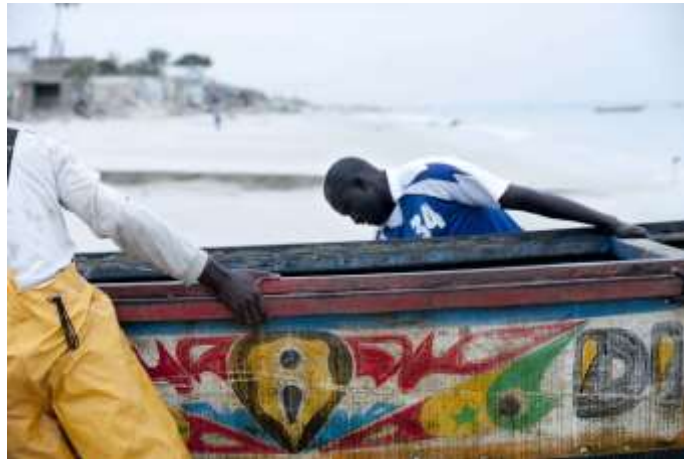
Planche 21 Plage de M'Bao (2014), fin de pêche.