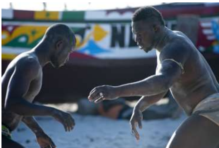
Planche 55 M'Bao (2014)

Le corpus sélectionné pour ces observations est issu de séances d'entraînement au bord de la plage de M'Bao ainsi qu'à Niakou Rapp.