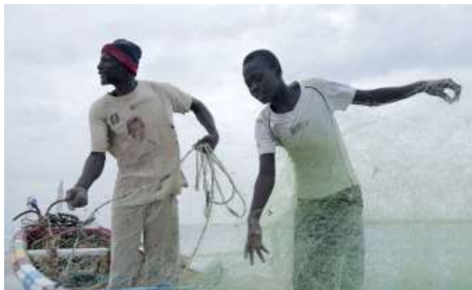
Planche 23 Mer de M'Bao (2014), départ pour la pêche.