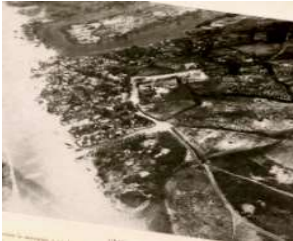
Planche 8 M'Bao (1946), Vue aérienne du village traditionnel de M'Bao. Au centre la mosquée « en dur » et l'école. Au fond, au delà de la boucle du marigot, Petit-M'Bao. G. Balandier / P. Mercier.

géographique, mais aussi une identification comme Lébous. Ils ont, à des époques différentes, pratiqué la pêche et cultivé la terre, même s'il existe quelques contrastes entre les différentes époques.