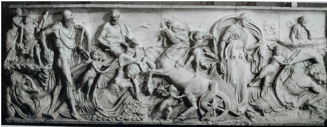
FIG. 23: Sarcophage, Mars and Rhea Silvia à gauche, Séléné et Endymion à droite. Vers 250 ap. J.-C ; LIMC 1988 s. v. Endymion 83 et KOORTBOJIAN 1995 ill. 57, (Vatican, Museo Gregoriano Profano 9558).