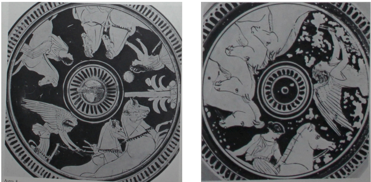
FIG. 4: Pyxides. (Gauche) LIMC 1988, s. v. Astra : 8 = 19 (Berlin, Antikensammlung, F 2519) ; (Droite) 9 = 20 (Londres, British Museum, 73.9-15.14, E 776).