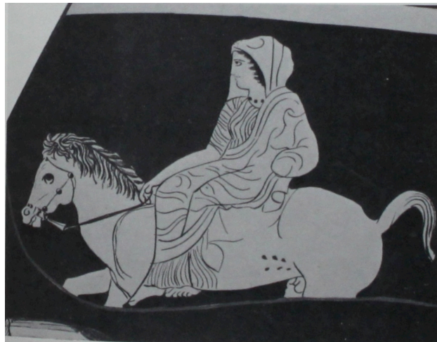
FIG. 6: Cratère Blacas. LIMC 1988, s. v. Astra , 22 (Londres, British Museum, E 466).