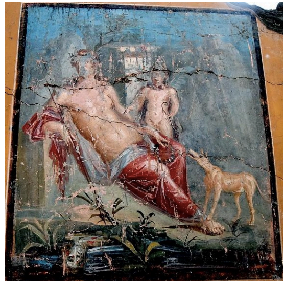
FIG. 27: (Gauche) Fresque d'Herculanum, Séléné et Endymion. LIMC 1988 s. v. Endymion 19 (Naples, Museo Archeologico Nazionale, 9246). (Droite) Fresque découverte à Pompéi (Regio V, via del Vesuvio) le 14 février 2019, Narcisse et Echo.