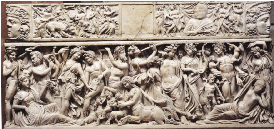
FIG. 12: Paire de sarcophages retrouvés à Saint-Médard-d'Eyrans, vers 230-240 ap. J.-C. (Haut) Endymion et Séléne, LIMC 1988 s. v. Endymion 70 et ZANKER et EWALD 2012, ill. 91. Voir aussi ZANKER et EWALD 2012, doc. 15 (Paris, Louvre MA 1335). (Bas) Dionysos et Ariane, ZANKER et EWALD 2012, ill.92 (Paris, Louvre).