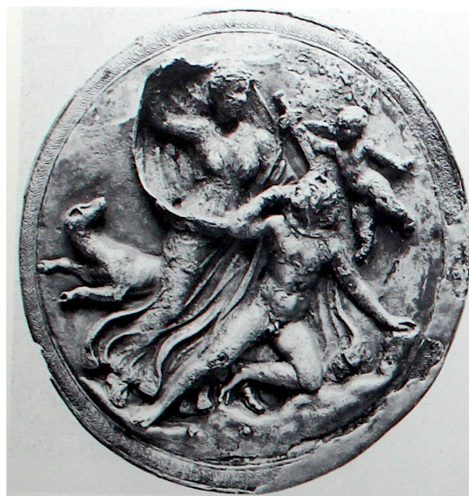
FIG. 25: Miroir à boîtier retrouvé à Démétrias en argent doré, seconde moitié du IV e s. av. J.-C. ; LIMC 1988 s. v. Astraea 55 (Athènes, Musée National 16111).