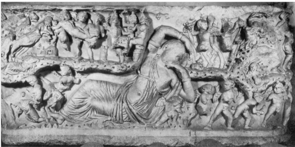
FIG. 21: Sarcophage, Ariane et les cupidons (250 ap. J.-C). ZANKER et EWALD 2012 ill. 152 (Naples, National Archeological Museum).