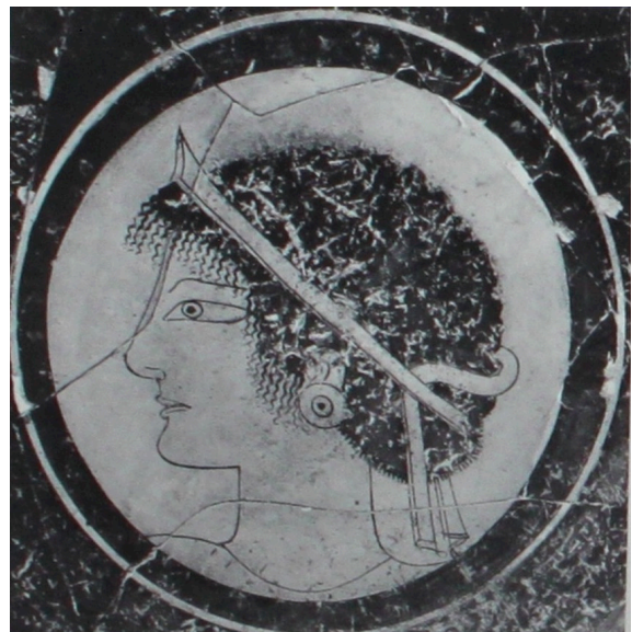
FIG. 8: Coupes attiques, début V e s., trouvées en Étrurie. (Gauche) LIMC 1988 s. v. Astra 41, de Vulci (Berlin-Charlottenburg, Staatliche Museum, F 2278) ; (Droite) LIMC 1988 s. v. Astra 42, d'Orvieto (Bonn, Akademisches Kunstmuseum, 63).