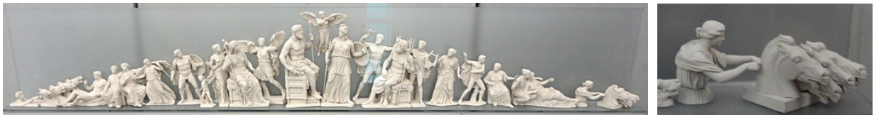
FIG. 2: (Gauche) Fronton oriental du Parthénon (reconstitution du musée de l'Acropole, Athènes). (Droite) Idem , détails de Séléne.