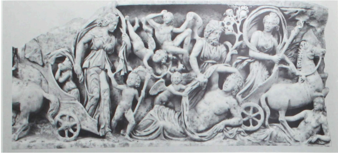
FIG. 13: Sarcophage, vers 220 ap. J.-C. : Séléné arrivant et repartant, Endymion au centre. LIMC 1988 s. v. Endymion 61 (Malibu, Getty Museum, 76.AA.8).