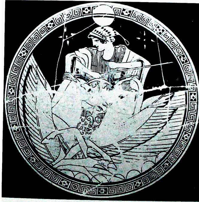
FIG. 7: Coupe représentant un lever de Lune. LIMC 1988 s. v. Astra , 39 = Séléné, Luna 47 (Berlin, Antikensammlung, F 2293).