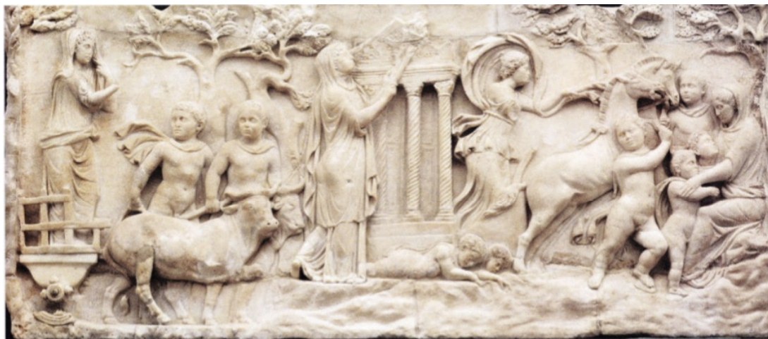
FIG. 18: Stèle érigée pour deux jeunes garçons, vers 170 ap. J.-C. : Cléobis et Biton. ZANKER et EWALD 2012 ill. 195, (Venise, Museo Archeologico).