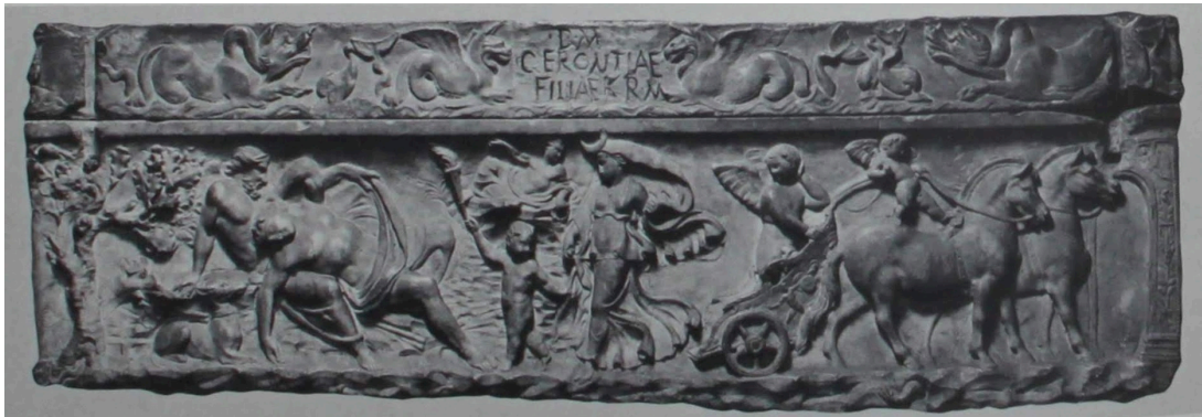
FIG. 9: Sarcophage d'enfant du début du II e s., (sarcophage de Gerontia, inscription du IV e s.). LIMC 1988 46 et ZANKER et EWALD 2012 doc. 14, p. 335-337 (Rome, Musée du Capitole, 325).