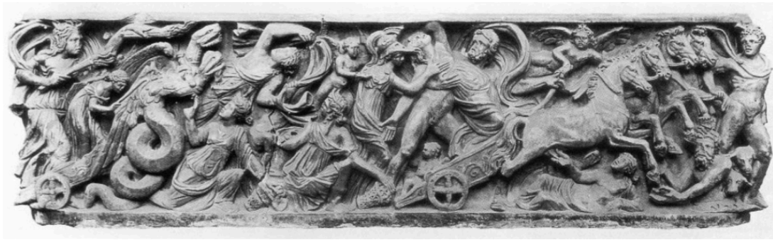
FIG. 17: Sarcophage de Charlemagne, représentant le rapt de Perséphone. ZANKER et EWALD 2012 ill. 4 (Aix-la-Chapelle).