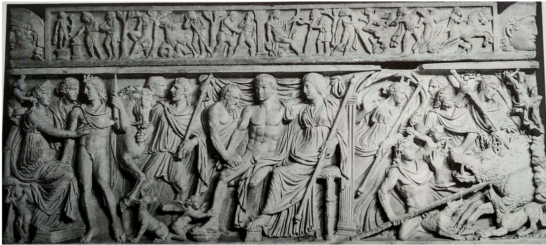
FIG. 15: Sarcophage représentant Adonis et Aphrodite. KOORTBOJIAN 1995, ill. 7 (Vatican, Museo Gregorio Profano, 10409).