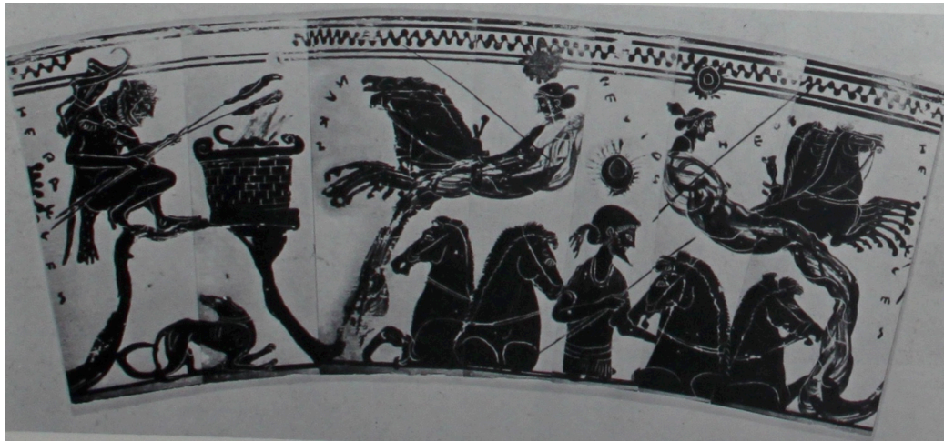
FIG. 5: Lécythe avec Hélios de face, Nyx et Éos de profil, Héraclès sacrifiant. LIMC 1988, s. v. Astra , 3 (New York, Metropolitan Museum, 41.162.29).