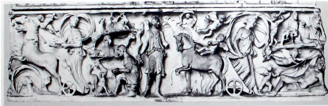
FIG. 14: Sarcophage, vers 150-170 ap. J.-C. : Séléné arrivant et repartant, Endymion sur la droite. LIMC 1988 s. v. Endymion 63 (Rome, Musée du Capitole, 725).