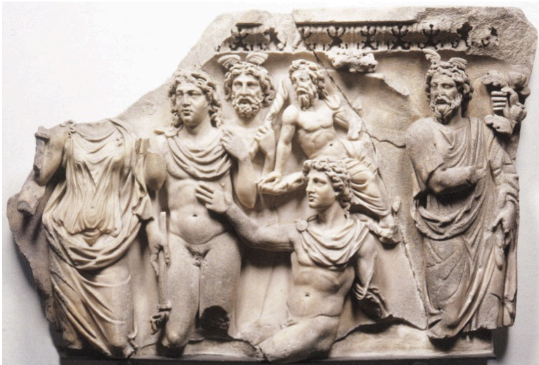
FIG. 24: Fragment de sarcophage, Endymion assis et éveillé. Vers 210-220 ap. J.-C ; LIMC 1988 s. v. Endymion 82 ; KOORTBOJIAN 1995 ill. 46 ; ZANKER et EWALD 2012 ill. 185, (Berlin, Staatliche Museen, Antikensammlung, Sk 846).