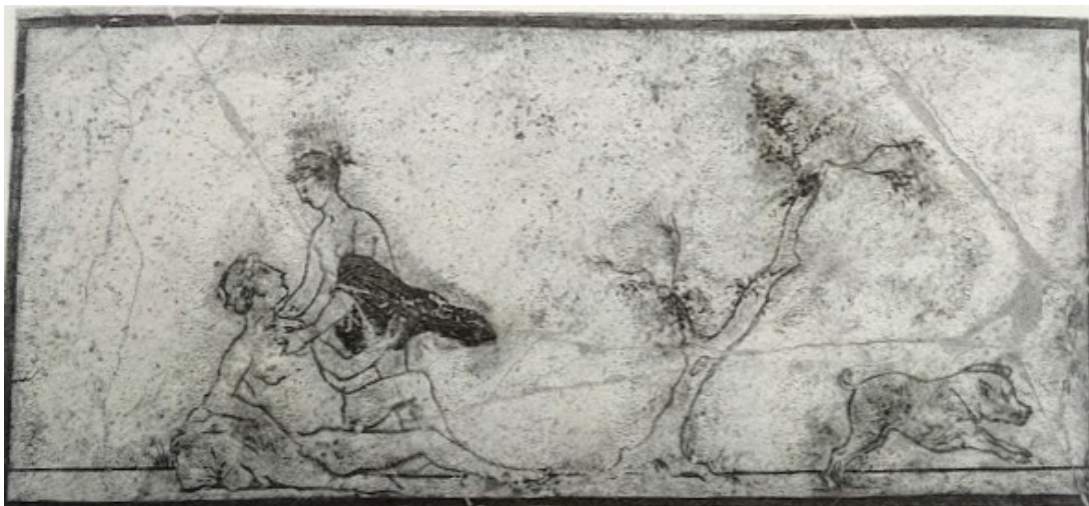
FIG. 16: Fragment de fresque de Pompéi sur fond stucé blanc représentant la mort d'Adonis. KOORTBOJIAN 1995, ill. 12 (Paris, Louvre).