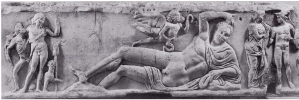
FIG. 19: Sarcophage, Endymion seul, les yeux ouverts. ZANKER et EWALD 2012 ill. 90 et KOORTBOJIAN 1995 ill. 49 (Rome, Palazzo Braschi).