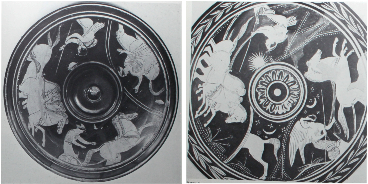
FIG. 3: Pyxides. (Gauche) LIMC 1988, s. v. Astra : 4 = 21 (Londres, British Museum, 1920.12-21.1) ; (Droite) 7 = 38 (Athènes, Musée national, 17983).