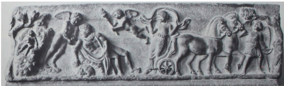
FIG. 10: Sarcophage d'Asie Mineure (Kastellorizo), vers 170 ap. J.-C ; LIMC 1988 s. v. Endymion , 53 (Paris, Louvre MA 3184).