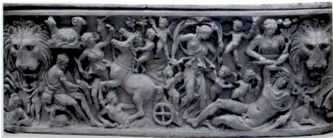
FIG. 11: Sarcophage en forme de lenos du début du III e siècle. LIMC 1988 s. v. Endymion , 81 et ZANKER et EWALD 2012, p. 340-344 (New York, Metropolitan Museum of Art, 47.100.4).