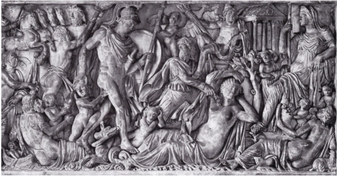
FIG. 22: Sarcophage, Mars et Rhéa Silvia (vers 250 ap.J.-C.). ZANKER et EWALD 2012 ill. 193 (Rome, Palazzo Mattei).