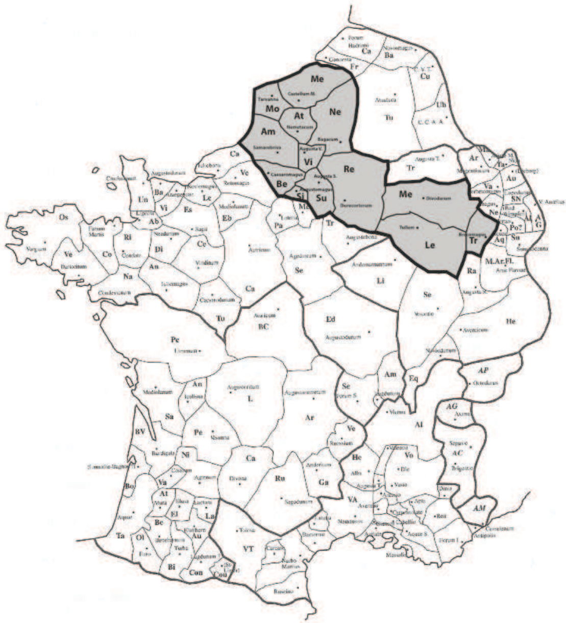
Figure 1. Le territoire du Nord-Est de la Gaule objet de cette recherche (d'après Dodin-Payre, Raepsaet-Charlier 2001, pl. XXII; DAO A. Dazzi).

À l'intérieur de la Gaule Belgique « française », tous les sites n'ont pas été pris en considération. Nous avons d'abord décidé d'exclure les villae , les établissements ruraux et les sanctuaires puisque la recherche était centrée sur l'étude du réseau hydraulique en milieu urbain. Comme les sites restants demeurent toujours très nombreux et que, dans certains cas, ils ne fournissent pas un nombre assez important de structures hydrauliques, nous étions dans l'obligation de sélectionner un échantillon qui