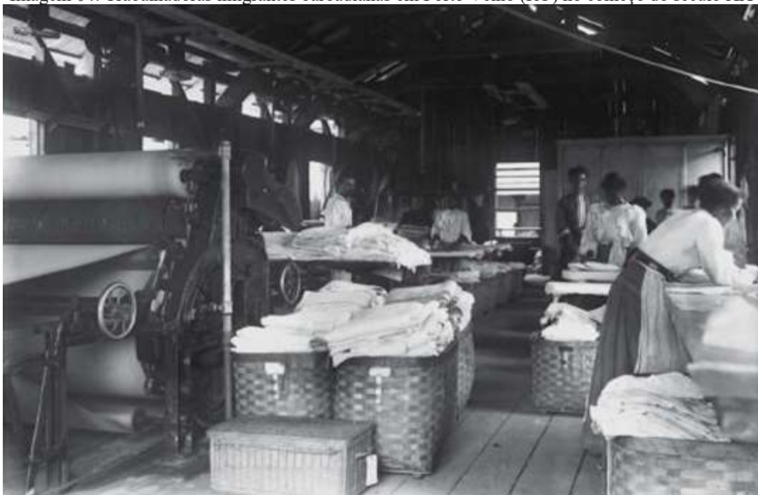
Imagem 04: Trabalhadoras imigrantes barbadianas em Porto Velho (RO) no começo do século XX