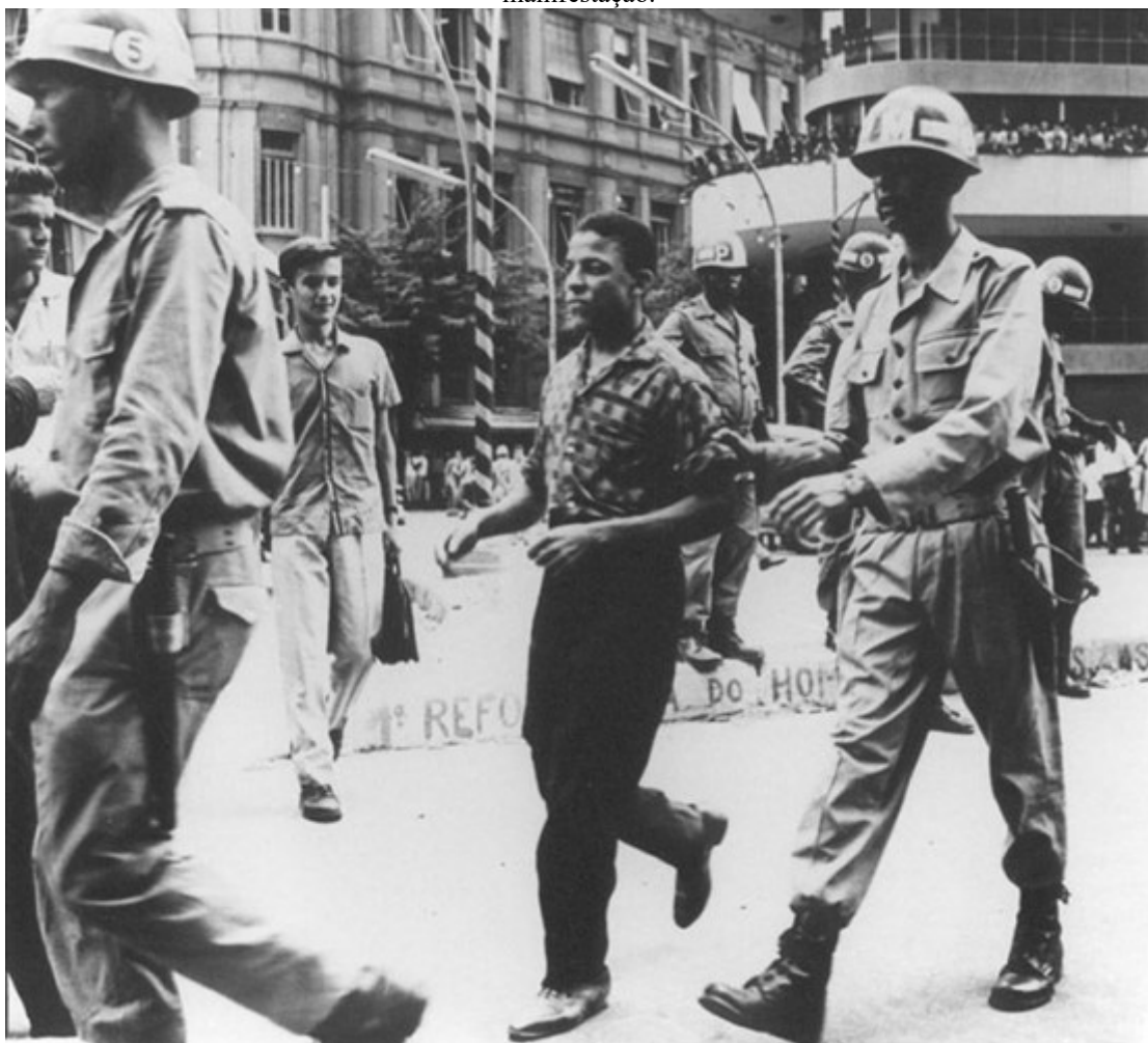
Imagem 13: Homem negro é preso pelas Forças Armadas em Belo Horizonte durante uma manifestação.