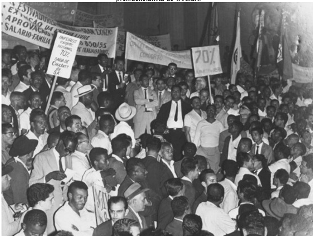
Imagem 11: A greve nacional que interrompeu os transportes no país no início do regime presidencialista de Goulart.

negociado com o FMI e, por conseguinte, foi significativamente validado pelo setor empresarial do país (FIGUEIREDO, 1993). Entretanto, esse não foi o caso das esquerdas brasileiras e, embora não seja possível identificar nenhuma mulher negra na foto a seguir, observa-se que o grupo de grevistas mobilizados durante o governo de Goulart foi majoritariamente composto por negros.