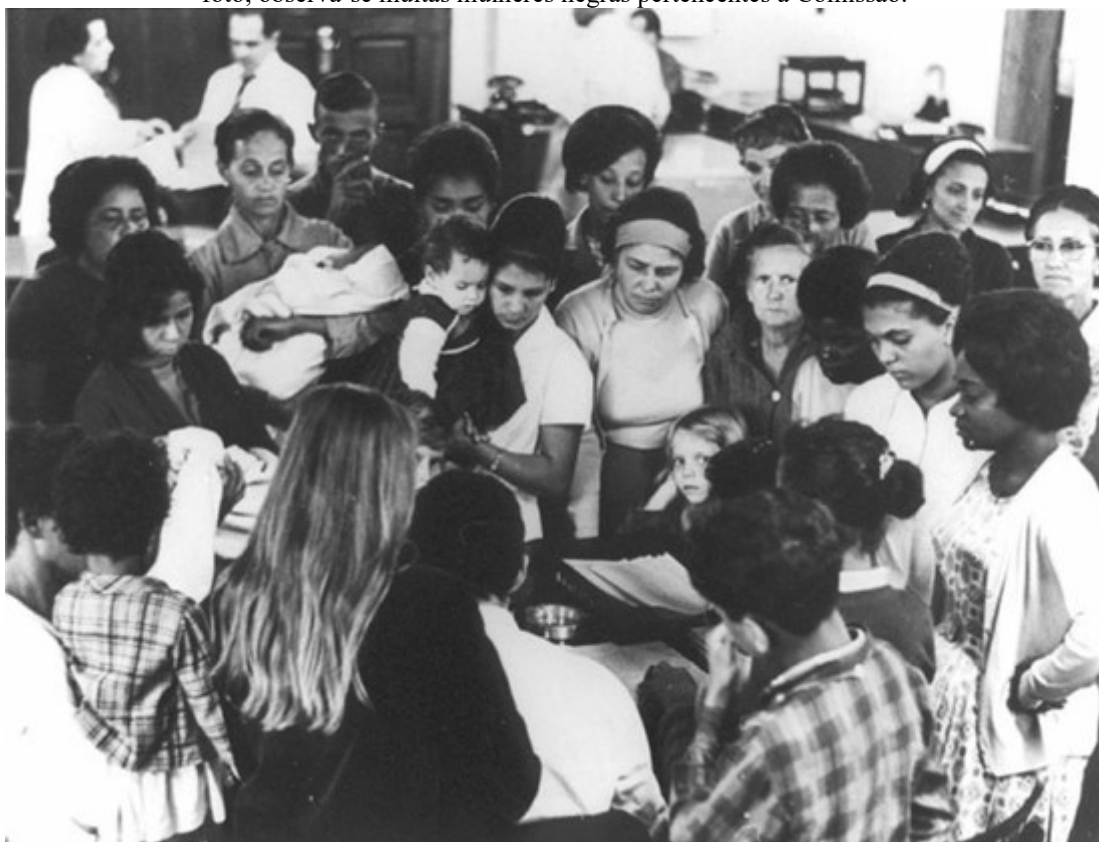
Imagem 12: Comissão de mães e esposas de presos políticos que, situadas na sede do jornal Correio da Manhã , no Rio de Janeiro, redigem um documento solicitando a Castello Branco a liberação de seus próximos. Nesta foto, observa-se muitas mulheres negras pertencentes a Comissão.