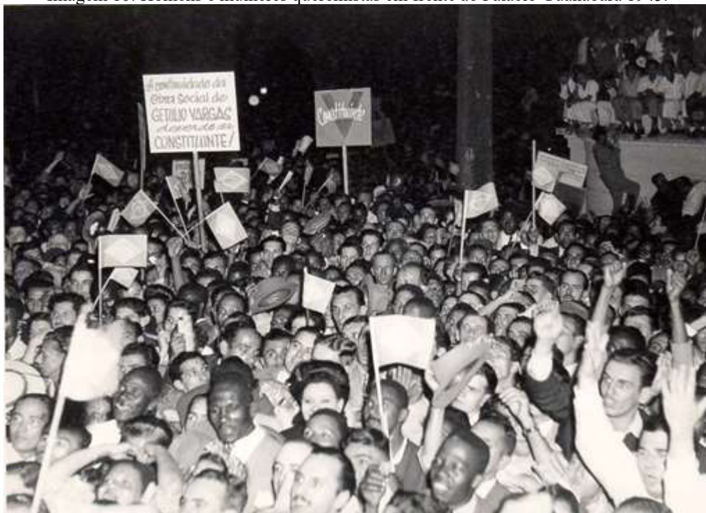
Imagem 10: Homens e mulheres queremistas em frente ao Palácio Guanabara 1945.