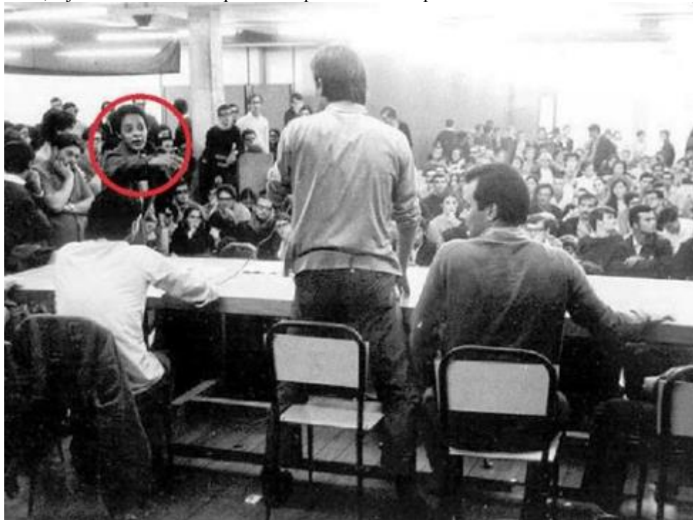
Imagem 18: Helenira discursa durante um evento da UNE em SP. Segundo o depoimento de sua irmã, Helenalda, o jovem estudante em pé contra quem Helenira aponta o dedo indicador seria José Dirceu.