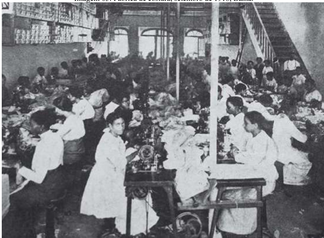
Imagem 05: Fábrica de costura, setembro de 1918, Bahia.