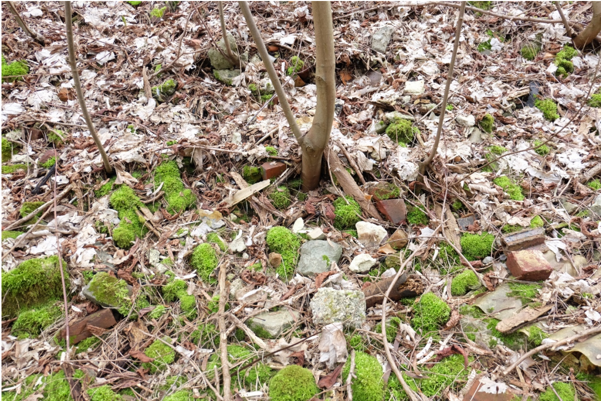
Le sol de la forêt de la Corniche des Forts est recouvert de gravats sur lesquels la végétation a poussé.