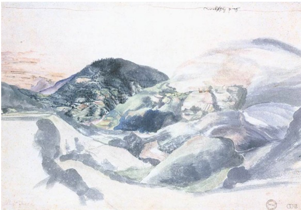
Figure 4 – Albrecht Dürer, Montagne welche , vers 1495, Oxford, Ashmolean Museum of Art and Archeology.