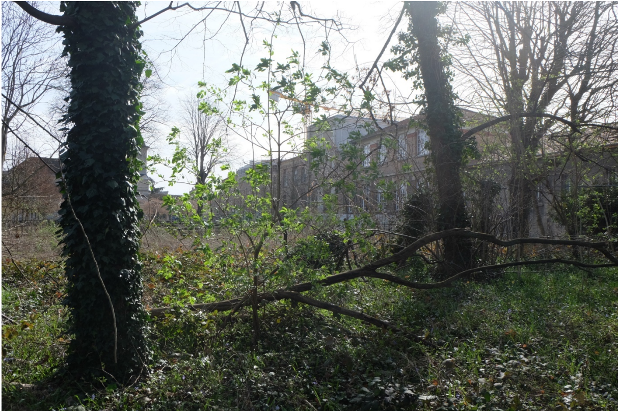
Anciennes usines de plâtre de Romainville.