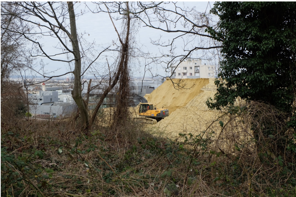
Le sable entassé à la lisière de la forêt du côté de Pantin. Il sert à fabriquer le béton qui comble les galeries souterraines de la Corniche des Forts.