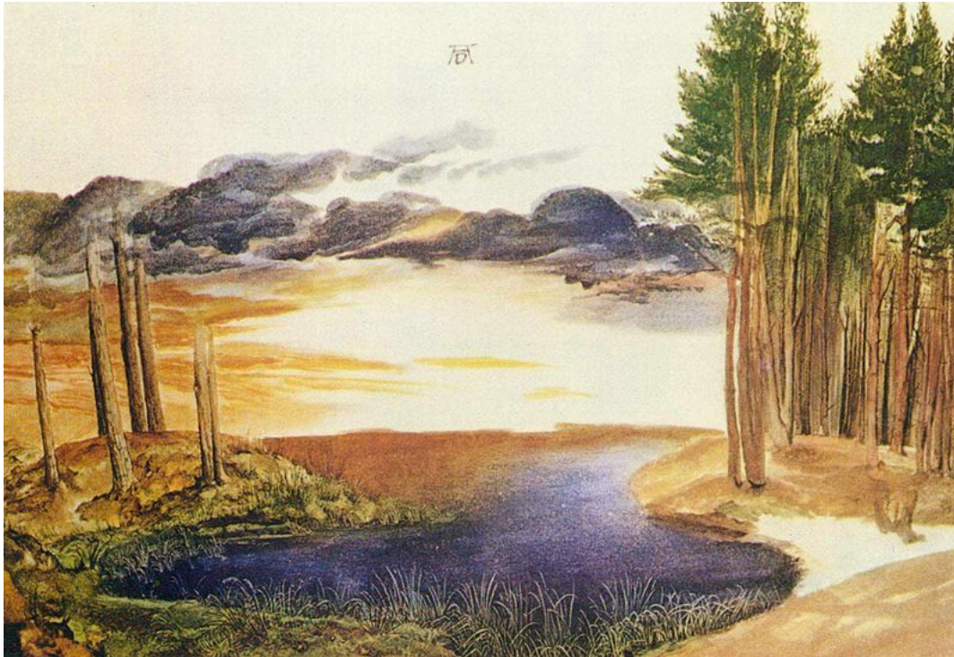
Figure 3 – Albrecht Dürer, L'étang dans la forêt , vers 1495. Londres, British Museum.