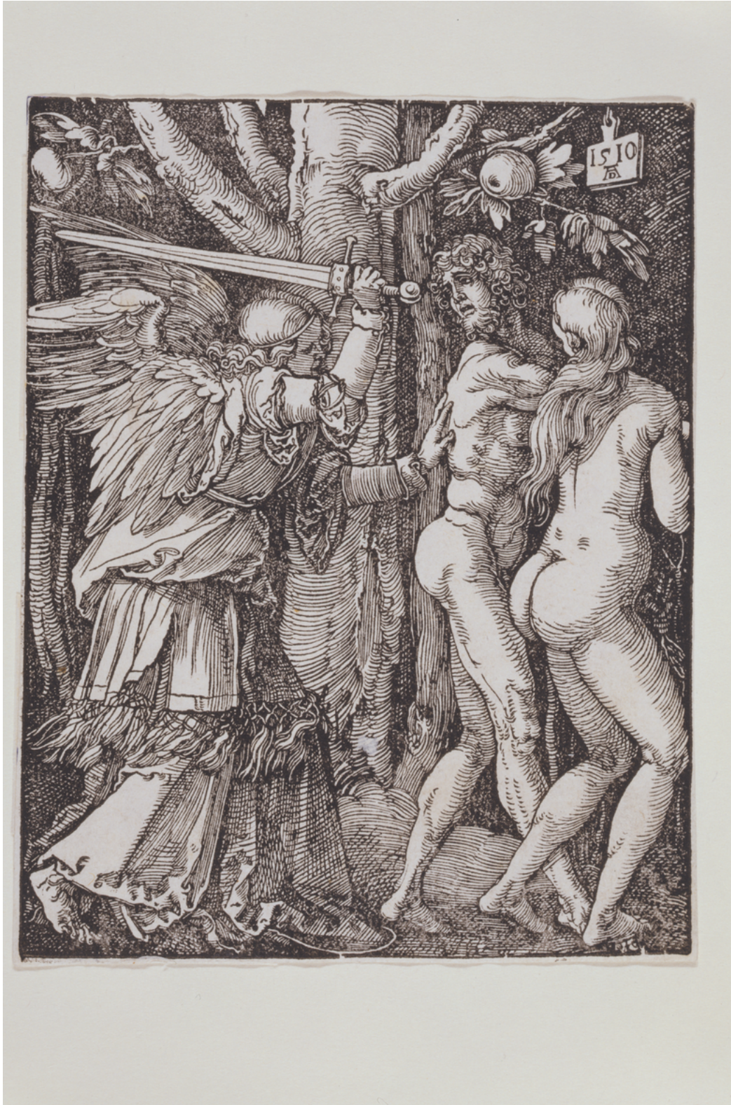
Figure 2 – Albrecht Dürer, L'expulsion du Paradis , gravure sur bois, 1510. Paris, Musée du Petit Palais, collection Dutuit. Reproduction de Cat. Albrecht Dürer, œuvre gravée , Paris-Musées, 1996, n° 98, p. 155.