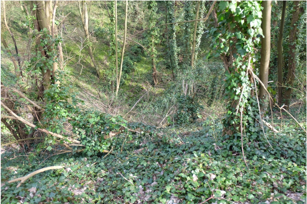
La forêt de Romainville a poussé spontanément sur d'anciennes carrières de gypse abandonnées. Ci-dessous une partie du front de taille recouvert de végétation.