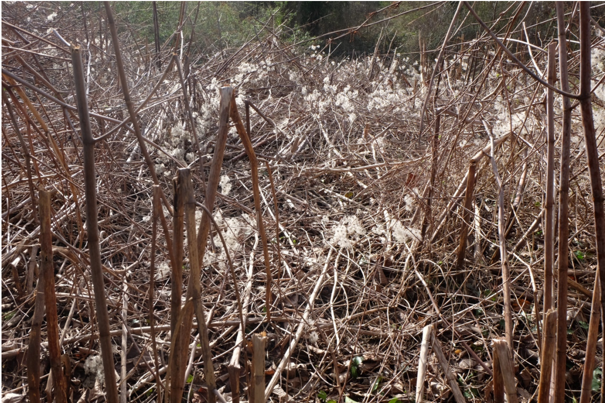
La renouée du Japon à la fin de l'hiver.