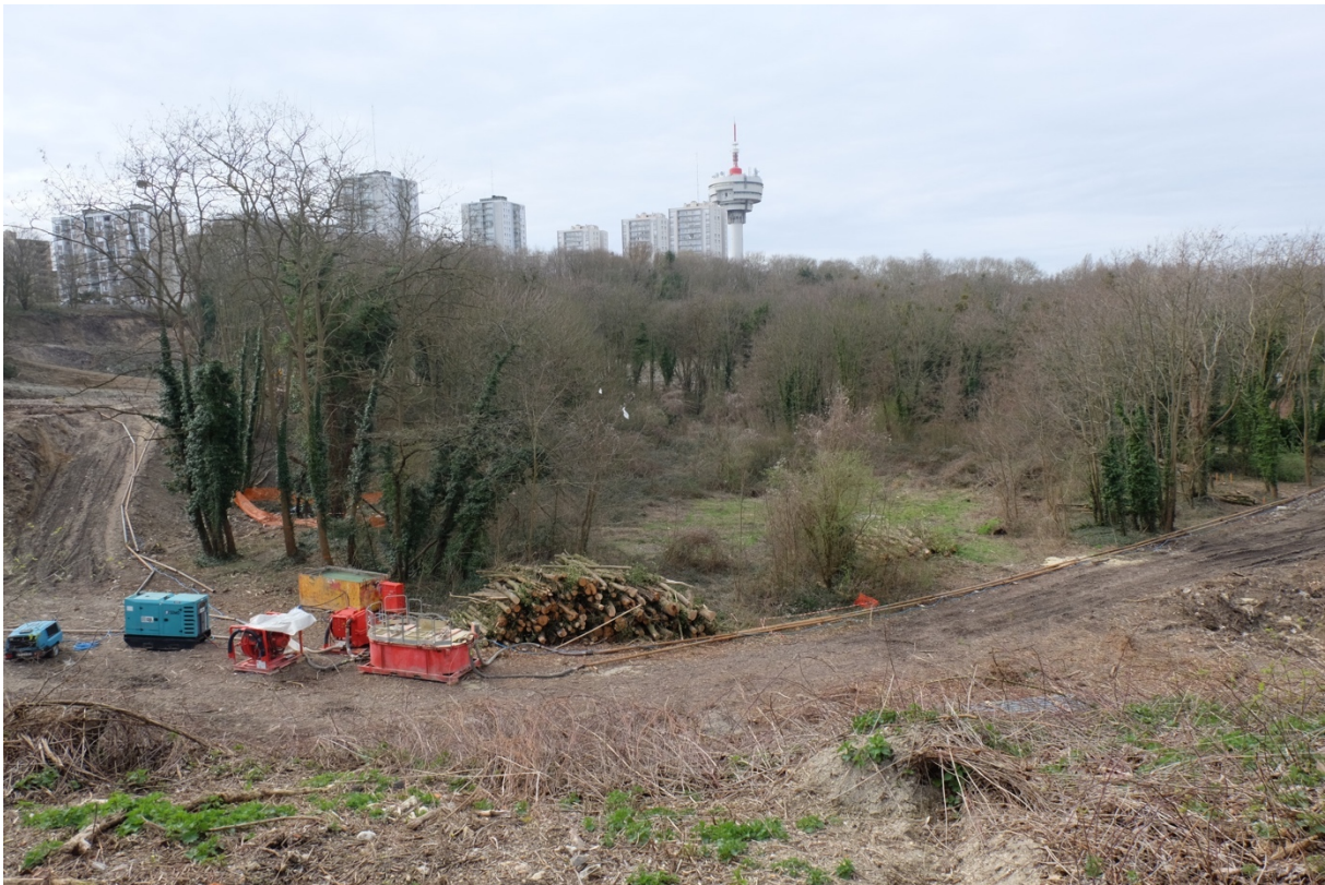
Le chantier de la base de loisir avec, à l'arrière-plan, la cité Youri Gagarine.