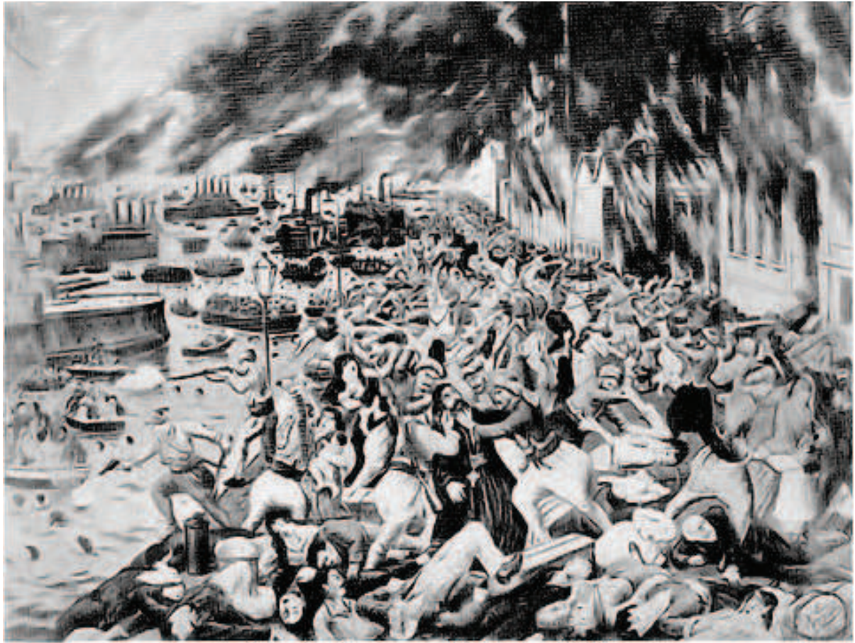
Une scène de massacres à Smyrne en 1922.