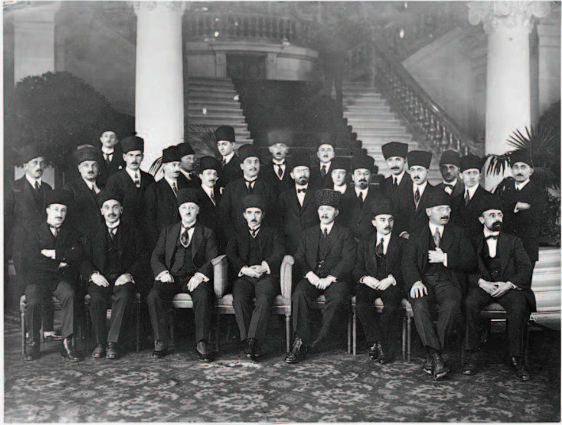
WHITE - Turkey - Government - Ismet Pasha in Center - 1923 -