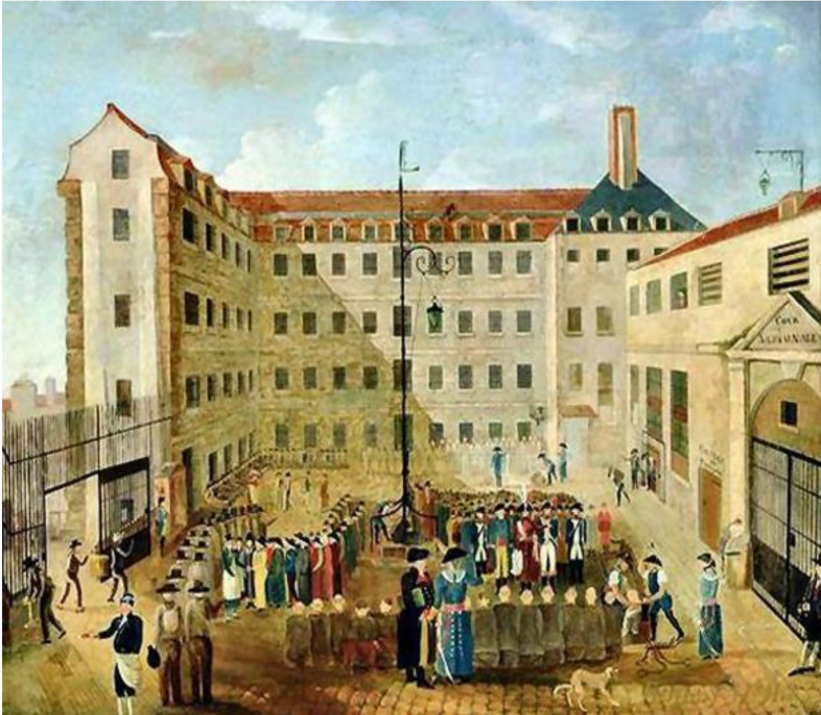
Figure 1 : « Le ferrement des prisonniers à Bicêtre », huile de Louis Léopold Boilly, 1791.