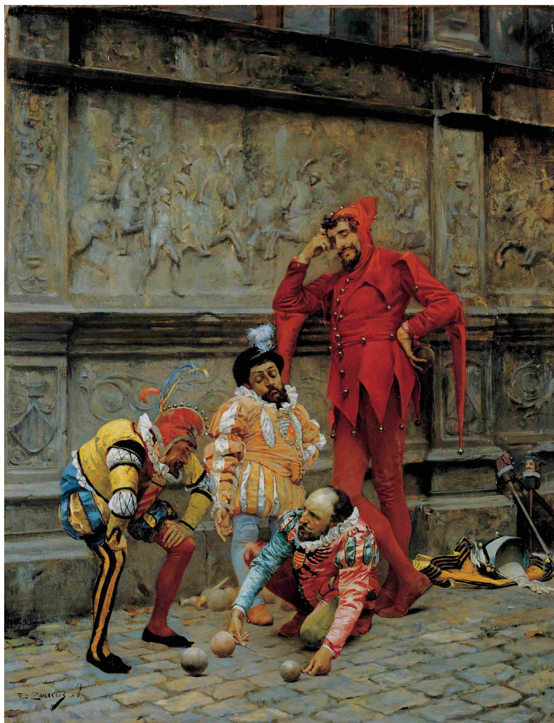
Bouffons de cour jouant aux boules, 1868 Eduardo Zamacois y Zabala

jusqu'à devenir une figure obsédante de l'imaginaire collectif, l'une des plus riches de significations morales » 5 . Le fou est ainsi devenu un thème artistique répandu. On ne compte plus les œuvres qui l'ont élu comme sujet.