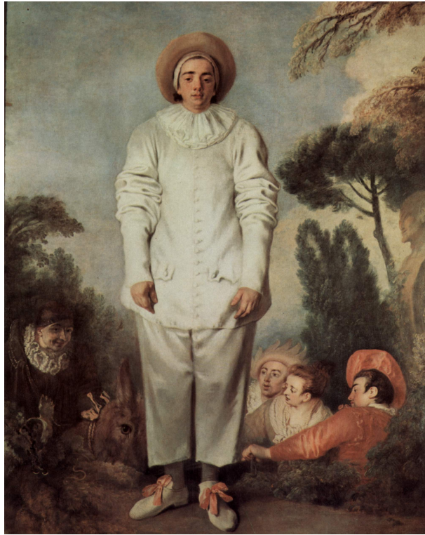
Pierrot dit autrefois Gilles, 1718-1719 Jean-Antoine Watteau