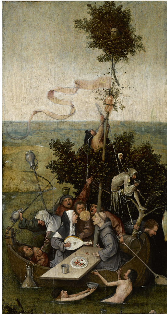
La Nef des fous Jérôme Bosch, vers 1490-1510

partir de 1497, et Éloge de la folie d’Érasme de Rotterdam en 1511. Dans le premier, il ne s’agit ni plus ni moins que d’un catalogue des folies du monde, un répertoire des péchés et des erreurs d’une l’humanité qui se fourvoie. C’est une œuvre satirique et didactique qui condamne moralement les “fous de carnaval” alors même qu’il se place sous son signe d’une simple phrase : « Imprimé à Bâle pour le jour de carnaval » 59 . Bref, ce sont des Vices qui sont encore mis sur le banc des accusés.