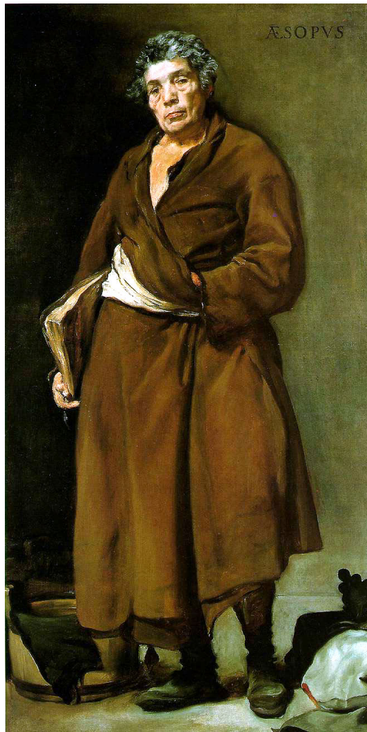
Ésope, Diego Velasquez, 1638

la légende dorée du bouffon qui se dessinera au cours des siècles suivants. Hors de la fiction, l'Histoire antique a recensé peu d'énergumènes de cette envergure. On ne peut guère citer que le bouffon du roi Salomon qui s'appelait Marcolphe et qui passait pour sage.