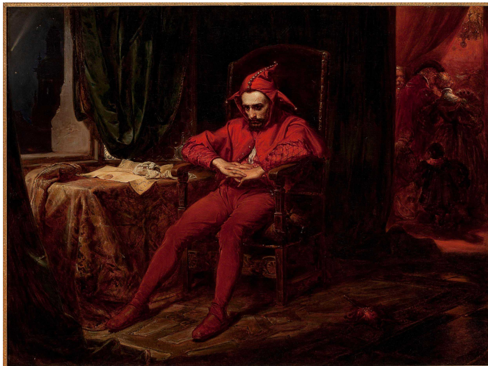
Stańczyk , 1862 Jan Matejko

nouveau. Ce Triboulet-là se métamorphosa encore en Rigoletto dans les mains de Verdi qui en sublima la souffrance dans un opéra populaire en 1851.