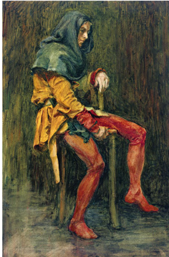
Touchstone, the jester John William Waterhouse

traduction de Jean-Michel Déprats, on peut lire : « Pierre de Touche, LE BOUFFON de la Cour » 50 . Le mot “clown” n’a pas été traduit. Il est absorbé par l’idée du bouffon. Est-ce une impasse de la traduction qui échoue à franciser l’idée de clown et qui se refuse à utiliser un anglicisme qui ne recouperait pas la même réalité parce qu’il créerait un anachronisme ? Ou est-ce un phagocytage du concept du français “bouffon” qui résorbe la différence sémantique entre le clown et le jester ? Cette dernière hypothèse se confirme dans le reste de la traduction de cette édition bilingue puisque la désignation de l’anglais CLOWN est systématiquement traduite par le français LE BOUFFON. C’est exactement la même chose dans La Nuit des rois . La liste initiale du personnel dramatique présente Feste ainsi : “Feste, CLOWN, jester to