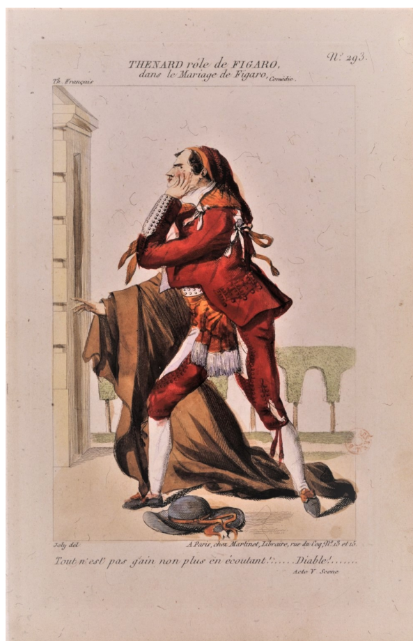
Le Mariage de Figaro costume de Thénard (Figaro), dessiné par Joly

ironique, de l'épigramme soigneusement mouchetée. Mais, surtout, le fol « classique » a définitivement perdu son caractère oppositionnel. S'il conserve encore sa faculté critique, il ne l'exerce plus qu'à l'encontre de travers individuels. Sa présence auprès du roi ne remet plus en cause l'ordre du monde ; il n'est plus sa doublure dérisoire, sa vivante caricature, sa puissante image négative. Le monarque absolu peut désormais régner sans entrave : le Grand Perturbateur est bel et bien mort 14 .