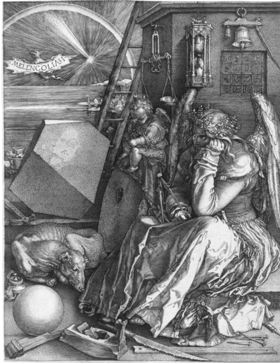
Melancholia , 1514 Albrecht Dürer, Metropolitan Museum of Art, New York

les coups. À bout, il prend la même décision que Don Juan :