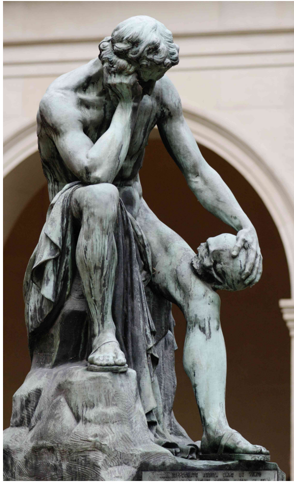
Démocrite méditant sur le siège de l'âme, 1868 Léon-Alexandre Delhomme, Jardin du Musée des Beaux-Arts de Lyon

Sénat abdéritain. Dans ce livre réédité dans une traduction d'Yves Hersant sous le titre Sur le rire et la folie en 1989, Hippocrate est sommé de venir en urgence pour soigner un philosophe qui a perdu la raison. Le patient s'appelle Démocrite.