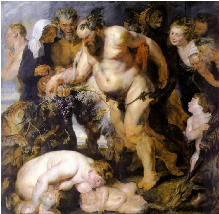
Silène ivre , Pierre Paul Rubens, 1616-1617

Il disserte sur le sujet dans ses Adages et explique que l'expression s'emploie pour une chose à première vue sans valeur et risible, mais admirable si on la considère plus profondément et de plus près :