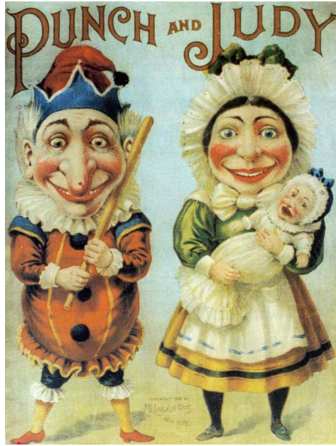
Affiche de Punch &amp; Judy

bouffon vient de ce qu'il doit, pour exister, être populaire. Or la popularité exige qu'il rappelle quelques traits de caractère des habitants. La question de la popularité est d'ailleurs centrale quand il s'agit de bouffons. L'insistance est déjà présente dans le jugement de Boileau. C'est au XVII e siècle donc que le transfert du bouffon de la cour aux tréteaux publics devient une caractéristique bientôt indissociable de l'idée même du bouffon.