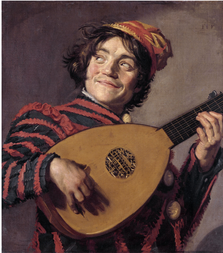
Le joueur de luth, 1623 Franz Hals

physique que mental. C'est cette matière qui inspirera à Michel de Ghelderode sa pièce L'École des bouffons en 1942.