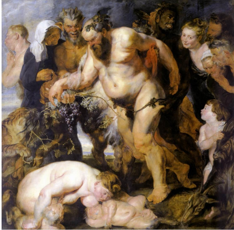
Silène ivre , Pierre Paul Rubens, 1616-1617

Il disserte sur le sujet dans ses Adages et explique que l'expression s'emploie pour une chose à première vue sans valeur et risible, mais admirable si on la considère plus profondément et de plus près :