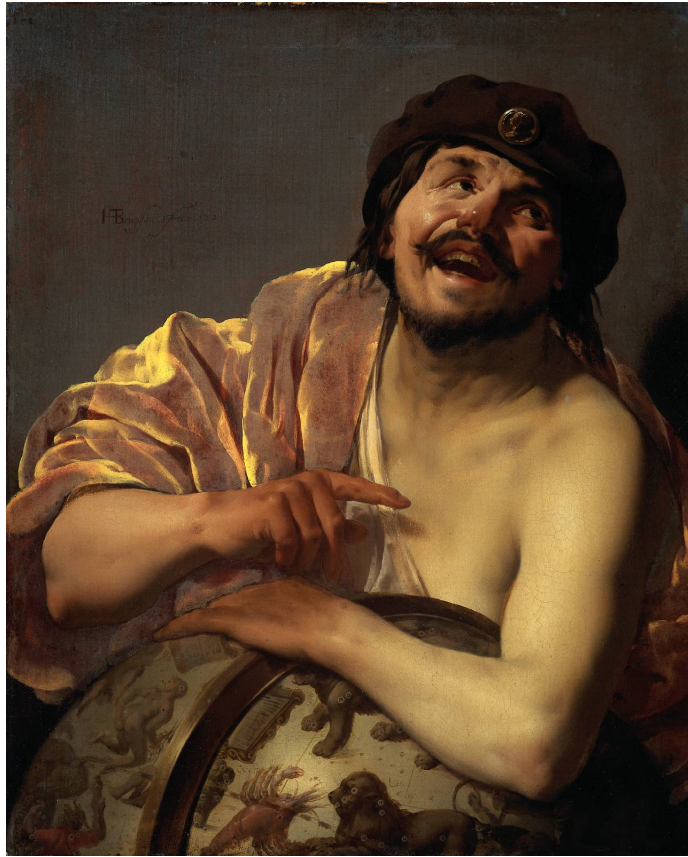
Democritus , Hendrick ter Brugghen, 1628

une maison à roulettes, qui eût facilité les déménagements en cas de méchant voisin. Indigné de tant de dénigrement, Zeus chassa Mômôs de l'Olympe.