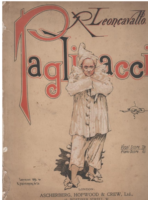
Pagliacci , 1892 couverture de l'arrangement pour piano

qu'au moment où ils cessèrent d'être comiques, alors même que ce critère était resté le seul encore inaltéré 35 . Peut-être aurions-nous dû plutôt parler de transmutation tant la nature profonde du bouffon s'est renversée. Ironie là encore quand on se rappelle que le fou est une figure privilégiée des renversements.