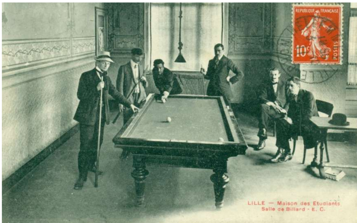
Illustration VIII: La Maison des étudiants à Lille avant-guerre.