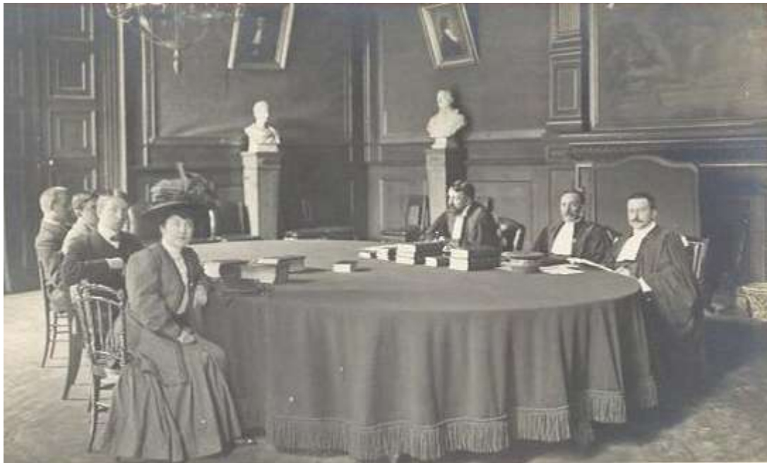
Illustration VII: Un examen à la Faculté de droit de Paris en présence d'une étudiante.