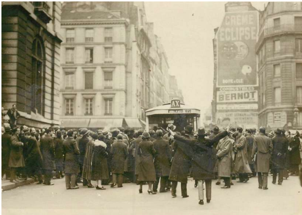
Illustration XIV: Une manifestation d'étudiants en droit (1932).