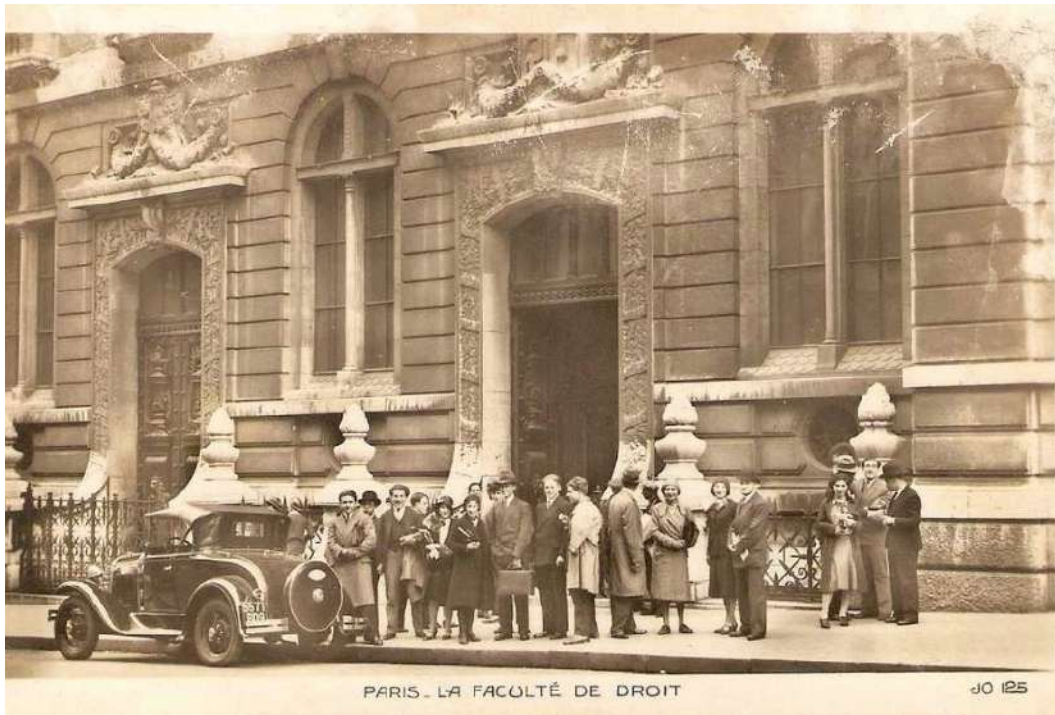
Illustration XIII: La Faculté de droit de Paris dans les années 1920.