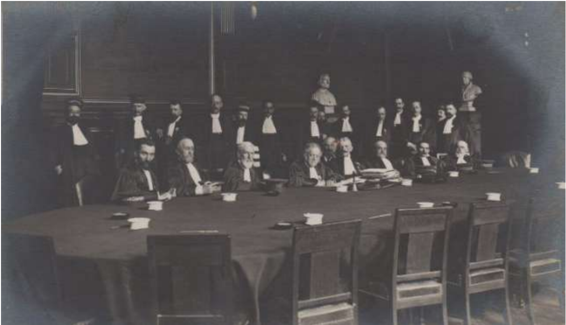
Illustration VI: Une séance du conseil à la Faculté de droit de Paris.