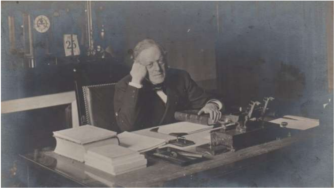
Illustration V: Le doyen parisien Charles Lyon-Caen.