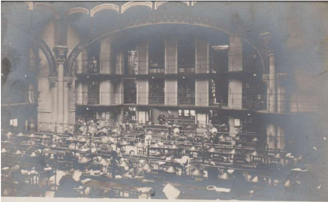
PARIS. — Faculté de Droit, la Bibliothèque, — ND Phot.