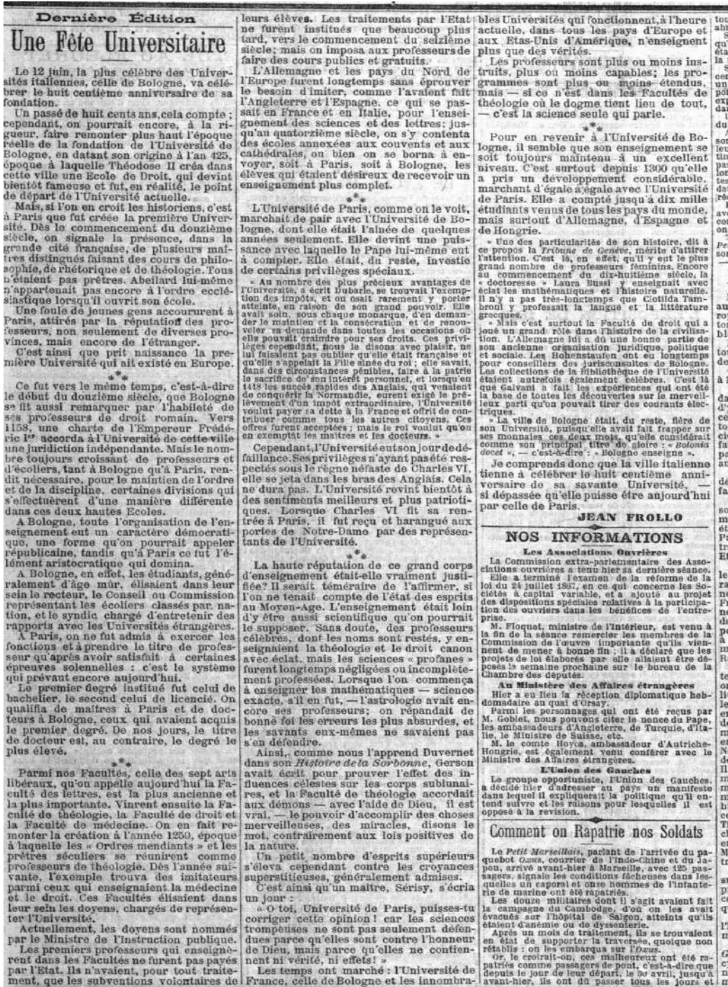
Illustration I: Le Petit Parisien, 1888/06/01, à propos des fêtes de l'Université de Bologne.