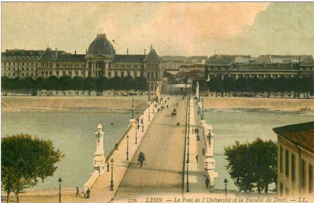
276 LYON — Le Pont de l'Université et la Faculté de Droit.