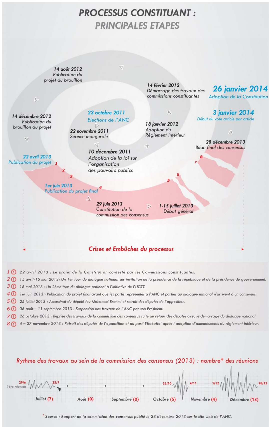
Schéma n°1. Processus constituant : Principales étapes