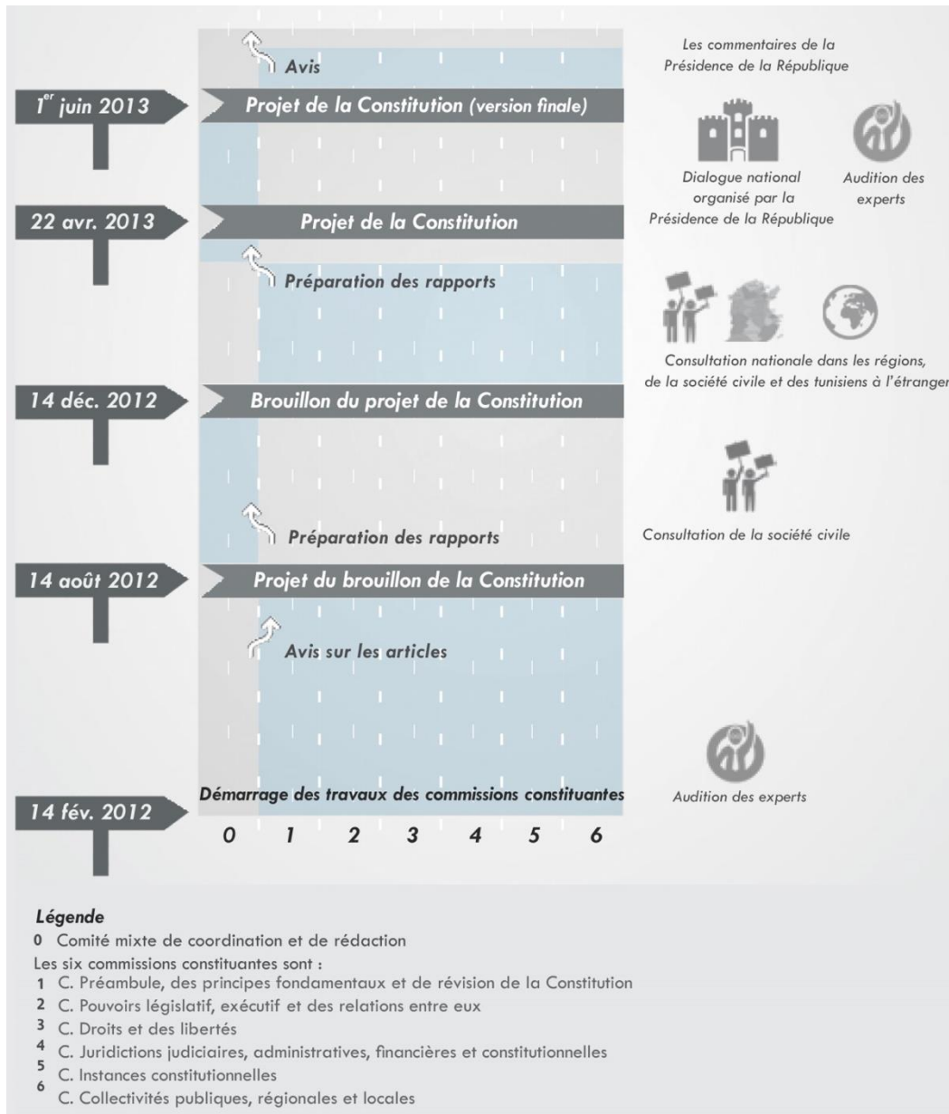
Schéma n°2. Processus constituant : Jusqu'à la publication du projet du 1 er juin 2013

30 juillet 2013 : Reprise du « Dialogue national ». L'UGTT, l'UTICA, la LTDH et l'Ordre des avocats élaborent une feuille de route pour essayer de sortir le pays de la crise 2648 . Assimilés à une tentative de coup d'Etat, Ennahdha et le CPR rejettent la feuille de route, seul Ettakatol l'accepte.