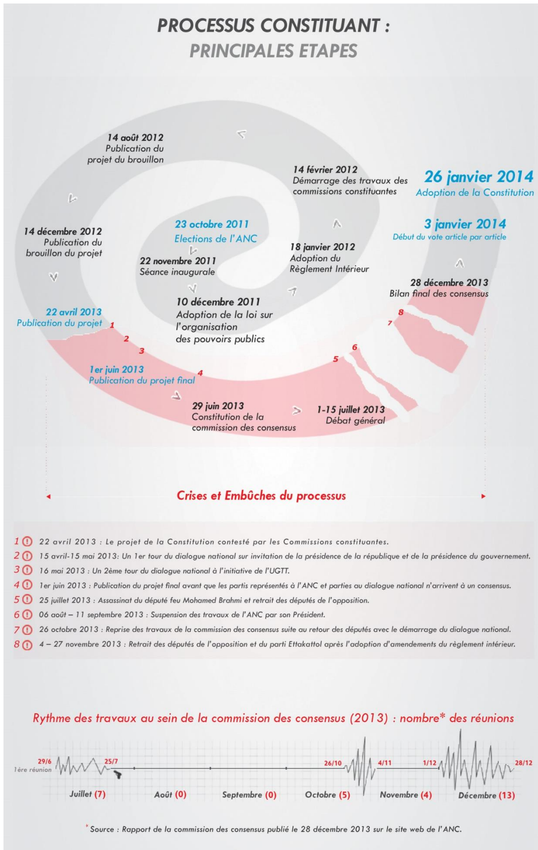
Schéma n°1. Processus constituant : Principales étapes