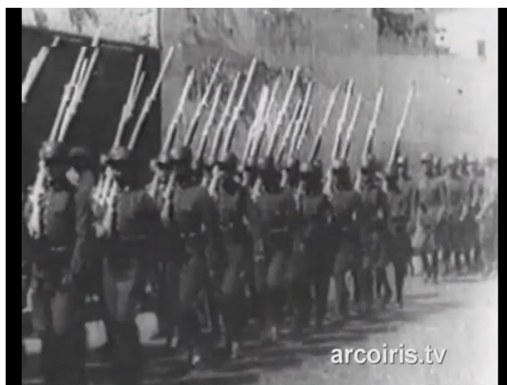
Illustration n° 93 - Promotion de l'union et du patriotisme, photogrammes tirés de Yo también perdí el corazón en Lima (1933)