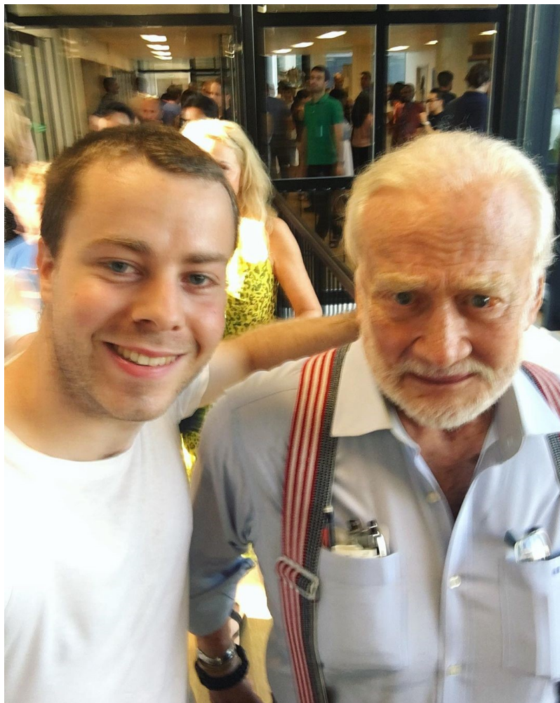
Avec Buzz Aldrin à l'International Space University (ISU), juillet 2019.

Buzz Aldrin, deuxième être humain à avoir marché sur la Lune (Apollo 11, juillet 1969).