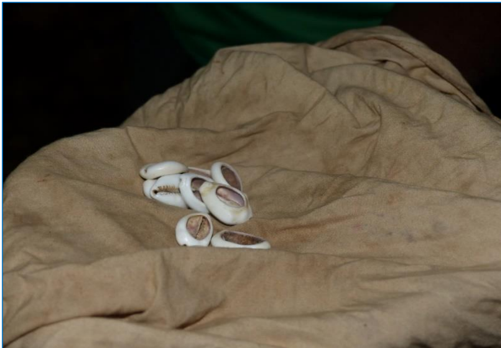
Les cauris, appelés djéké, servant à la divination