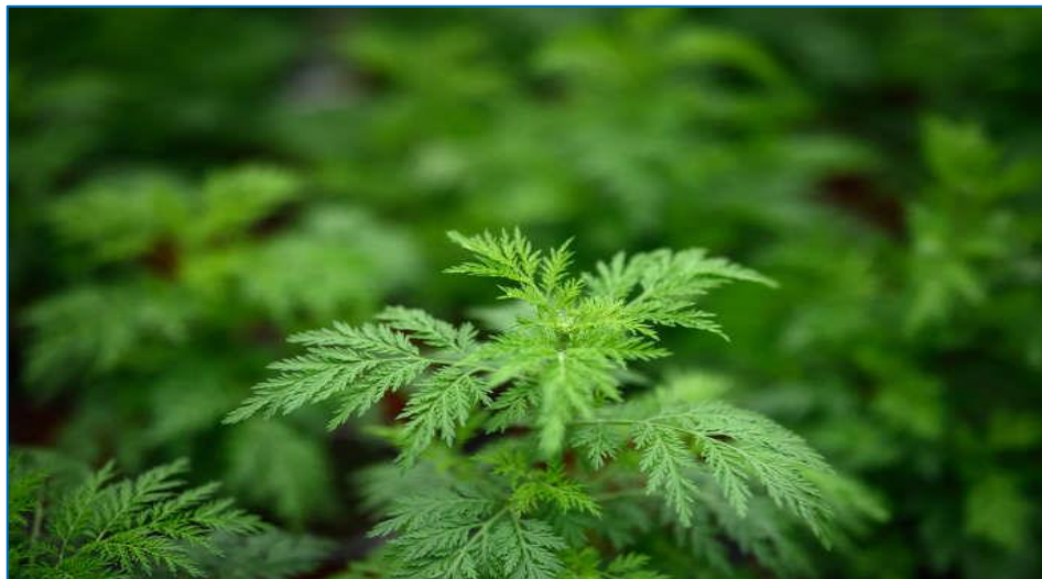
La plante Artemisia utilisée dans le traitement du paludisme.