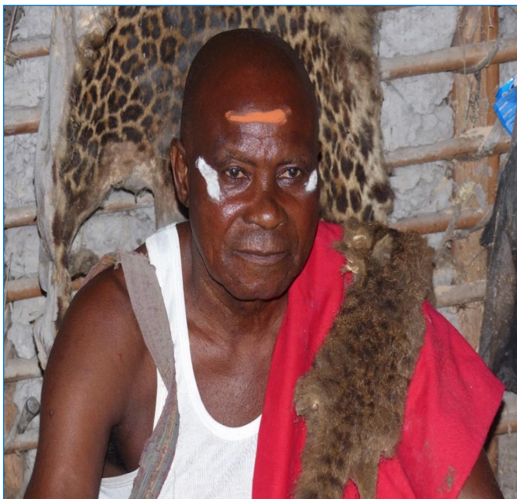
Le regard fixe du ngang pour la photo (Photo : été 2017)