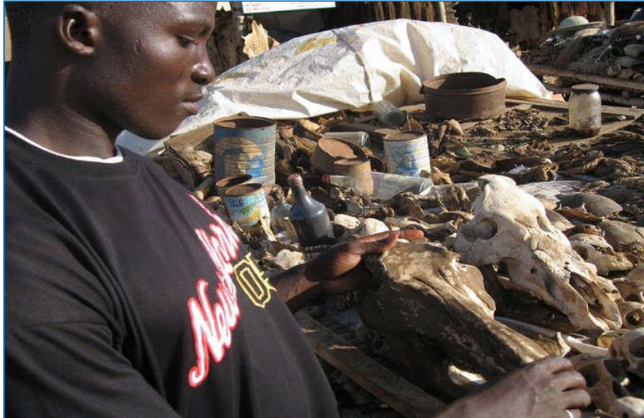
Un jeune homme tenant le crâne d'un animal devant des matières animales et végétales dans un marché en Côte d'Ivoire. Image du journal Le Monde.