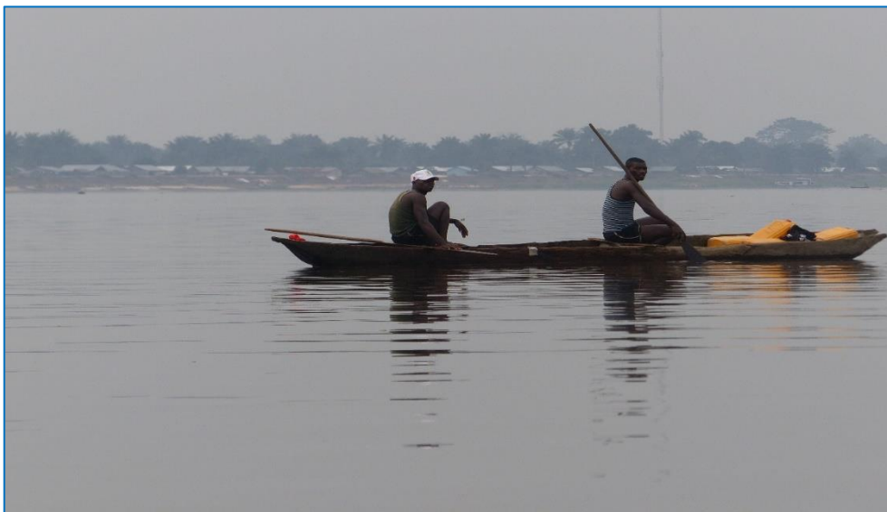
Mossaka, ville des pêcheurs (Photo : été 2017).