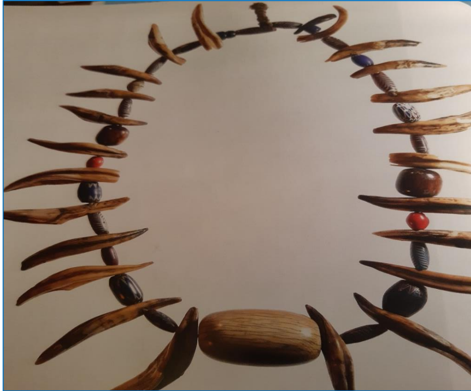
Collier d'un dignitaire