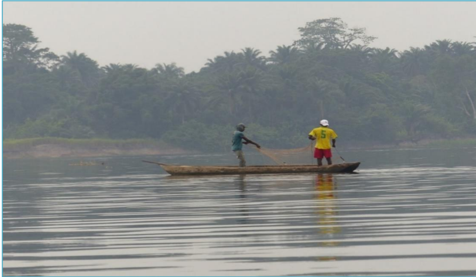
La pêche au filet sur le fleuve Congo en amont de Mossaka