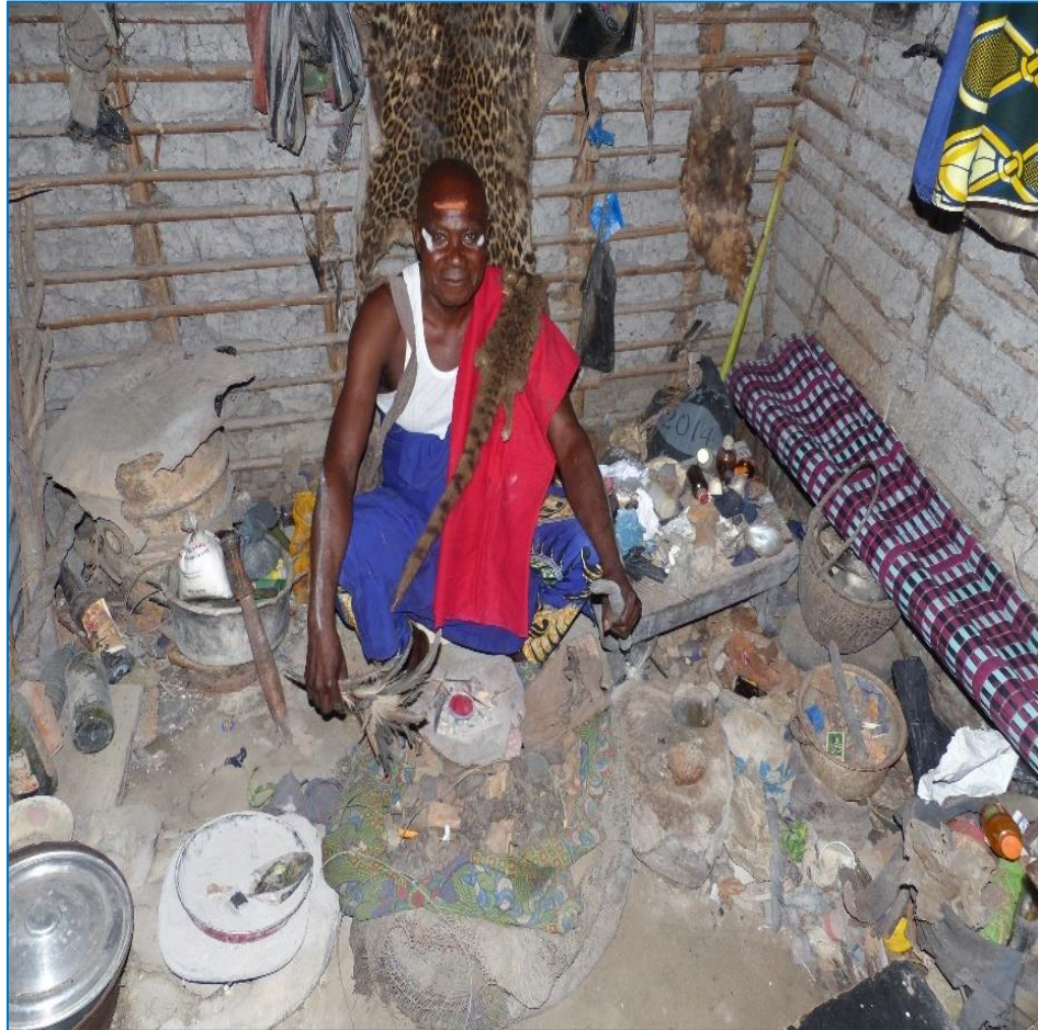
Le nganga assis entouré de son Mokossa (Objets divinatoires).