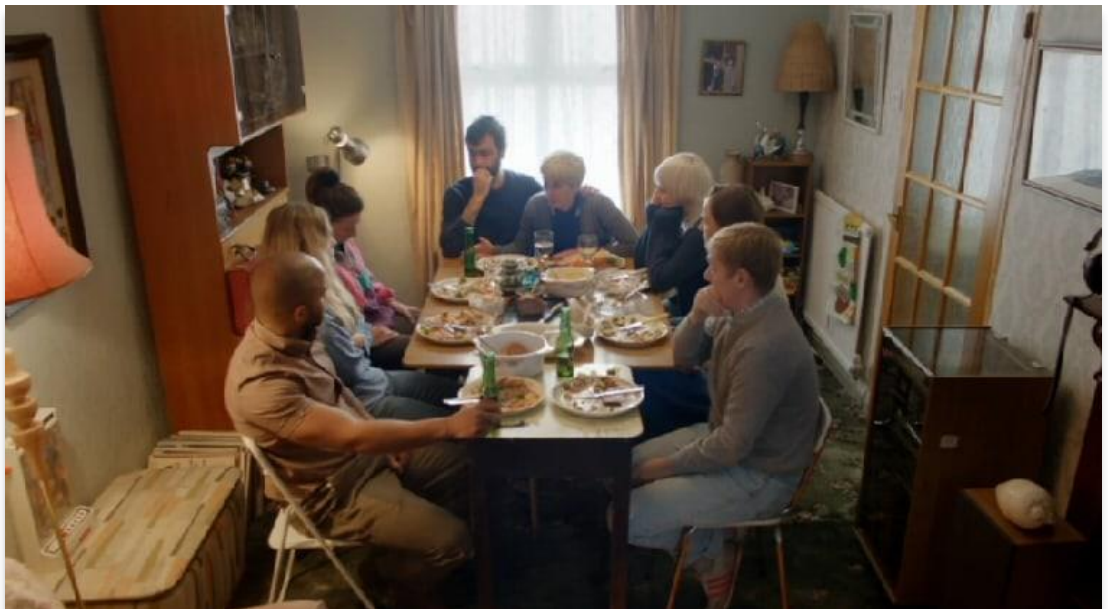
Le groupe à la table du repas, This Is England '90, (3. 03)