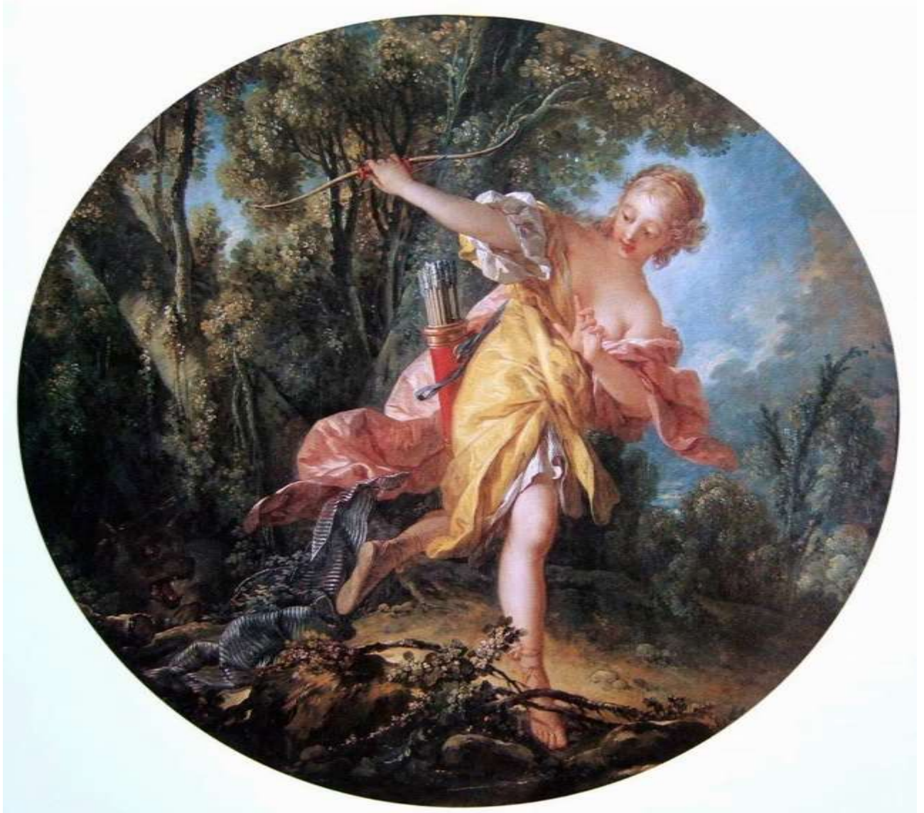
Planche 22 : F. Boucher, Sylvie fuyant le loup blessé , huile sur toile, 122,5 X 134 cm, signé et daté, 1756, Tours, musée des Beaux-Arts.