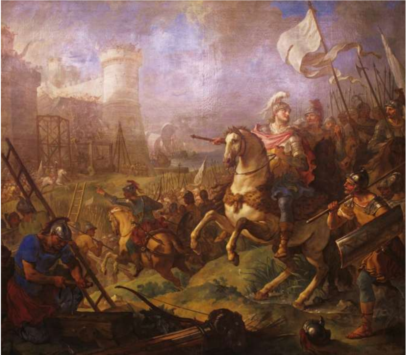
Planche 5 : C.-J. Natoire, Le Siège de Bordeaux , huile sur toile, 266 X 300 cm, signé et daté, 1737, Troyes, musées d'Art et d'Histoire.