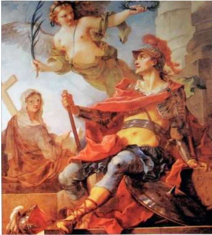
Planche 1 : C.-J. Natoire, Clovis, couronné par la Victoire, fait fleurir la Religion , huile sur toile, 140 X 128 cm, signé et daté, 1736, Troyes, musées d'Art et d'Histoire.