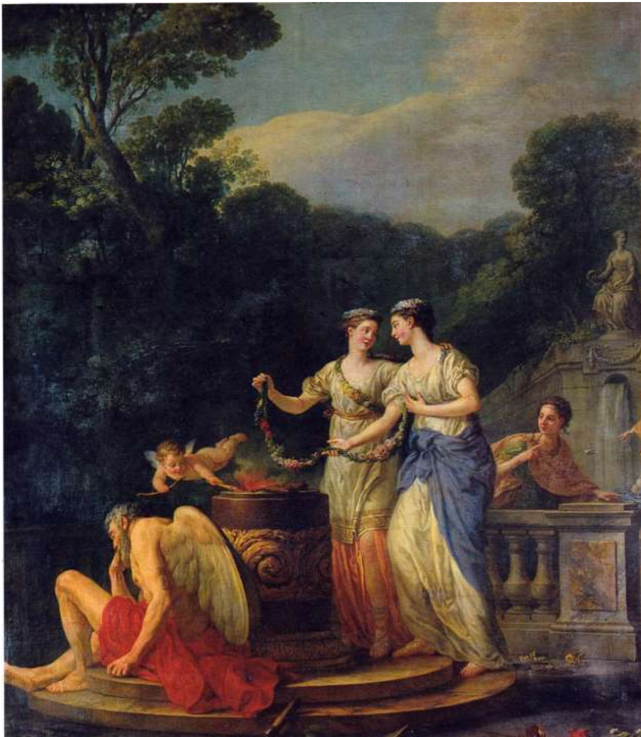
Planche 38 : J.-M. Vien, Deux jeunes grecques faisant serment de ne jamais aimer ou Le Serment de l'Amitié , huile sur toile, 270 (320) X 230 cm, v. 1773, non signé, Chambéry, Préfecture.