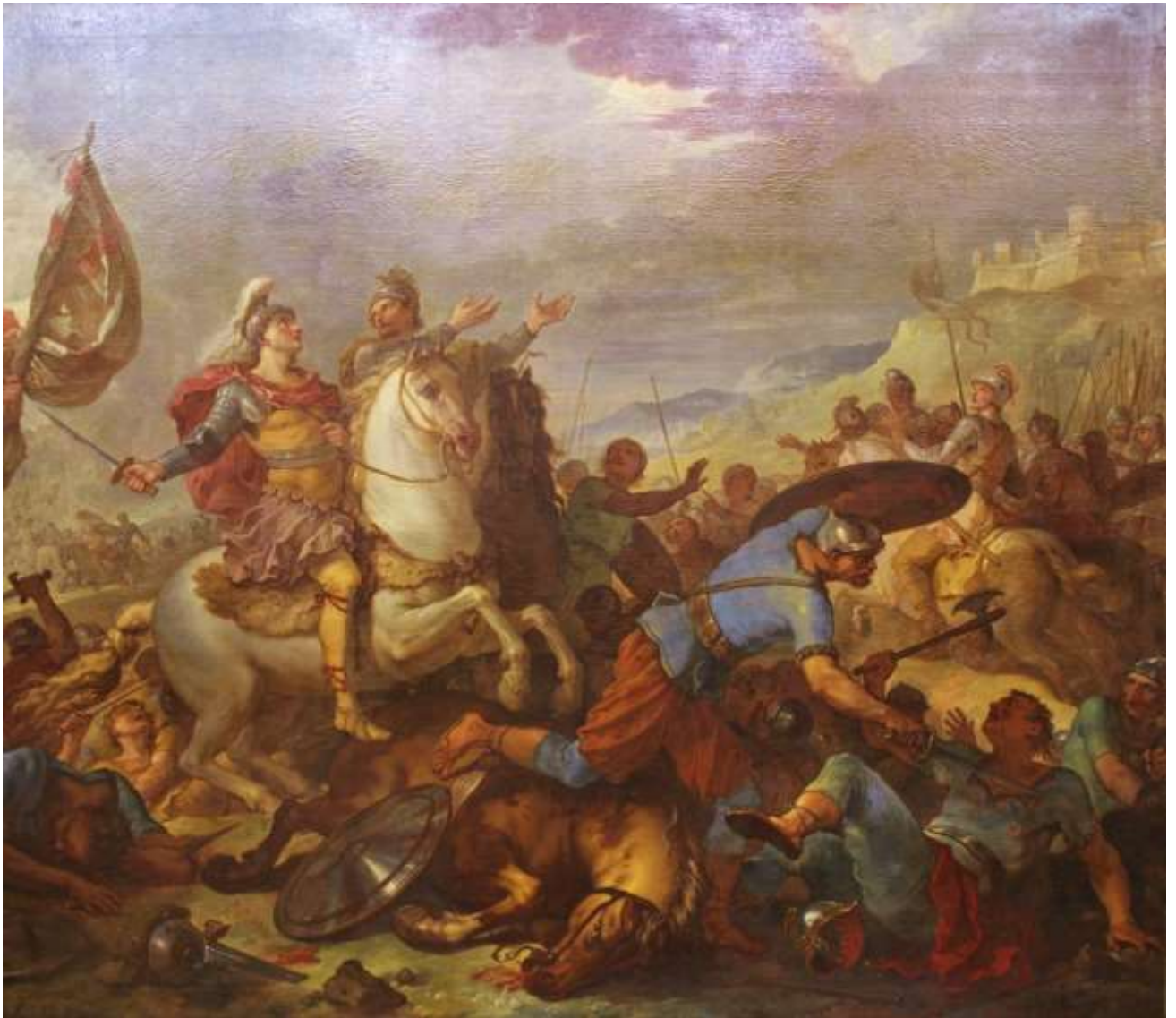
Planche 3 : C.-J. Natoire, La Bataille de Tolbiac , huile sur toile, 266 X 300 cm, signé et daté, 1735, Troyes, musées d'Art et d'Histoire.