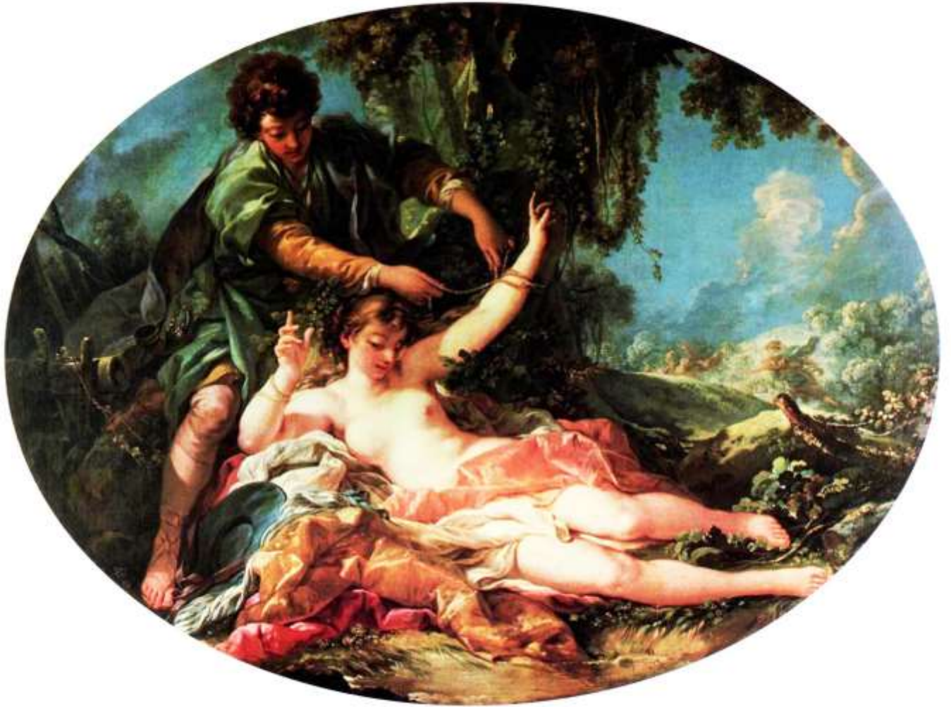
Planche 21 : F. Boucher, Sylvie délivrée par Aminte , huile sur toile, 120 X 136 cm, 1755, Paris, Banque de France.