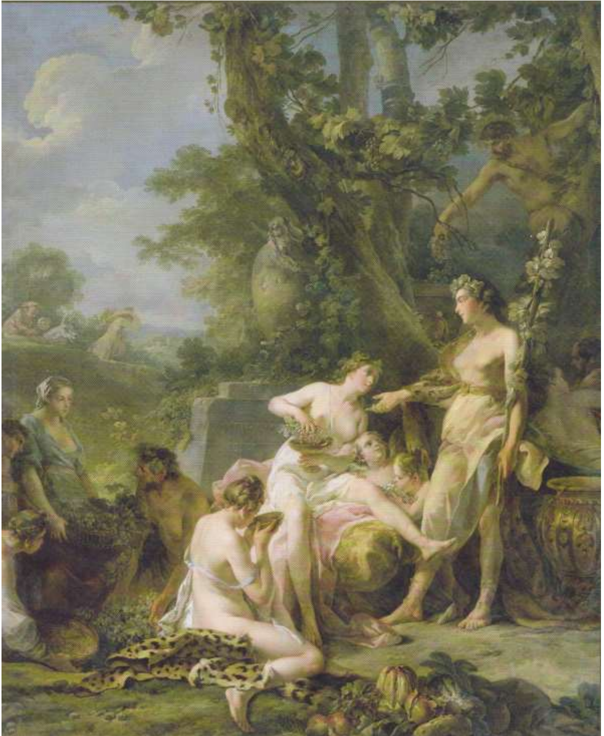
Planche 32 : J.-B. M. Pierre, La Vendange ou Bacchus au milieu de sa cour , huile sur toile, 300 X 238 cm, 1768-1773, Versailles, musée national des châteaux de Versailles et de Trianon.