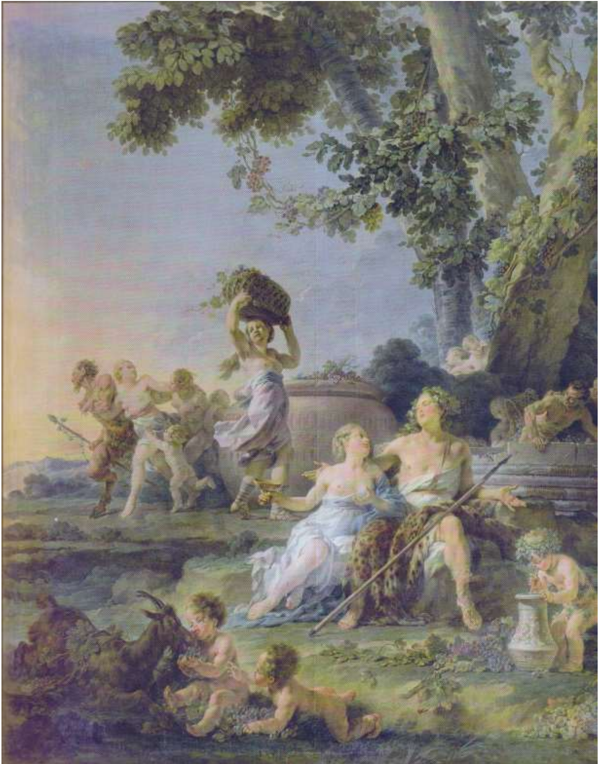
Planche 31 : N. Hallé, La Vendange ou Le Triomphe de Bacchus , huile sur toile, 277 X 255 cm, signé et daté, 1776, Versailles, musée national des châteaux de Versailles et de Trianon, Petit Trianon, salle à manger.