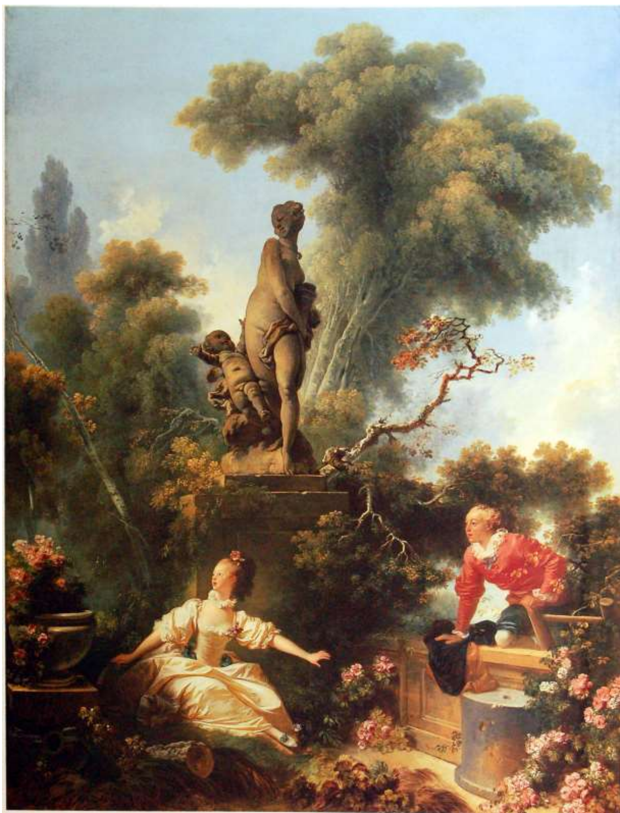
Planche 35 : J.-H. Fragonard, Le Rendez-vous , huile sur toile, 317,5 X 215,5 cm, 1771-1772, signé, New-York, collection Frick.