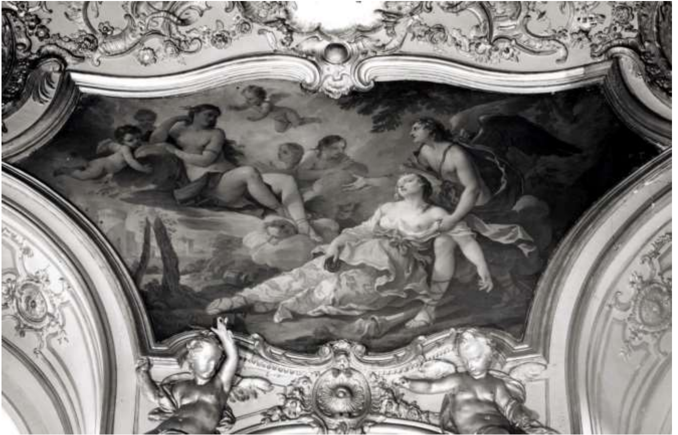
Planche 18 : C.-J. Natoire, Psyché s'évanouissant et l'Amour demandant à Vénus de sauver sa vie , huile sur toile, 180 X 266 cm, 1737-1739, Paris, musée de l'Histoire de France, Archives nationales.