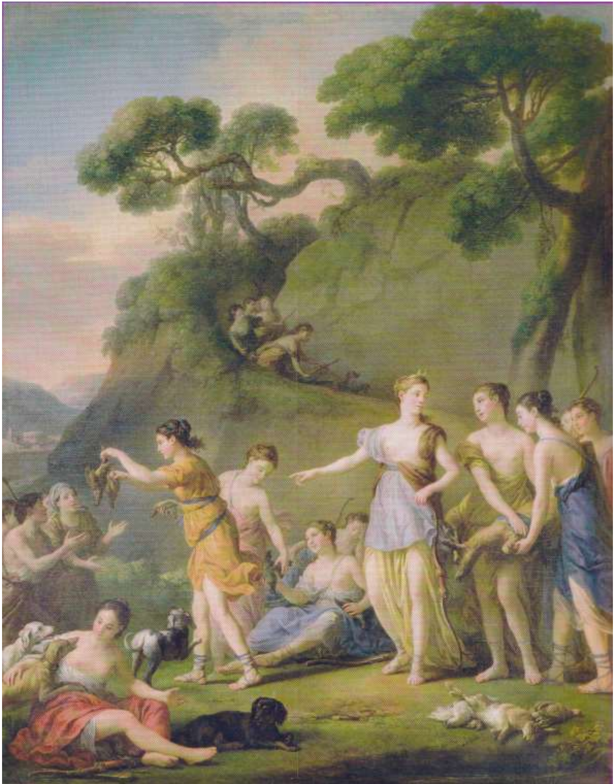
Planche 33 : J.-M. Veytaux, La Chasse ou Diane ordonnant de distribuer le gibier aux bergers des environs , huile sur toile, 329 X 231 cm, signé et daté, 1772, Versailles, musée national des châteaux de Versailles et de Trianon, Petit Trianon, salle à manger.