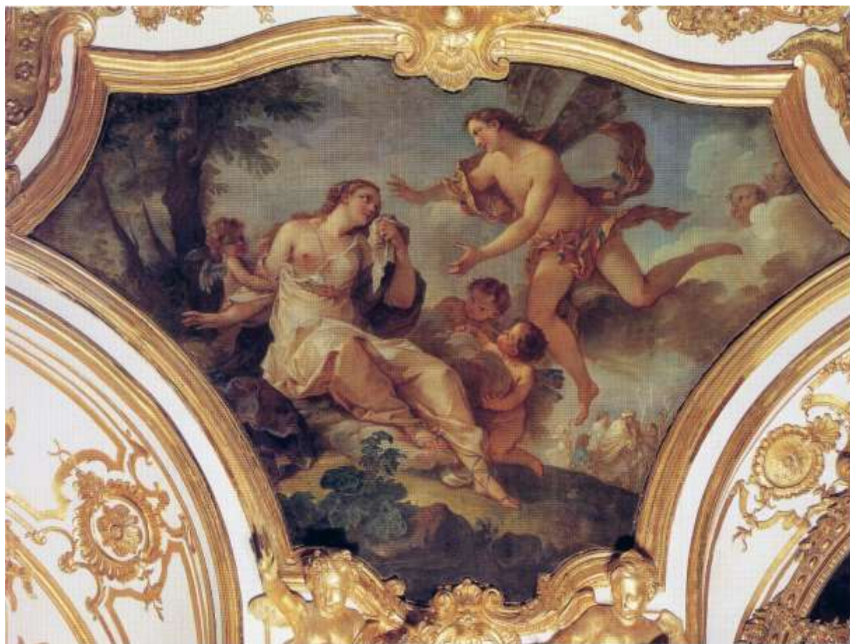
Planche 12 : C.-J. Natoire, Psyché recueillie par Zéphyr , huile sur toile, 180 X 266 cm, 1739, Paris, musée de l'Histoire de France, Archives nationales.