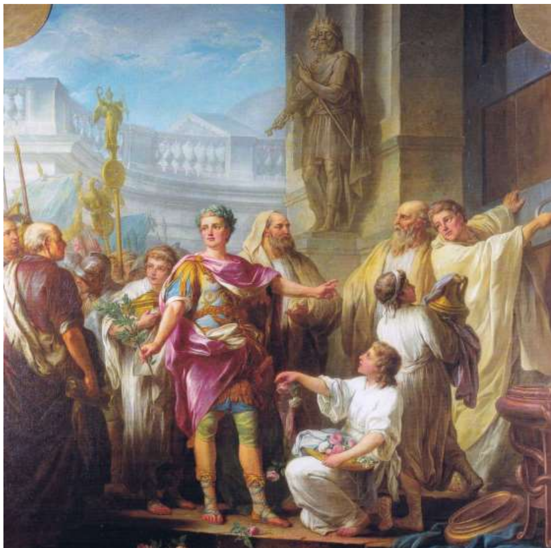
Planche 24 : C. Vanloo, Auguste fait fermer la porte du temple de Janus , huile sur toile, 299 X 244 cm, 1765, Amiens, musée de Picardie.