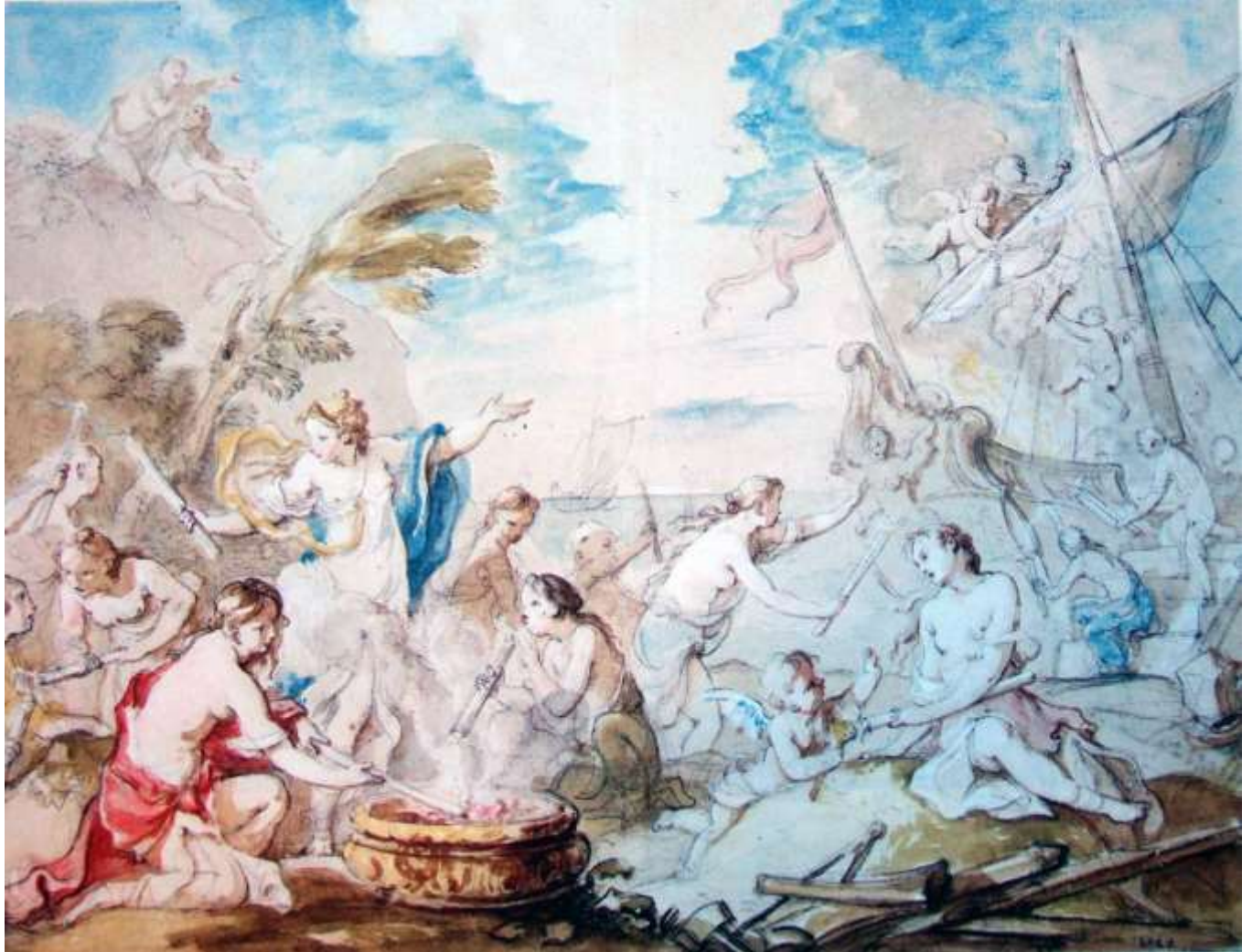
Planche 11 : C.-J. Natoire, Le Vaisseau de Télémaque brûlé par les nymphes , mine de plomb, aquarelle et gouache, 31 X 39,7 cm, Stockholm, Nationalmuseum.