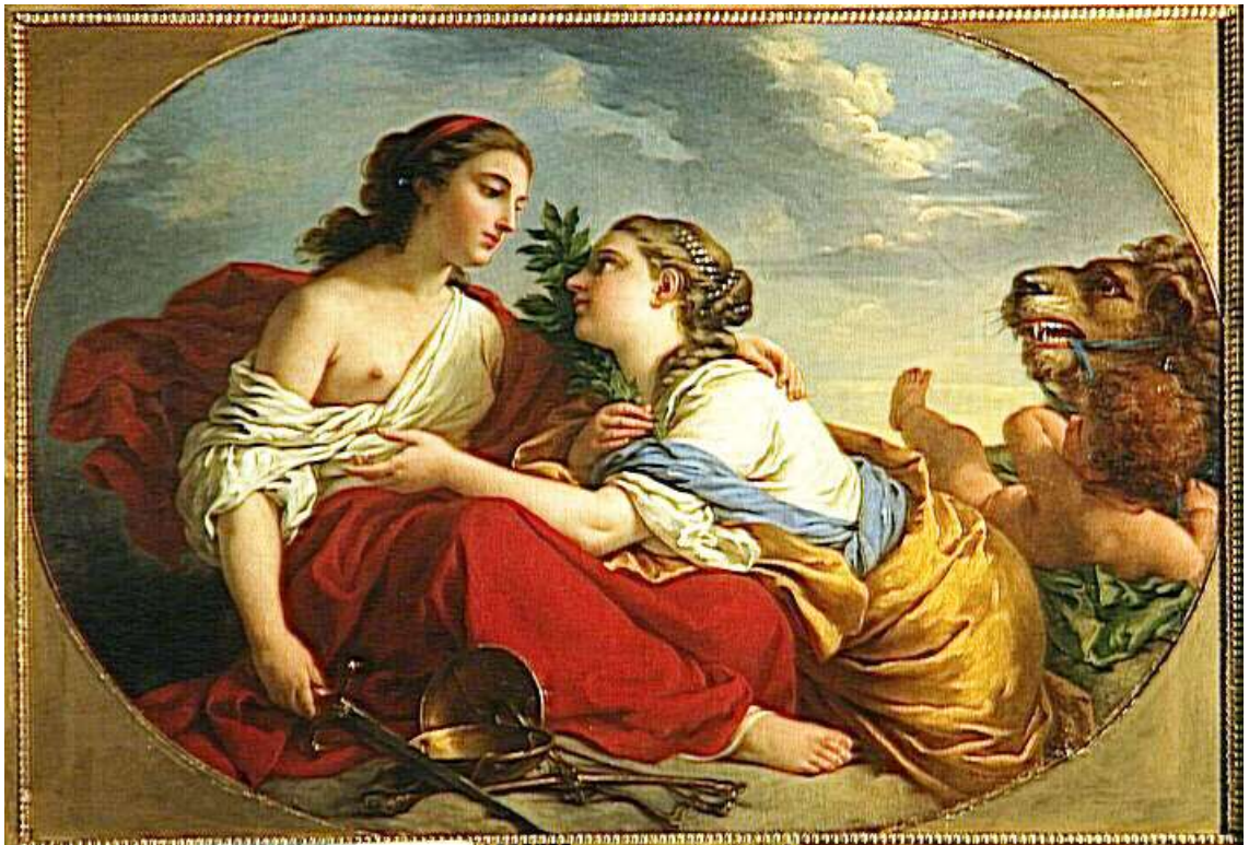
Planche 28 : L.-J.-F. Lagrenée, La Clémence et la Justice , huile sur toile, 106 X 156 cm, signé et daté, 1765, Fontainebleau, musée national du château de Fontainebleau.