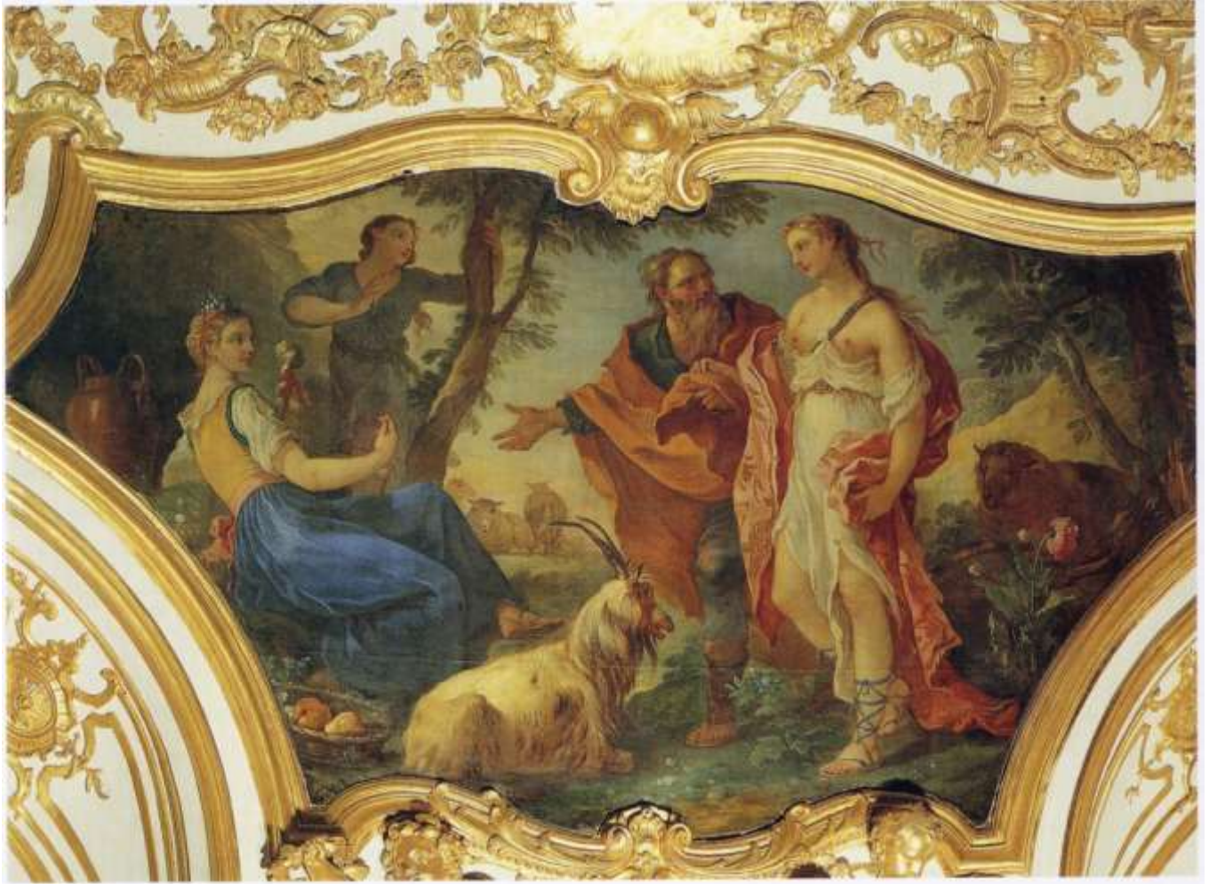
Planche 17 : C.-J. Natoire, Psyché accueillie par les bergers , huile sur toile, 166 X 340 cm, 1737-1739, Paris, musée de l'Histoire de France, Archives nationales.