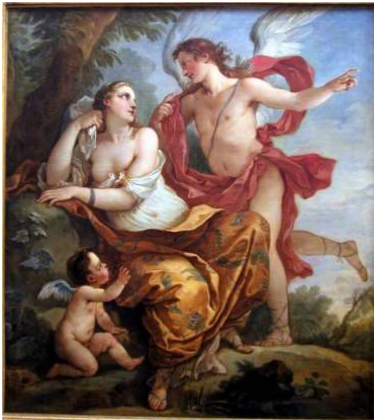
Planche 8 : C.-J. Natoire, Calypso écoutant les conseils de l'Amour , huile sur toile, 140 X 150 cm, Troyes, musées d'Art et d'Histoire.