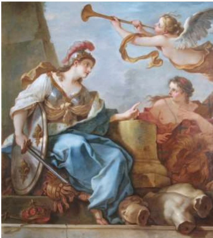
Planche 2 : C.-J. Natoire, Le Repos de la France , huile sur toile, 140 X 128 cm, signé et daté, 1736, Troyes, musées d'Art et d'Histoire.