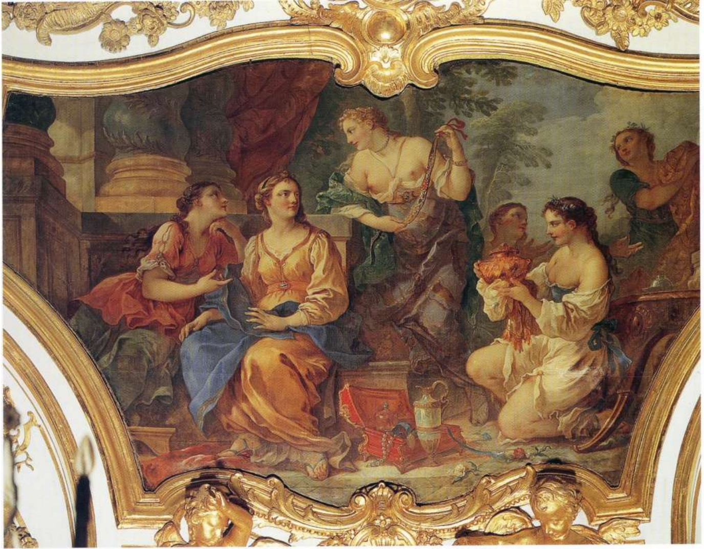
Planche 14 : C.-J. Natoire, Psyché montrant ses trésors à ses sœurs , huile sur toile, 166 X 340 cm, 1738, Paris, musée de l'histoire de France, Archives nationales.