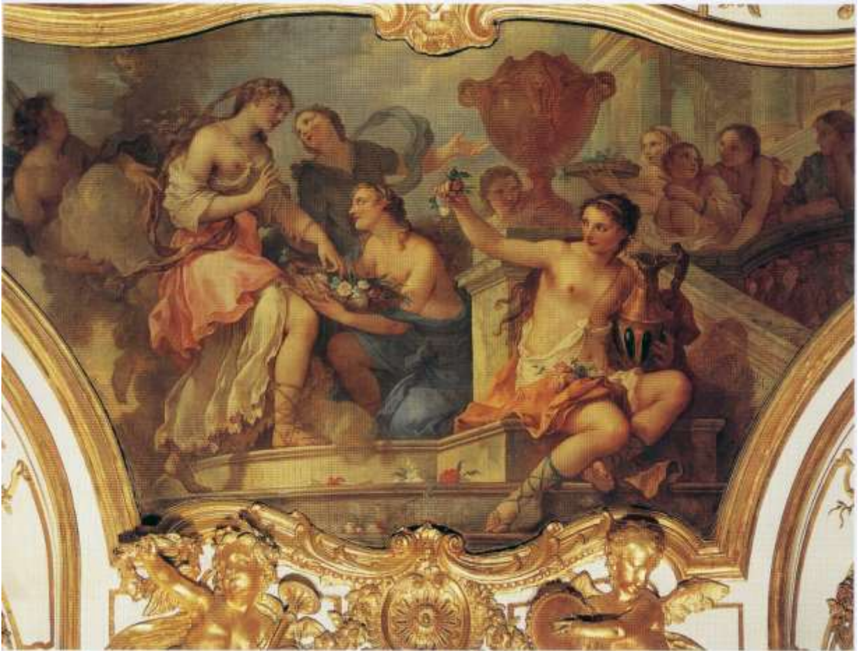
Planche 13 : C.-J. Natoire, Les nymphes offrent des fleurs à Psyché au seuil du palais de l'Amour , huile sur toile, 166 X 340 cm, 1737, Paris, musée de l'Histoire de France, Archives nationales.