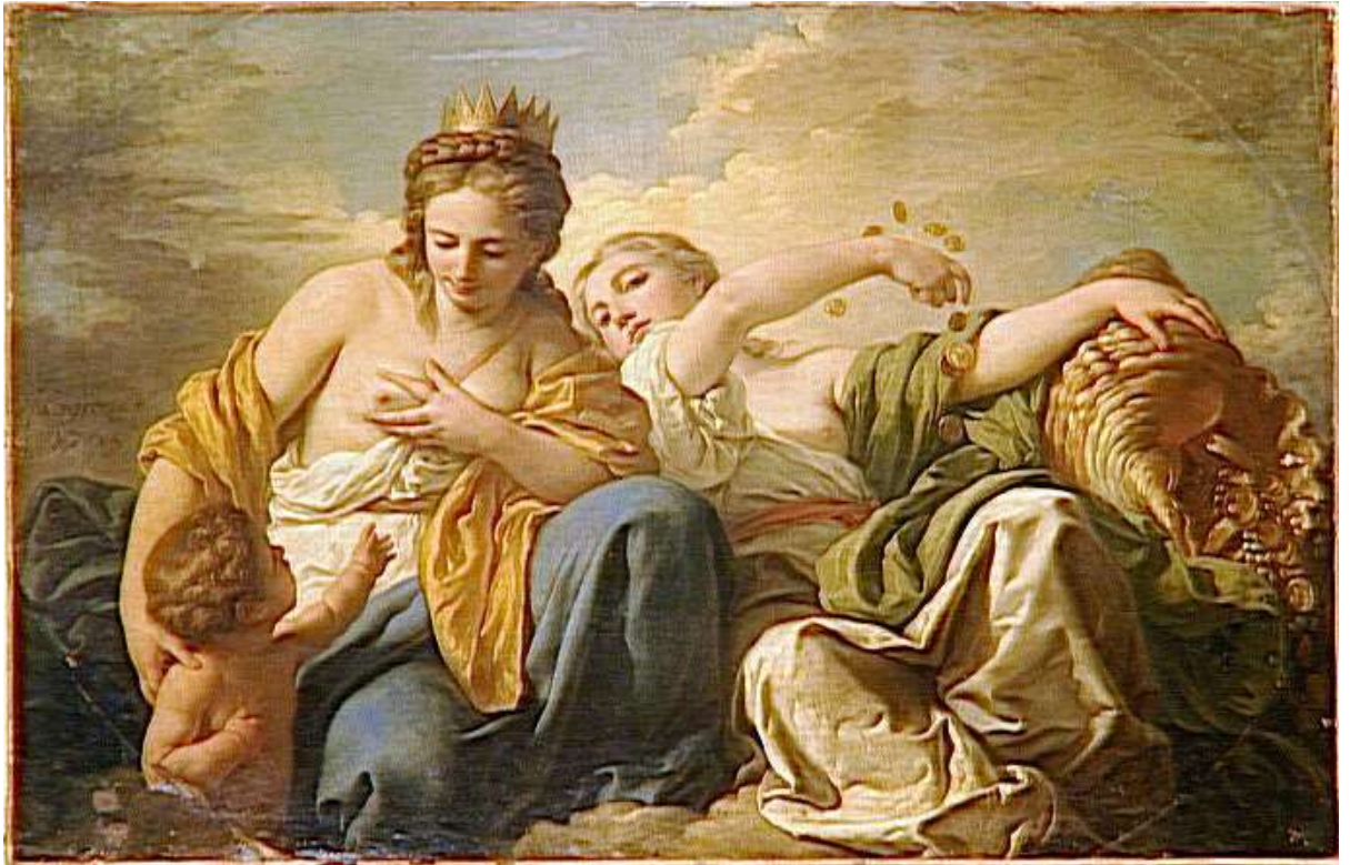
Planche 27 : L.-J.-F. Lagrenée, La Bonté et la Générosité , huile sur toile, 110 X 154 cm, signé et daté, 1765, Fontainebleau, musée national du château de Fontainebleau.