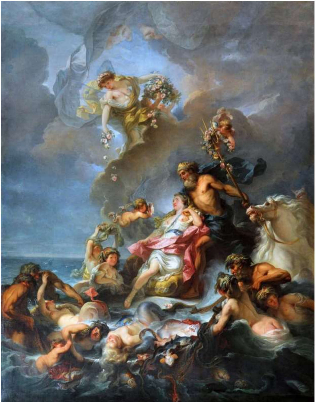
Planche 29 : G. F. Doyen, La Pêche ou Le Triomphe d'Amphitrite , huile sur toile, 277 X 253 cm, v. 1768, Versailles, musée national des châteaux de Versailles et de Trianon, Petit Trianon, salle à manger.