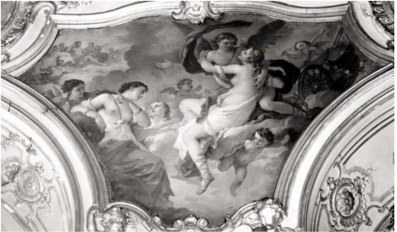
Planche 19 : C.-J. Natoire, Psyché ravie par l'Amour , huile sur toile, 180 X 266 cm, 1737-1739, Paris, musée de l'Histoire de France, Archives nationales.