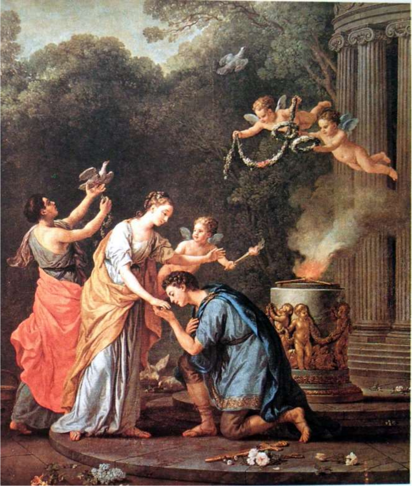
Planche 41 : J.-M. Vien, Deux amants s'unissent à l'autel de l'Hymen ou L'Autel de l'Hymen , huile sur toile, 270 (315) X 230 cm, 1774, signé et daté, Chambéry, Préfecture.