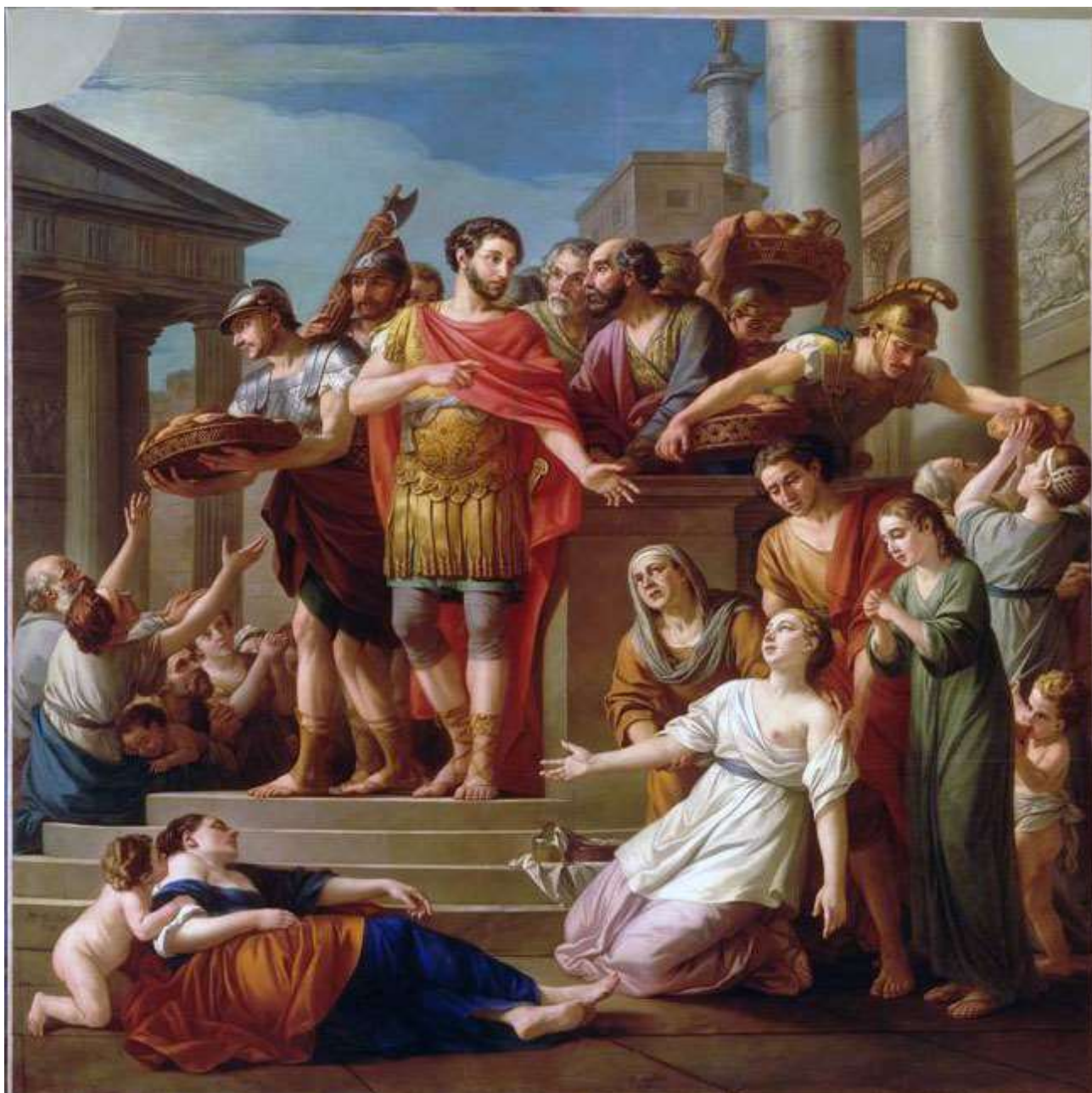
Planche 26 : J.-M. Vien, Marc-Aurèle faisant distribuer au peuple des aliments et des médicaments dans un temps de famine et de peste , toile, 300 X 301 cm, signé et daté, 1765, Amiens, musée de Picardie.