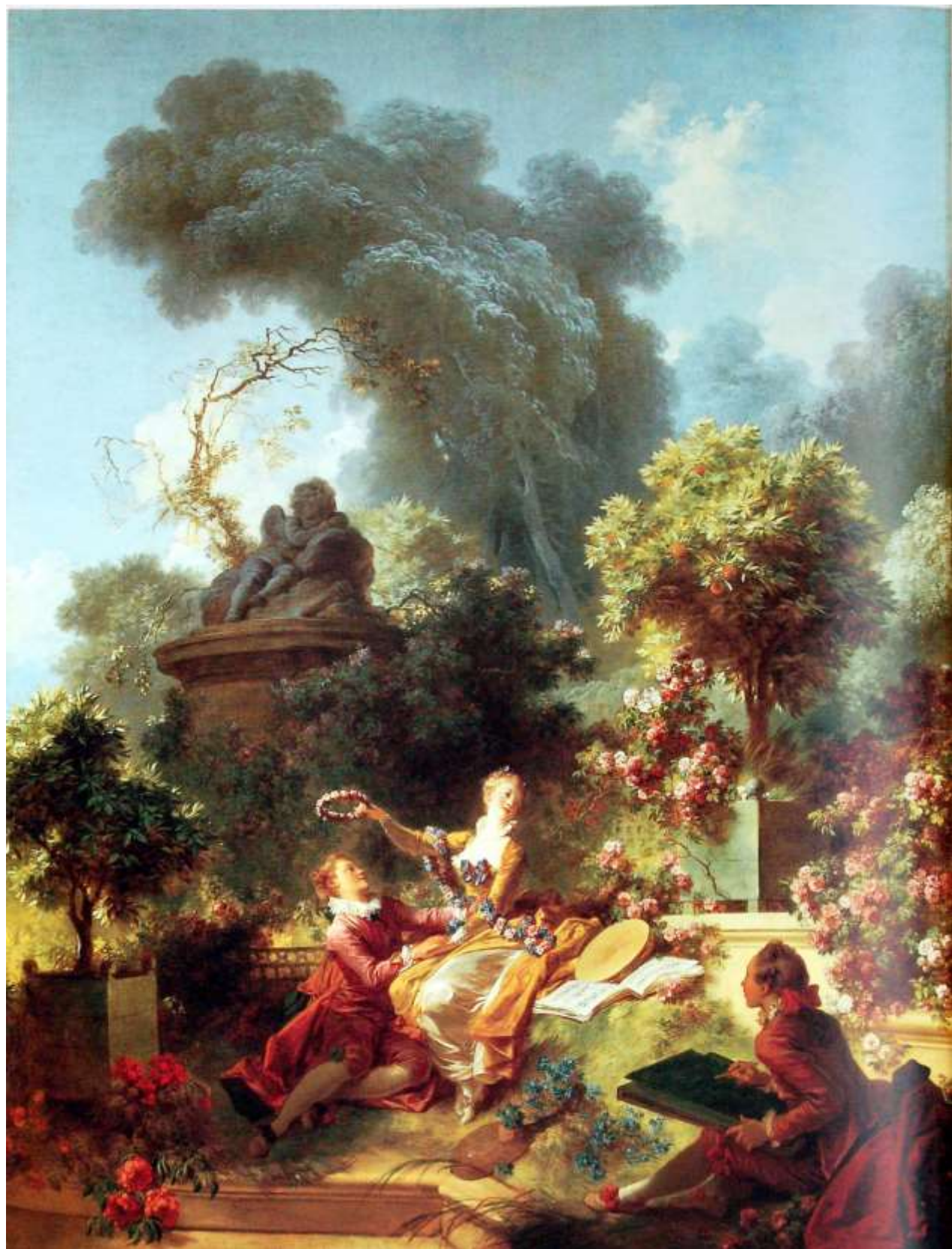
Planche 36 : J.-H. Fragonard, L'Amant couronné , huile sur toile, 318 X 243 cm, 1771-1772, signé, New-York, collection Frick.