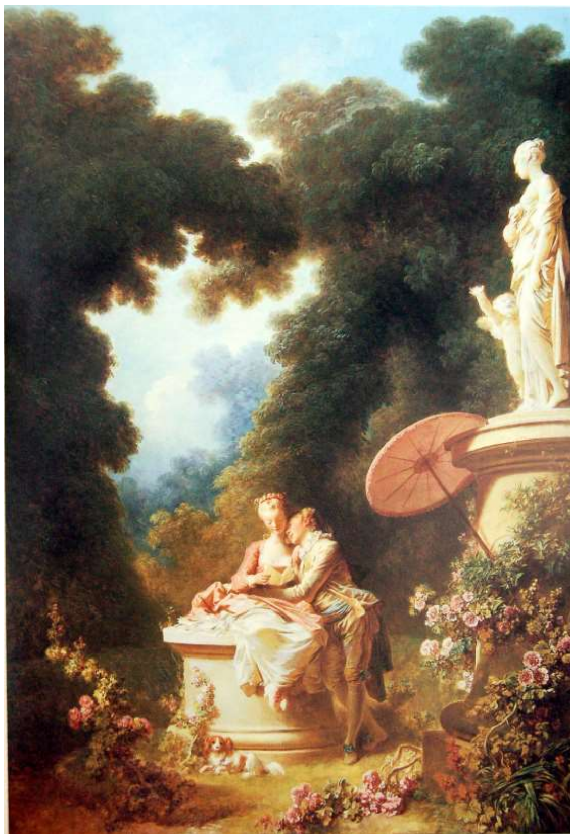
Planche 37 : J.-H. Fragonard, Les Lettres d'amour , huile sur toile, 317 X 217 cm, 1771-1772, signé, New-York, collection Frick.