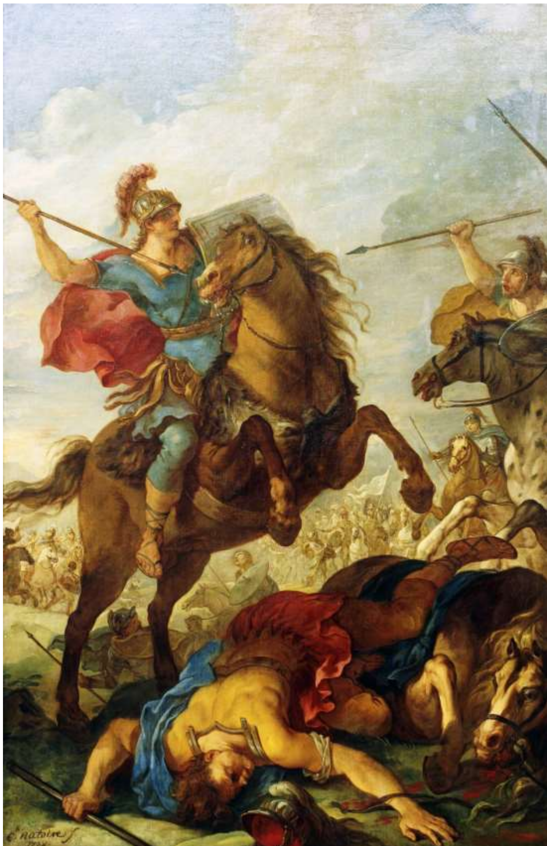
Planche 6 : C.-J. Natoire, La Bataille de Vouillé , huile sur toile, 234 X 154 cm, signé et daté, 1738, Troyes, musées d'Art et d'Histoire.