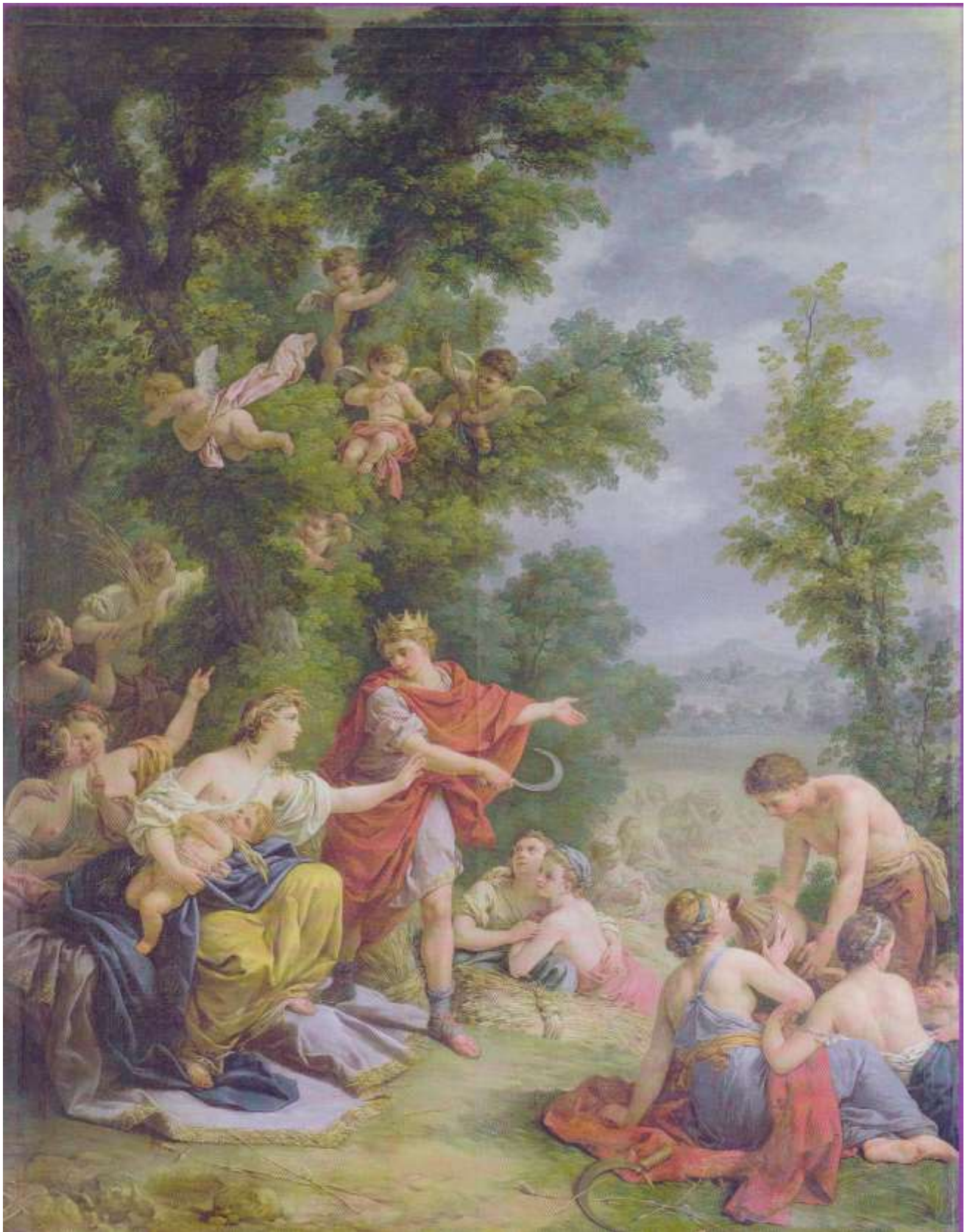
Planche 30 : L.-J.-F. Lagrenée, La Moisson ou Cérès enseignant l'agriculture à Triptolème , huile sur toile, 329 X 224 cm, v. 1770, Versailles, musée national des châteaux de Versailles et de Trianon, Petit Trianon, salle à manger.