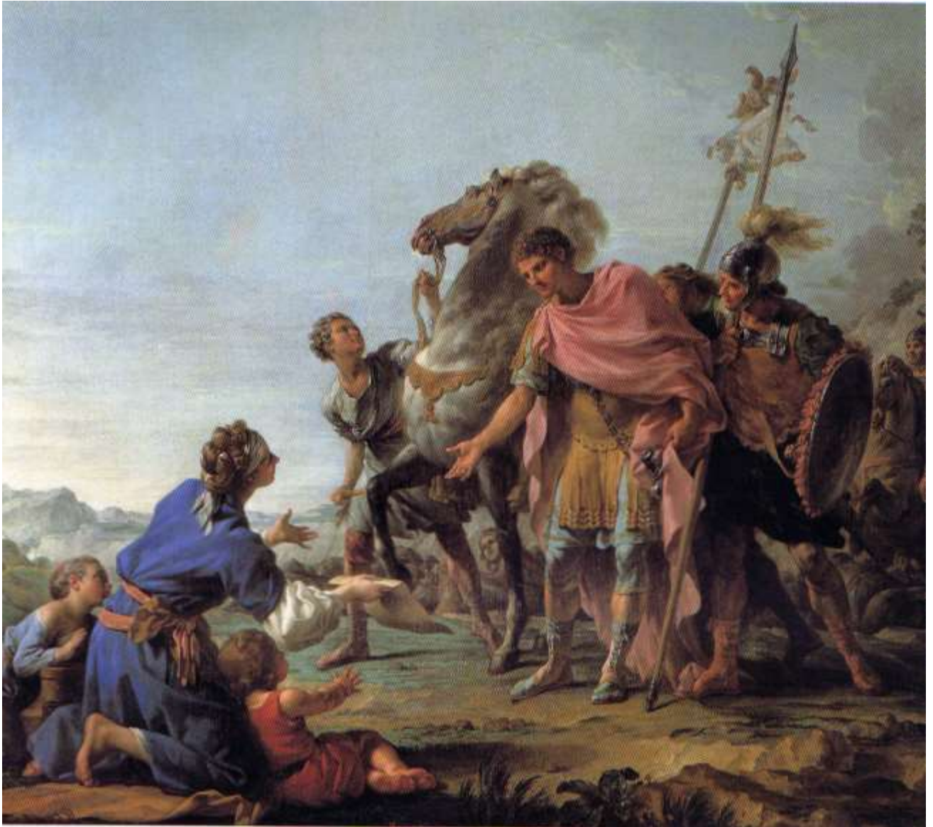
Planche 25 : N. Hallé, Trajan partant pour une expédition très pressée, descend de cheval pour entendre la plainte d'une pauvre femme ou La Clémence de Trajan ou La Justice de Trajan , huile sur toile, 269 X 230 cm, signé et daté, 1765, Marseille, musée des Beaux-Arts.