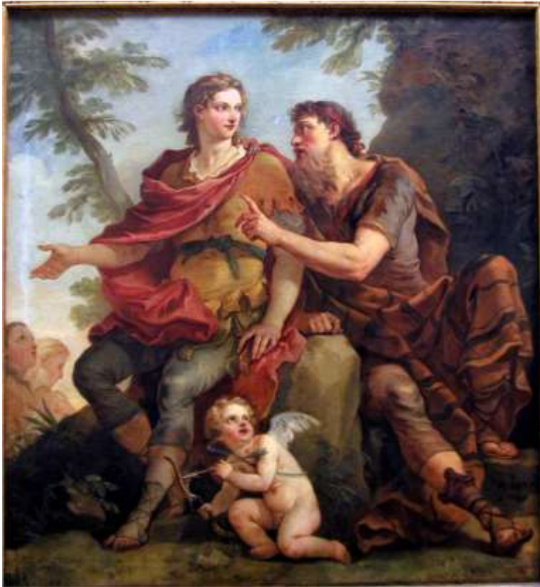
Planche 7 : C.-J. Natoire, Télémaque écoutant les conseils de Mentor , huile sur toile, 140 X 131 cm, signé et daté, 1740, Troyes, musées d'Art et d'Histoire.