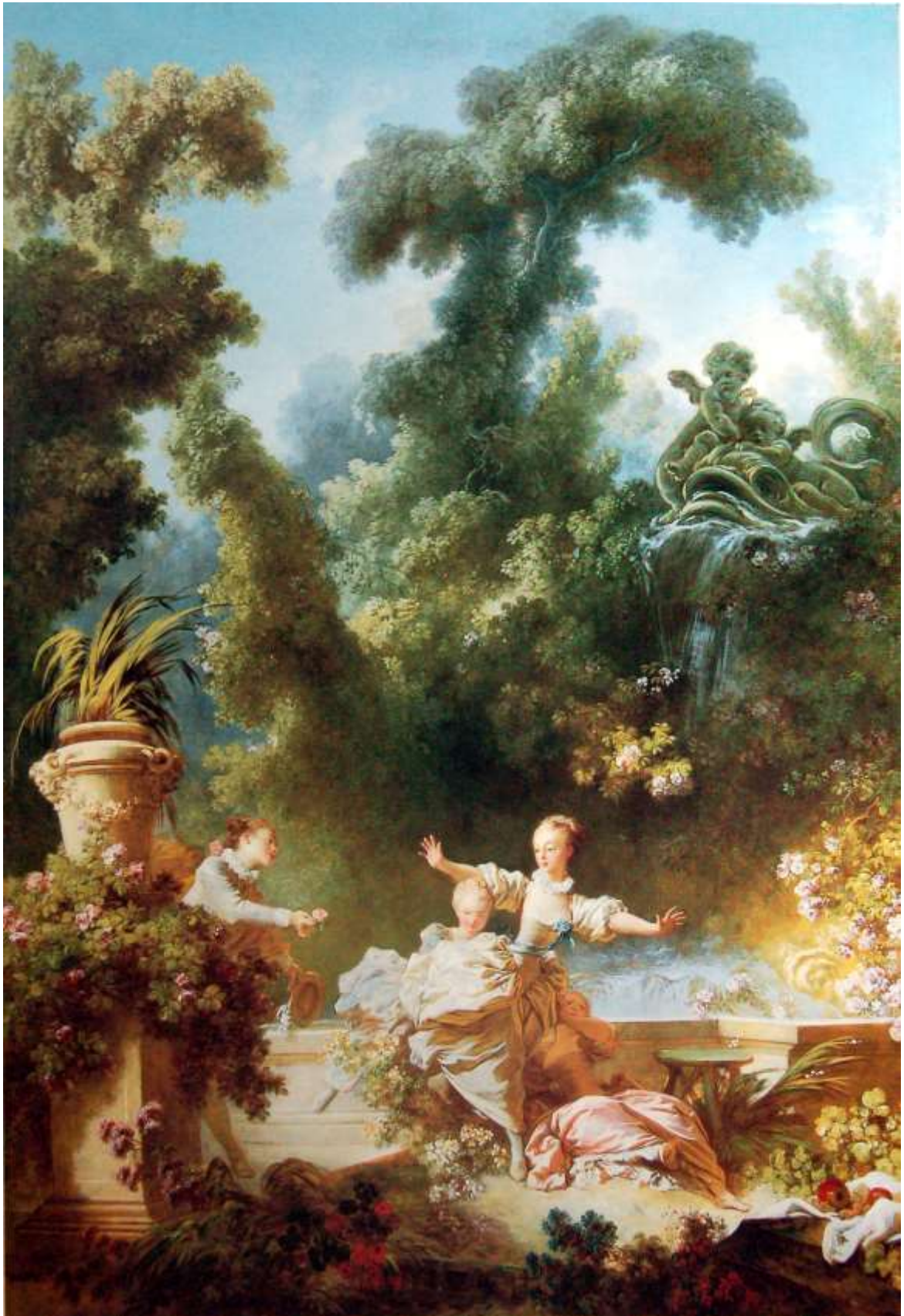
Planche 34 : J.-H. Fragonard, La Poursuite , huile sur toile, 318 X 215,5 cm, 1771-1772, signé, New-York, collection Frick.