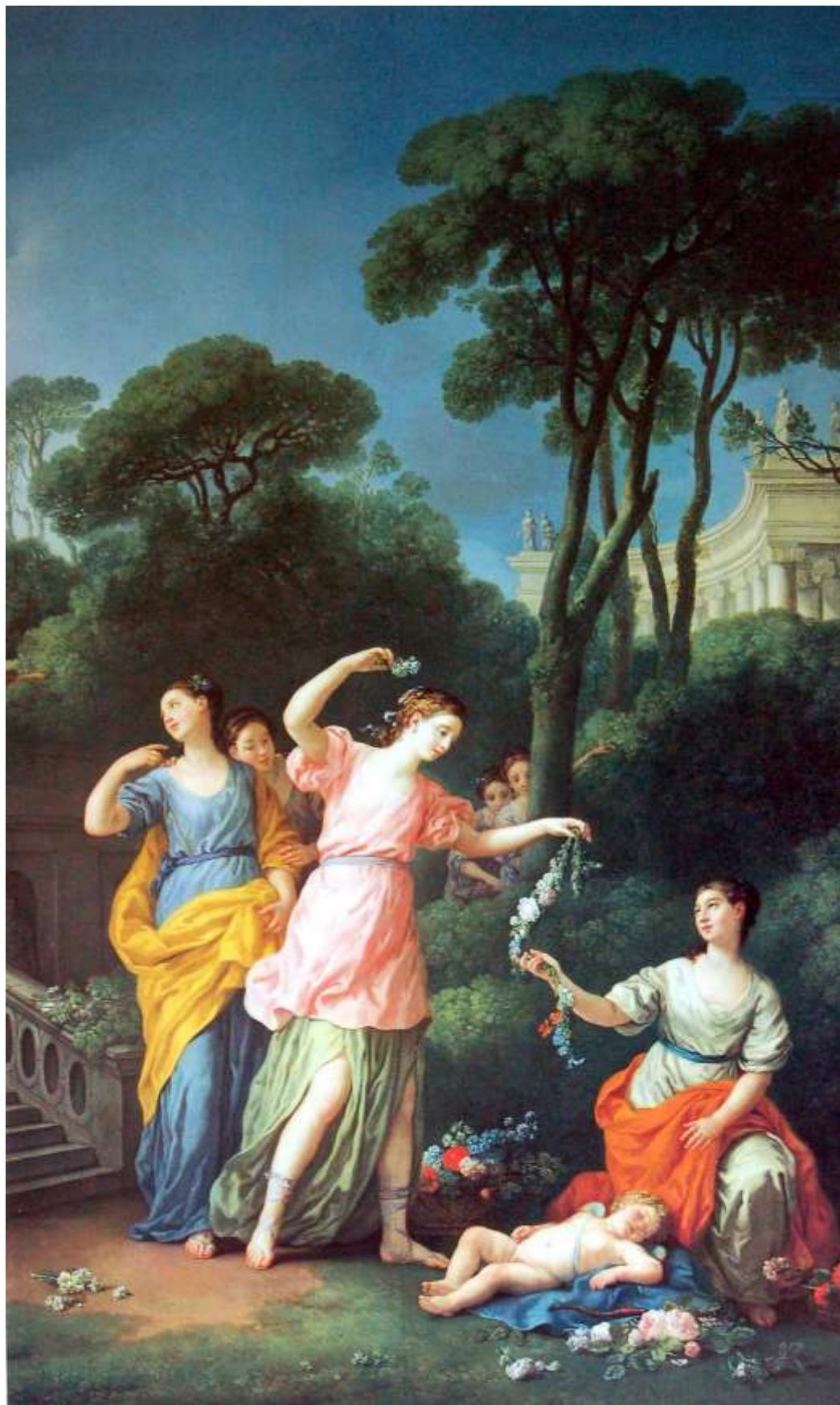
Planche 39 : J.-M. Vien, De jeunes grecques rencontrent l'Amour endormi dans un jardin ou La Rencontre avec l'Amour , huile sur toile, 350 X230 cm, 1773, signé et daté, Paris, musée du Louvre.