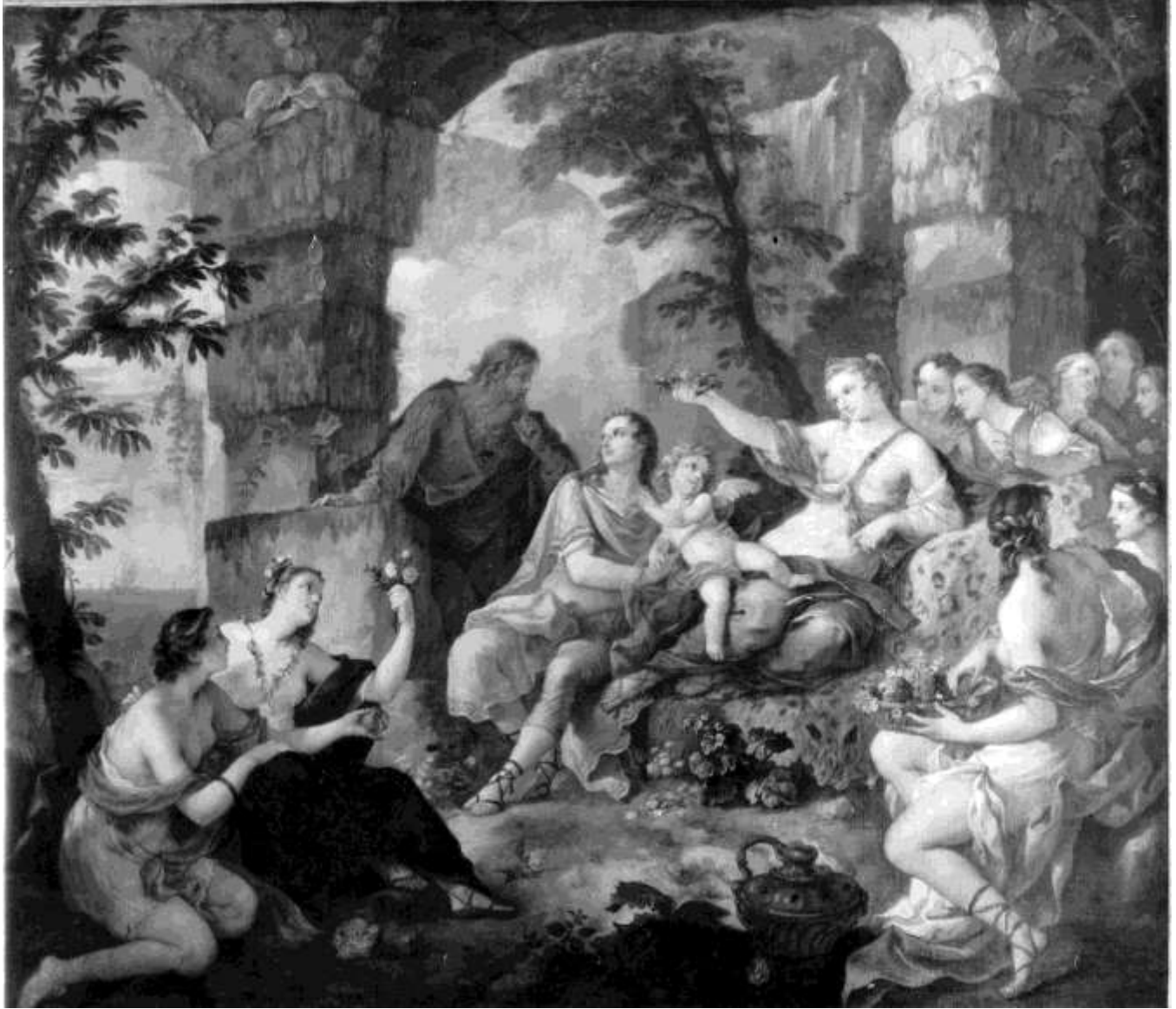
Planche 10 : C.-J. Natoire, Télémaque caressant l'Amour dans l'île de Calypso , huile sur toile, 260 X 292 cm, Saint-Pétersbourg, musée de l'Ermitage.