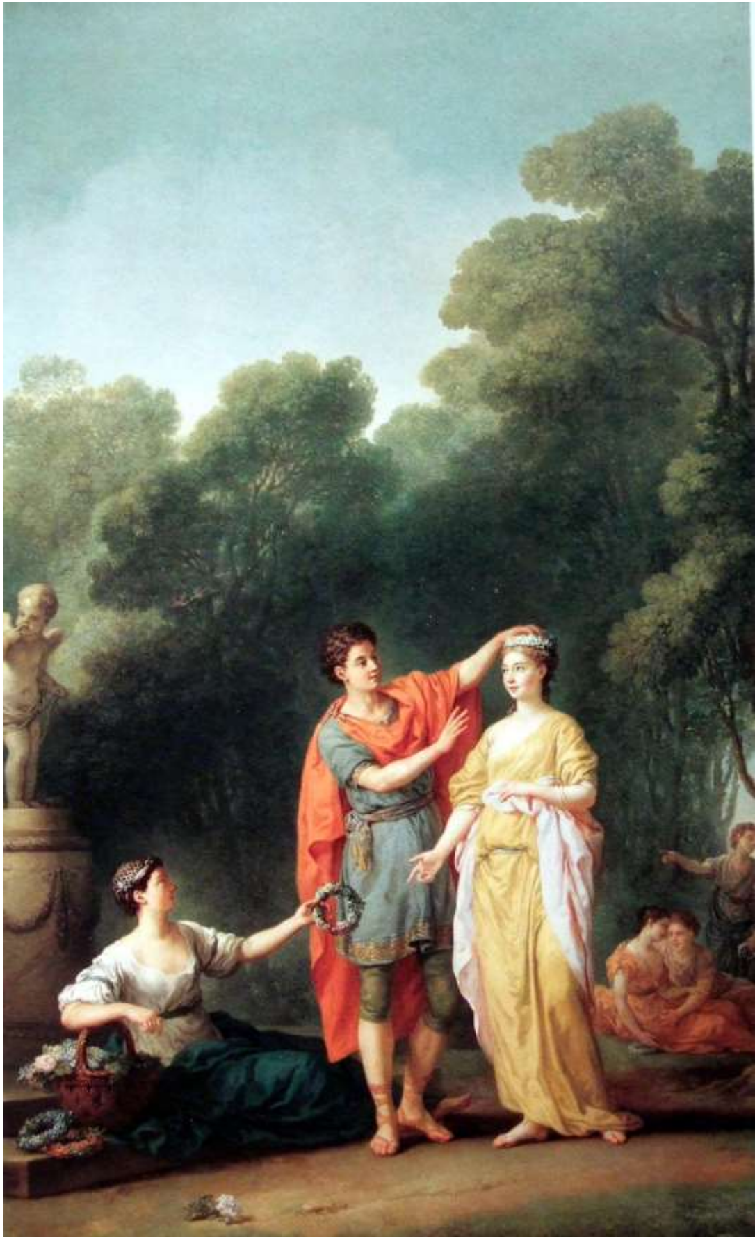
Planche 40 : J.-M. Vien, L'Amant couronnant sa maîtresse ou Le Couronnement , huile sur toile, 350 X 230 cm, 1773, signé et daté, Paris, musée du Louvre.