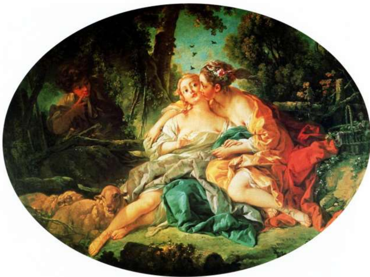
Planche 20 : F. Boucher, Sylvie guérit Phillis de la piqûre d'une abeille , huile sur toile, 120 X 136 cm, signé et daté, 1755, Paris, Banque de France.