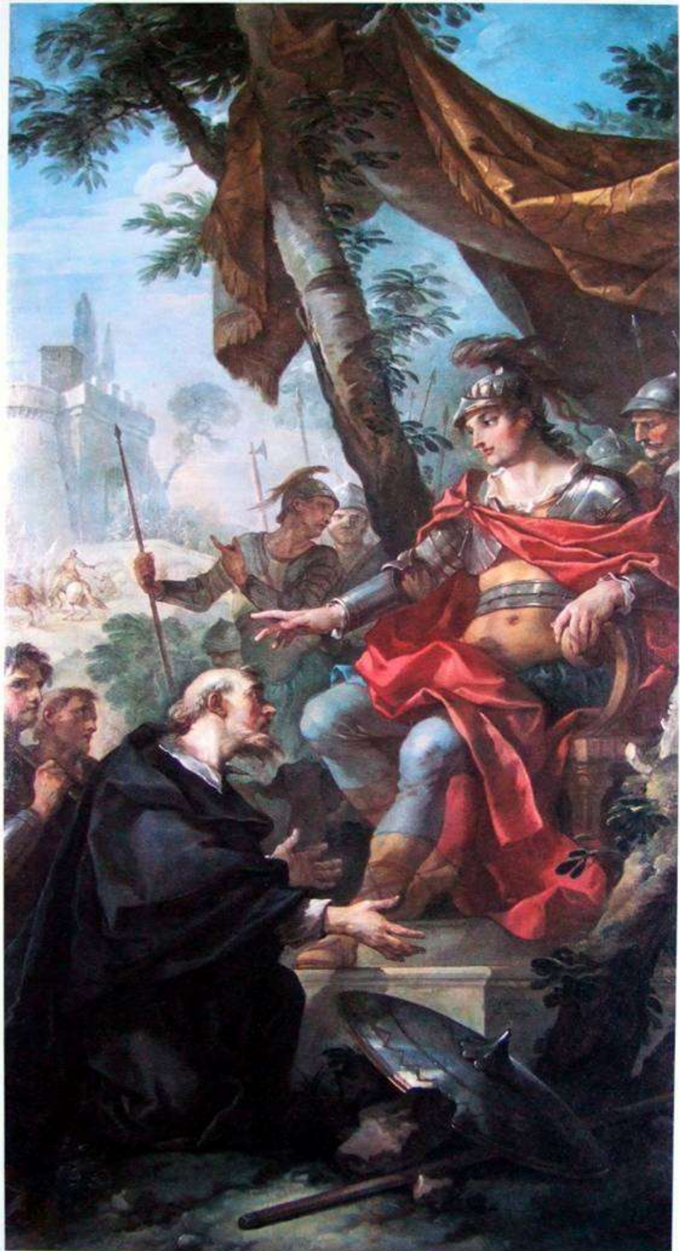
Planche 4 : C.-J. Natoire, Clovis recevant un envoyé de saint Rémi , huile sur toile, 234 X 124 cm, signé et daté, 1736, Troyes, musées d'Art et d'Histoire.