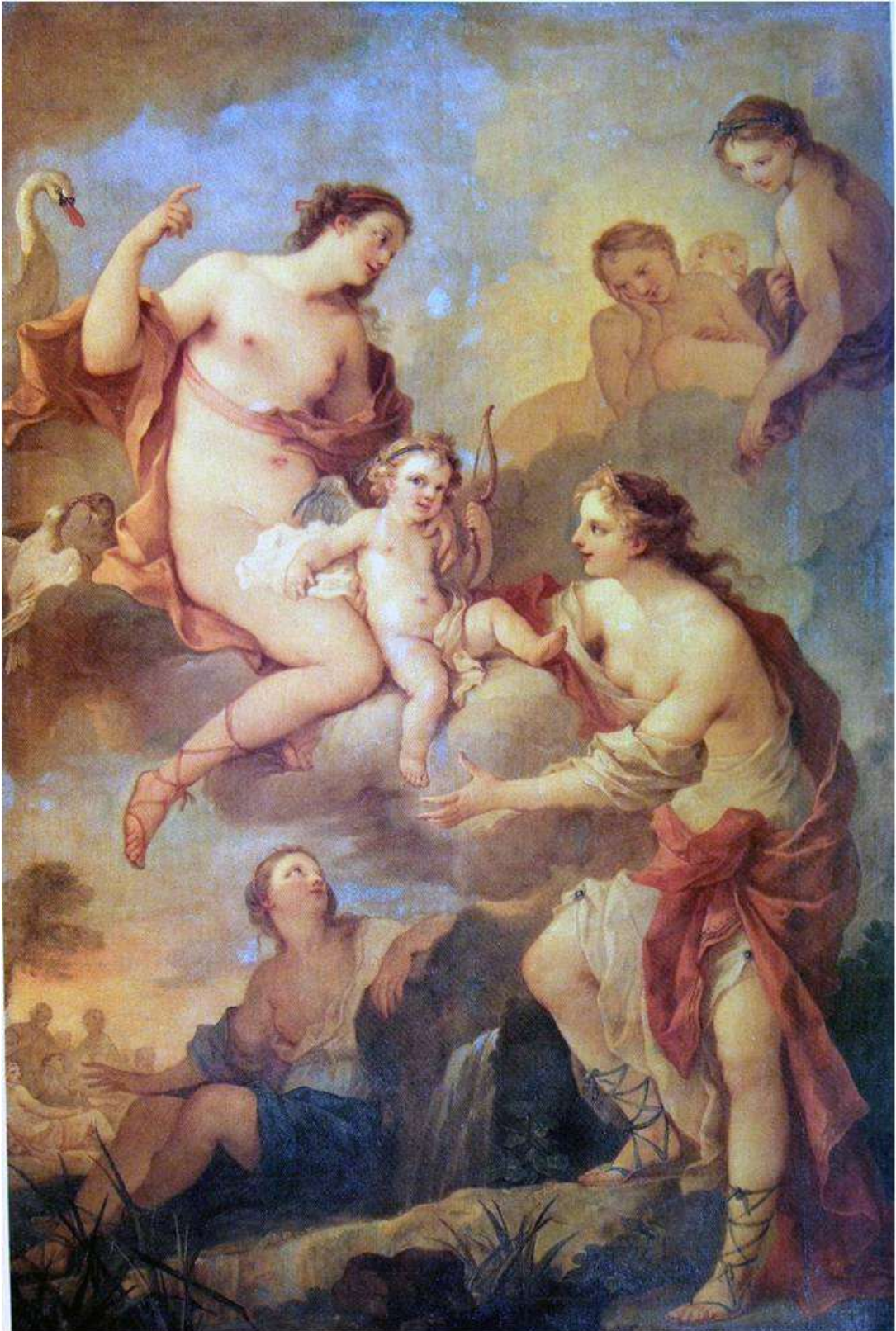
Planche 9 : C.-J. Natoire, Vénus qui donne l'Amour à Calypso , huile sur toile, 218 X 143 cm, Moscou, musée Pouchkine.