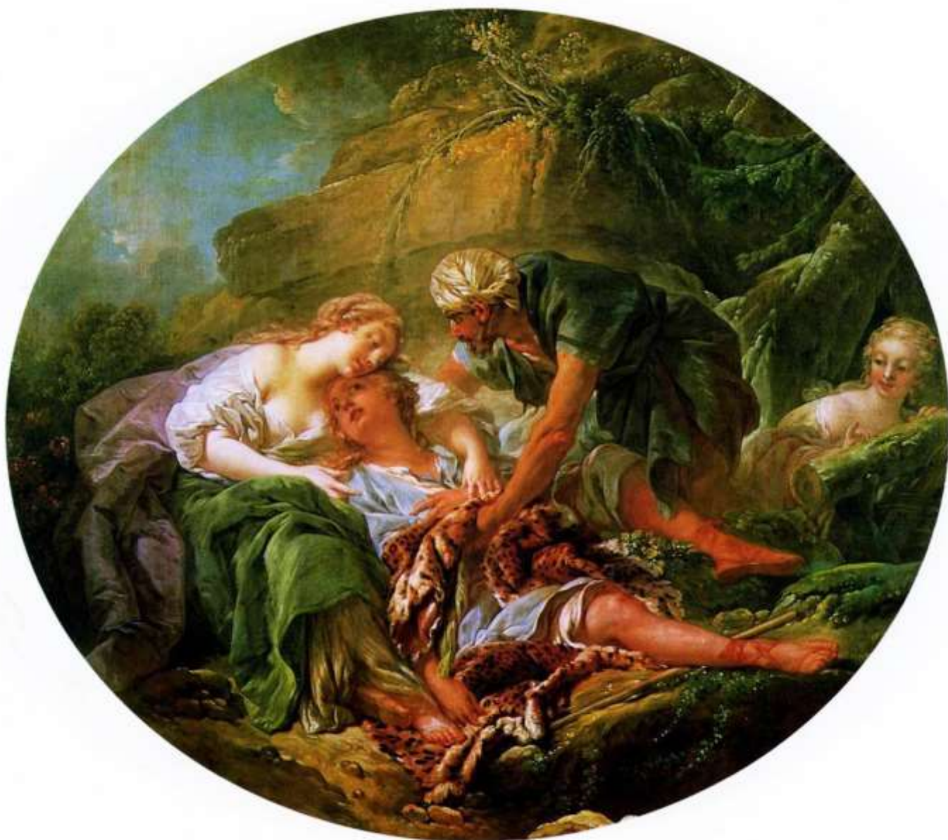
Planche 23 : F. Boucher, L'Amour ranime Aminte dans les bras de Sylvie , huile sur toile, 122,5 X 139 cm, signé et daté, 1756, Tours, musée des Beaux-Arts.