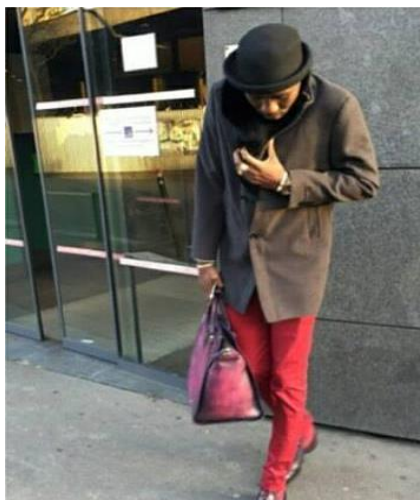
Figure 13 : Le chanteur Wally Seck portant un sac à main dans la ville de New York.