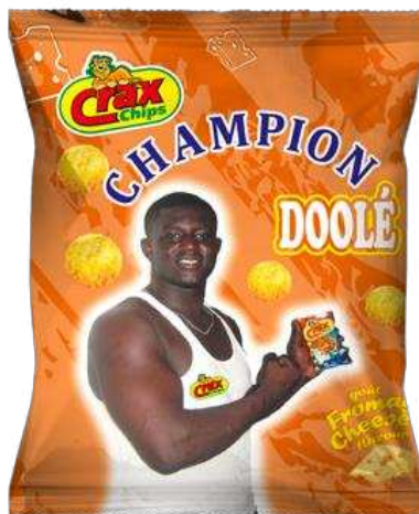
Figure 12 : Paquet de chips de la marque Crax représentant le lutteur Balla Gaye (Source : http://www.africachipssenegal.com/crax-chips/og/7515 ).

masculin apparaît ainsi comme le « lieu symbolique du désir et de l'érotisme », la musculature comme un des signes extérieurs de « virilité » (Vallet, 2008). Cette association entre corps des hommes et force physique ( dolle ou doolé ) est donnée à voir aux enfants dès leur plus jeune âge par le biais de fictions télévisuelles, des sports médiatisés et d'un certain nombre de biens de consommation.