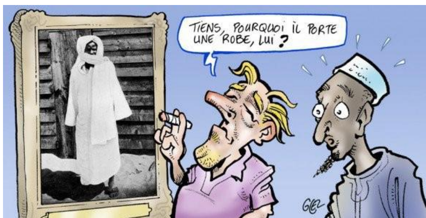
Figure 14 : Représentation de Cheikh Amhmadou Bamba signée Damien Glez (Source : https://www.cath.ch/newsf/senegal/ ).

La confusion entre le caftan et la robe est très mal prise par l'ensemble des Sénégalais-es qui n'apprécient guère ce trait d'humour. Suite à ces faits, le président de la République sénégalaise, Macky Sall, condamne « avec fermeté cette maladresse incompréhensible et inadmissible de la part d'un organe de presse qui s'identifie à l'Afrique et censé connaître, défendre et promouvoir la culture et les valeurs africaines » 12 . Waly Seck, quant à lui, ne parvenant pas à justifier qu'il ne s'agit que