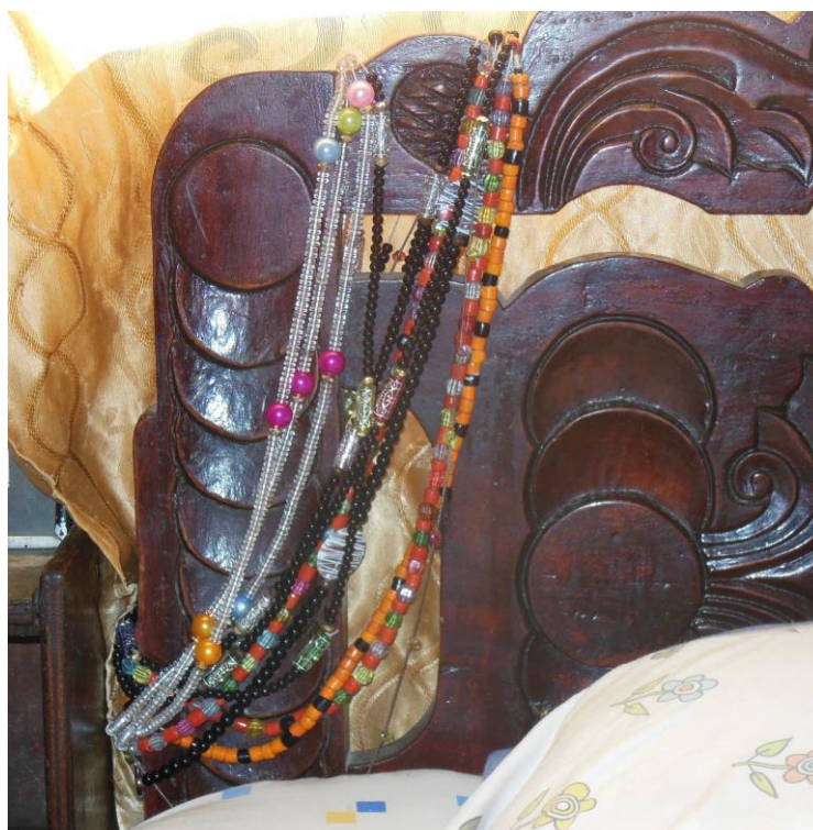
Figure 11 : Colliers de hanche.