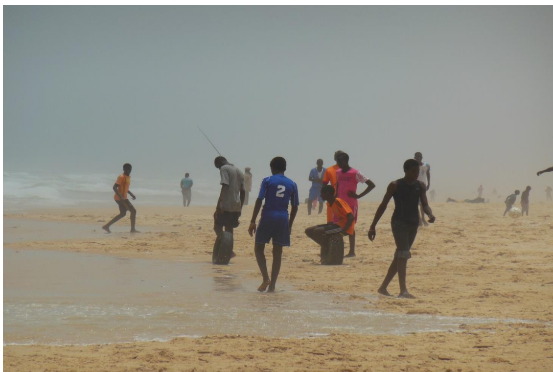
Figure 10 : Des jeunes hommes s'entraînant sur la place de Cambérène.

À Dakar, nombreux sont les cadres pouvant être définis comme des espaces homosociaux, des « maison-des-hommes ». Parmi ceux-ci, on peut mentionner les chambres dans lesquelles les garçons, passé un certain âge, et les jeunes hommes non mariés résident. Ils partagent soit des matelas soit des nattes, alors que, dans une autre pièce de la maison familiale, les filles et les jeunes femmes dorment également ensemble. Mis à part le cas de chambres en location partagées par les parents et leurs enfants, cette division des espaces dortoirs est de rigueur. Il est donc improbable qu'adolescents et adolescentes, jeunes hommes et jeunes femmes dorment ensemble. Les espaces sportifs en plein air sont également des espaces peu mixtes. De même, la présence de femmes se fait rare sur les plages dakaroises.