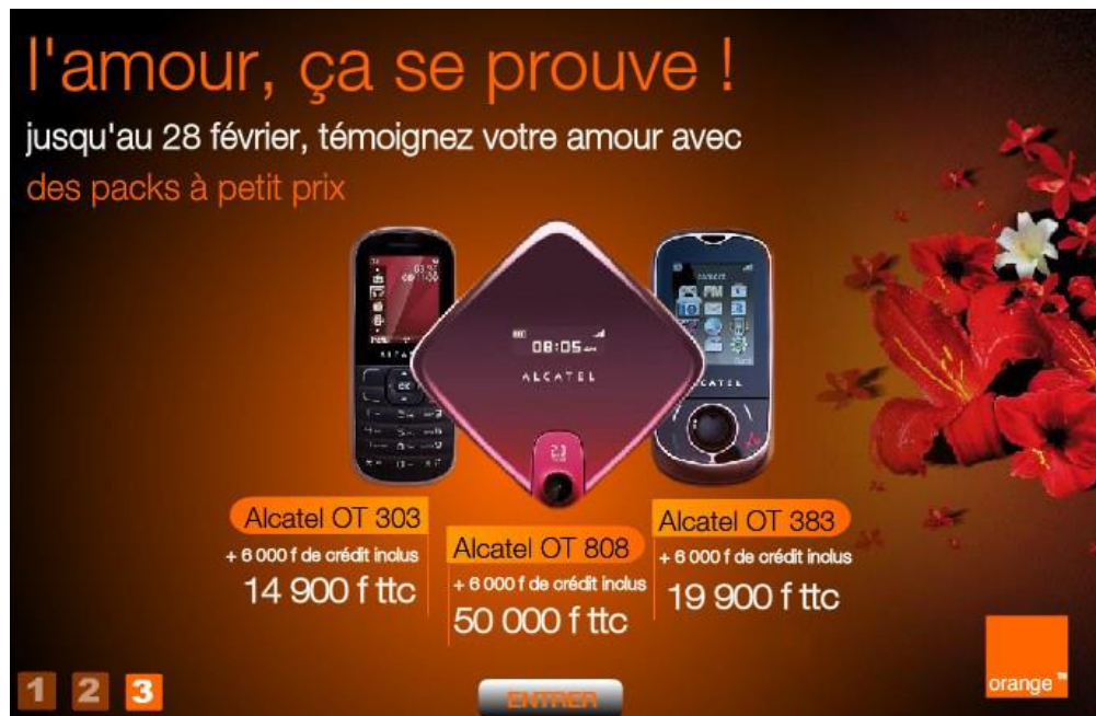
Figure 9 : Promotion de l'opérateur de télécommunication Orange réalisée pour l'occasion de la fête de la Saint-Valentin de 2011 ( https://frama.link/hqfB76ZT ).

La forme et la fréquence de ces coûts non financiers dépendent de différents critères tels que ce que les hommes sont prêts à engager, les réactions de leurs partenaires, le niveau de la relation, l'entente des couples, etc. Si l'on prend l'exemple du temps que les hommes passent au téléphone avec une partie de leurs partenaires, la fréquence et l'ampleur des « dépenses temporelles » sautent aux yeux. C'est d'ailleurs une donnée qui semble avoir été bien prise en compte dans diverses campagnes publicitaires mettant en avant le rôle des conversations téléphoniques en tant que vecteurs privilégiés pour démontrer son amour.