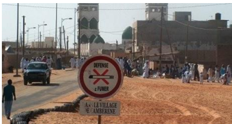
Figure 4 : La zone « sainte » de Cambéréne ( https://www.xibar.net/Operation-de-desencombrement-a-Camberene-Le-maire-bute-sur-la-resistance-des-populations_a55461.html xibar.net).

Pendant longtemps, la proximité du centre-ville a encouragé l'installation de nouveaux arrivant·es. Les espaces les plus éloignés du centre-ville, tels que Cambéréne, situés à la sortie de Dakar et jouxtant la ville périurbaine de Guédiawaye, ont connu une croissance démographique moins rapide