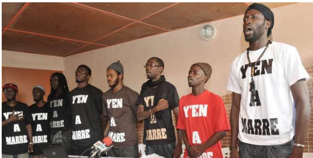
Figure 16 : Les leaders du mouvement YAM le 27 juin 2011

des hommes. Partant du principe que les libertés que s'accordent les femmes, et les dérives qui en découleraient, constituent des freins à l'émergence d'une « modernité morale », ils se pensent les mieux placés pour contribuer au changement social, c'est-à-dire à la mise en place d'une société meilleure dans tous les sens du terme. En agissant et en se transformant, les hommes pourraient remédier à cette situation, là où les femmes ne peuvent qu'échouer par excès d'individualisme. Devenir un NTS suppose donc, pour ces hommes, de se positionner dans des jeux de rapports de pouvoir entre hommes et femmes. En cela, la perspective de mise en place d'une société « moderne » renvoie à une dimension genrée.