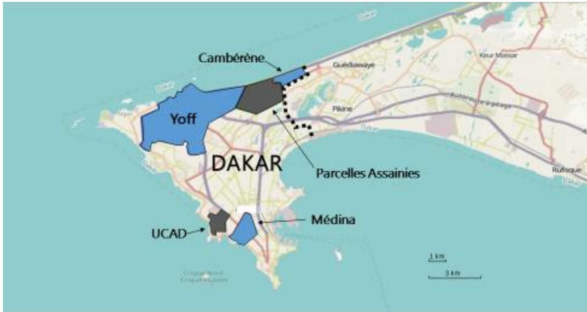
Figure 2 : Carte des quatre communes d'arrondissement enquêté et l'UCAD (Conception N. Faynot).