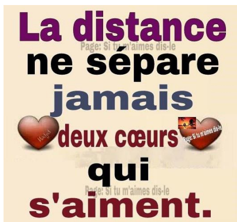
Figure 17 : Contenu relayé par plusieurs hommes de l'UCAD sur leur compte Facebook.

Certains messages postés par les jeunes Sénégalais·es ne s'adressent pas directement à l'être aimé·e et ne cherchent pas à déclarer l'amour porté à quelqu'un·e. L'amour, en tant que but, peut faire l'objet d'un discours au travers de formules poétiques ou empreintes d'une forme de philosophie. Les personnes qui postent ces messages sur leur « mur » peuvent en être les auteurs ou autrices, mais il leur arrive aussi de relayer des montages photographiques ou des textes qui les ont marqué·es.