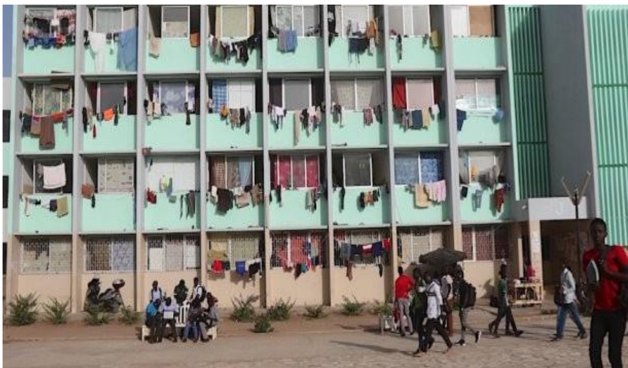
Figure 6 : Vue sur les fenêtres des chambres bondées de la cité universitaire.

Que ce soit sur des nattes ou sur des mer-gàdday (matelas très fins et peu confortables), ils arrivent à placer leur literie dans tous les espaces que la chambre propose. Cela leur permet ainsi d'économiser sur le prix du loyer et d'arriver à pallier le manque de chambre mises à disposition des étudiants par une solidarité d'urgence. La question de dormir à quatre dans une chambre ne se pose pourtant pas pour les occupants : il y a tellement d'étudiants sans logement qu'il leur semble inenvisageable de fermer leur porte à ceux qui sont dans le besoin d'un espace où s'allonger pour dormir.