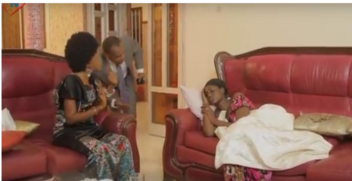
Figure 8 - Mounass allongée sur un divan, alors que Daro explique au prétendant inquiet la nature du mal qui atteint son amie (DN, Saison 1, épisode 3).

légaux ou moraux, il s'agit d'un espace-temps dans lequel les femmes peuvent avoir accès à une certaine forme de liberté qui ne sera reproductible pour elles que dans l'hypothèse d'un divorce. Or, le statut de divorcée pouvant être stigmatisant, il n'est pas forcément recherché même s'il peut avoir l'intérêt d'amener les femmes à ne plus dépendre d'un père ou d'un époux (Dial, 2008). Celui de célibataire (au sens de n'ayant jamais été mariée) ne l'est lui aussi que passé un certain âge. D'autre part, la capacité des femmes à obtenir des « dons » de la part de leur(s) petit(s) ami(s) induit que, une fois mariées, elles soient en mesure de faire respecter les obligations économiques de leur époux en ne mettant pas à mal le prestige de celui-ci. Les cadeaux du mari à son épouse ne faisant pas strictement partie d'obligations statutaires, il faut bien que les jeunes femmes fassent l'apprentissage de cette compétence consistant à « savoir obtenir ».