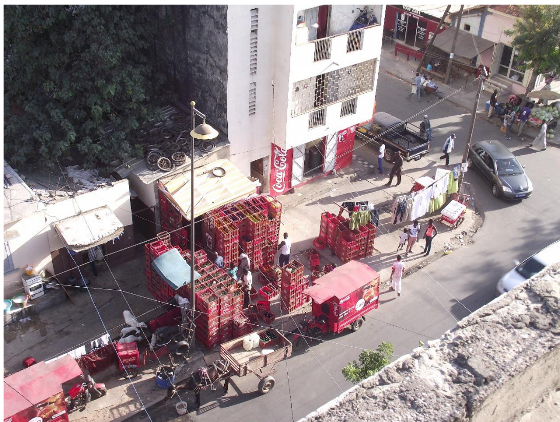
Figure 7 : Les débits de boisson de Médina.

Ce groupe, avec celui de l'UCAD, est celui qui dispose du plus faible pouvoir d'achat à la différence non négligeable que les prix des loyers et de la nourriture sont autrement plus onéreux qu'ils ne le sont à la cité universitaire. Ils comptent souvent sur la générosité des habitant·es du quartier, de leurs amis ou de membres de leur famille éloignée pour s'inviter à déjeuner et avoir ainsi l'assurance de manger un plat de riz, soit un repas bien plus complet que ceux qu'ils se partagent le soir, quand ils mangent. Dans ce groupe, un homme disposant de 200 Francs Cfa (0,3 euros) préfère acheter le matériel nécessaire à la préparation collective du thé que de s'acheter de quoi dîner pour lui seul, ce qui illustre une fois de plus l'importance symbolique de ce moment récréatif.