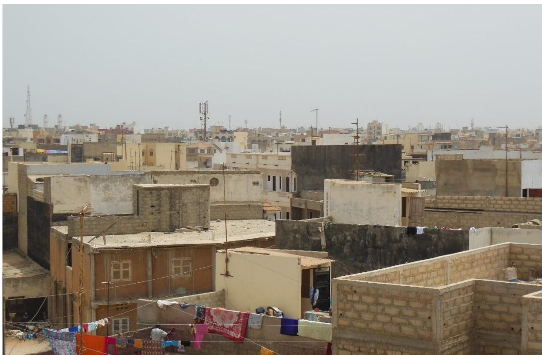
Figure 5 : Vue sur les immeubles à étages et les terrasses de Parcelles Assainies.

transformer une partie de Cambérène. C'est ainsi que le nouveau quartier administratif de Parcelles Assainies est né (Lessault et al. , 2013).