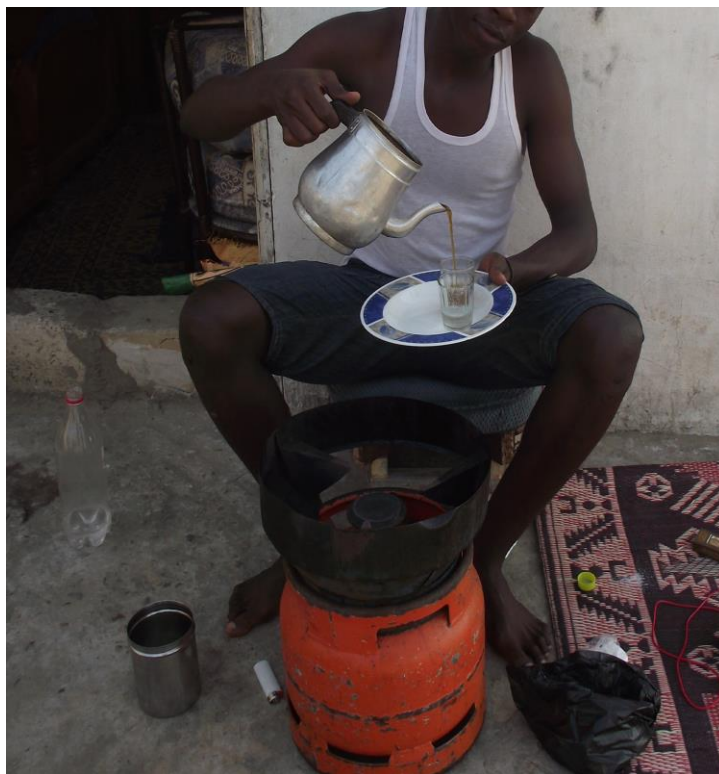
Figure 1 : Un jeune homme de Cambérène en pleine préparation du thé.

cuisine, la préparation du thé est avant tout l'apanage des hommes. Les femmes n'en sont pas exclues, mais, d'ordinaire, si un homme sachant préparer le thé est présent dans l'enceinte domestique, c'est lui qui s'en chargera. Ce sont en priorité les jeunes hommes qui s'en occupent. Les aîné·es ont ainsi le privilège de boire du thé sans être en charge du labeur qui accompagne sa préparation. Préparer un bon attaaya dans les règles de l'art demande effectivement du temps et un investissement conséquent et s'appuie, en tant que compétence masculine, sur des « observation[s] et imitation[s] [acquises] à l'adolescence » (Bondaz, 2013 : 64), voire même dès l'enfance.