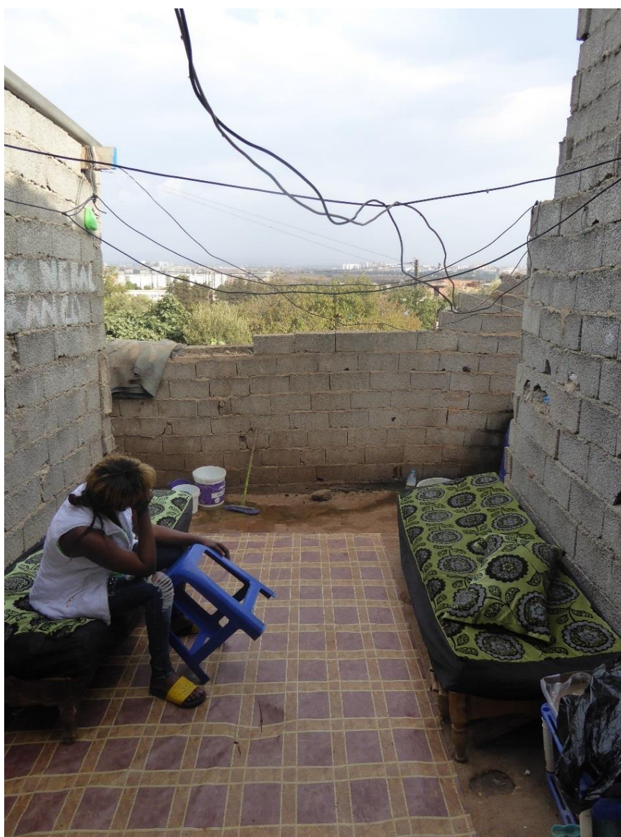
Photo n°8, cour d'une maisonnette dans le quartier des Amandiers, septembre 2017.

Ce témoignage particulièrement édifiant met en lumière les conditions de vie désastreuses des migrants dans ces quartiers périphériques ; si les migrants sont, partout en Algérie, vulnérables en raison de leur absence d'accès au droit, ils sont encore bien plus exposés à toute forme de violences (agressions, viols et meurtres) dans ces quartiers périphériques tels que Coca, Les Amandiers et Aïn Beïdha, considérés comme des zones de non-droit. Comme ce témoignage le montre, rares sont celles d'entre les personnes agressées qui osent porter plainte, par peur de représailles, ou par crainte d'être elles-mêmes enfermées pour absence de papiers en règle. De plus, la totale inaction des autorités dans la plupart des cas d'agressions envers les migrants, amènent ceux-ci à entretenir la plus grande méfiance envers la police algérienne.