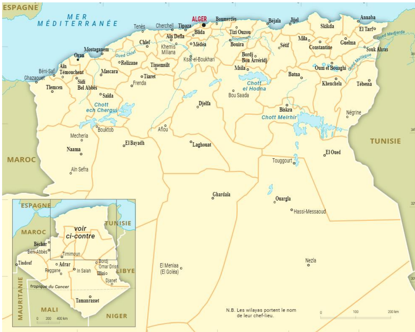
Carte n°1, villes et wilaya (départements) d'Algérie 24

Oran est la deuxième plus grande ville d'Algérie – après Alger, la capitale – et se situe sur la côte nord-ouest de l'Algérie. Sa structure urbaine est particulière : « avec son centre colonial et les cinq grands “douars périphériques” qui l’encerclent (Chteïbo, Belgaïd, Sidi El Bachir, El Hassi et Aïn Beïda), Oran présente une forme étoilée qui confère une grande lisibilité à sa structure urbaine actuelle. À Oran se maintient toujours l’ancien clivage séparant la ville “formelle”, longtemps réservée à la population française et européenne, des quartiers d’habitat “informels” et/ou précaires, situés en périphérie » 25 . Dans un contexte régional où la mobilité des migrants est entravée et où ils sont tenus de s’installer temporairement sur leur trajet, la ville d'Oran occupe une place particulière : du fait de sa position géographique, elle est l'une