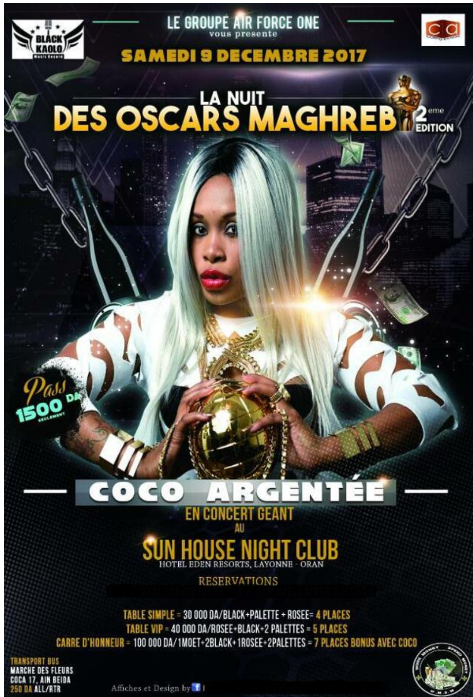
Affiche n°3, exemple d'affiche sur Facebook, accompagnée d'un message, pour un concert de la chanteuse camerounaise « Coco Argentée », se déroulant dans un hôtel.