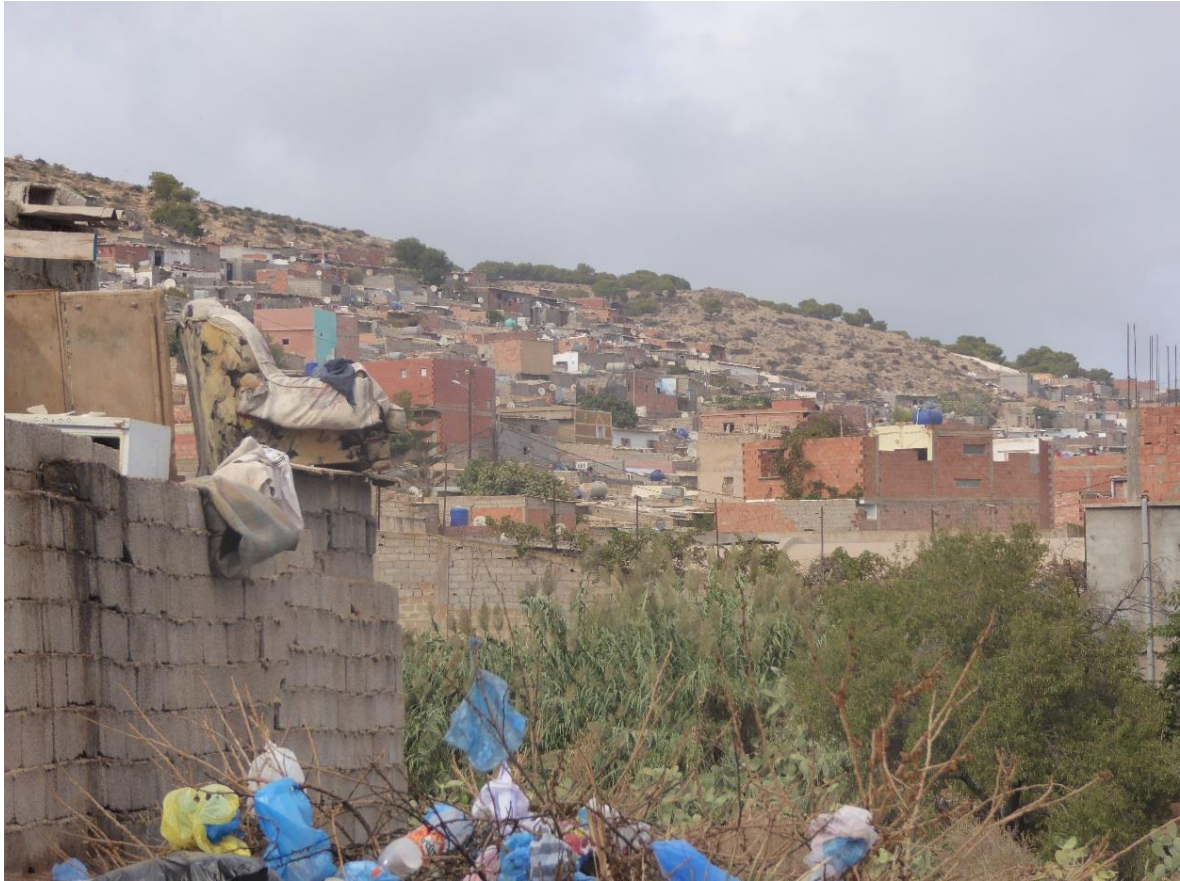
Photo n°10, vue d'ensemble sur le quartier des Amandiers, septembre 2017.