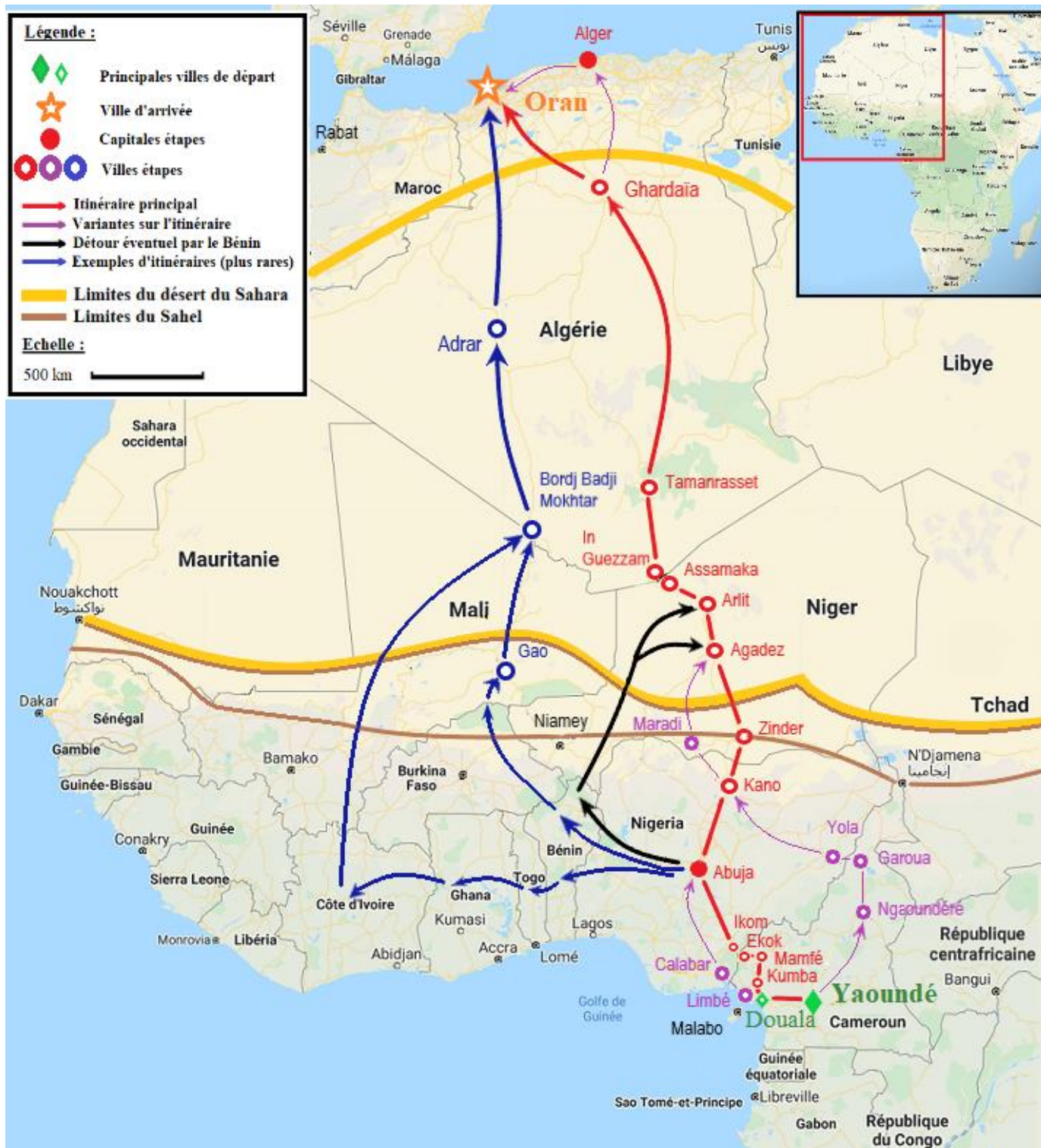
Carte n°3, itinéraires migratoires entre le Cameroun et l'Algérie 203