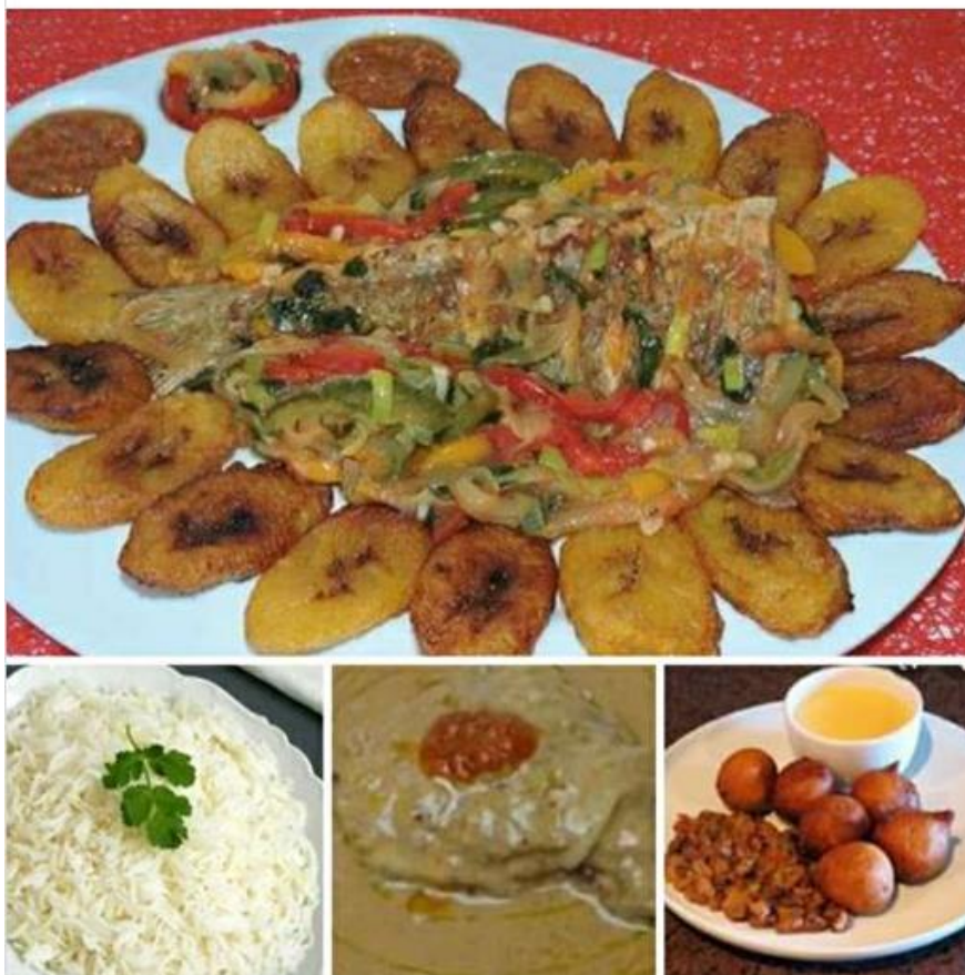
Message Facebook n°2, exemple de message avec photos sur Facebook, pour annoncer le menu du jour dans un maquis .

Frite de plantain et pommes , poissons ( maquereau, carpe et macgnia) braisé. Dinde , poulet DG