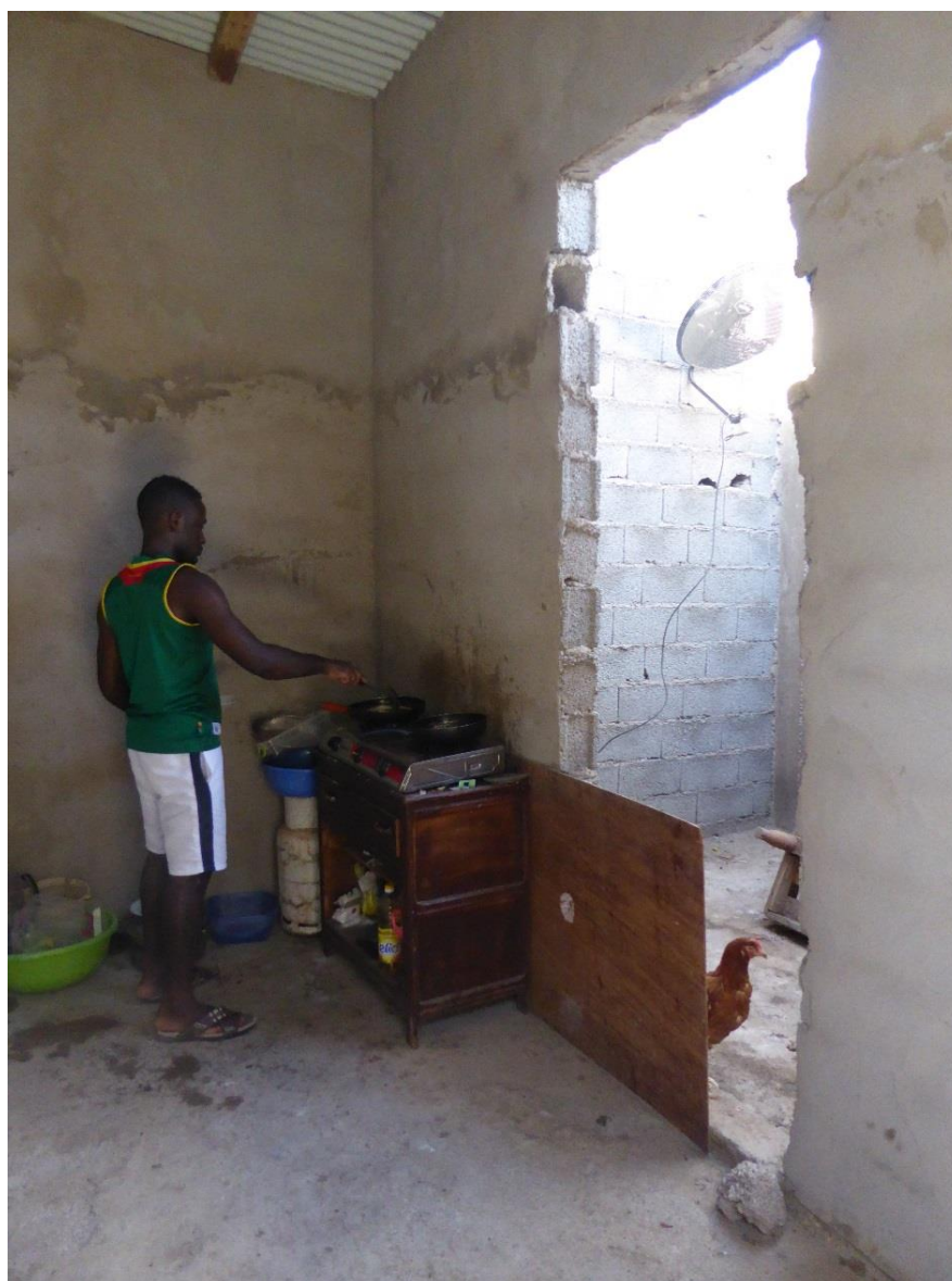
Photo n°14, maisonnette dans le quartier d'Aïn Beïdha, août 2017. Cuisine en semi-extérieur (ouverte sur le couloir extérieur et le poulailler). Coin poulailler. Murs en parpaings, toit en tôle.

de basses températures, car certaines « pièces » sont en semi-extérieur, le couloir est à ciel ouvert et il n'y a strictement aucune isolation.