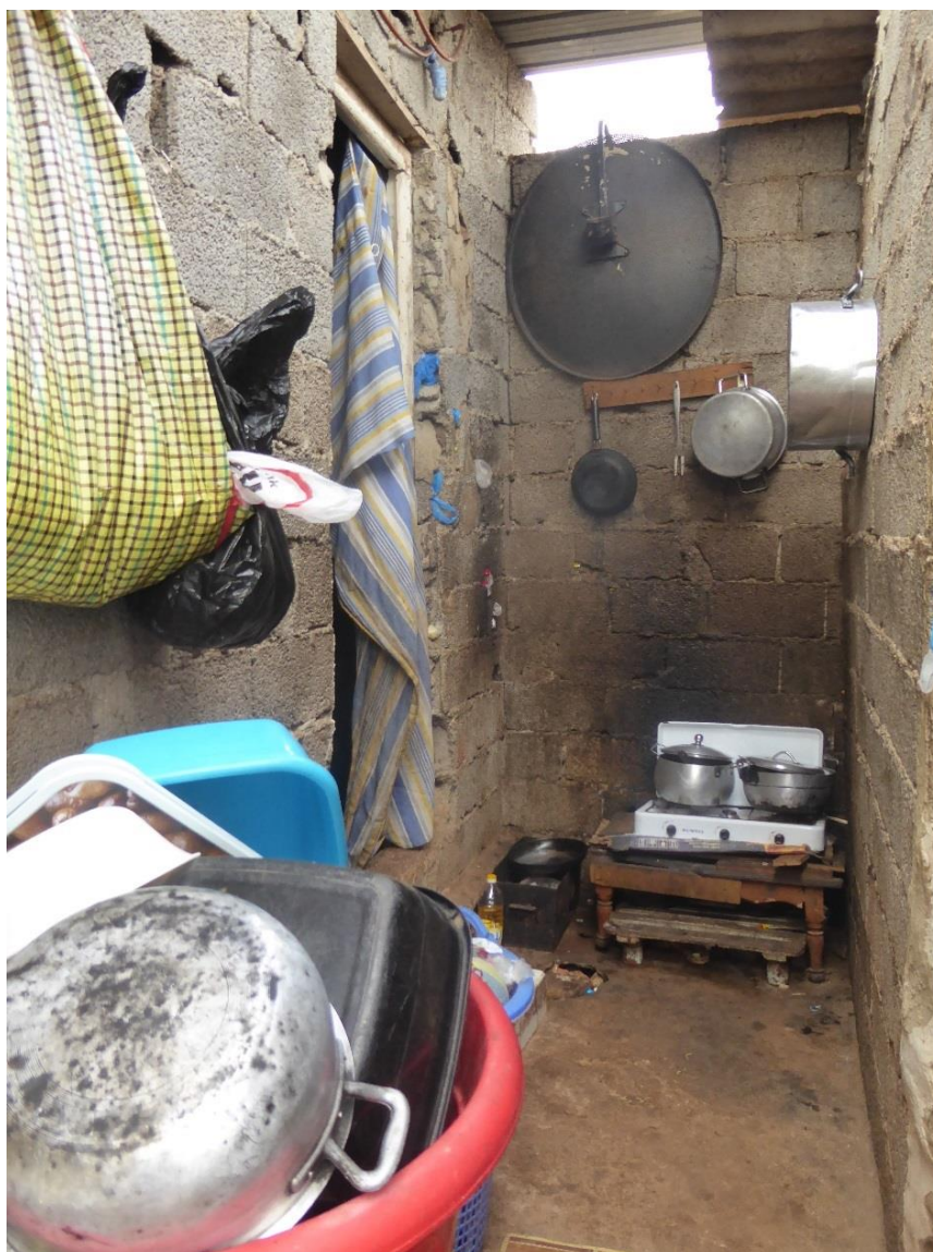
Photo n°7, maisonnette dans le quartier des Amandiers, septembre 2017. Cuisine en semi-extérieur, sol en terre battue, murs en parpaings apparents, toit en tôle.

Les Amandiers, plus couramment appelé « les Amandines » par les migrants camerounais, est un quartier situé en périphérie sud-ouest d'Oran. Comme le quartier Coca, il est construit en partie illégalement sur une colline en terre battue. Des tonnes de débris s'amoncellent sur la colline entre les maisonnettes en briques ou parpaings apparents ; les conditions de vie y sont absolument désastreuses.