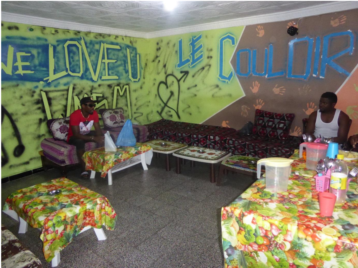
Photo n°17, salle de restaurant dans un maquis du centre-ville, septembre 2017. À cette heure de la journée (fin d'après-midi), il n'y a quasiment aucun client.

difficiles dans certains maquis à cause de l'absence de sommeil due à la multiplication des tâches en journée et à l'obligation de servir les clients la nuit.