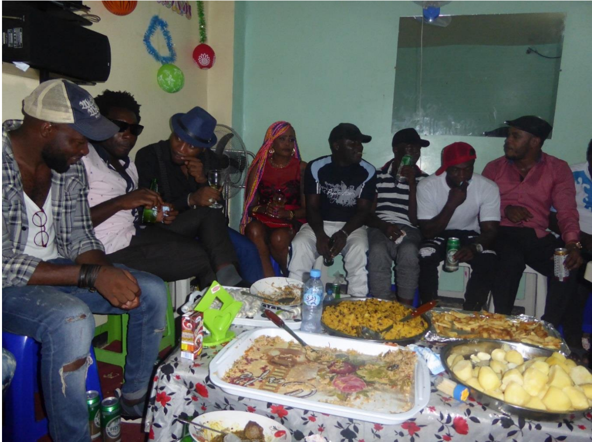
Photo n°19, fête d'anniversaire chez un particulier au quartier Kimine, août 2017.