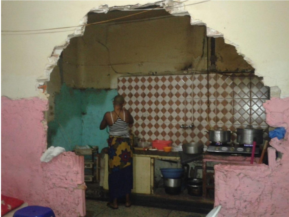
Photo n°15, décor faisant la cuisine, octobre 2016. Maquis chez Salomé et Ernest. Cuisine vue depuis la salle à manger, avec le mur percé en arcade.