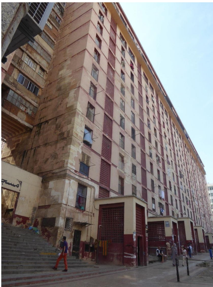
Photo n°1, cité Lescure, septembre 2017.

En Algérie il est d'usage de verser un an de loyer d'avance ; ou six mois si le propriétaire est conciliant. Dans le cas des migrants sans-papiers qui louent des appartements de façon non-déclarée, le cas le plus courant, en cas de différend avec le bailleur, est qu'ils soient mis à la porte du jour au lendemain sans être remboursés des loyers qu'ils ont versés à l'avance. De plus, les bailleurs profitent du fait que les migrants sont sans-papiers pour leur louer leurs biens deux à trois fois plus cher qu'ils ne le loueraient à un Algérien. Les migrants n'ont d'autre choix que d'accepter, pour pouvoir se loger. Parfois, il arrive que des migrants souhaitent partir de l'appartement parce qu'ils ont trouvé mieux ailleurs, ou parce qu'ils ont prévu de voyager . Alors qu'ils ont déjà payé plusieurs mois d'avance, ils proposent alors de vendre la maison à un autre Camerounais qui leur payera le restant en espèces, à condition de demander l'accord du bailleur, ce afin de pouvoir reprendre la location.