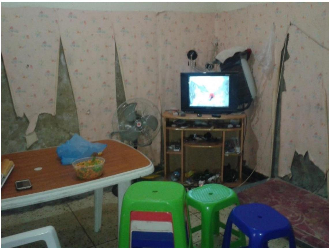
Photo n°16, maquis chez Salomé et Ernest, octobre 2016. Salle à manger.