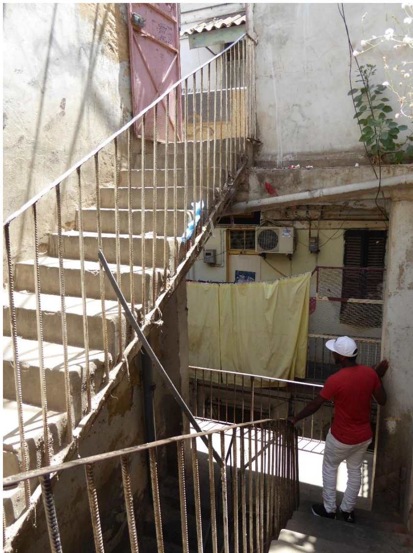
Photo n°2, cage d'escalier dans un immeuble du centre-ville, juillet 2017.

m'ont indiqué qu'ils ne voyaient quasiment jamais leur propriétaire, hormis pour lui payer le loyer tous les six mois, voire une fois par an. Enfin, les propriétaires algériens sont aux abonnés absents lorsqu'il s'agit de faire des travaux de rénovation ou d'entretenir leur bien : c'est au locataire de faire les travaux d'assainissement ou de rénovation si besoin est, s'il en a les moyens. Et, parfois, les propriétaires vont jusqu'à réclamer un loyer plus élevé lorsqu'ils constatent qu'une rénovation ou qu'un aménagement a été effectué, car leur bien est en meilleur état, grâce au locataire. Ce non-sens est relativement courant et revient dans différents témoignages : des justifications fallacieuses sont mises en avant par certains propriétaires pour augmenter significativement et régulièrement le montant du loyer.