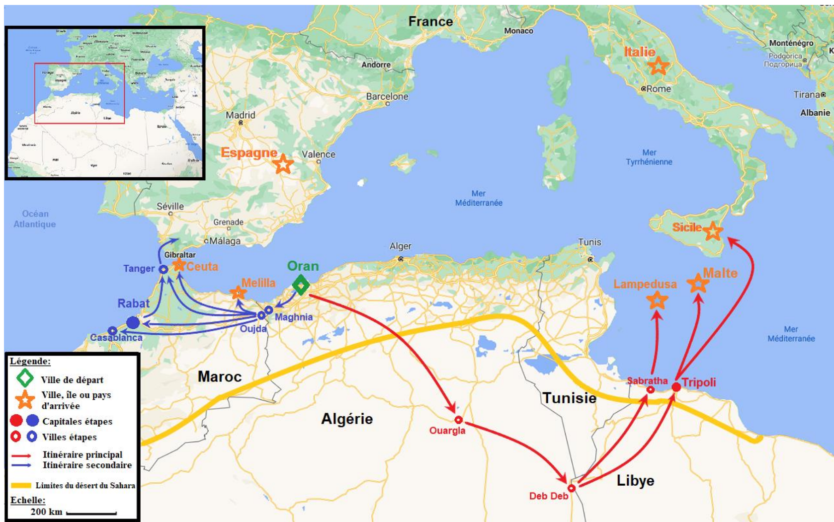
Carte n°4, itinéraires migratoires entre l'Algérie et l'Europe 314