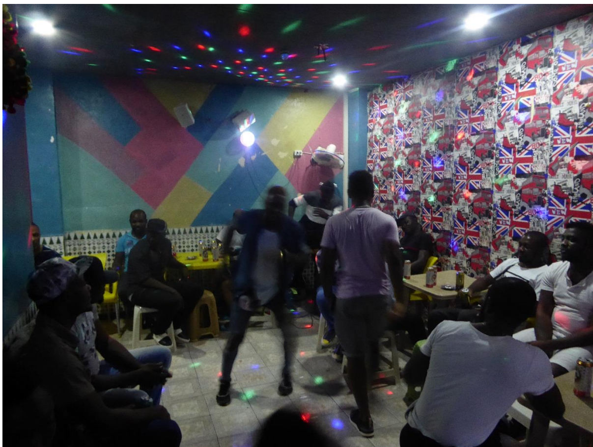
Photo n°18, soirée dans un maquis du quartier Tahtaha, septembre 2017. Un danseur particulièrement talentueux fait une démonstration, sous le regard des clients.