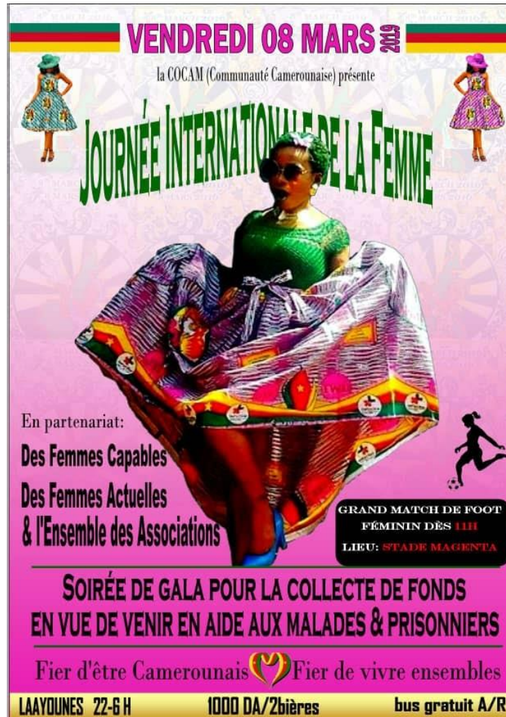
Affiche n°1, exemple d'affiche sur Facebook, accompagnée d'un message, pour une fête se déroulant dans un hôtel.

Ceci constituait une grande nouveauté et était appelé à se renouveler en cas de réussite de l'événement (pas de bagarres, bon déroulement de la soirée). En effet, nous l'avons dit, les lieux tels que les boîtes de nuit, les bars ou les restaurants officiellement gérés par des migrants subsahariens n'existent pas en Algérie 713 .