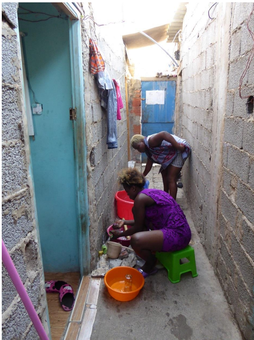
Photo n°13, maisonnette dans le quartier d'Aïn Beïdha, juillet 2017.

Quatre chambres sont disposées autour d'un couloir extérieur. Les murs sont en parpaings apparents, le toit en tôle. La porte en fer du fond donne directement sur la rue. Derrière la prise de vue, se trouve le coin toilettes-douche.