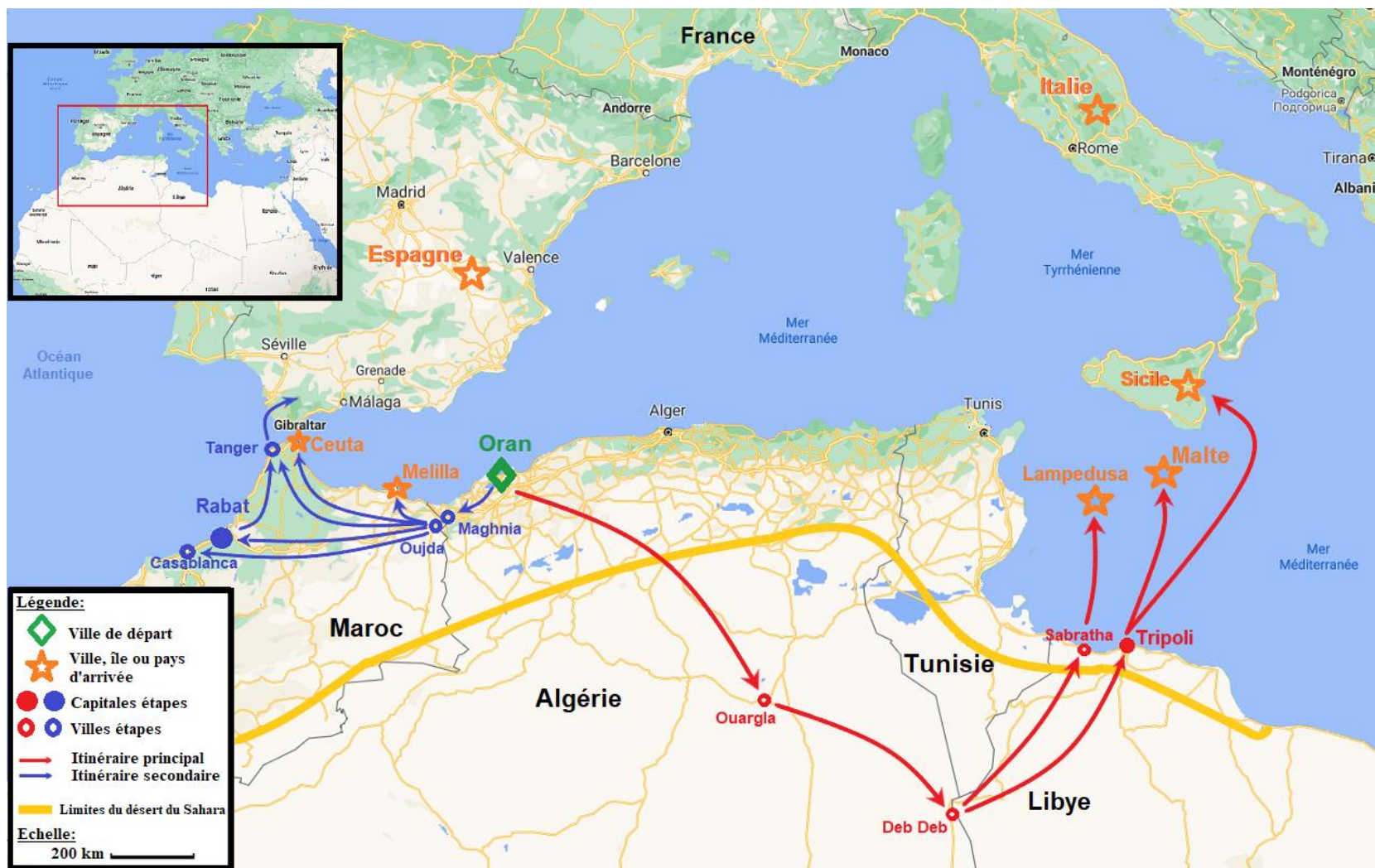
Carte n°4, itinéraires migratoires entre l'Algérie et l'Europe 314