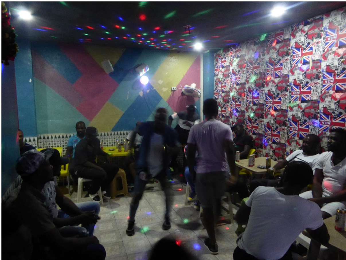
Photo n°18, soirée dans un maquis du quartier Tahtaha, septembre 2017. Un danseur particulièrement talentueux fait une démonstration, sous le regard des clients.