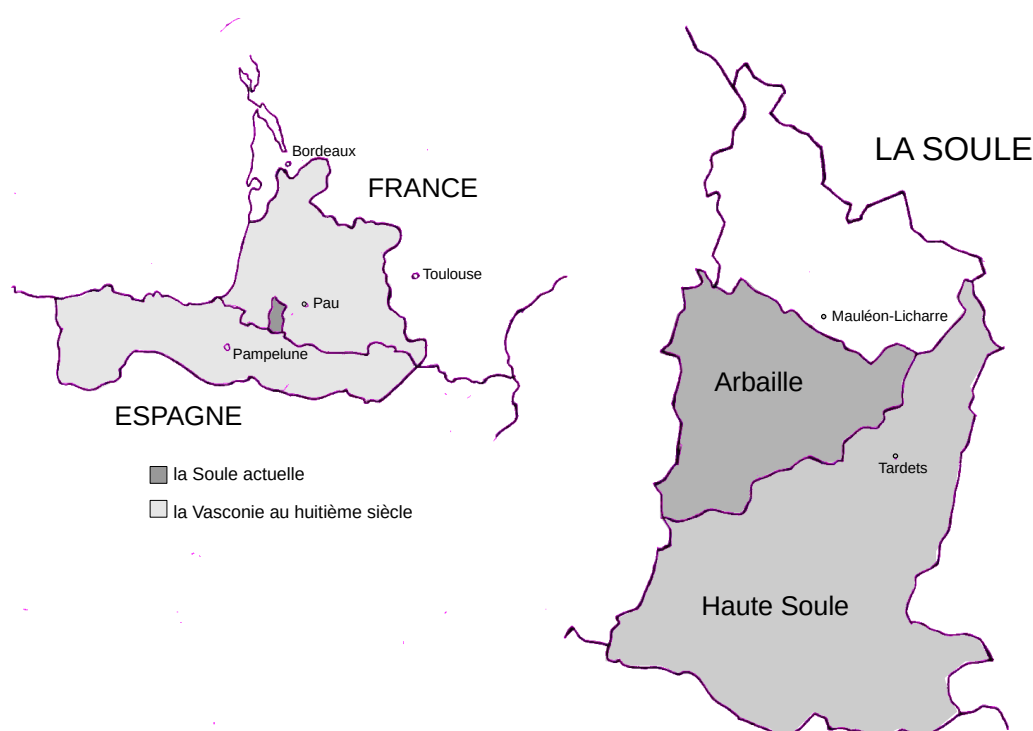
Figure 1 : La Soule avec ses cantons, et sa situation au sein de l'ancien territoire de la Vasconie.

raisons. D'abord parce que les chants et pratiques vocales qui entrent dans cette recherche sont très anciens, et bien qu'on ne puisse pas les dater avec précision, faute de documentation, on peut spéculer sur la présence de chants similaires sur toute l'aire des Pyrénées vasconnes, qui rassemblait jusqu'au onzième siècle au moins une population unie par leurs coutumes et modes de vie sur un territoire qui s'étendait de la côte atlantique jusqu'à l'actuelle Ariège 31 . La langue basque s'est resserrée aujourd'hui sur la partie ouest de la chaîne, mais on trouve ses traces dans la toponymie jusqu'en Catalogne 32 , et on retrouve sur toute la partie vasconne une même forme d'organisation sociale qui témoigne de l'appartenance de ces villages éparpillés à une même grande culture de montagne. Cela nous permet de réfléchir à comment le chant a évolué dans d'autres parties de la chaîne, et aux fonctions qu'il aurait pu avoir dans la vie collective de la Vasconie avant son progressif morcèlement par les événements de l'Histoire.