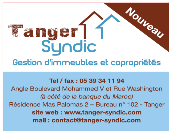
Illustration 1 : Annonce de création du cabinet Tanger Syndic dans un journal local

Cette phase de prospection commerciale intervient dans un environnement où la demande de gestion de syndic est particulièrement élevée ; ce qui a motivé la création du cabinet Tanger Syndic par ses associés. De nouveaux immeubles se sont construits dans la ville en raison de la forte croissance du secteur de la promotion immobilière et de la construction durant la décennie 2000-2010. Le démarrage doit cependant faire face à une