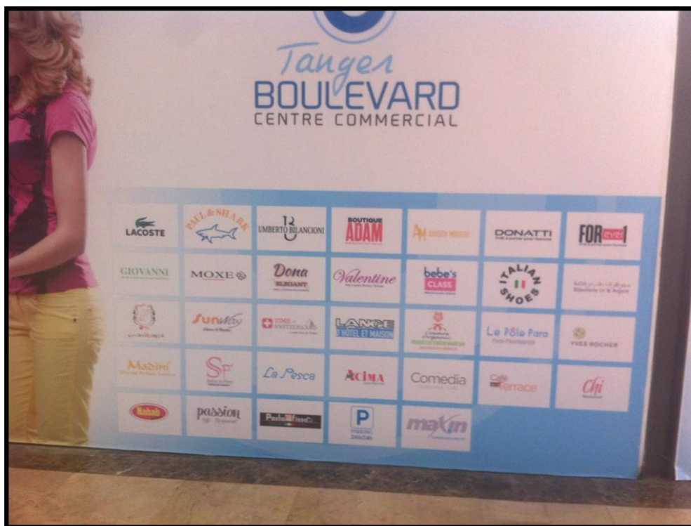
Illustration 4 : Enseigne publicitaire du centre commercial Tanger Boulevard

La constitution précoce du syndicat des copropriétaires pour la partie commerciale a répondu à une exigence principalement économique. Il s'agissait de créer les organes de gestion et de désigner à leur tête les responsables parmi les copropriétaires commerçants afin que l'ouverture de la galerie marchande devienne effective le plus tôt possible. En effet, avec la livraison progressive des locaux par le promoteur, il s'avère primordial d'ouvrir le centre commercial pour que les boutiques puissent démarrer leur activité et notamment le supermarché géré par l'enseigne Acima.