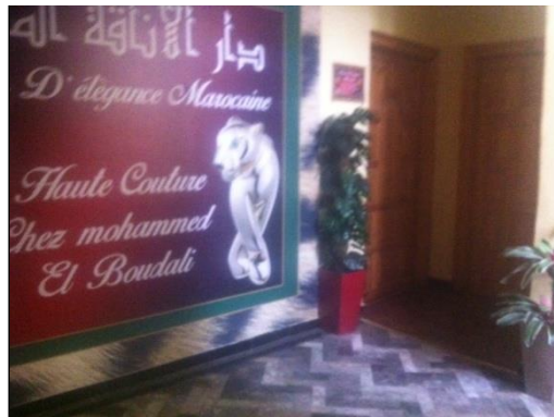
Illustration 2 : Couloir commun transformé en espace commercial par un copropriétaire de Tanger Boulevard

Les commerçants font de même. Certains choisissent un espace vide dans les parties communes pour y entreposer de la marchandise. Une seule règle : être le premier à occuper l'espace vacant. La délimitation des espaces réservés aux terrasses sur la place publique est ici significative pour illustrer mes propos.