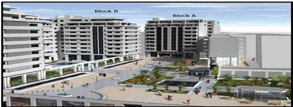
Illustration 3 : Maquette de présentation du projet immobilier Tangerang Boulevard

L'une des particularités de cet ensemble urbain privé réside dans la place publique créée qui se situe donc à l'intérieur de l'enceinte du complexe immobilier. Selon le règlement de copropriété, elle constitue une partie privative du complexe et est ouverte au public selon les conditions fixées par un protocole d'accord entre la commune de Tangerang et le promoteur immobilier. La place permet également l'accès au centre commercial, à certains blocs d'appartements et aux parkings. Cette place, et le complexe pris dans sa globalité, se positionne dans la ville comme une nouvelle centralité urbaine.