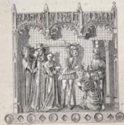
Fragment du retable en bois peint et doré dit « chapelle portative des ducs de Bourgogne » sculpté de 1290 à 1300 par Jacques de Baerze, aujourd'hui au Musée de Dijon.