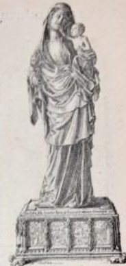
Statue de la Vierge en argent doré, donnée par la reine de France Jeanne d'Evreux, veuve de Charles IV à l'abbaye de Saint-Denis en 1319 (Musée du Louvre).