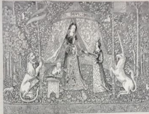
Fragment d'une tapisserie française de la fin du XV e siècle, dite de la Danse et la Licorne (Musée de Cluny).