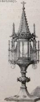
Reliquaire d'argent doré; XV e siècle (Musée du Louvre).