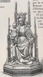
Reliquaire en argent repoussé; début du XV e siècle (Musée de Cluny).