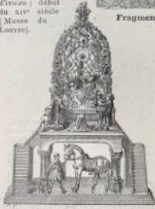
Ouvrage d'orfèvrerie, offert à Charles VI par l'archevêque de Bavière en 1401, conservé aujourd'hui à Albstadt en Bavière, appelé en Allemagne das goldene Rossel (le petit cheval d'or).