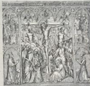
Fragment d'un devant d'autel dessiné sur toile, donné par Charles V à la cathédrale de Narbonne (Musée du Louvre).