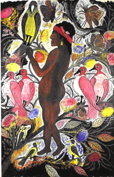
Hector Hyppolite. Maîtresse Erzulie . 1948.

Outre l'évidente relation hypertextuelle avec Forster, Smith insère également dans son œuvre littéraire des références picturales et musicales. Comme pour contredire Howard Belsey qui ne jure que par l'art abstrait et interdit toute forme d'art représentatif chez lui 1 , la voix narrative de On Beauty invite son lectorat à contempler des peintures par le biais d'ekphraseis nombreuses et précises. La première, lors d'une visite de Kiki à Carlene, permet d'évoquer en détail la peinture de l'artiste haïtien Hector Hyppolite, Maîtresse Erzulie (1948). L'œuvre est alors décrite à travers le regard de Kiki Belsey :