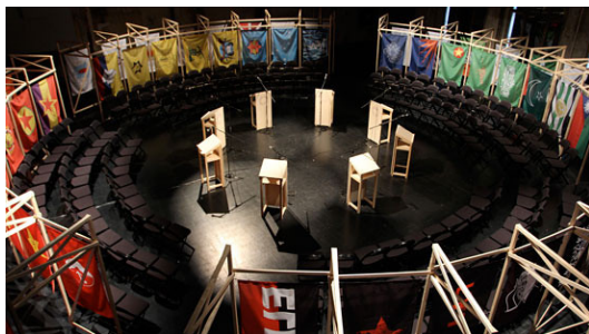
Jonas Staal, The New World Summit , 2012