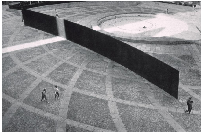
Tilted Arc Richard Serra, 1981

Il faut rappeler que l'objet est aussi sa fonction, son effet et sa capacité (à affecter), etc. Nous pouvons considérer l'objet présenté dans ces trois cas comme un problème, un souci, une question qui intervient, qui provoque des réactions instantanées et qui fonctionnent comme une prise dans la construction du public comme un peuple à venir. Par rapport à Tilted Arc (1981) en tant que sculpture comme art public qui ne