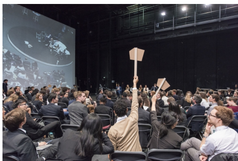
Théâtre des négociations' aux Amandiers

« Il n'y a pas de monde commun. Il n'y en a jamais eu. Le pluralisme est avec nous pour toujours. Pluralisme des cultures, oui, des idéologies, des opinions, des sentiments, des religions, des passions, mais pluralisme des natures aussi, des relations avec les mondes vivants, matériels et aussi avec les mondes spirituels. » 239