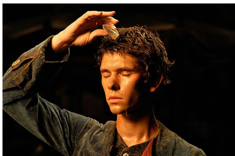
L'extrait du film, Tom Tykwer, « Le Parfum, Histoire d'un meurtrier », 2006