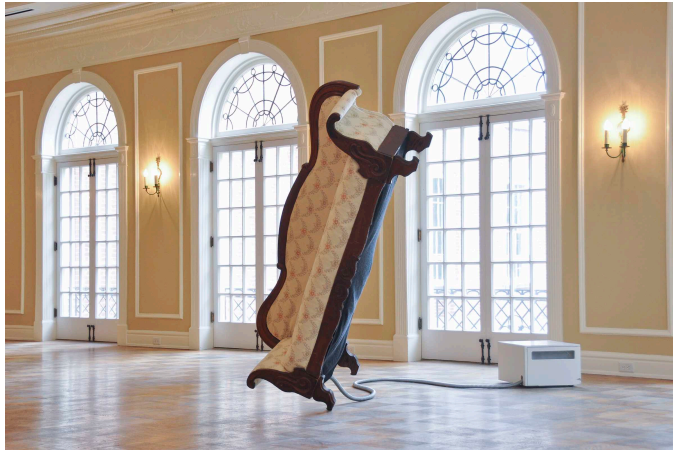
Jacob Tonski, Balance From Within , 2012

D'une manière délicate, avec tout un mécanisme à l'intérieur, un canapé datant de 170 ans, se balance précairement et continuellement sur une jambe.