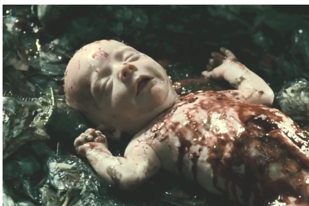
L'extrait du film, Tom Tykwer, « Le Parfum, Histoire d'un meurtrier », 2006

Le héros du film, le parfumeur meurtrier, se nomme Jean Baptiste Grenouille, et son nom souligne tout de suite une dimension Kafkaïenne. Le parfumeur Grenouille pourrait être considéré comme créateur, praticien doué, hypersensible aux flux, c'est à dire, les sensations, les affects, les idées, les inspirations, etc. Son talent, sa différence surhumaine est sa capacité particulière de l'odorat, sens le plus incarné et le plus abstrait. Il est plutôt un être de la nature, né parmi les forces de matières des déchets organiques et non pas dans les bras de sa mère humaine, qui le jeta plutôt à la poubelle des poissons (rappelant par ailleurs le compost de la vie et la mort.) Plus sensible aux matières qu'aux sujets humains, ainsi, il est depuis petit considéré comme autre, étranger, « alien » par son entourage.