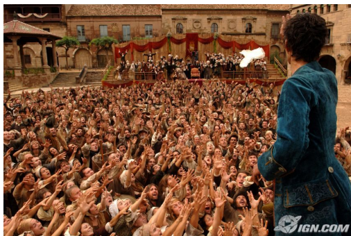
L'extrait du film, Tom Tykwer, « Le Parfum, Histoire d'un meurtrier », 2006

Pour nous, lorsque Isabelles Stengers met l'accent sur « revenir sur terre » dans le geste de l'engagement spéculatif, c'est surtout revenir à un monde situé au niveau, à dimension humaine, dont l'éthique, la morale, etc. après avoir vécu l'expérience de l'Infini qui nous dépasse. C'est de revenir parmi « nous », dans « ce monde », et pas dans d'autres multiplicités composées d'autres dimensions. Sinon, nous ne verrions plus la vie et la mort sur Terre, en gardant perpétuellement en tête une perspective cosmique, comme dans le cas de Grenouille. Cela pose d'énormes soucis sociaux aux « autres » humains, comme non-humains qui partagent ce monde habitable « sur terre ». Pour nous, le fait de sacrifier les « autres » être humains pour réaliser l'œuvre transcendante, reste une vision centrée sur « le sujet », que ce soit anthropocentrique, individualiste. C'est cette logique qui permet de sacrifier sans hésitation les autres comme « la nature », « les non-humains », pour satisfaire la production économique humaine, dont le parfum « normal ». C'est ce dont les nouveaux matérialistes essaient de se sortir. Surtout, ils rappellent sans cesse le besoin d'une nouvelle éthique, d'une nouvelle politique, dans une nouvelle perspective. Parce qu'en dépassant la dimension humaine, tout de suite nous voyons autrement la distinction entre la vie et la mort, le sujet et le collectif et ainsi de suite.