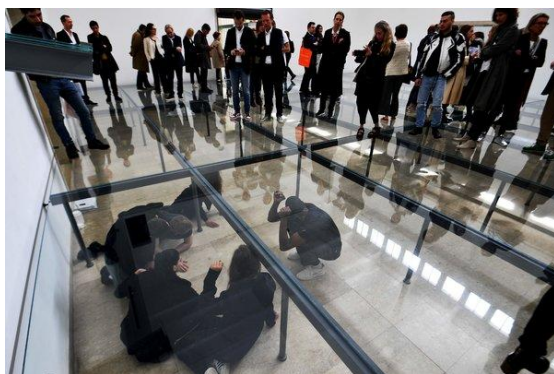
Faust , 2017, Anne Imhof, présenté au Pavillon allemand de la Biennale de Venise

Dans Faust , 2017 présenté lors de la Biennale de Venise, nous remarquons la création systématique d'une « production » affective grâce à la mise-en-espace de l'exposition. Elle forme en réalité une mise en situation de son public, comme dans un dispositif produisant efficacement une angoisse. A l'intérieur du Pavillon, le sol a été rehaussé, de sorte que les visiteurs marchent sur une plaque de verre transparente maintenue par des pilotis d'acier, d'autres parois de verre et d'acier se dressent et compartimentent les différents espaces. L'architecture, aux connotations de fascisme historique, a été installée pour l'occasion, et rappelle également la transparence glacée des vitrines de magasins de luxe et des banques d'où surgit le pouvoir. Cette mise-en-espace fait ressurgir en quelques sorte la précarisation gouvernementale ainsi que l'obligation de participer qui est devenue, finalement, institutionnelle. La participation productive de