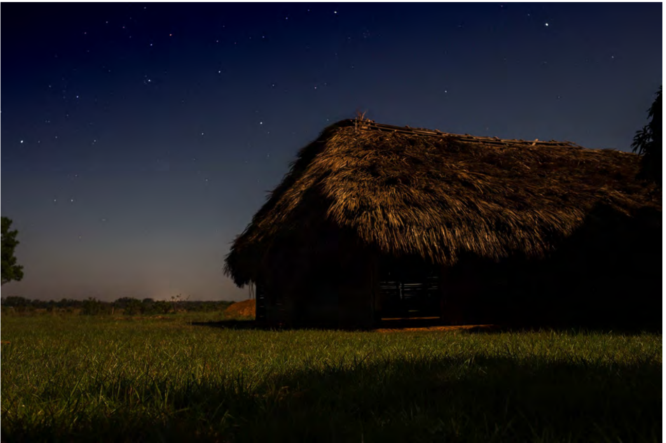
Liweisi-Bo, village Kalia Wirinae