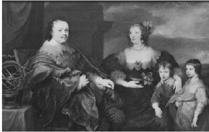
Figure 5 : Sir Kenelm Digby, Venetia and their two eldest sons, peint par Anthony Van Dyck. Huile sur toile, 137,8 cm x 210,8 cm. Collection privée.

qui signalent que, si le cercle est de plus en plus rare dans la nature, il n'en demeure pas moins un idéal divin auquel l'homme peut participer.