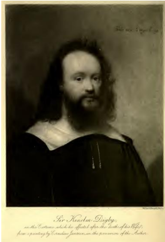
Figure 2 : Portrait de Digby fait à partir d'une peinture de Cornelius Janssens, 1634

Les biographes de Digby rapportent que Digby se retire alors au collège de Gresham, l'une des grandes institutions intellectuelles de Londres fondée au siècle précédent où l'on enseignait des sujets divers tout en promouvant la retraite intellectuelle, l' otium latin 1 . Plusieurs personnes oscillaient entre le cercle de Deptford et le collège de Gresham, et les questions qui y étaient débattues n'étaient pas inconnues de Digby. Peut-être cependant n'y a-t-il là qu'un avatar de la mise en scène de son deuil : les écrits de 1634 reflètent en effet une introspection significative, mais rien ne prouve qu'elle ait eu lieu à Gresham, alors que Digby a pour habitude de faire valoir ses relations avec les