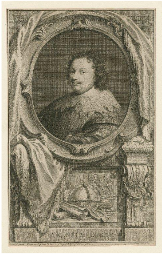
Figure 1 : Portrait de Digby inclus dans Oplomachia , Folger Library.

manuscripts, 95 sont issus de sa collection personnelle 1 , ce qui donne une indication fiable tant de ses moyens matériels que de son goût pour les ouvrages.