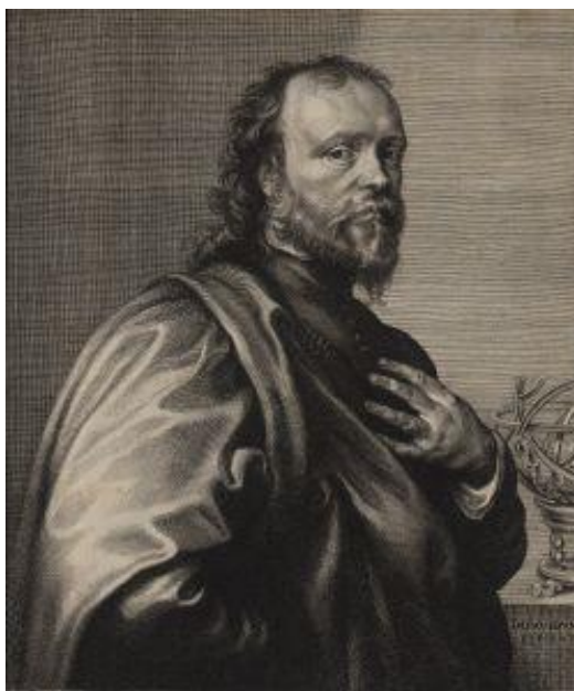
Figure 6 : portrait de Digby avec la sphère armillaire, gravure faite à partir du portrait peint par Van Dyck pour Iconography de R. Van Voerst.

avec la devise attenante qui semble contredire l'impassibilité stoïque. Le cercle figure la mémoire ou le discours, mais aussi la notion, unité suffisante, entière et indépendante 1 . Le labeur de la science, explique le chevalier, englobe toute la connaissance possible dans un vaste cercle que l'homme ne peut que découvrir petit à petit 2 . Dans un élan lyrique où il s'adresse à son âme, Digby souligne que la connaissance s'apparente à la figure parfaite du cercle – qu'il compare au chaînon – qui explique l'ensemble des phénomènes physiques et métaphysiques 3 . La chaîne d'or, chaîne causale qui comprend toutes les possibilités, peut être résumée à un unique chaînon, puisqu'il est possible à l'âme désincarnée d'acquérir l'ensemble du savoir de manière instantanée, grâce à la connexion intime que partagent toutes choses. Or, le chaînon est d'ordinaire présenté sous une forme oblongue : Digby hésite entre le cercle et sa contrepartie déformée pour dire la perfection de la connaissance. L'image du cercle évolue sous sa plume.