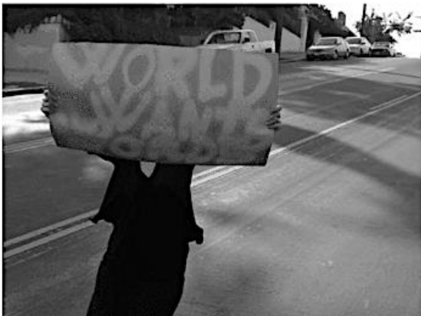
Céline Ahond, World wants word , performance, 30 mars 2013, à Public Fiction, Los Angeles