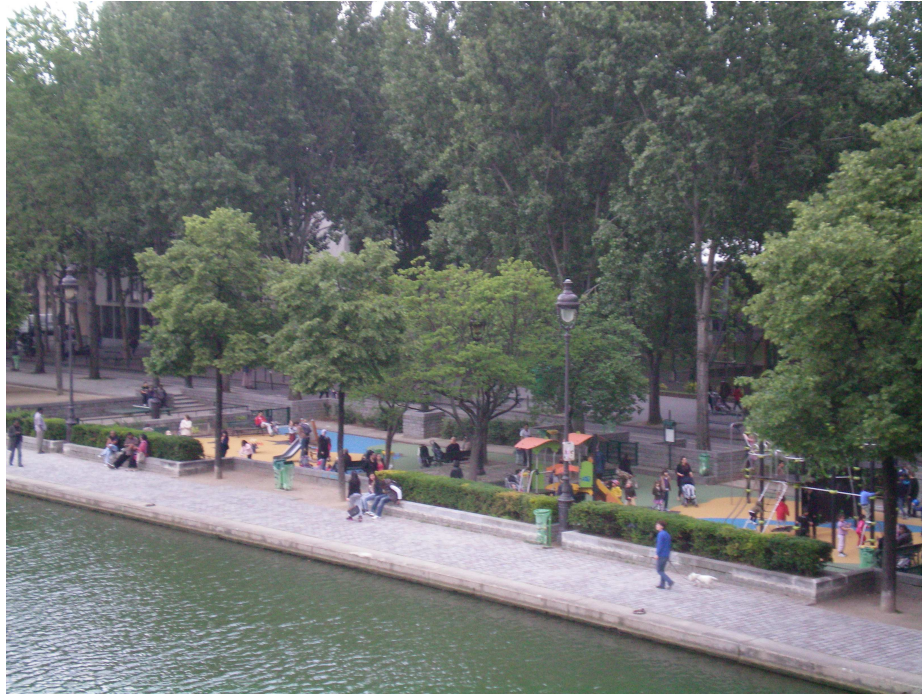
Photo n° 8 – Sur le quai de la Loire, un espace protégé pour les plus jeunes

La demande des enfants qui grandissent n'est toutefois pas seule à entrer en compte, les espaces protégés se trouvant en effet associés par les parents à des ambiances distinctes. Des parcs sont ainsi considérés comme plus « familiaux » que d'autres : on relève notamment une opposition forte sur le terrain parisien entre le parc des Buttes-Chaumont et le parc de la Butte du Chapeau-Rouge, ce dernier étant présenté par de nombreux parents comme un lieu où l'on peut se retrouver pour pique-niquer le week-end entre amis sans avoir besoin de s'organiser à l'avance. Ainsi qu'Alexis Trémoulinas l'a relevé au sujet des parties de football informelles qui se déroulent de manière régulière dans certains lieux ouverts à tous, un « common knowledge local » se constitue, associant des espaces à des pratiques 48 .