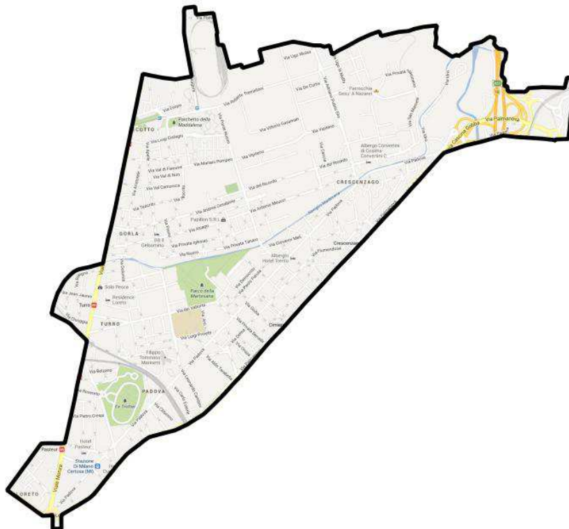
Carte n° 3 - Le triangle Monza-Padova

Échelle 1/33 000. Fond : Contours aree funzionali .