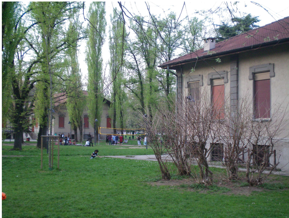
Photo n° 6 – Deux « pavillons » de l'école située dans l'enceinte du Parco Trotter