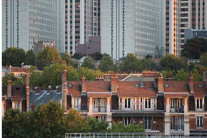
Photo n° 3 - Maisons ouvrières de la Mouzaïa et tours de la place des Fêtes

d'ouvrières du lotissement de la Mouzaïa, sorties de terre au tournant du XX e siècle (voir photo n° 3).