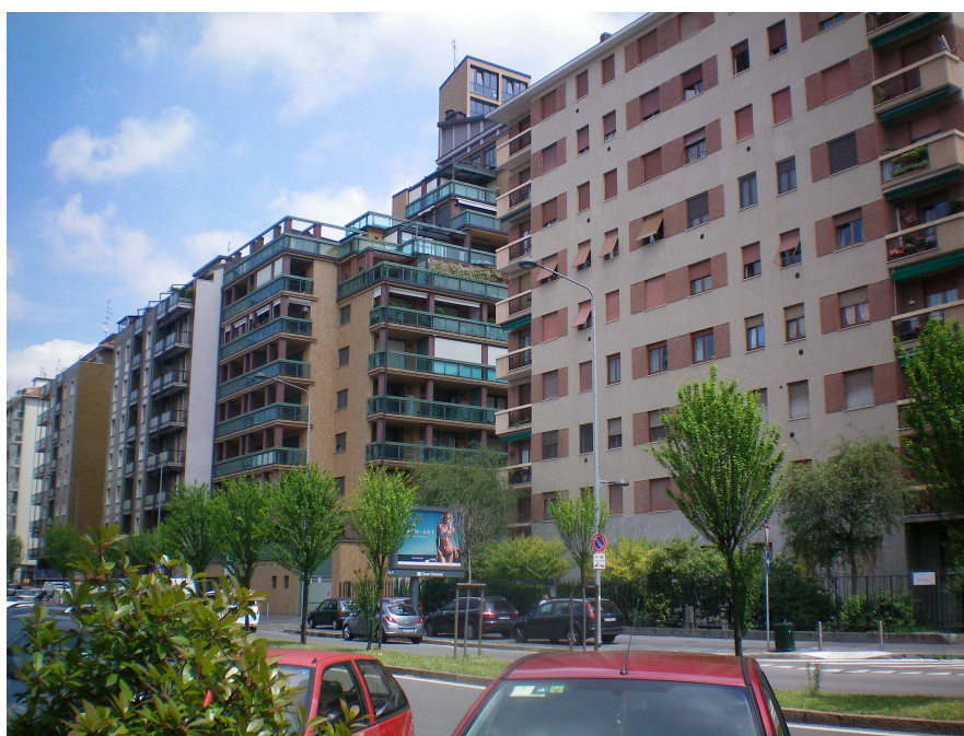
Photo n° 5 – Immeubles caractéristiques de la construction massive des années 1950-60, viale Monza

Nous avons vu que l'urbanisation du triangle Monza-Padova ne peut se comprendre sans prendre en compte le processus d'industrialisation, et plus précisément la situation privilégiée