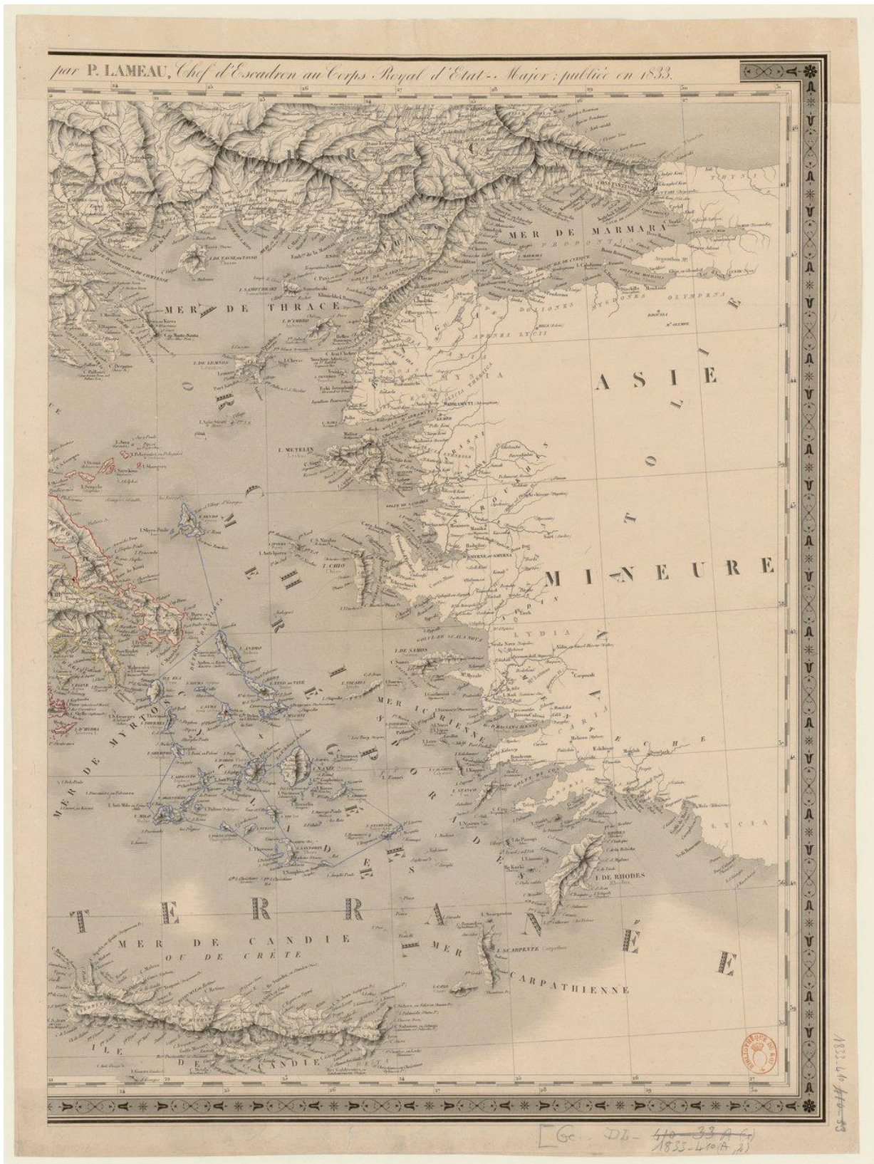
Carte du royaume de la Grèce divisée en 10 départements (partie 2) par P. Lameau, chef d'escadron au corps royal d'état-major. 1833.