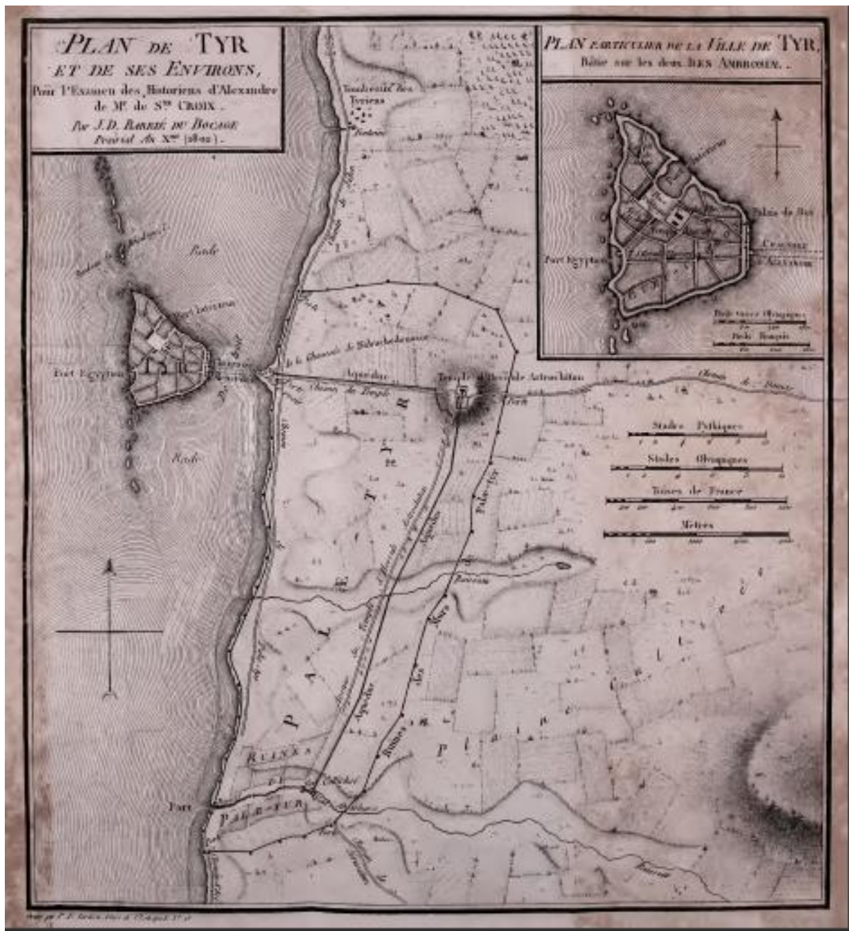
Plan de Tyr et de ses environs, G. de Sainte-Croix, Examen critique des anciens historiens d'Alexandre le Grand , 1804