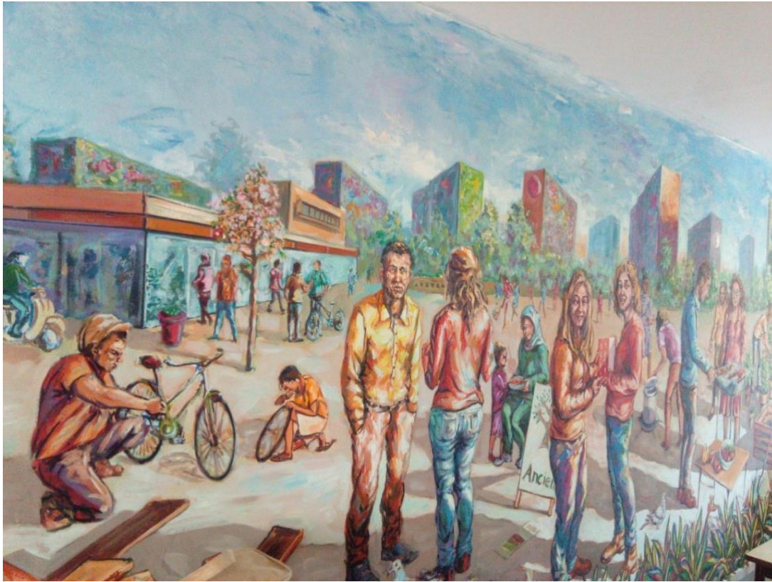
Photo 15 : section centrale de la fresque murale à la «Maison pour agir». Photo du 15/04/2018, A.M.