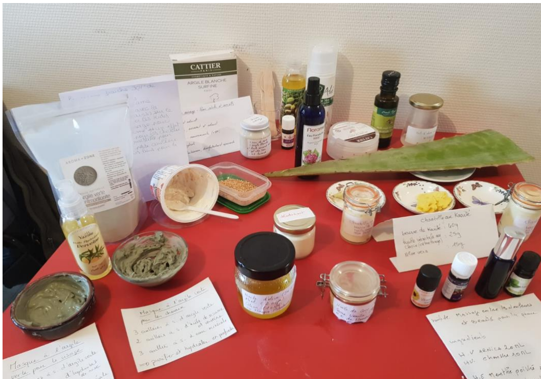
Photo 8 : ensemble de recettes de cosmétiques écologiques. Photo du 8/02/2019, A.M.