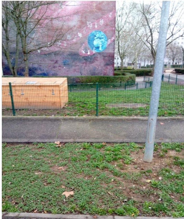
Photo 7 : le composteur des Noirettes, près de la façade d'un immeuble de quartier représentant une fresque murale. Photo du 30/01/2018, A.M.