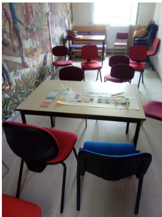
Photo 4 : la salle du fond de la «Maison pour agir» (pièce 3), scène d'un atelier « quizz ». Photo du 12/04/2018, A.M.