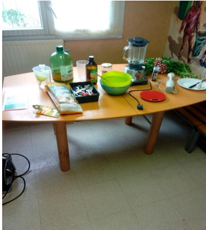
Photo 11 : équipement et ingrédients culinaires pour les ateliers de cuisine. Photo du 29/09/2017, A.M.