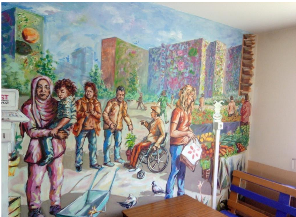
Photo 14 : section droite de la fresque murale à la «Maison pour agir». Photo du 15/04/2018