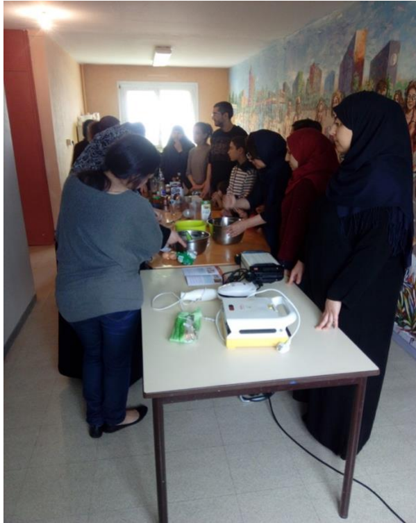
Photo 5 : préparation d'un atelier de cuisine. Photo du 10/04/2018, A.M.