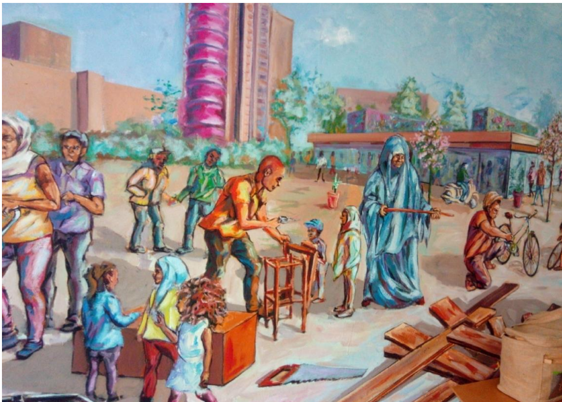
Photo 16 : section gauche de la fresque murale à la «Maison pour agir». Photo du 15/04/2018, A.M.