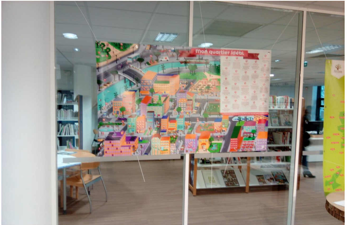
Photo 13 : la bâche « Mon quartier idéal » d'Anciela à la Maison de l'Environnement, Lyon. Photo du 18/01/2018