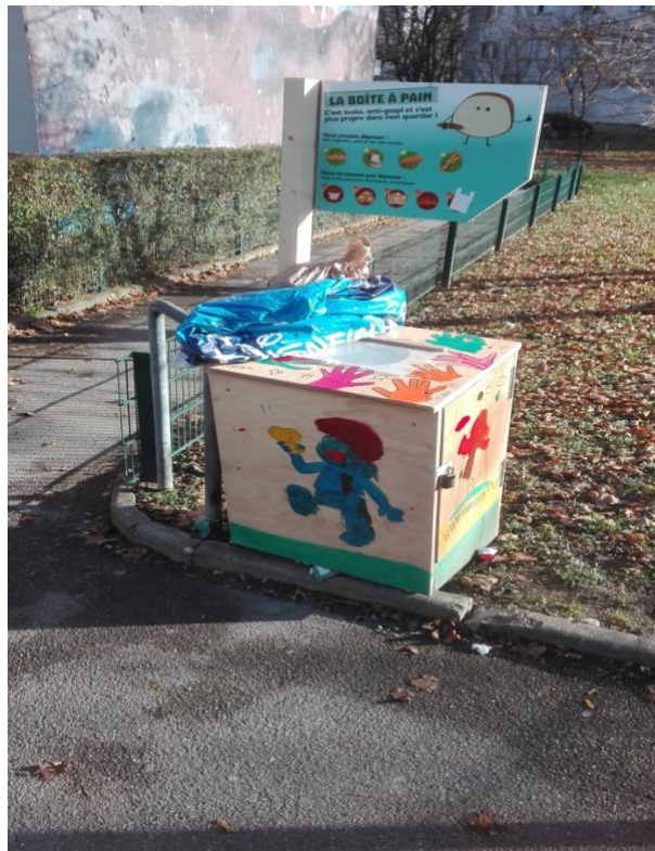
Photo 12 : « boîte à pain » installée près de la Maison pour agir. Photo du 2/12/2019, A.M.