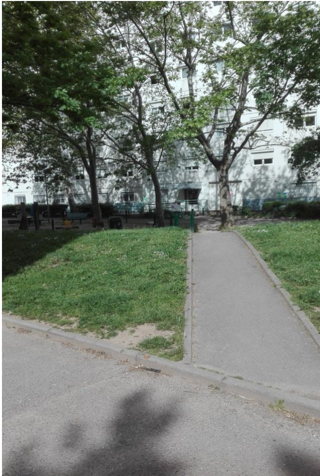
Image 1 : cour interne enchâssée entre deux immeubles dans le secteur des Noirettes, Vaulx-en-Velin. Au dernier plan : raccourci d'une façade des fenêtres et de la porte postérieures des locaux de la «Maison pour agir», au rez-de-chaussée d'un immeuble. Photo du 7/05/2018, A.M.