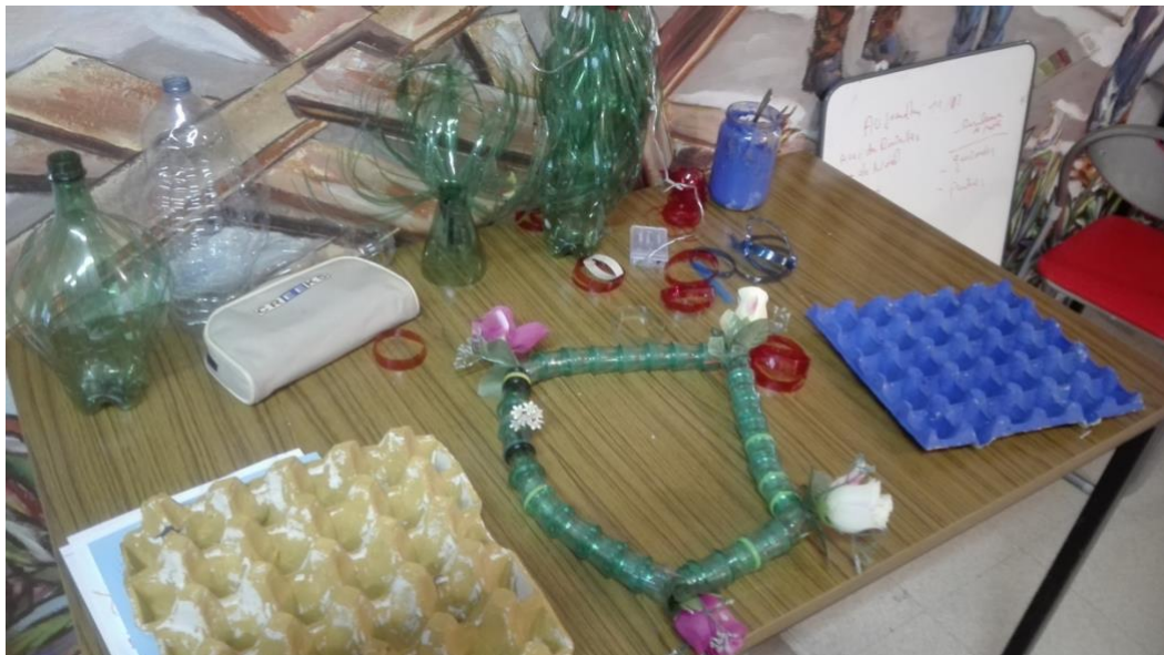
Photo 10 : bricoles artistiques à partir de bouteilles en plastique et boîtes d'œufs récupérées. Photo du 7/05/2019, A.M.