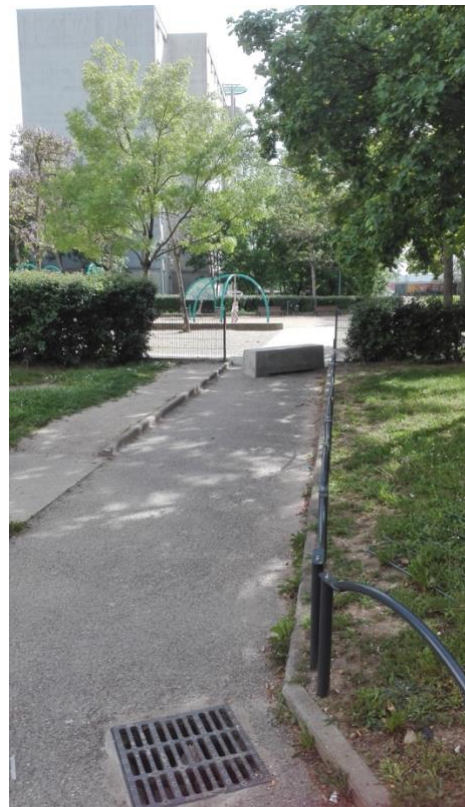
Image 2 : une autre vision de la cour adjacente à la «Maison pour agir». Photo du 7/05/2018, A.M.