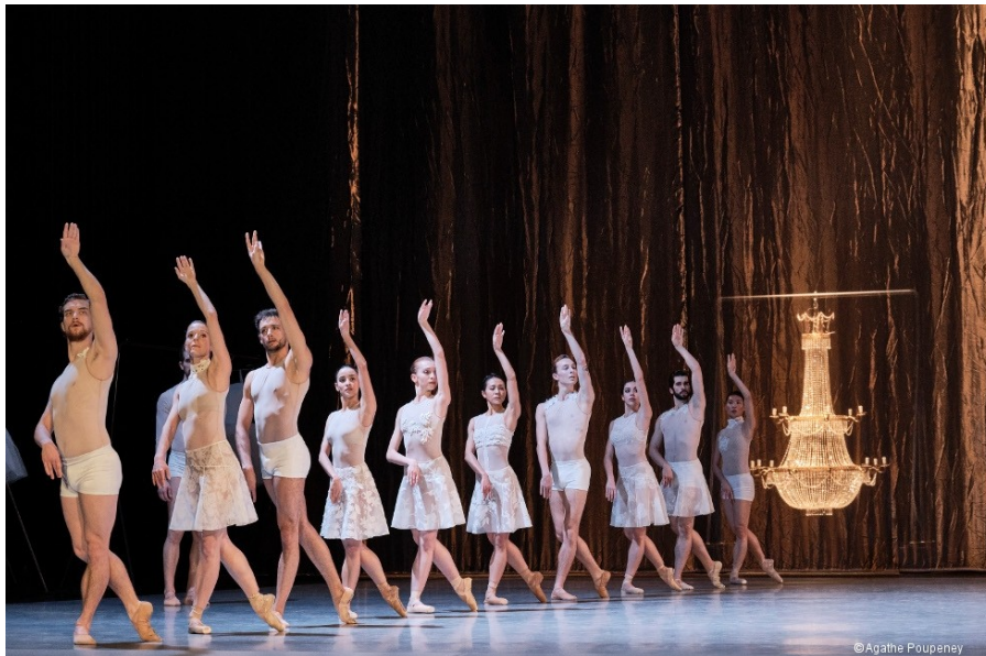
Image 1- Ligne mixte de cygnes dans Le Lac des cygnes de Radhouane El Meddeb.

dimension genrée. À l'inverse, après qu'ils ont formé tous ensemble des lignes de cygnes mixtes (cf. image 1 ), les femmes partent à l'avant-scène : incarnant seuls les ports de tête et de bras 16 qui convoquent tout un imaginaire des danseuses-cygnes du Lac , les hommes donnent à en voir l'étrangeté. Plutôt que de se fondre dans une uniformité de corps de ballet 17 , chacun colore singulièrement cette position, par une orientation du regard, une cassure ou un effacement des articulations, une ouverture de la main, qui diffèrent d'un interprète à l'autre.