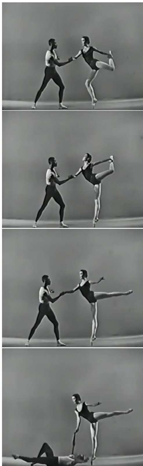
Image 3 – Diana Adams et Arthur Mitchell dans Agôn de George Balanchine (1960).