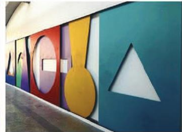
L'expérience de la géométrie et des nuances.

sont associées à la première syllabe de celle-ci, la couleur violette devient alors le son « VI ». L'atelier amène les enfants à prendre contact les uns avec les autres, ils se questionnent, s'entraident. Un premier concert débute par tapements sur les tabourets de couleurs. Tous