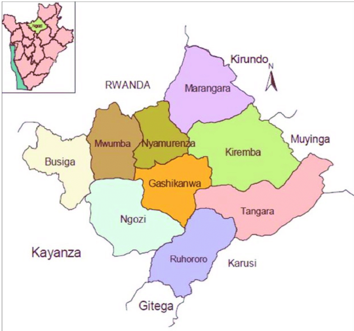
Carte 2. Communes de la Province de Ngozi, Burundi

© Ministère burundais de la planification du développement et de la reconstruction nationale, Localisation de la province de Ngozi au Nord du Burundi [document cartographique], 2006, échelle inconnue, telle que reproduite dans Tatie Masharabu, François Havyarimana, Eric Niyonkuru, Jacques Nkengurutse, Paul Hakizimana, Frédéric Bangirinama, « Diversité, distribution et conservation des essences ligneuses autochtones en paysage anthropisé au Burundi: cas de la Zone Musenyi en Commune Tangara », 2018.