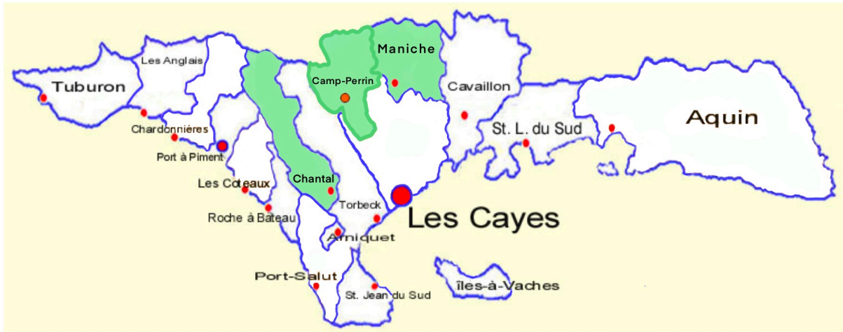
Carte 4. Communes du département du Sud, Haïti