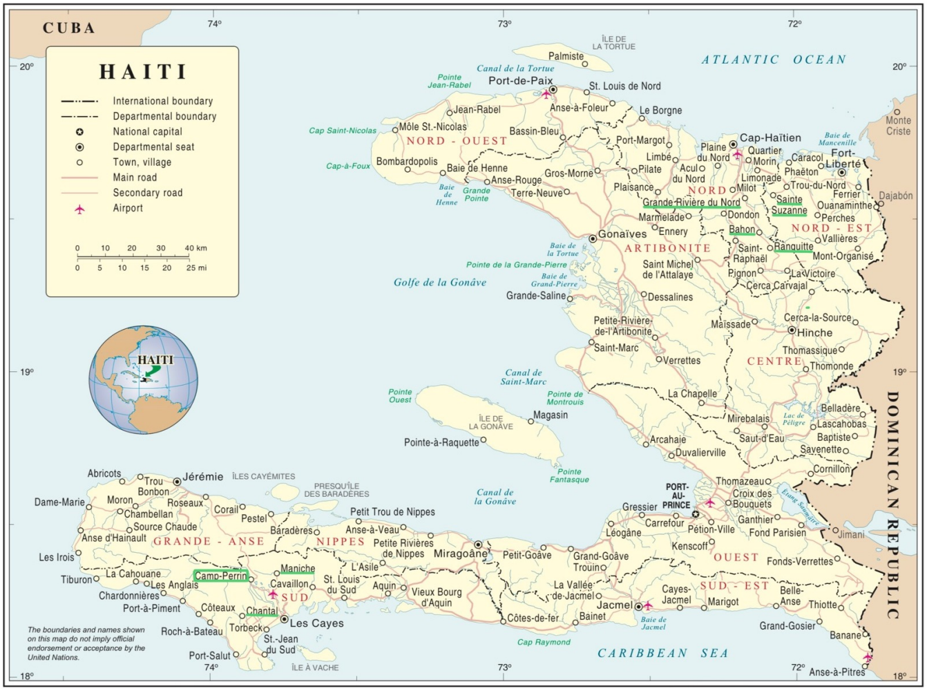
Map No. 3855 Rev. 5 UNITED NATIONS February 2016 Department of Field Support Geospatial Information Section (formerly Cartographic Section)

© Section de la Cartographie de l'ONU, carte administrative d'Haïti, carte n° 3855, février 2016.