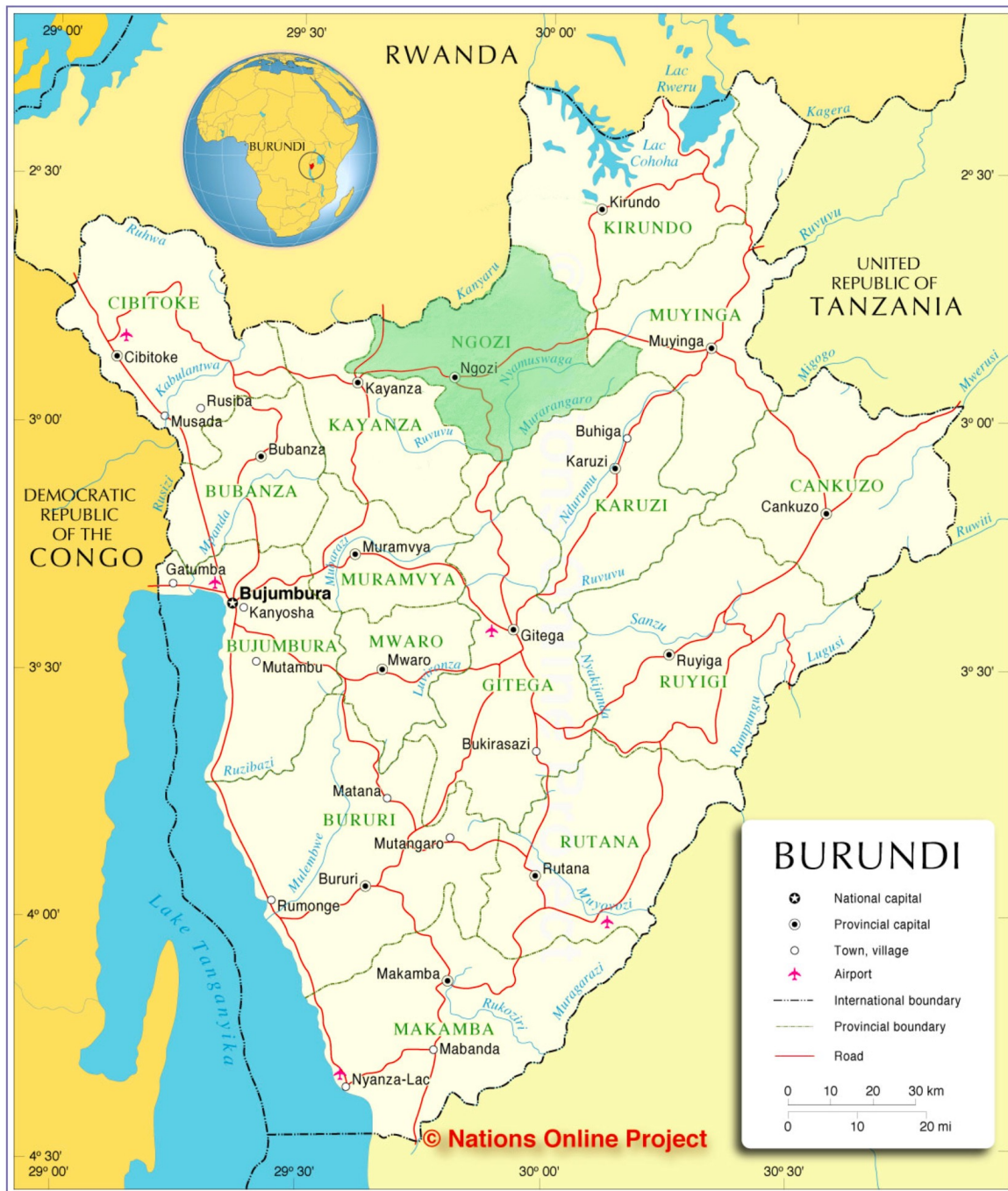
Carte administrative du Burundi [document cartographique], basée sur la carte n° 3753 de la Section de la Cartographie de l'ONU, juin 2019.