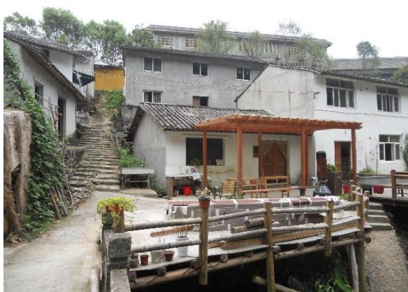
Salles de classe et bibliothèque après 2015