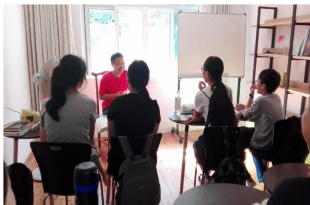
Cours dujing , classe des grands en 2016