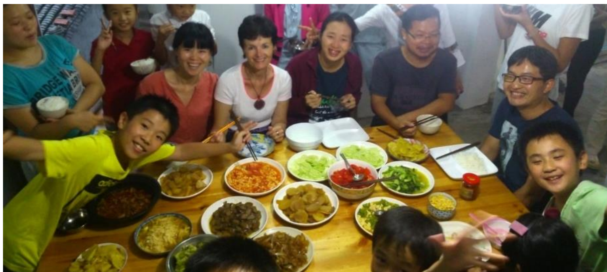
Cantine en 2015, repas fait par les enfants le jour du maître

Même si la responsable est devenue végétarienne dans les années 2015, elle n'impose pas de régime particulier pour l'école, mais donne la priorité à une alimentation basée sur des produits frais. Régulièrement les courses sont faites dans les marchés des environs profitant des produits locaux pour constituer la base de l'alimentation. Une fois par semaine les enfants, garçons et filles préparent les repas.