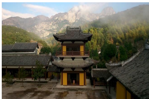
Temple bouddhiste derrière l'école