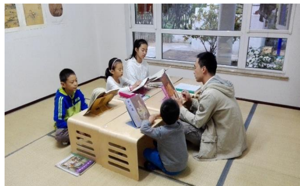
Lecture les élèves les plus anciens, 2016