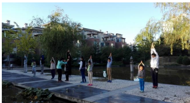
Classe matinale de qigong, 2016