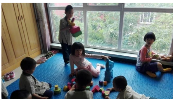
Récréation des petits