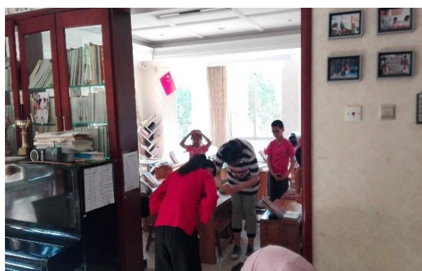
Salutation à la maîtresse 2016