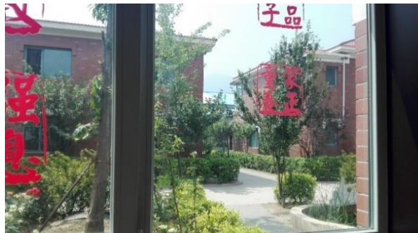
Vue de la fenêtre du plus grand bâtiment