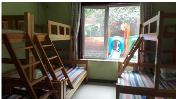
Un des dortoirs des petits