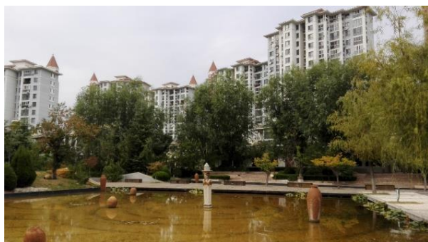
Quartier fermé où est située l'école