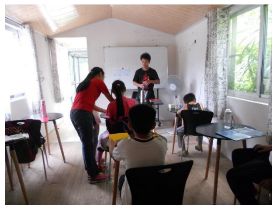
Cours de mathématiques des petits en 2017