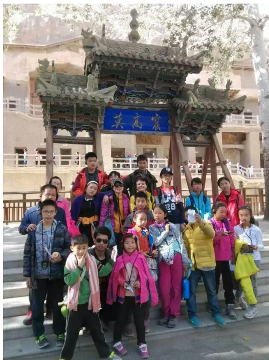
Voyage d'études à Dunhuang, 2015