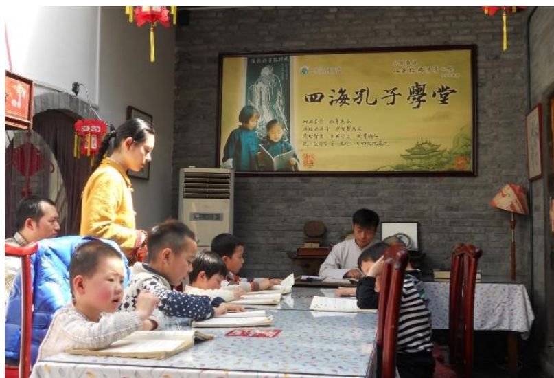
Classe dominicale à Pékin

récitation du Dizigui. Lors d'occasions particulières le restaurant propose aux parents et aux enfants des cours pour fabriquer du savon naturel, ou du modelage avec de la pâte et des colorants végétaux ( 面塑), ou encore certains plats.