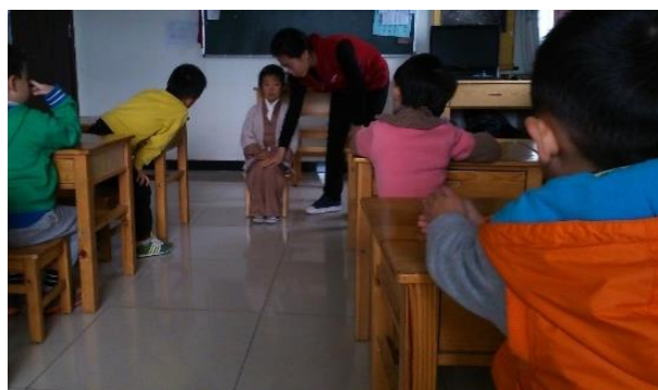
Cours de xiushen 修身