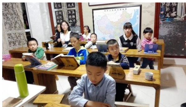
Lecture le soir par toute la classe, 2016