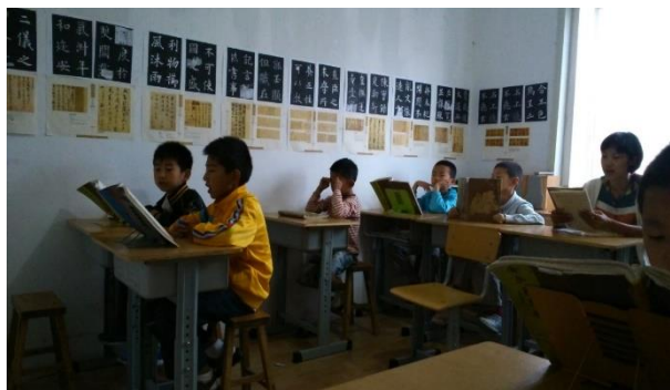
Lecture avant le petit-déjeuner 2014