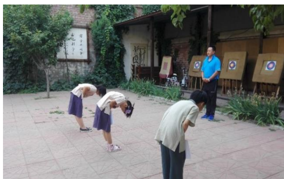
Cours d'archerie : salutation cours