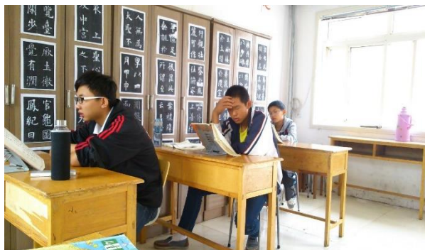
Lecture, la classe des grands 2014