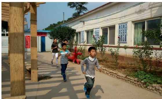
Course pendant la récréation 2014