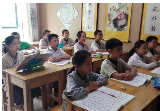
Classe de lecture des classiques, dujing