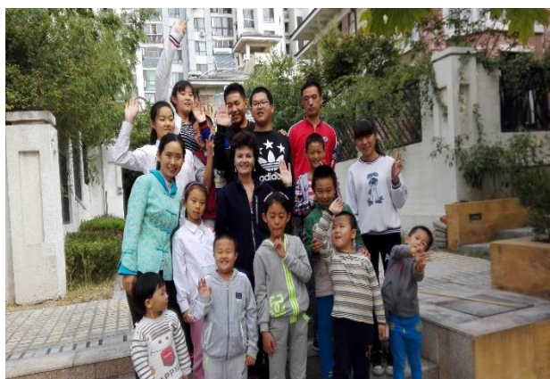
Classe de 2016