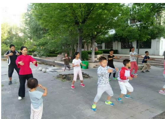
Classe occasionnelle de taichi 2016