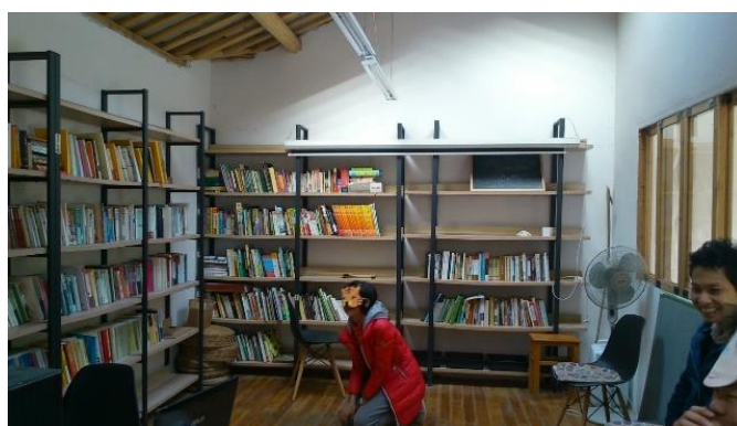
Cours de théâtre à la bibliothèque