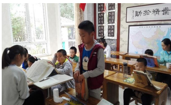
Lecture, les nouveaux élèves, 2016