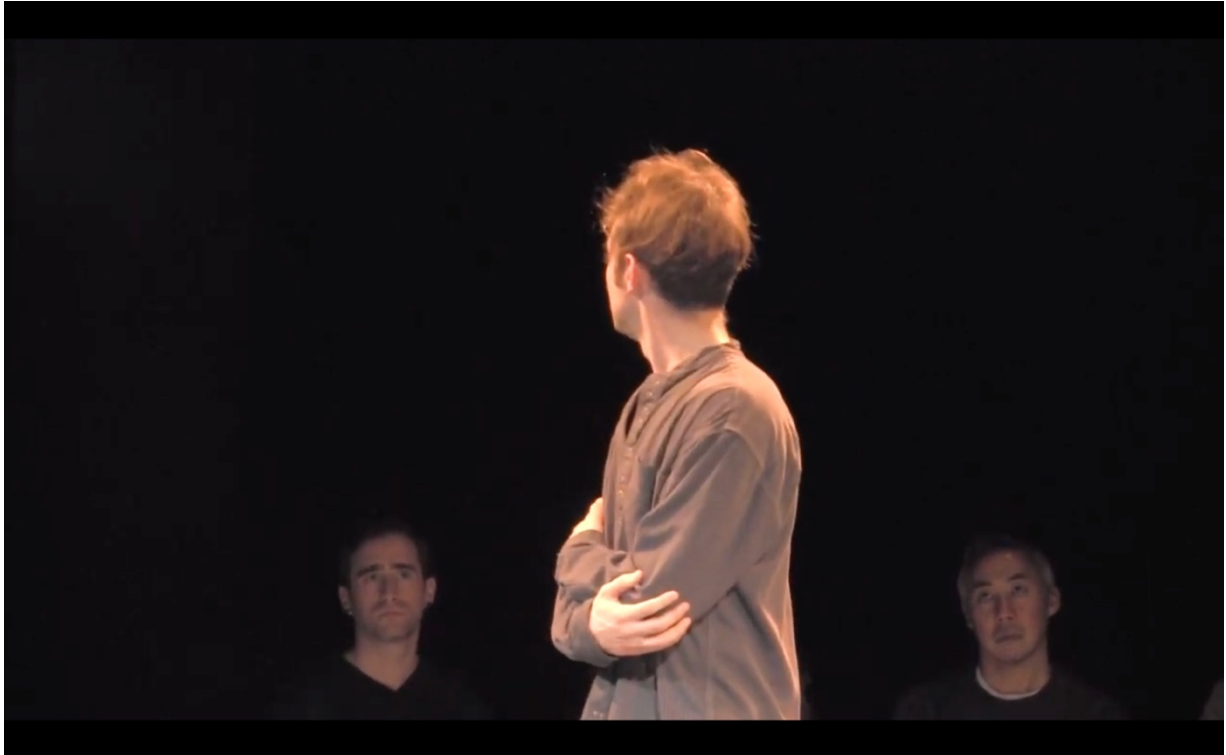
Illustration 7 The Dreaming of the Bones. Le Jeune Homme. DancePlayers Company.

Puis il se tourne en direction de l'endroit où le couple de fantômes a disparu, signe d'un manque de fermeté et d'un possible sentiment de regret :