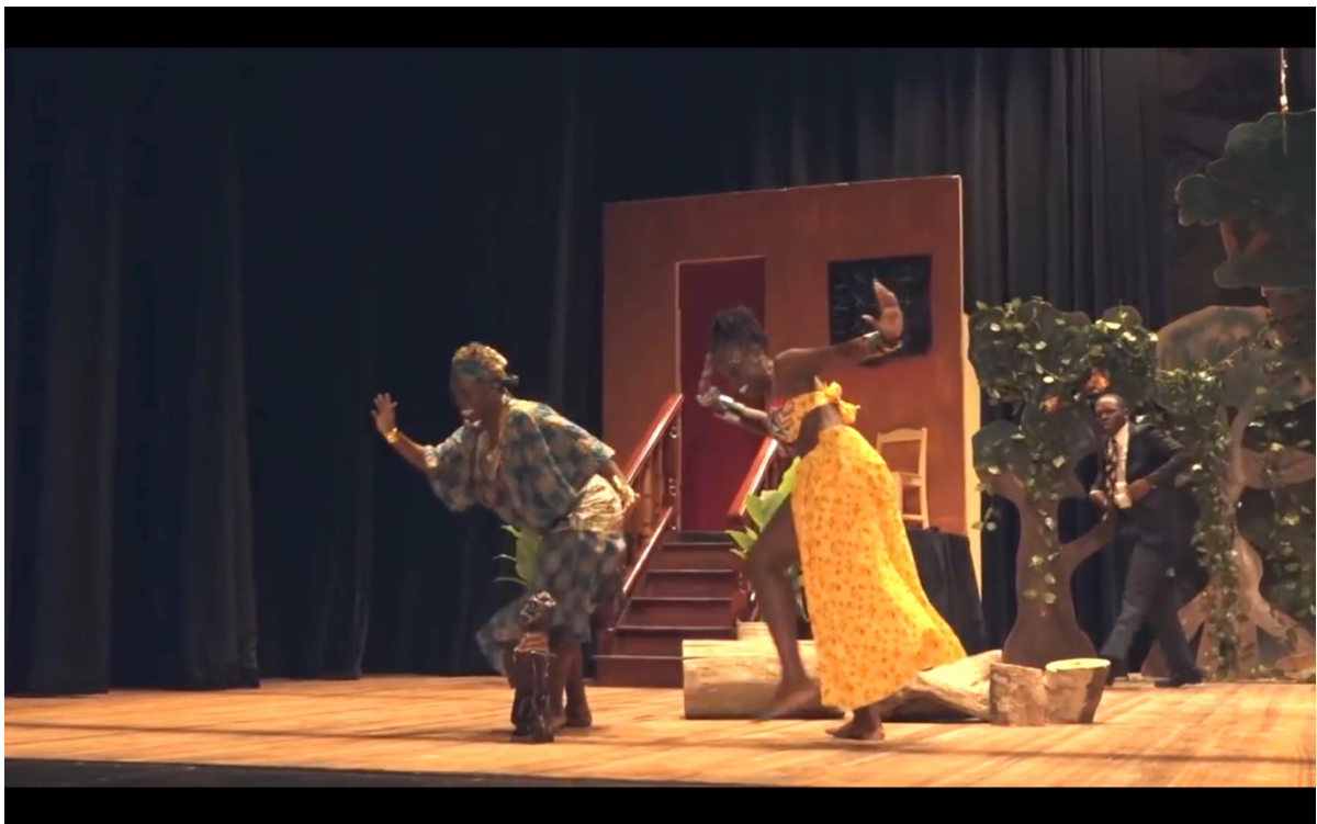
Illustration 11 The Lion and the Jewel. Sadiku et Sidi dansent avec exaltation autour de la statuette du bale. National Drama Company of Guyana.

apparaît alors comme le couronnement d'un duel matérialisé sur la scène et non comme le simple redoublement de l'amertume et de la hargne verbales de Sadiku. La danse de cette dernière autour de Baroka peut ainsi s'interpréter comme une manière indirecte de répondre avec ironie aux préjugés d'hommes de pouvoir tels que le lion d'Ilujinle qui prétendent que le « monde tourne autour d'eux » (« like the foolish top you think the world revolves around you »). En l'occurrence, la statuette de Baroka se voit encerclée par une chorégraphie qui loin de se confondre avec les tournoiements stériles de la toupie, fait signe vers un horizon nouveau, celui de la liberté du corps et de l'esprit des femmes 390 , d'autant plus que Sidi rejoint bientôt Sadiku dans sa danse rebelle :