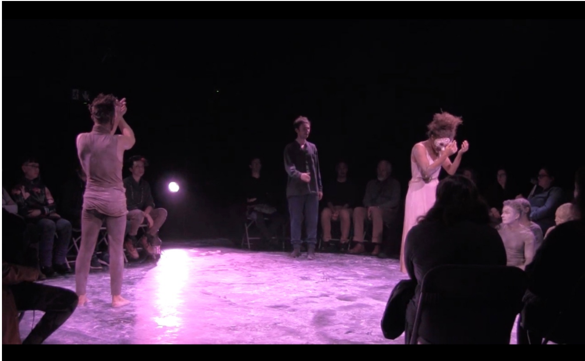
Illustration 6 The Dreaming of the Bones. Le Jeune Homme esquisse un geste amical vers Devorgilla. DancePlayers Company.

agressif s'adoucit vite, laissant place à un ton plus méditatif. À un moment donné, le Jeune Homme va même jusqu'à tendre le bras vers Devorgilla – qui a le dos tourné et couvre ses yeux de ses mains comme l'indique le texte (Yeats 2001 : 315) – avant de se reprendre et de prononcer les mots fatidiques « Never, never / Shall Diarmuid and Devorgilla be forgiven » :