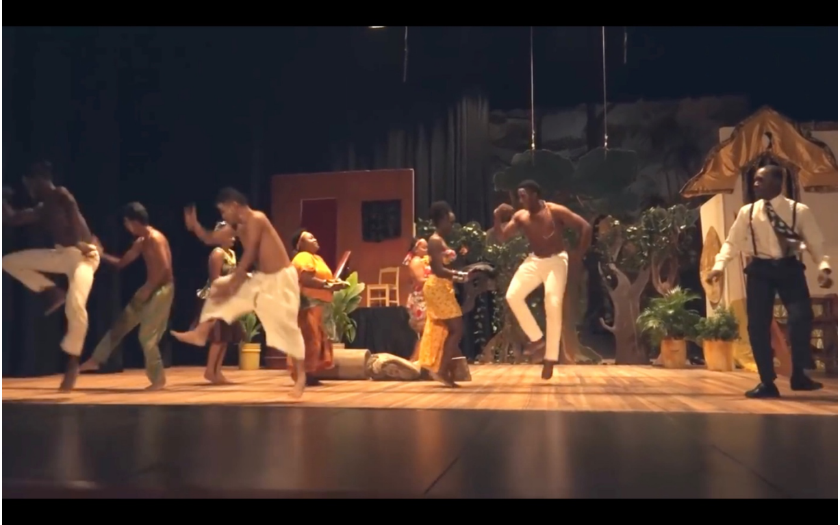
Illustration 8 The Lion and the Jewel . Lakunle sur la droite. National Drama Company of Guyana. National Cultural Centre.

Lakunle apparaît ici comme un être emprunté. Maître d'école, il en est pourtant réduit à essayer de copier, tel un cancre, la gestuelle dynamique et virile des autres personnages masculins, comme le montre son regard tourné vers eux. Les bras ballants et le corps crispé, Lakunle est en retard ; ses pieds plats ne lui permettent pas de danser avec l'aisance des autres personnages.