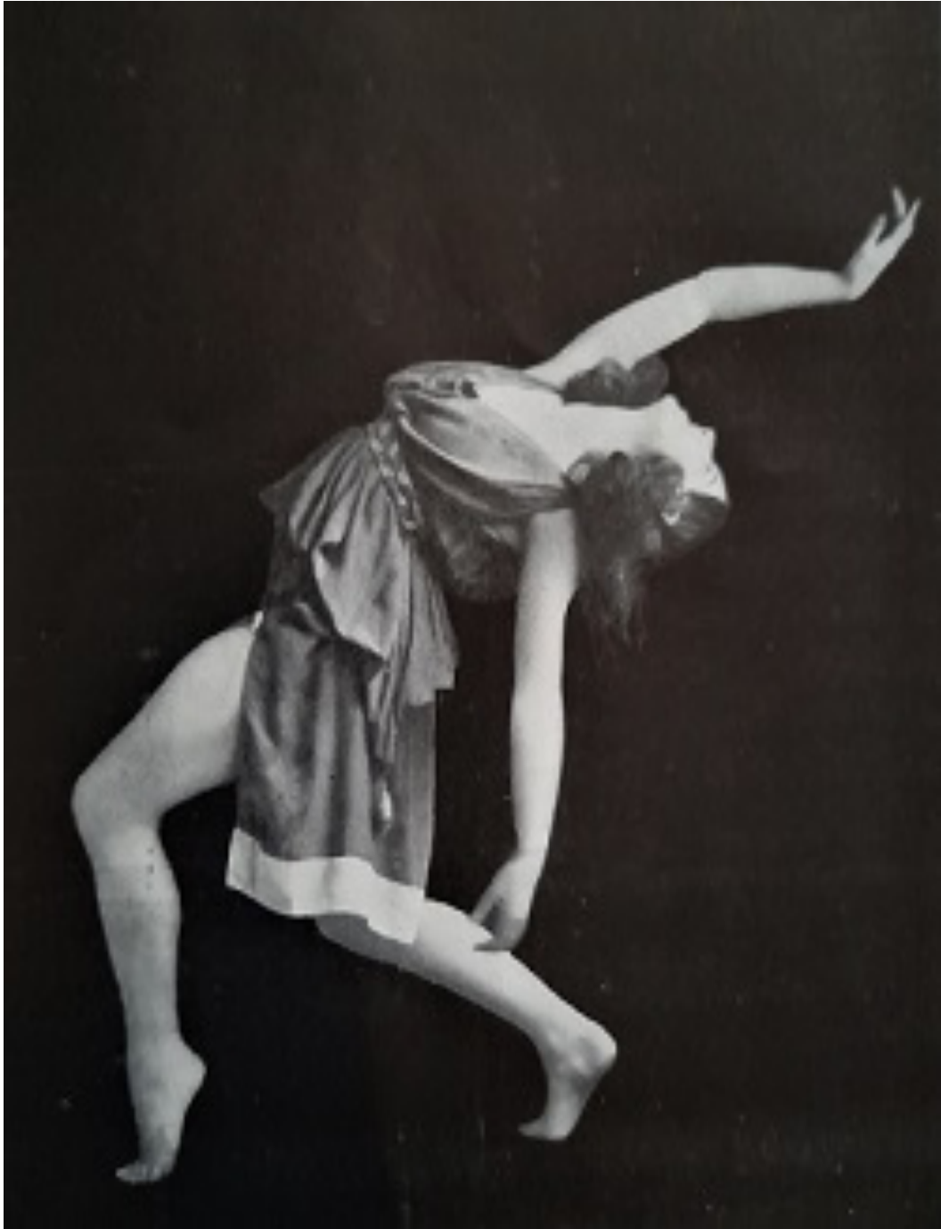
Annexe V. Ninette de Valois interprétant le rôle de la nymphe dans le ballet Narcisse, 1923