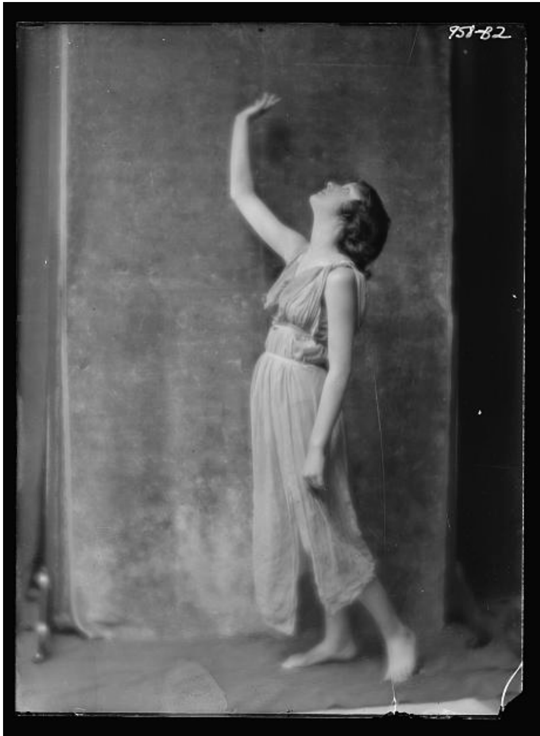
Annexe VII. Isadora Duncan, entre 1915 et 1923