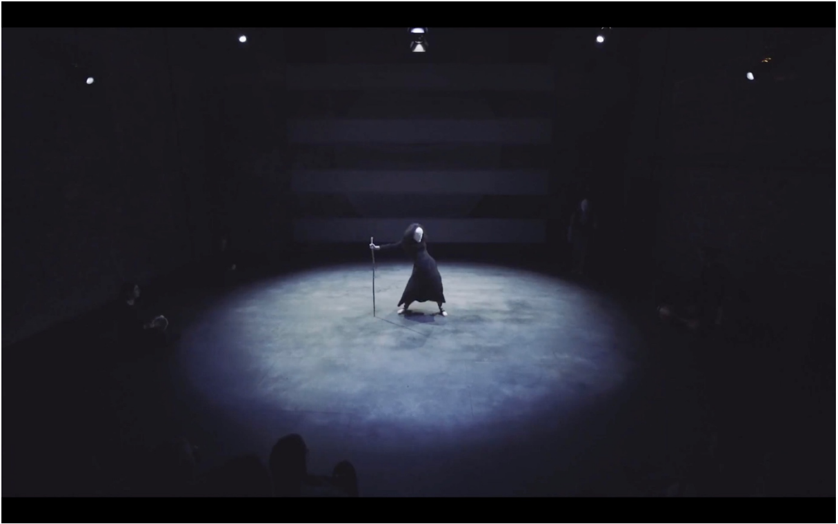
Illustration 4 The Cat and the Moon. La Boiteuse exécutant des mouvements sensuels et agressifs du bassin. Blue Raincoat Company.