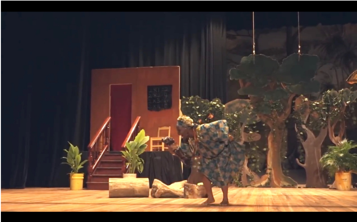
Illustration 9 The Lion and the Jewel. Sadiku avec la statuette du bale à la main. National Drama Company of Guyana.

Dans la mise en scène de la pièce par la NDC (National Drama Company of Guyana) en 2017, Sadiku, au lieu de poser la statuette de Baroka devant l'arbre dès le départ, prononce une partie de son discours en instaurant un jeu corporel avec cette dernière, jeu qui incarne la prise de pouvoir féminine dont elle parle. Elle commence en s'adressant directement à l'image sculptée de Baroka qu'elle tient à la main, tantôt moqueuse, tantôt agressive :