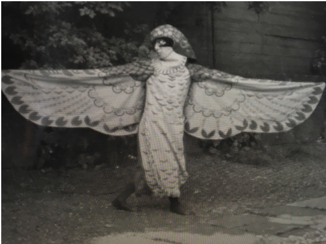
Annexe IV (A). Michio Ito dans le costume de la Gardienne du Puits, At the Hawk's Well, 1916, photographie de Alvin Langdon Coburn.