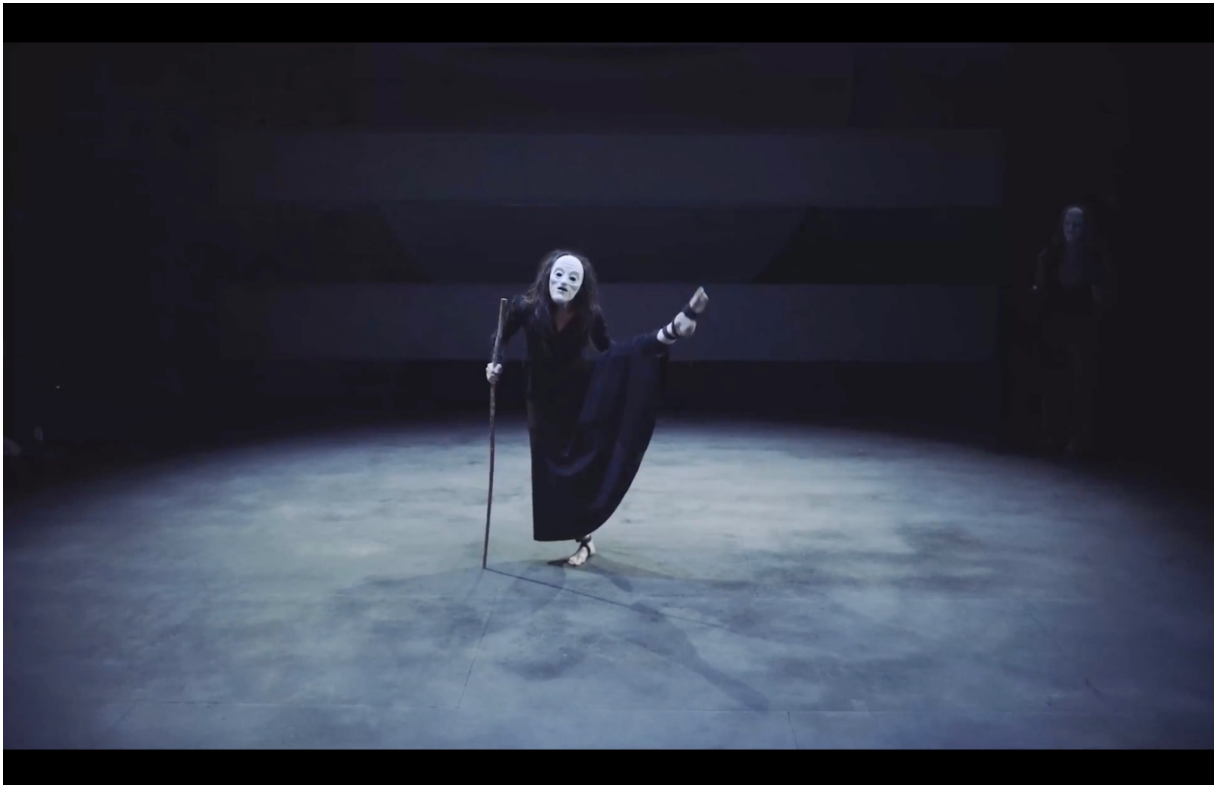
Illustration 3 The Cat and the Moon. La Boiteuse. Blue Raincoat Company.

habiles. Le corps de la Boiteuse se déploie et se décripe peu à peu, cette dernière effectuant des développés de la jambe avec légèreté. Ses pieds jusqu'à alors recroquevillés, sont à présent bien ancrés dans le sol, ce qui lui permet d'effectuer des tours, de marcher sur les demi-pointes avec un jeu de jambe rapide, de faire des développés de la jambe plus amples et affirmés comme le montre l'illustration suivante :