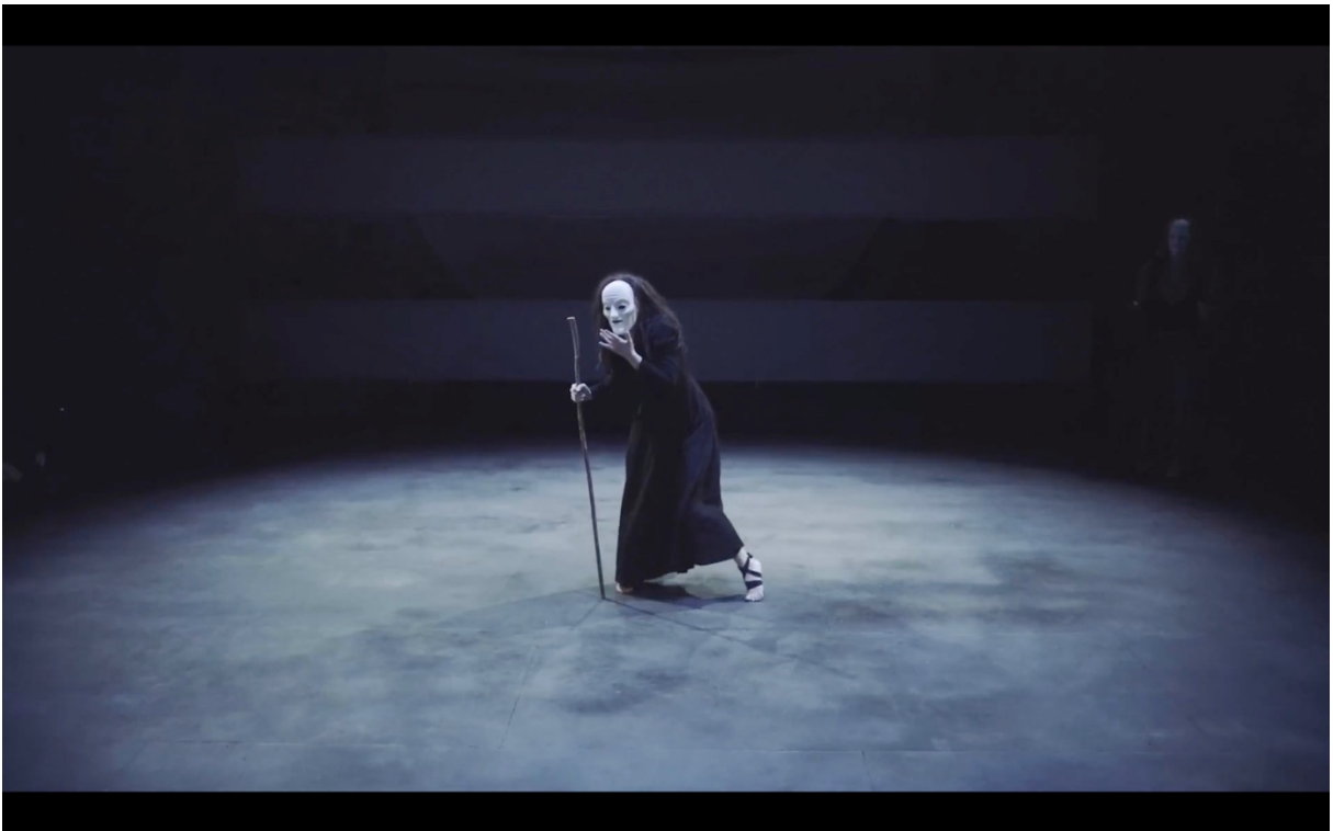
Illustration 5 The Cat and the Moon. La Boiteuse qui rit de plaisir. Blue Raincoat Company.