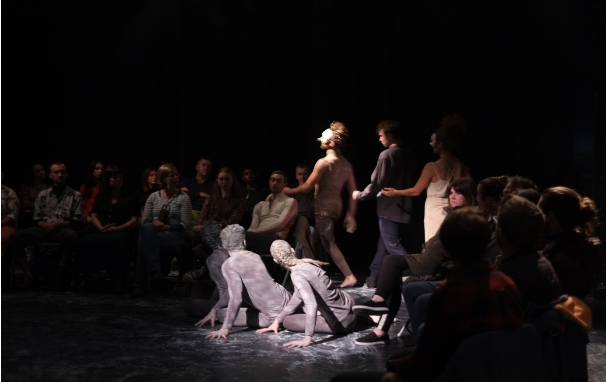
Illustration 1 The Dreaming of the Bones. Le Jeune Homme, situé entre le fantôme de Diarmuid et celui de Devorgilla, accomplit sa marche rituelle. DancePlayers Company. O'Donoghue Theatre, © Emilia Lloret.

Ici, le Jeune Homme entame le voyage qui doit le mener jusqu'au sommet d'une montagne où on viendra le chercher à l'aube. Il est situé entre les deux fantômes de Diarmuid et Devorgilla – dont il ne connaît pas l'identité véritable – et les trois personnages accomplissent lentement les mêmes gestes stylisés en formant un cercle mouvant qui entoure et réintroduit le public dans sa sphère singulière.