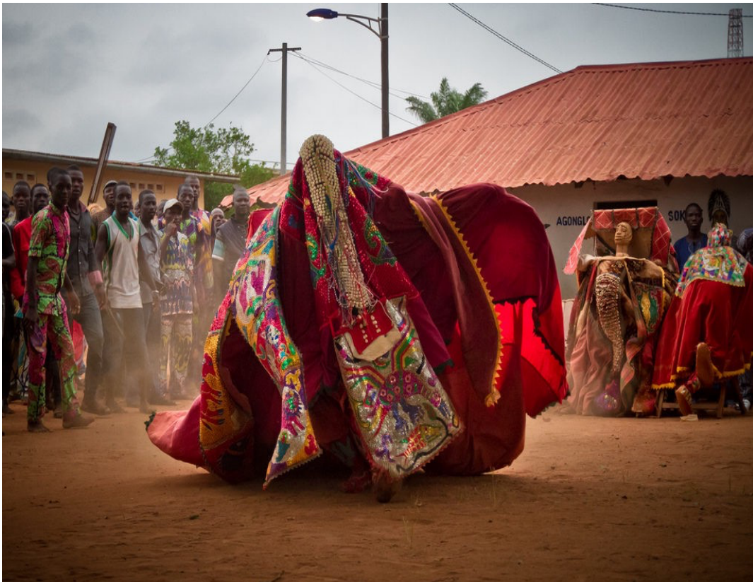
Annexe III. Masque egungun, Ibadan, 2017.

Lien vidéo : https://www.youtube.com/watch?v=sCjOzZdzi8