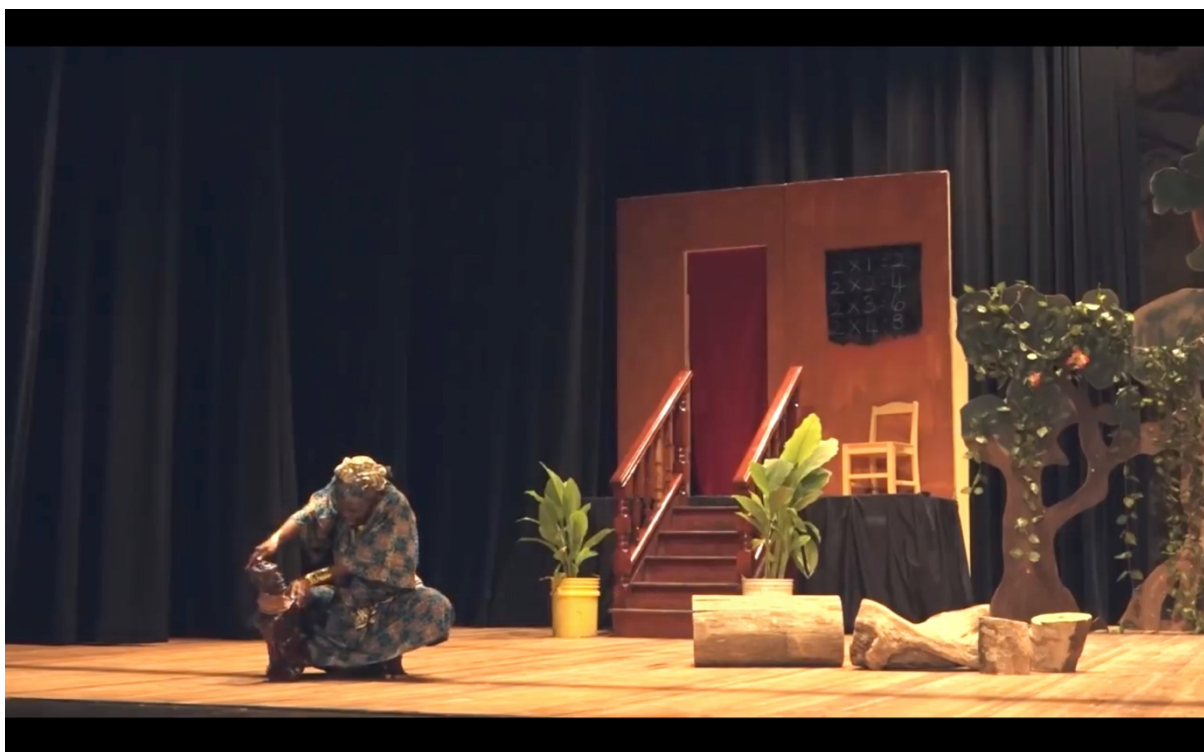
Illustration 10 The Lion and the Jewel. Sadiku qui maîtrise la statuette du bale et la fait littéralement tourner en rond et danser. National Drama Company of Guyana.

Si nous employons le terme de ficelles, c'est parce que le discours de Sadiku tisse un lien implicite entre la toupie tournoyante (« the foolish top [that spins] ») et l'image de la quenouille : « it is you who run giddy while we stand still and watch, and draw your frail thread from you ». Sadiku renverse ici le stéréotype genré sur les femmes qui filent la quenouille : loin d'être reléguées à un statut inférieur, ces dernières créent la matière et ont la main sur les hommes (au sens littéral si l'on observe bien l'image ci-dessus) qu'elles manipulent comme bon leur semble.