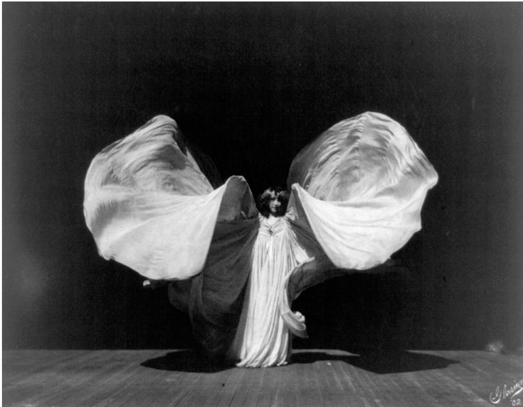
Annexe VI. Loie Fuller, 1902