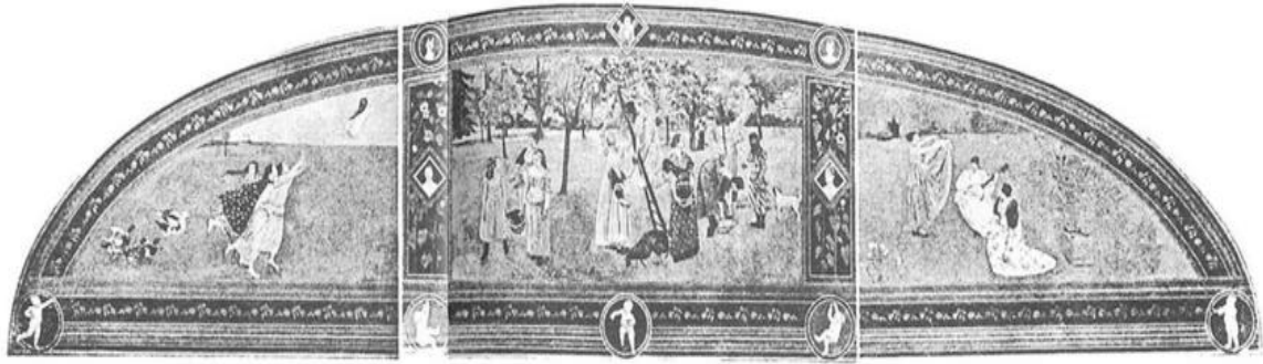
Fig. 1. Mary Cassatt, Modern Woman (1892-93), oil on canvas, 15' x 64 1/2'. (From Maud Howe Elliott, Art and Handicraft in the Woman's Building of the World's Columbian Exposition, Chicago, 1893 ).

Au centre de la fresque, on distingue trois jeunes femmes qui cueillent les fruits de l'arbre de la science. Sur le côté gauche, d'autres trois jeunes filles poursuivent la gloire symbolisée par une femme nue. Quant au côté droit de la fresque, on peut voir deux figures allégoriques de la musique et de la danse, accompagnées par une autre femme qui représente « la femme amatrice d'art ».