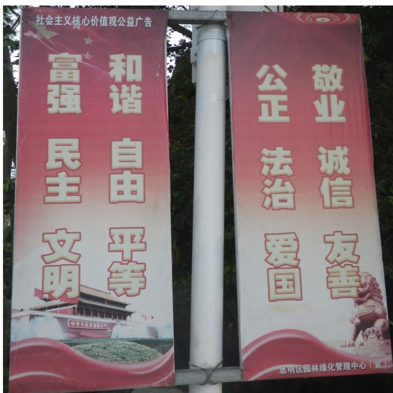
Dernier exemple de propagande politique, photographie (Xiamen, juillet 2017)