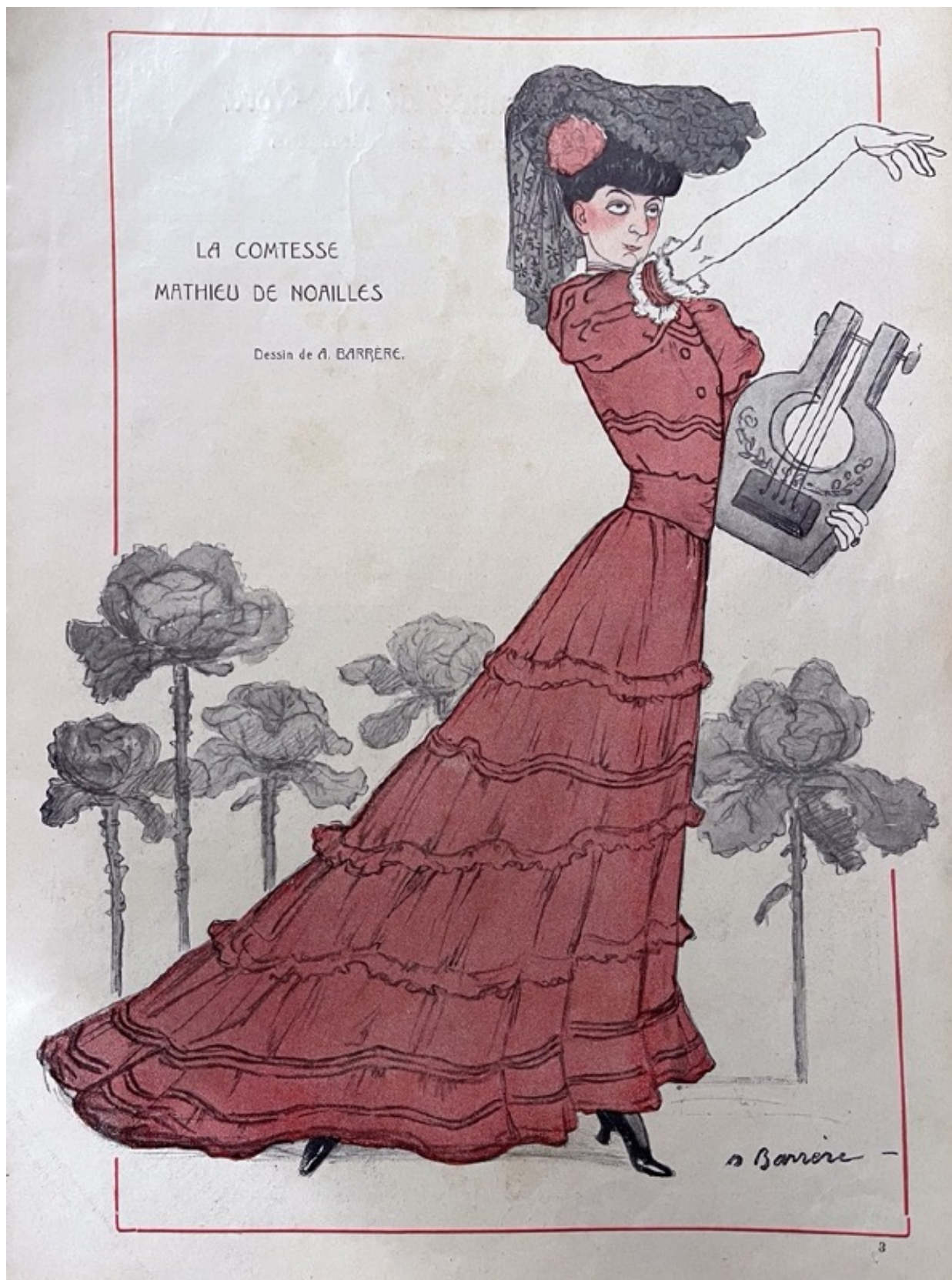
Caricature de la Comtesse Mathieu de Noailles par Adrien Barrère (1874-1931), lithographie, publiée dans le magazine Fantasio (série des têtes de turcs), 1906.