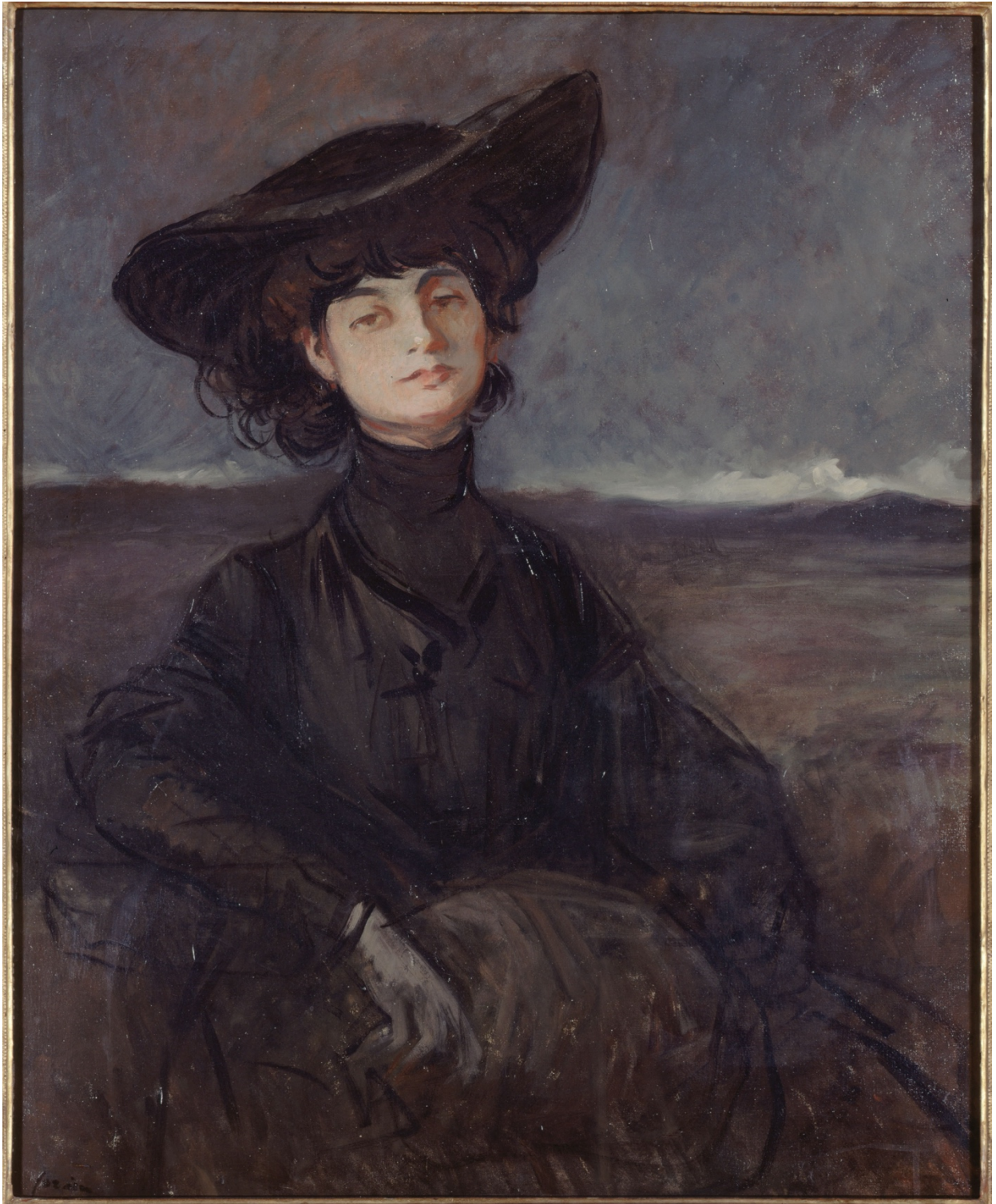
Jean-Louis Forain (1852-1931) Portrait de la comtesse Anna de Noailles , huile sur toile, 100 x 91 cm, 1905. Musée Carnavalet, Paris.