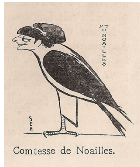
Caricature Comtesse de Noailles par Georges Goursat, dit SEM (1863-1934), lithographie, circa 1911.