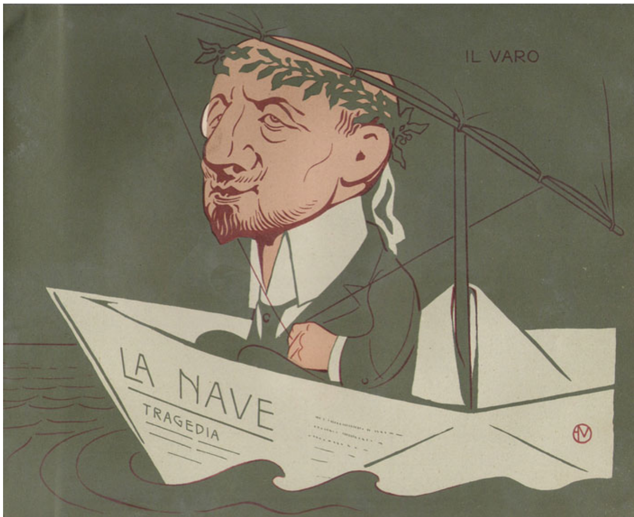
Caricature de Gabriele d'Annunzio , parue lors de la parution de La Nave , tragédie, 1908.