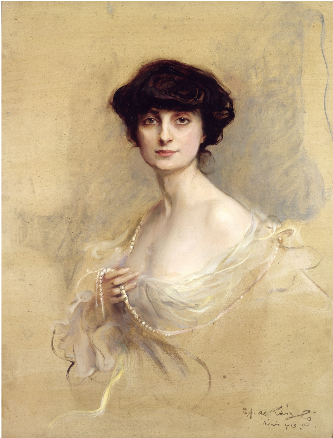
La Comtesse Anna de Noailles par Philip Alexius de Laszlo (1869-1937), huile sur toile, 1913, 93,5 x 73 cm, musée d'Orsay.