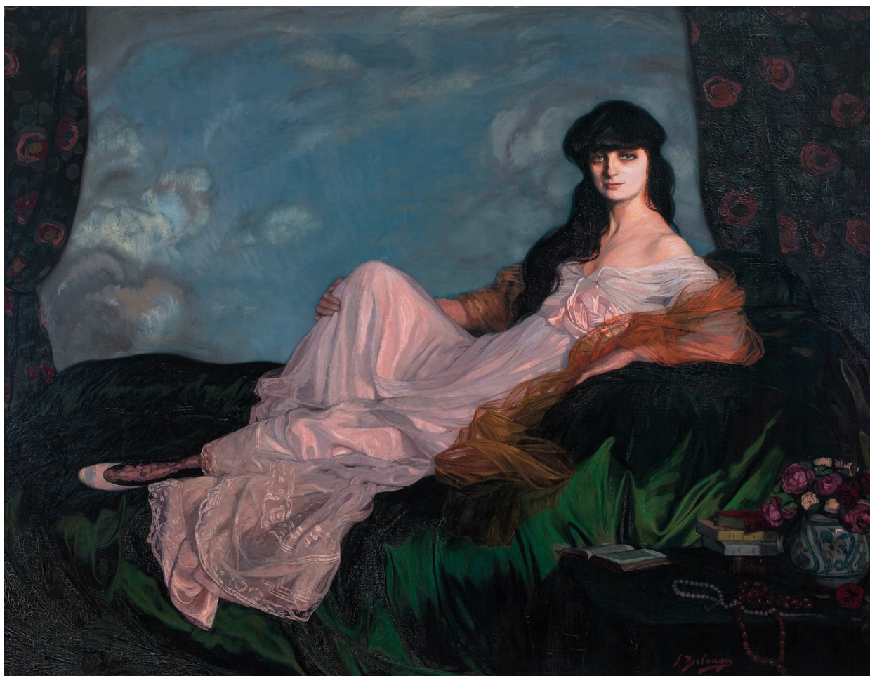
Ignacio Zuloaga (1870-1945), portrait de la Comtesse Anna de Noailles , huile sur toile, 1913, 152 x 195,5 cm, Musée des Beaux-arts de Bilbao.