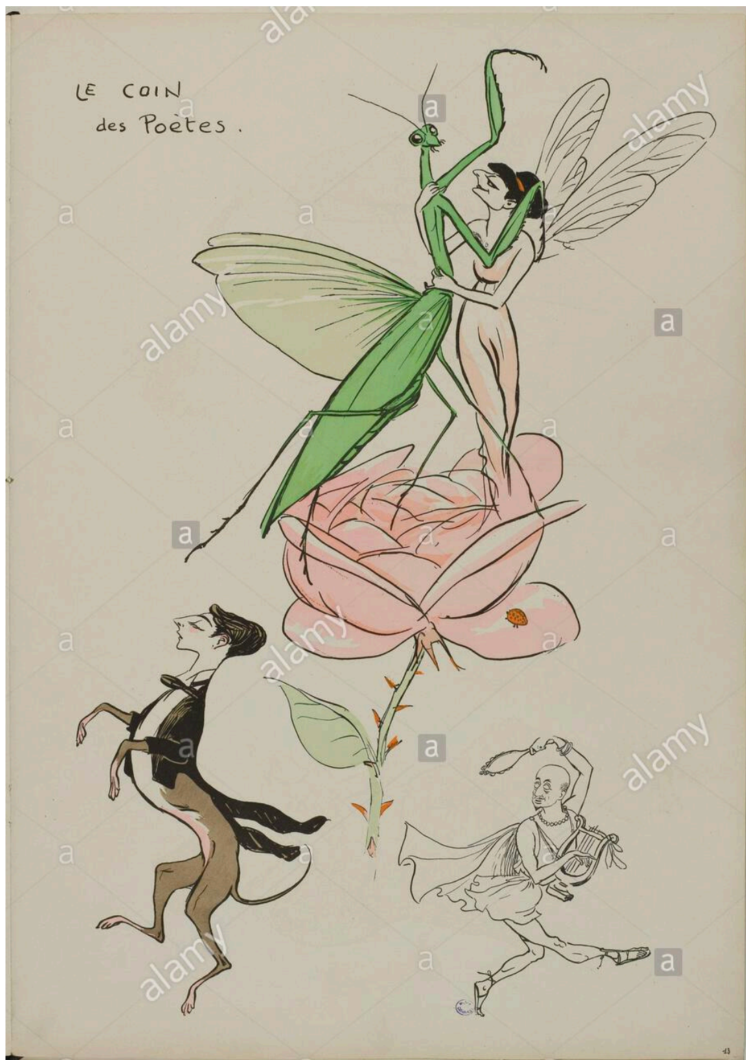
Caricature : Le coin des poètes (la comtesse Anna de Noailles, Jean Cocteau fait des grâces de levrettes et Gabriel d'Annunzio en éphémère grec), album Tangoville-sur-mer, par Georges Goursat, dit SEM (1863-1934), lithographie, circa 1910.