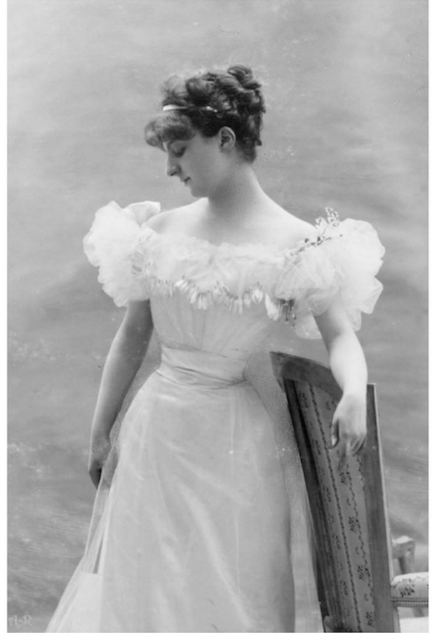
Anna de Noailles à l'époque du Cœur innombrable , photographie, circa 1900.