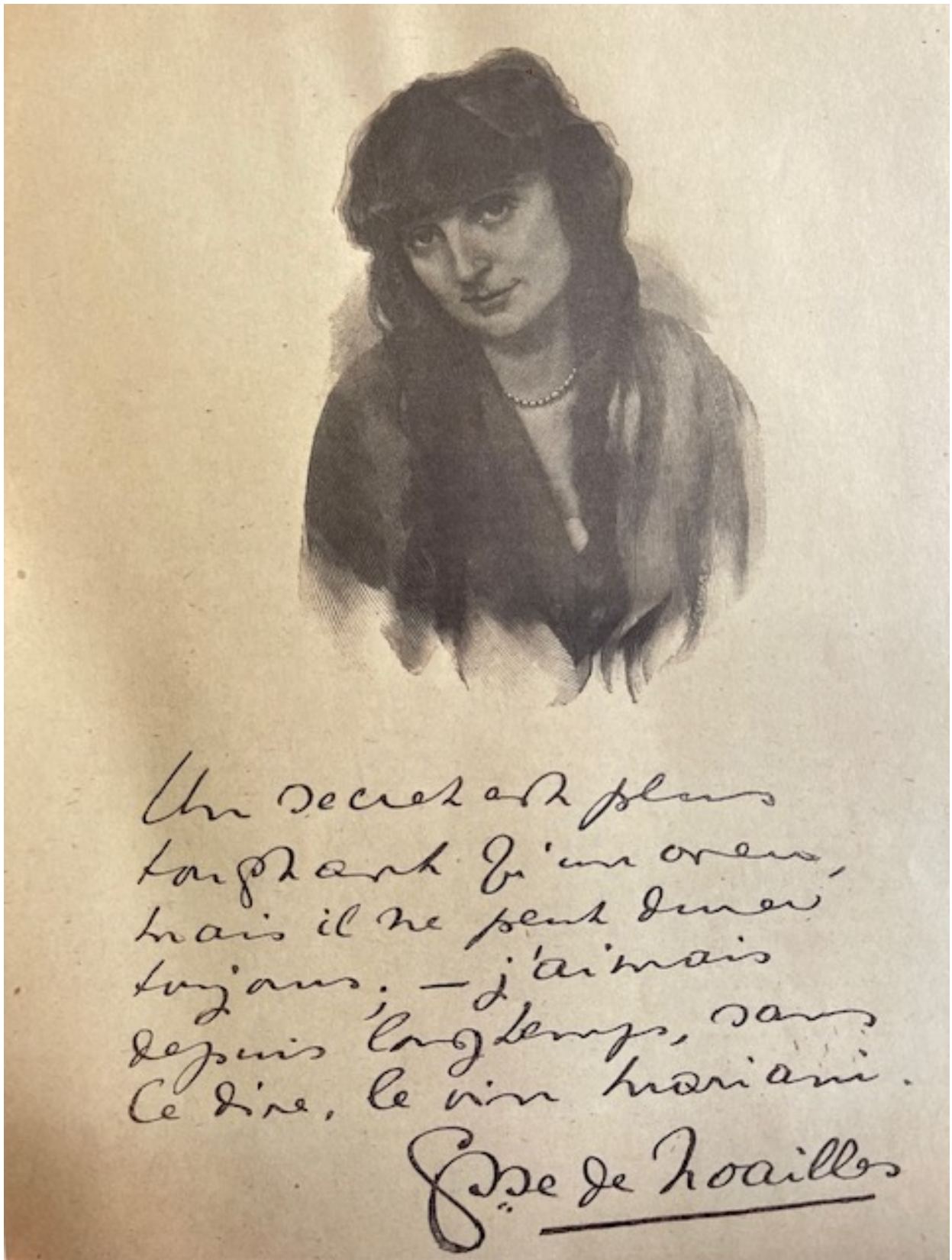
Album Mariani, Figures contemporaines , soixante-seize portraits, autographes, notices et biographies rédigées par Joseph Uzanne, gravures sur bois par Henri Brauer, Charles Clément, etc. , quatorzième volume, librairie Henri Floury, Paris, 1925.