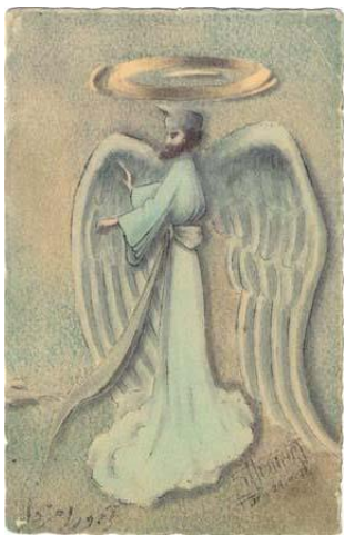
Image d'Ahura-Mazda 168

Or, chez Sadegh Hedayat l'image et le rêve s'associent et se reflètent non seulement dans la vie quotidienne mais aussi dans l'avenir. Il est à noter qu'il avait aussi un goût pour la peinture qui était en effet sa première passion, mais empêché par l'autorité paternelle il n'a jamais pu maîtriser cet art afin d'en faire son métier, comme Sadegh Hedayat écrit dans son Enterré vivant : « Je regrette de ne pas être artiste peintre ; le seul métier que j'aimais et qui me plaisait. Je croyais ne pouvoir trouver une certaine consolation que dans la peinture 166 . » (p. 40) C'est pourquoi dans la plupart de ses œuvres la peinture joue un rôle central qui évolue avec l'histoire racontée. C'est lui qui, après avoir traduit Kârnâmeye Ardechir-e Pâpakân ou Les gestes d'Ardéchir, fils de Pâpak du pehlevi en persan, a dessiné l'image d'Ahura Mazda sur la couverture du livre. Il a également dessiné l'image d'une chouette sur la première et la dernière page de La Chouette aveugle 167 . Ce récit est en fait un exemple significatif de l'association de la peinture et de l'écriture au sein duquel l'immense solitude du narrateur l'entraîne vers la folie.