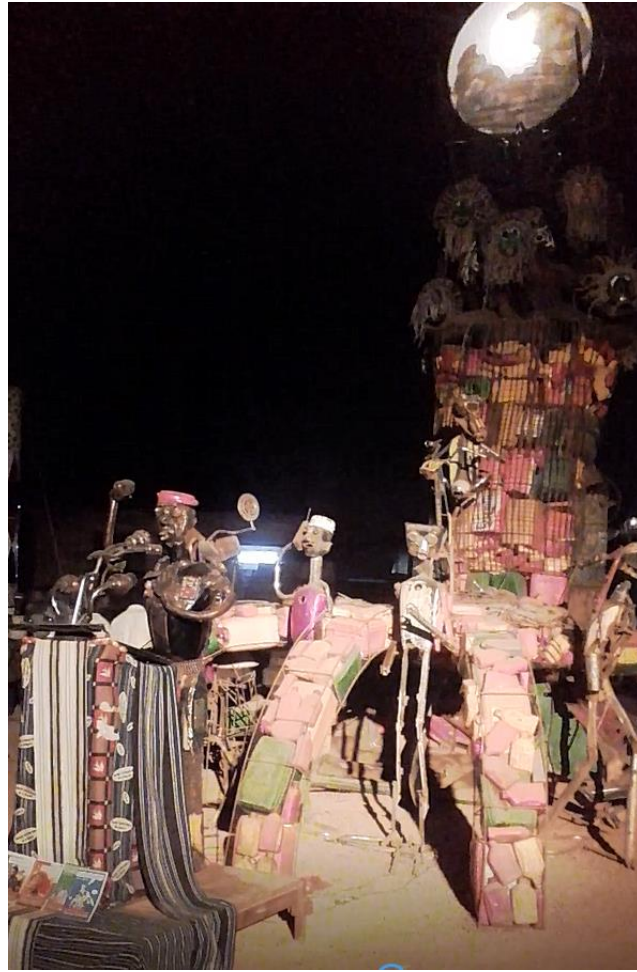
Thomas Sankara sur le « rond-point de Sahab », quartier Bougsemtenga à Gounghin, novembre 2016.

L'installation de Sahab Koanda s'articule également à un imaginaire de la lutte nationale et panafricaine fondé sur l'art de la réduplication, réactivé dans le contexte de la chute de Blaise Compaoré : « [...] et 27 ans après sa mort tous les Africains savent que Sankara a dit : « vous me tuerez tout seul mais bientôt il y aura 1000 Sankara ». C'est lors des événements de 2014, que l'on a su vraiment, qu'il y avait 1000 Sankara au du Burkina Faso 1265 ». En l'occurrence, l'unisson autour de la parole politique de Thomas Sankara s'élabore à partir des performances de slam – comme à travers la chanson du collectif Qu'on sonne et voix-ailes auquel appartient Tony Ouedraogo 1266 – mais aussi des performances de conte 1267 . L'idée des voix singulières qui s'unissent pour faire corps politique travaille l'imaginaire urbain et génère des effets de résonance