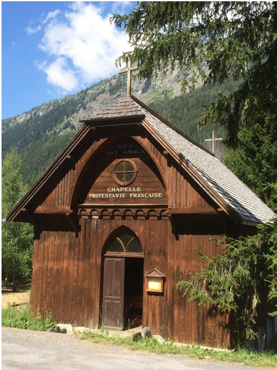
Figure 3 Chapelle d'Argentière en bois de mélèze

À l'initiative de Raoul Allier, ils acquièrent des terrains au pied de la moraine.