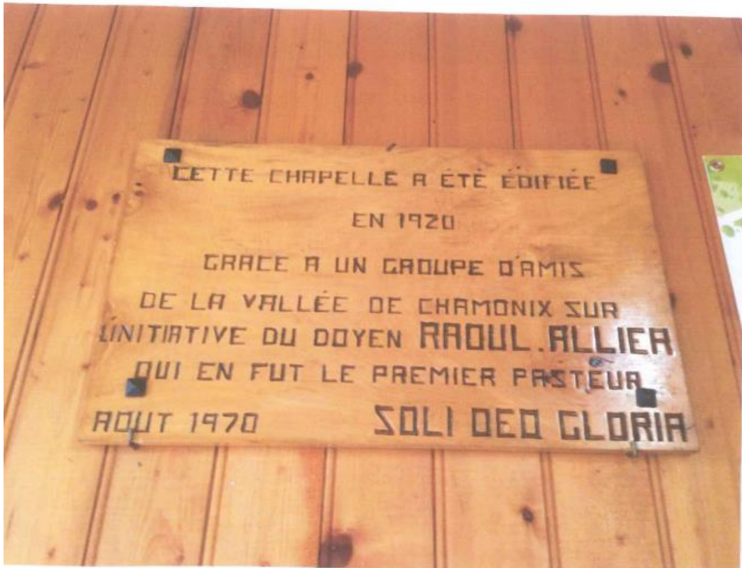
Figure 5 Inscription en hommage à R. Allier

Or, s'il n'a jamais été pasteur, dans la mémoire collective des fidèles d'Argentière, il en a eu les caractéristiques. On peut dire que c'est dans ce village d'Argentière que Raoul Allier trouve le plein épanouissement de ce qui fut pour lui comme un vrai ministère pastoral.