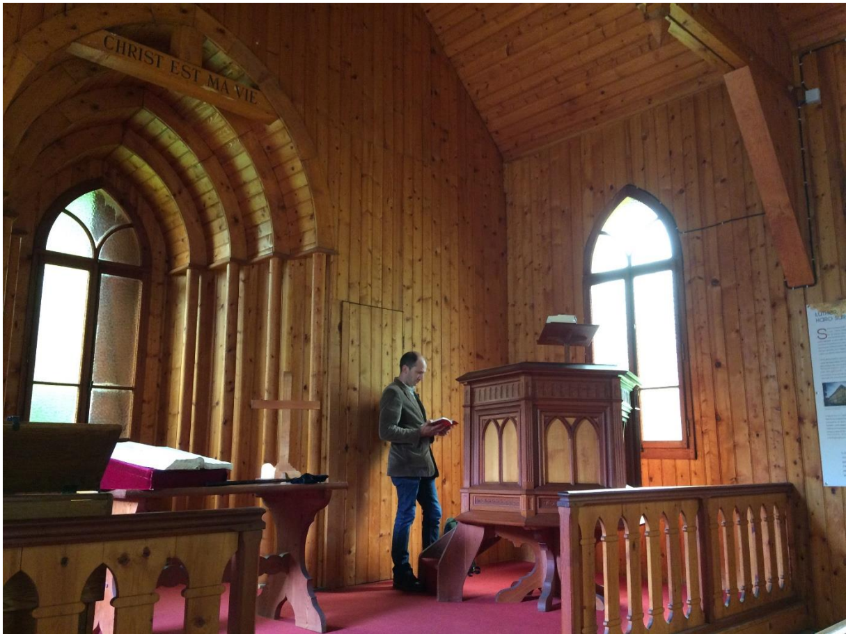
Figure 4 Intérieur de la chapelle

L'édifice est inauguré en 1920, Raoul Allier en est le premier responsable, il est considéré par tous comme son premier pasteur conformément à l'inscription qui y figure. 2003