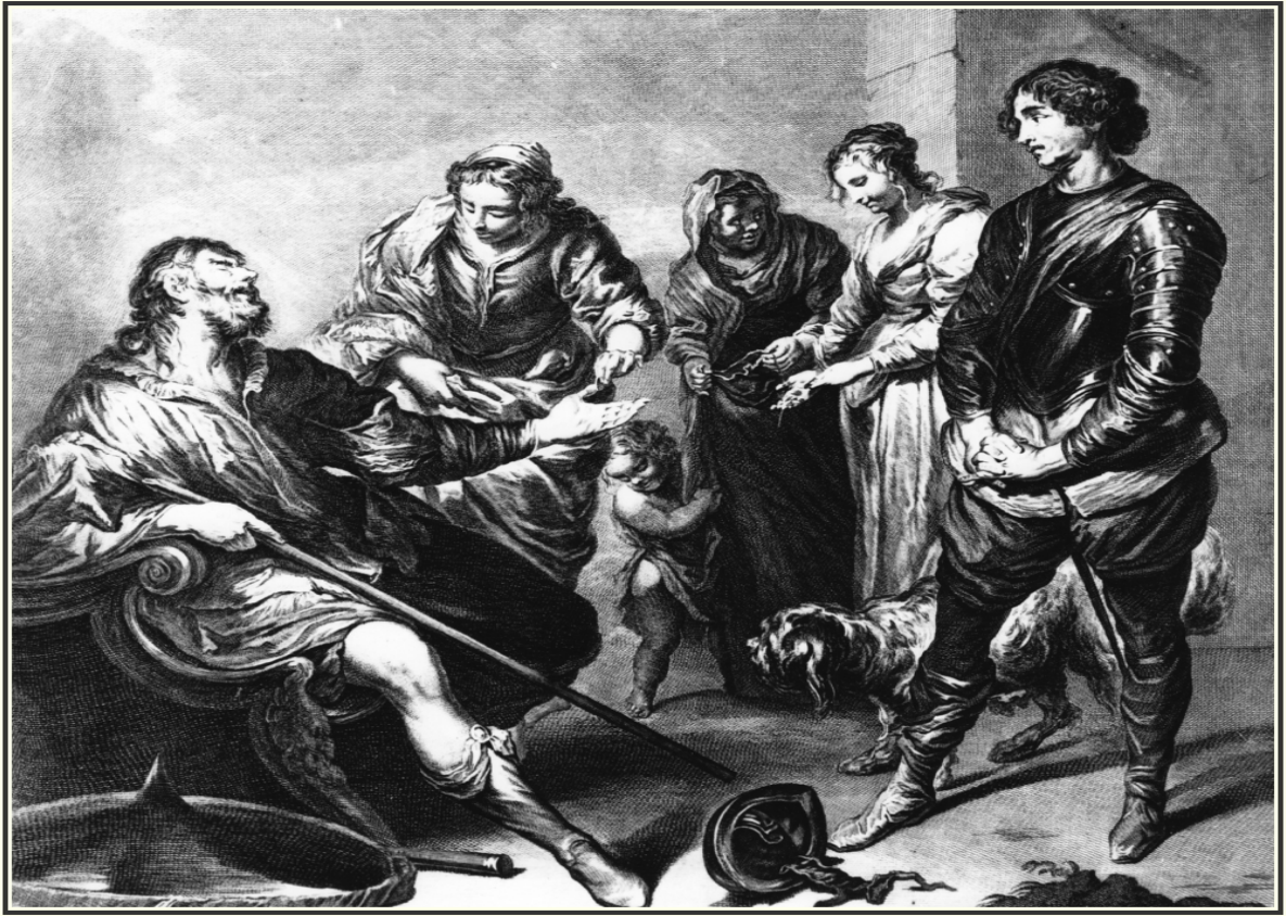
Le Bélisaire de Borzone, longtemps attribué à Van Dyck