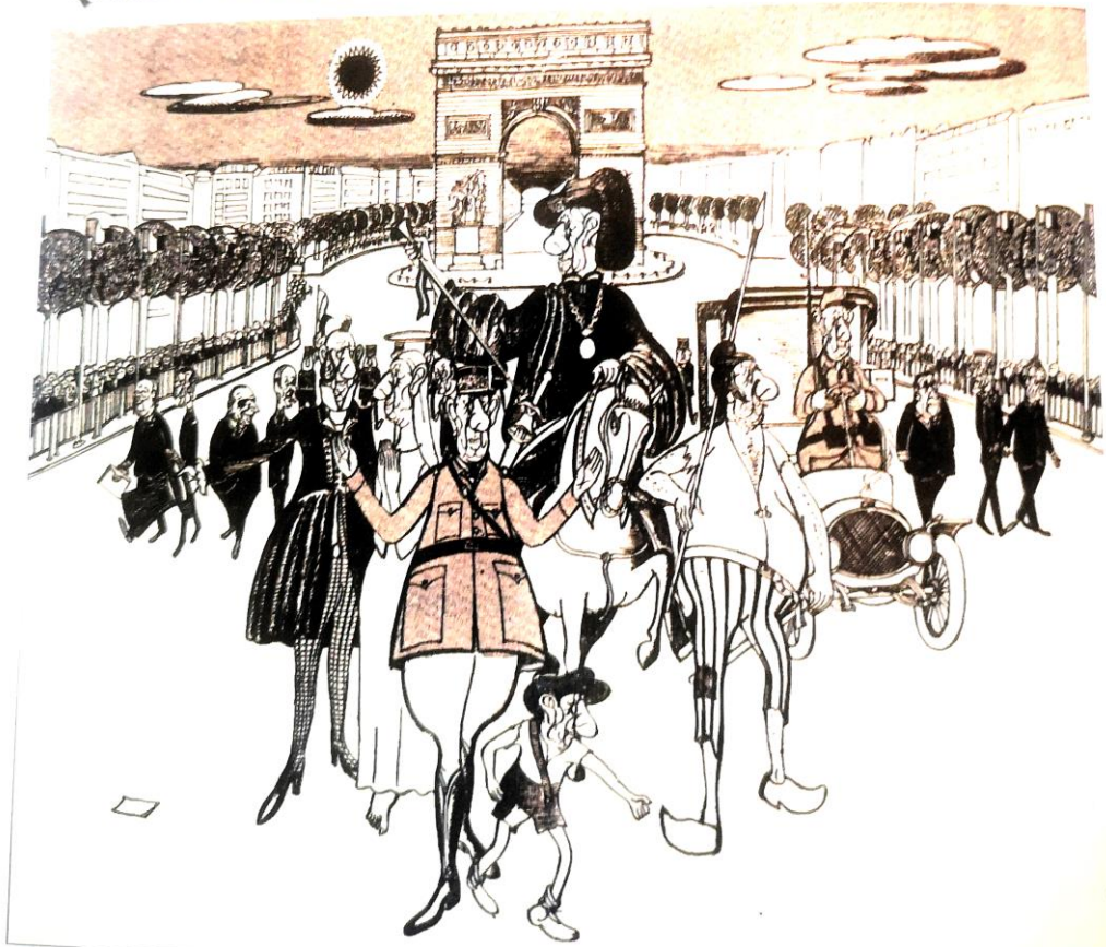
Roland Moisan, « 15 siècles de Libération, un seul libérateur » dans Le Canard enchaîné, 3 juillet 1964 © Adagp, Paris 2012/ BnF/ Le Canard enchaîné