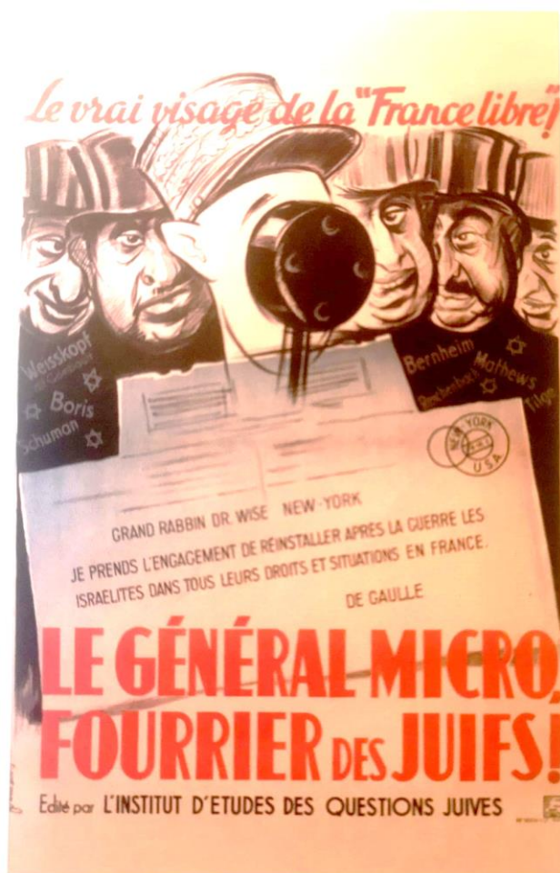
Ligue française anti-britannique, 1940