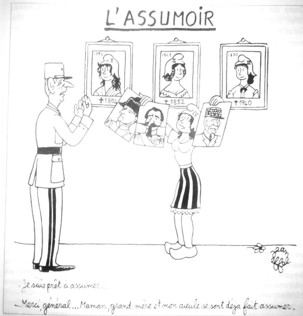
Jean Effel, « L'assumoir » dans L'Express, 22 mai 1958