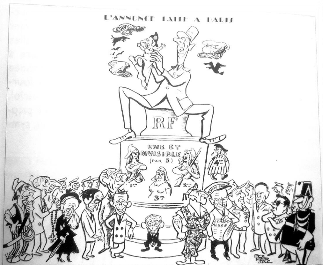
Pol Ferjac, « L'annonce faite à Paris » dans Le Canard enchaîné, 3 septembre 1958