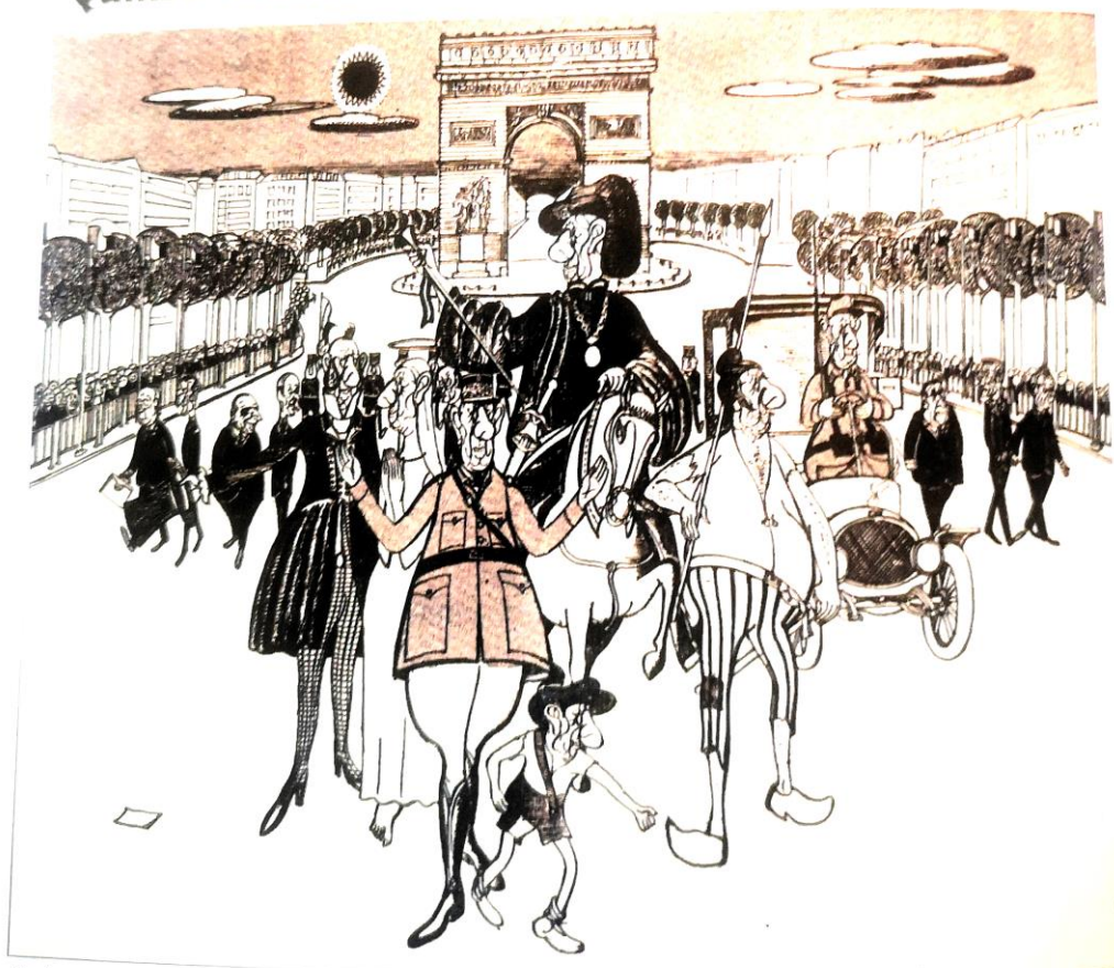
Roland Moisan, « 15 siècles de Libération, un seul libérateur » dans Le Canard enchaîné, 3 juillet 1964 © Adagp, Paris 2012/ BnF/ Le Canard enchaîné