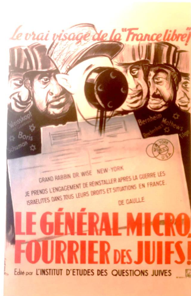
Ligue française anti-britannique, 1940