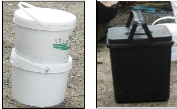
Photo 2 : Bio-seau de récupération (à gauche) et bio-seau vendu dans le commerce (à droite)

Marcelline, ceux du Moulins font moins appel aux ressources de leur quartier et utilisent leur réseau de proches au sein de la copropriété.