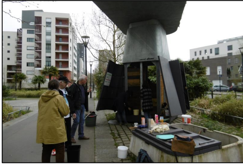
Photo 11 : Permanence à Orféo dans le cadre de la semaine nationale du compostage