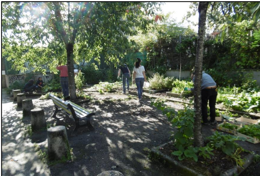
Photo 8 : Jardin potager et ornemental du composteur partagé de Marcelline