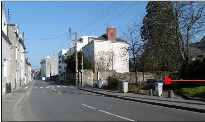
Photo 7 : Rue passante qui longe le « coin compost » de Marcelline, et habitat voisin