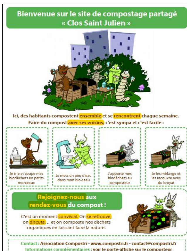
Illustration 1 : Affiche disposée sur chaque composteur partagé