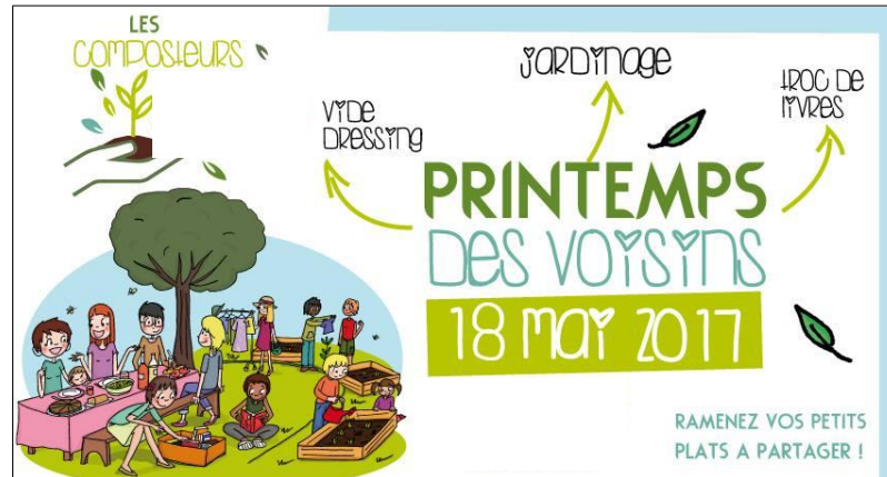
Illustration 2 : Illustration 85 d'une invitation pour une Fête des voisins à Marcelline