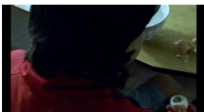
Figure 16. Rosetta