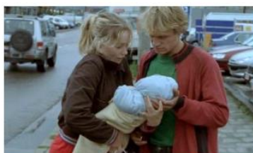
Figure 59. L'Enfant