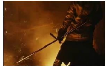
Figure 129. Je pense à vous