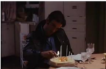
Figure 130. Je pense à vous