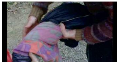
Figure 89. Rosetta