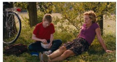
Figure 54. Le Gamin au vélo