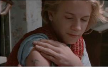
Figure 100. La Promesse