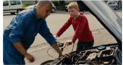
Figure 48. Le Gamin au vélo