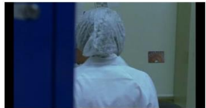
Figure 69. Rosetta