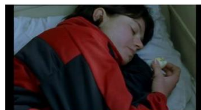
Figure 17. Rosetta