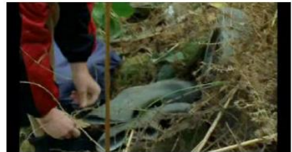
Figure 66. Rosetta