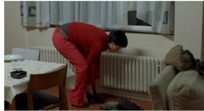
Figure 38. Le Silence de Lorna