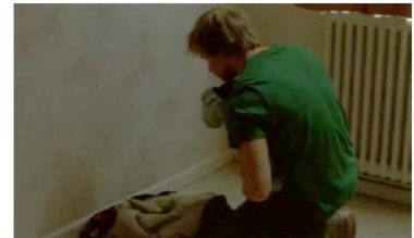
Figure 93. L'Enfant