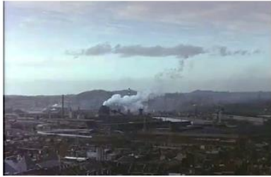
Figure 1. Je pense à vous