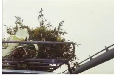
Figure 2. Je pense à vous