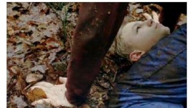
Figure 123. Le Fils