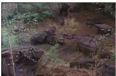
Figure 7. Je pense à vous