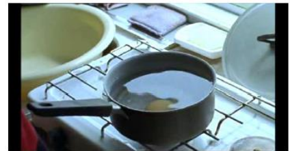
Figure 15. Rosetta