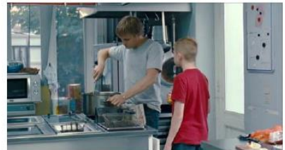
Figure 51. Le Gamin au vélo