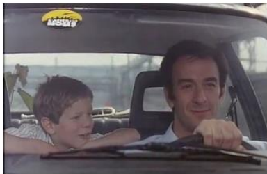
Figure 4. Je pense à vous