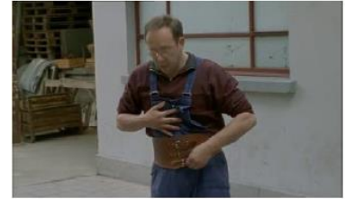
Figure 120. Le Fils