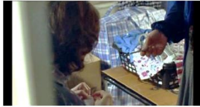
Figure 29. Rosetta