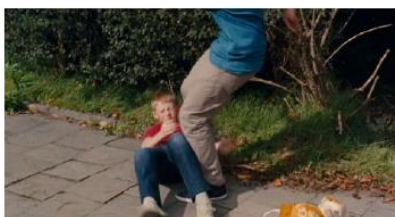
Figure 55. Le Gamin au vélo