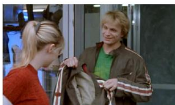
Figure 58. L'Enfant