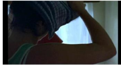
Figure 74. Rosetta