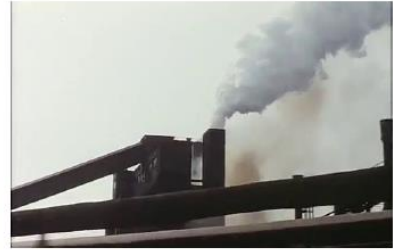
Figure 3. Je pense à vous