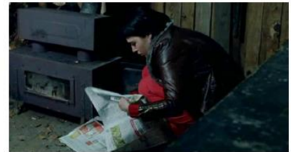
Figure 42. Le Silence de Lorna