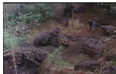
Figure 9. Je pense à vous