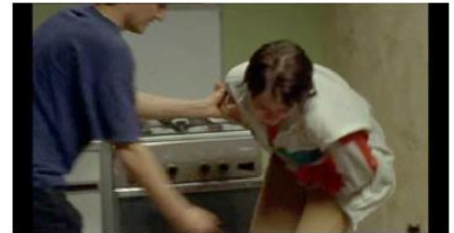
Figure 21. Rosetta