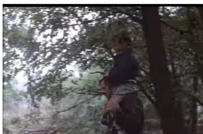
Figure 8. Je pense à vous