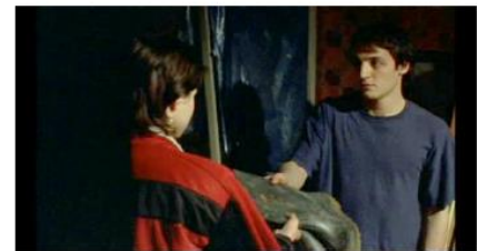
Figure 78. Rosetta