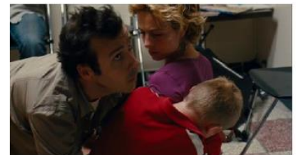
Figure 45. Le Gamin au vélo