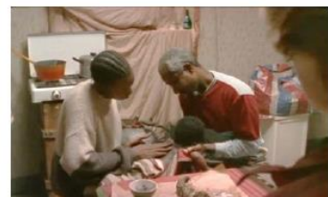
Figure 125. La Promesse