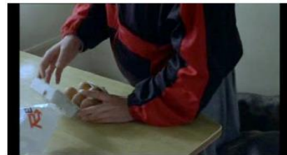
Figure 14. Rosetta