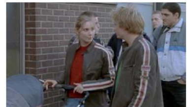
Figure 96. L'Enfant