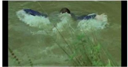
Figure 84. Rosetta