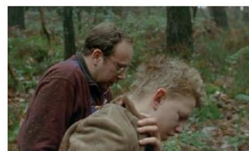
Figure 60. Le Fils