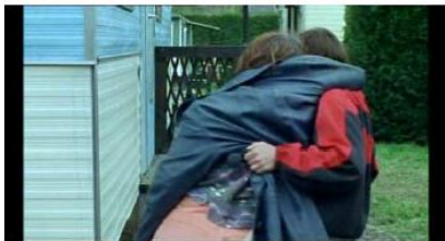
Figure 13. Rosetta