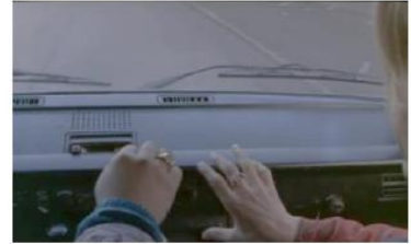
Figure 102. La Promesse