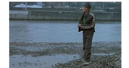
Figure 90. L'Enfant