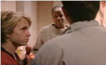
Figure 127. La Promesse