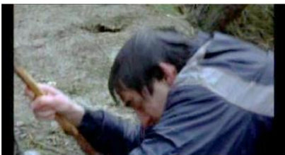
Figure 88. Rosetta