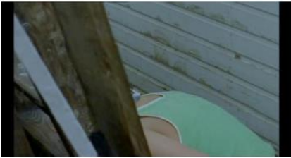
Figure 73. Rosetta