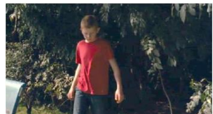
Figure 135. Le Gamin au vélo