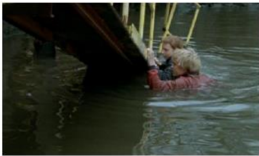
Figure 136. L'Enfant