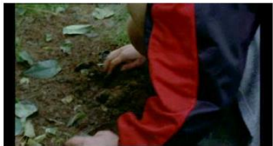
Figure 31. Rosetta