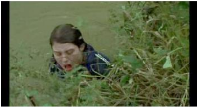
Figure 85. Rosetta