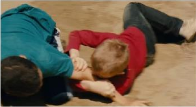
Figure 46. Le Gamin au vélo