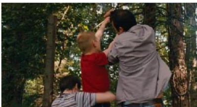
Figure 43. Le Gamin au vélo