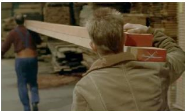
Figure 121. Le Fils