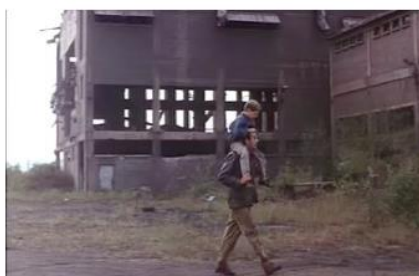
Figure 5. Je pense à vous