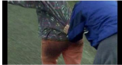
Figure 83. Rosetta