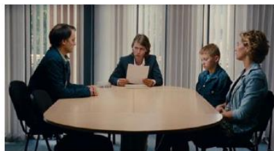
Figure 53. Le Gamin au vélo