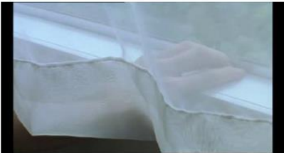
Figure 19. Rosetta