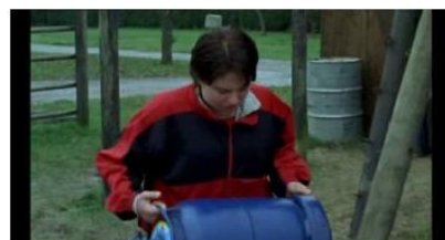
Figure 57. Rosetta