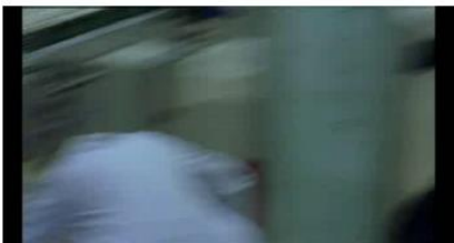
Figure 70. Rosetta