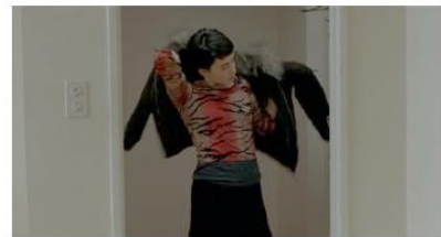
Figure 35. Le Silence de Lorna