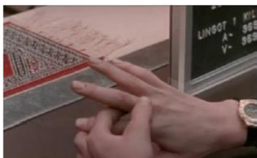
Figure 109. La Promesse