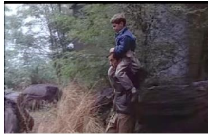
Figure 11. Je pense à vous