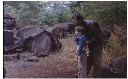
Figure 12. Je pense à vous