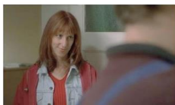
Figure 61. Le Fils