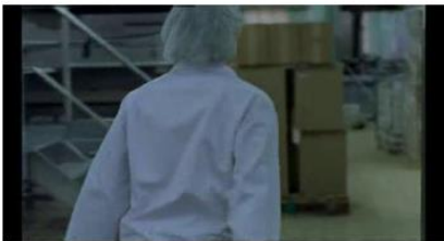
Figure 67. Rosetta