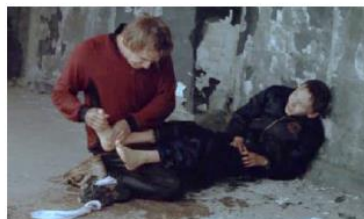
Figure 98. L'Enfant