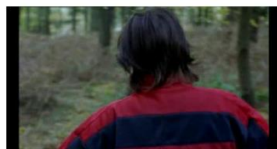
Figure 63. Rosetta