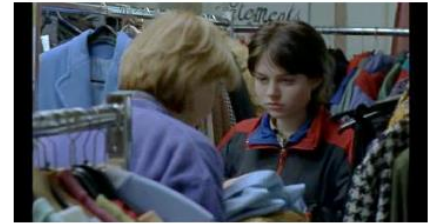
Figure 75. Rosetta