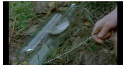
Figure 33. Rosetta