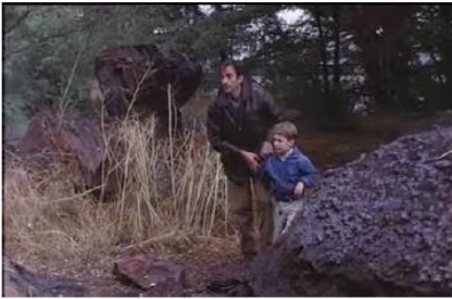
Figure 10. Je pense à vous