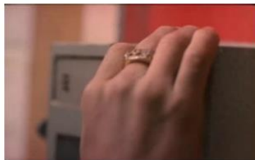
Figure 107. La Promesse