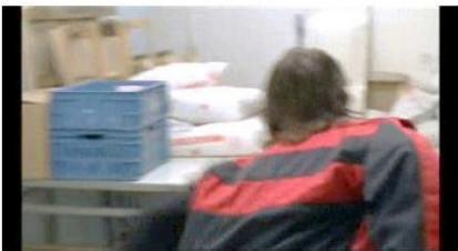
Figure 76. Rosetta