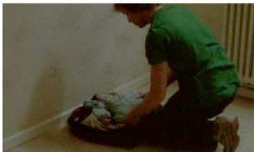
Figure 94. L'Enfant