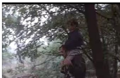
Figure 8. Je pense à vous