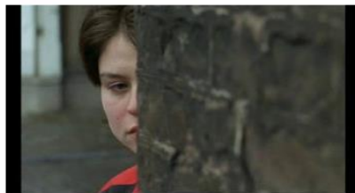
Figure 23. Rosetta