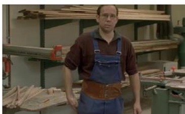
Figure 114. Le Fils