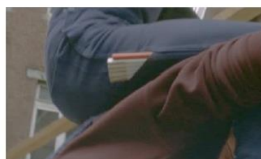
Figure 117. Le Fils