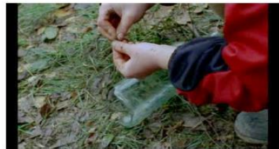
Figure 32. Rosetta