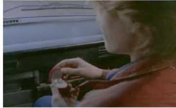
Figure 101. La Promesse