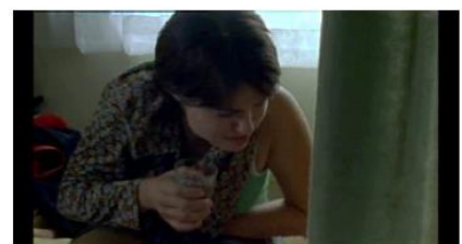
Figure 18. Rosetta