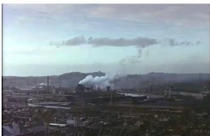
Figure 1. Je pense à vous