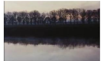
Figure 27. Je pense à vous