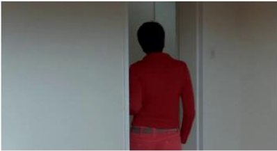
Figure 37. Le Silence de Lorna