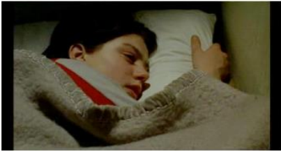
Figure 82. Rosetta