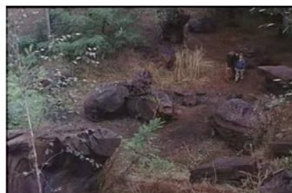
Figure 9. Je pense à vous