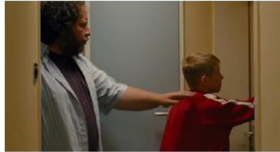
Figure 47. Le Gamin au vélo