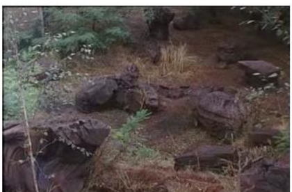
Figure 7. Je pense à vous