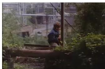
Figure 6. Je pense à vous