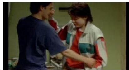
Figure 80. Rosetta