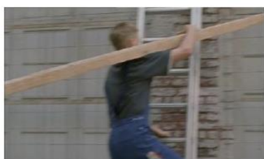
Figure 115. Le Fils