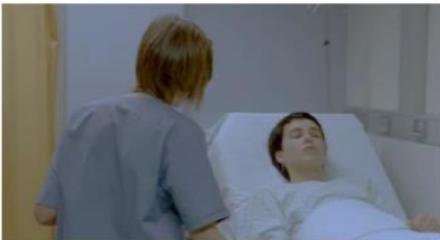
Figure 40. Le Silence de Lorna