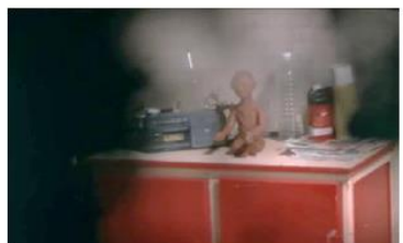
Figure 124. La Promesse