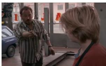
Figure 113. La Promesse