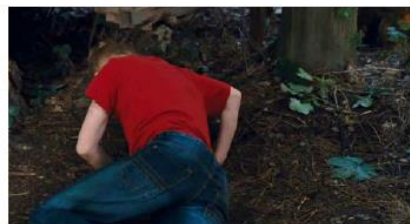
Figure 134. Le Gamin au vélo