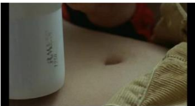
Figure 22. Rosetta