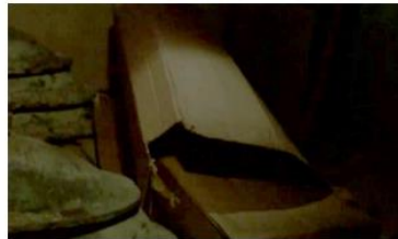
Figure 92. L'Enfant