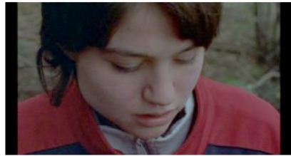
Figure 86. Rosetta