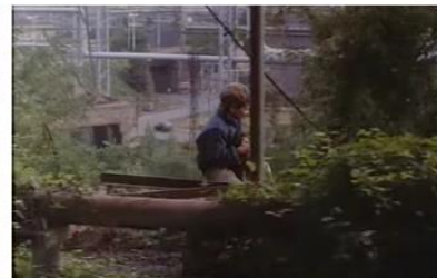
Figure 6. Je pense à vous