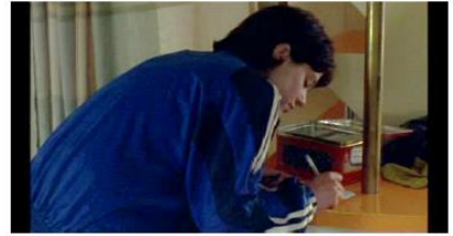
Figure 30. Rosetta