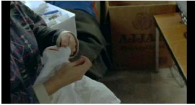
Figure 28. Rosetta