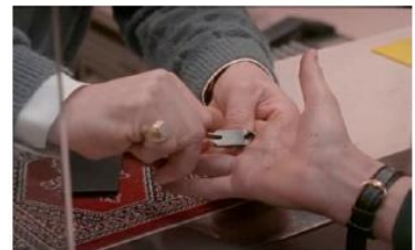
Figure 108. La Promesse