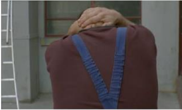
Figure 118. Le Fils