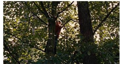
Figure 132. Le Gamin au vélo