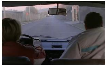
Figure 104. La Promesse