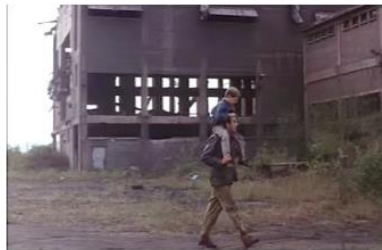
Figure 5. Je pense à vous