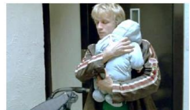
Figure 99. L'Enfant