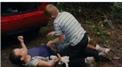
Figure 52. Le Gamin au vélo