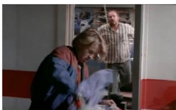
Figure 56. La Promesse