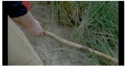
Figure 87. Rosetta