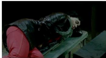
Figure 131. Le Silence de Lorna