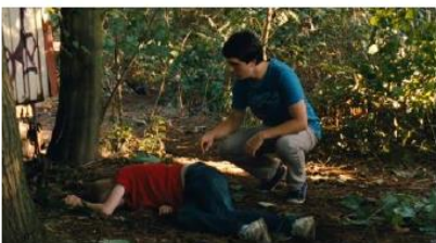
Figure 133. Le Gamin au vélo