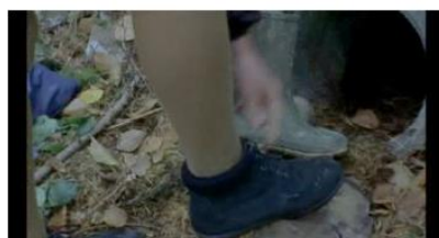
Figure 62. Rosetta