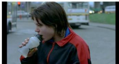
Figure 71. Rosetta