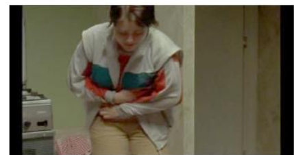
Figure 81. Rosetta