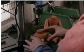
Figure 128. La Promesse