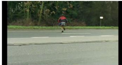
Figure 65. Rosetta