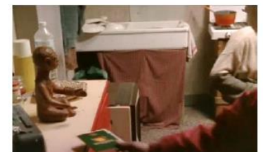
Figure 126. La Promesse