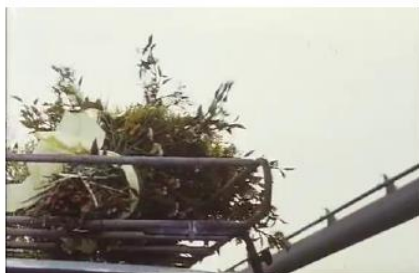
Figure 2. Je pense à vous