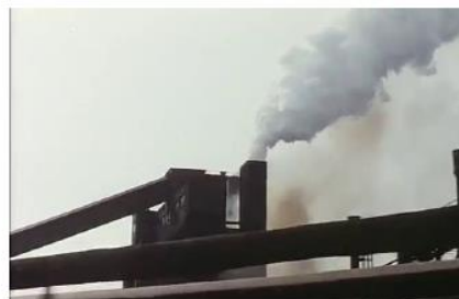
Figure 3. Je pense à vous