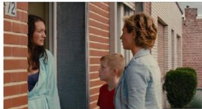
Figure 50. Le Gamin au vélo