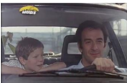
Figure 4. Je pense à vous