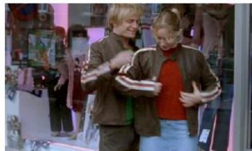
Figure 95. L'Enfant