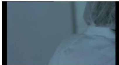
Figure 68. Rosetta