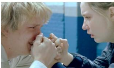
Figure 97. L'Enfant