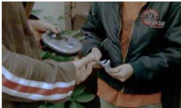
Figure 91. L'Enfant