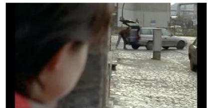
Figure 24. Rosetta