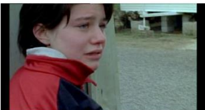
Figure 25. Rosetta