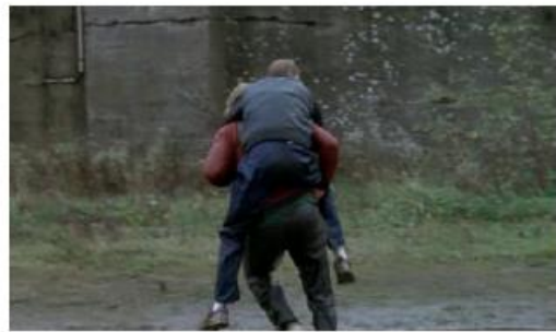
Figure 137. L'Enfant