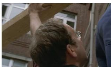
Figure 116. Le Fils