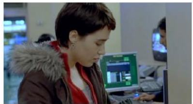
Figure 34. Le Silence de Lorna