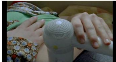
Figure 20. Rosetta