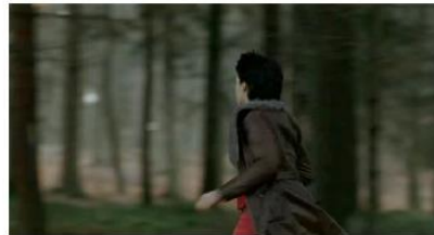
Figure 41. Le Silence de Lorna