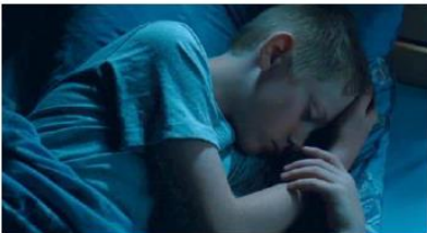
Figure 49. Le Gamin au vélo