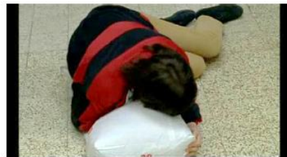
Figure 77. Rosetta