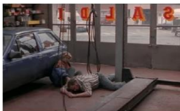
Figure 110. La Promesse