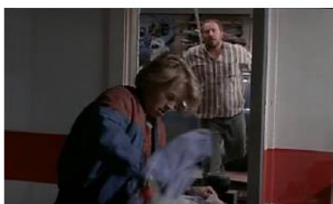
Figure 112. La Promesse