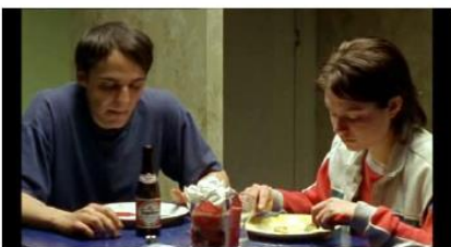
Figure 79. Rosetta