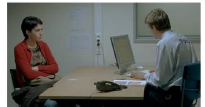
Figure 36. Le Silence de Lorna