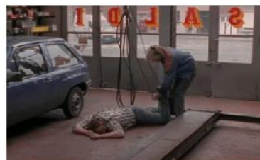
Figure 111. La Promesse